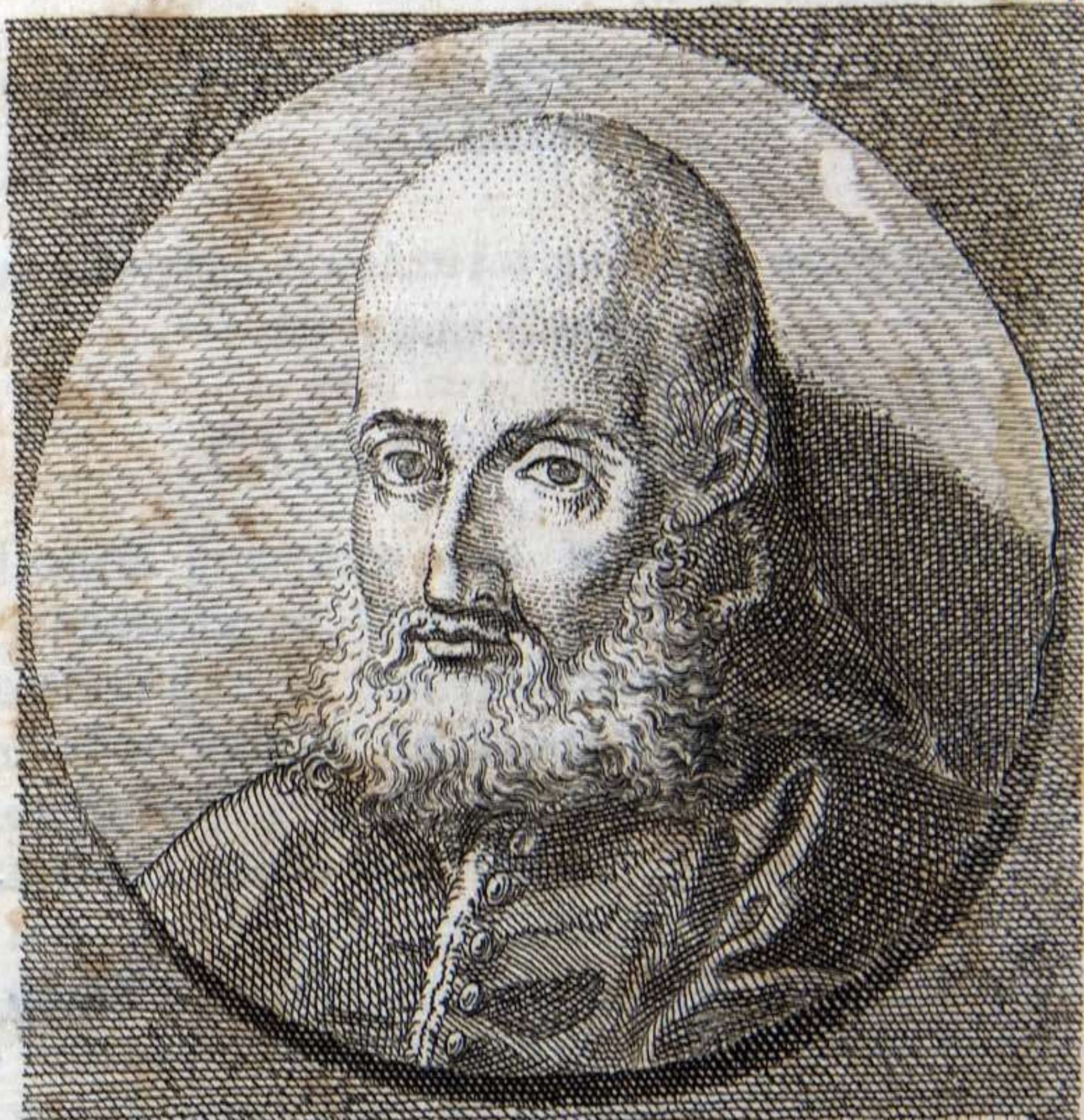
V.D.D. IOANNES A RIVERA ARCHIEP. VALENT. PATRIARCHA. ANTIOCH.