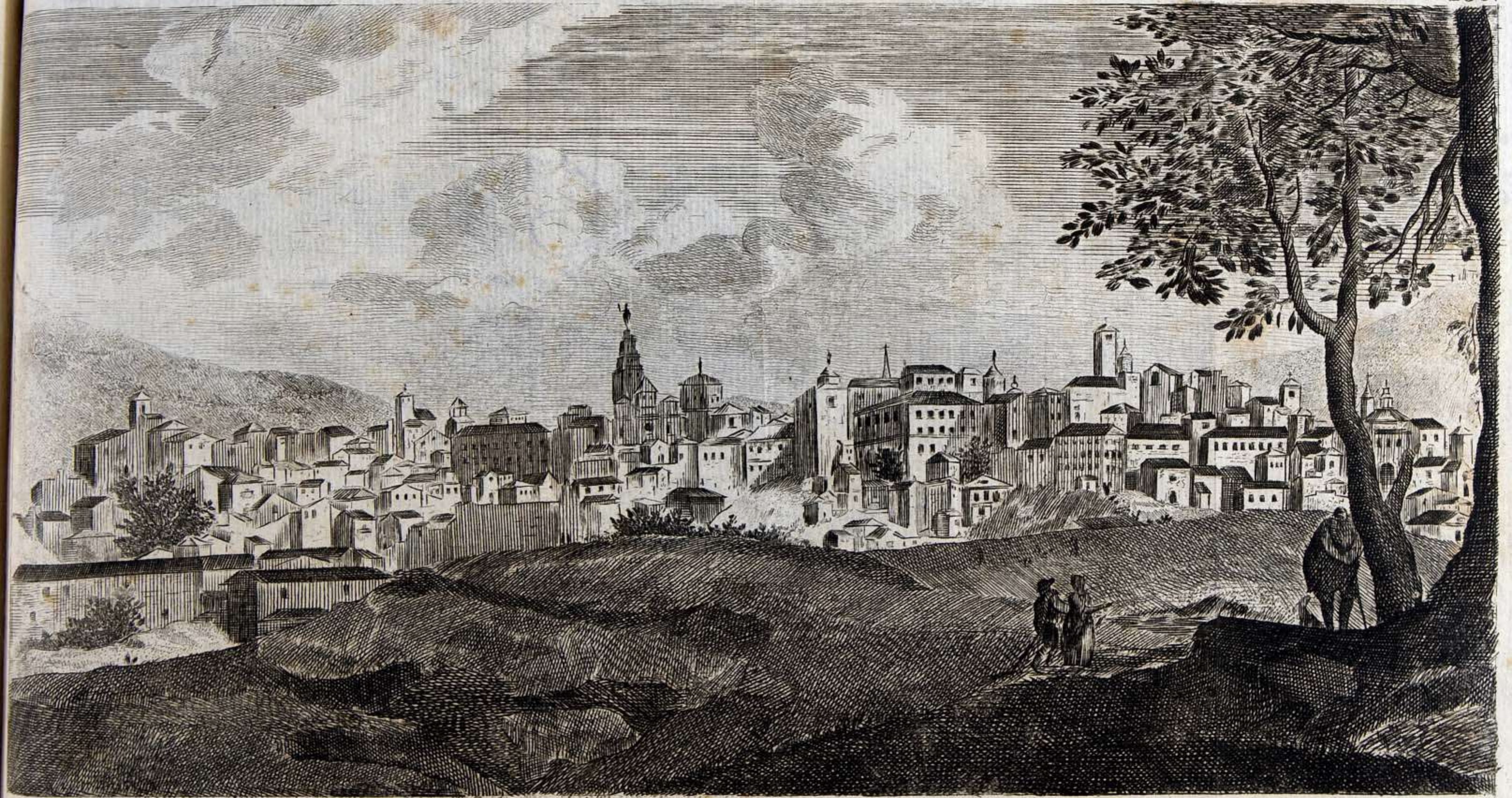
VISTA DE CUENCA.