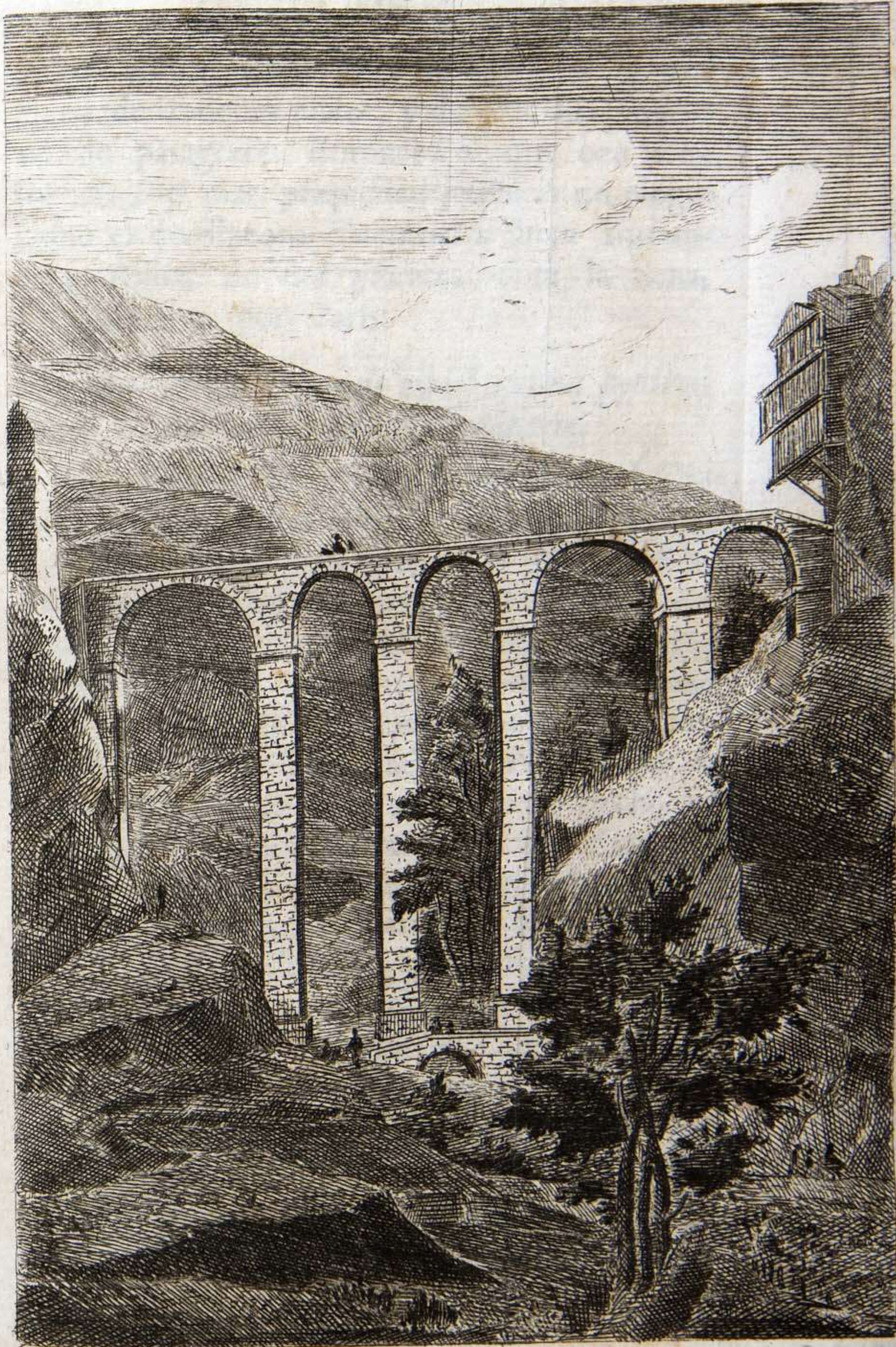
PUENTE DE S. PABLO.