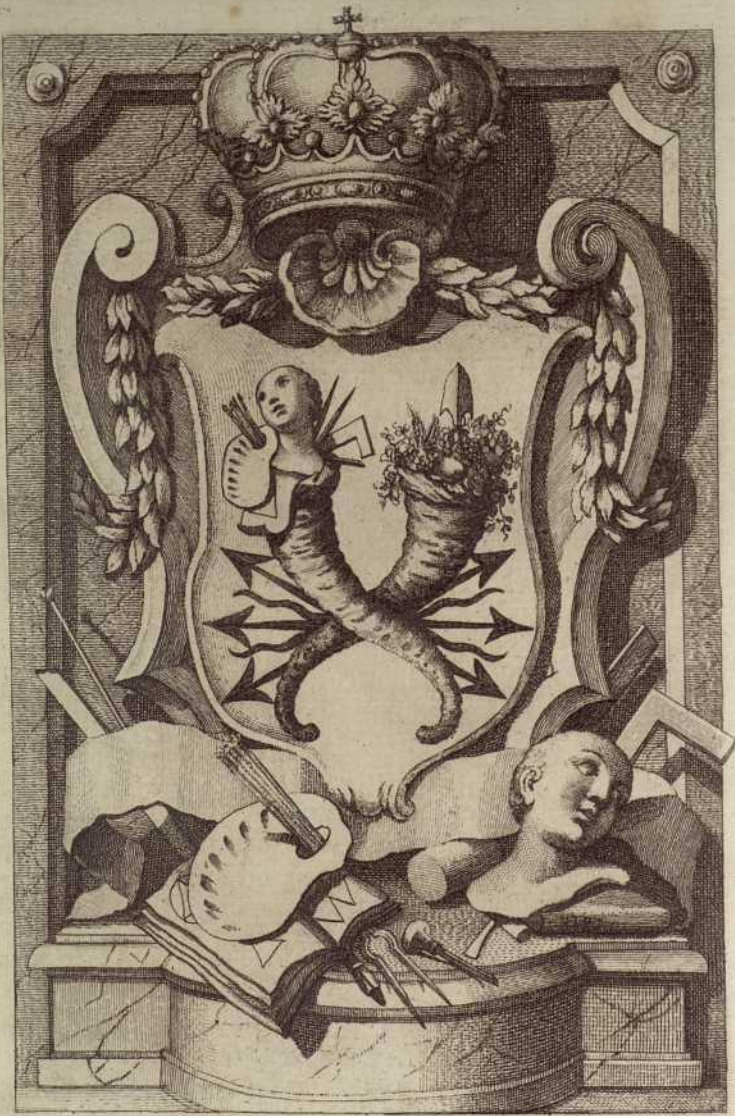
Immanuel Meyfort auct. sculp.