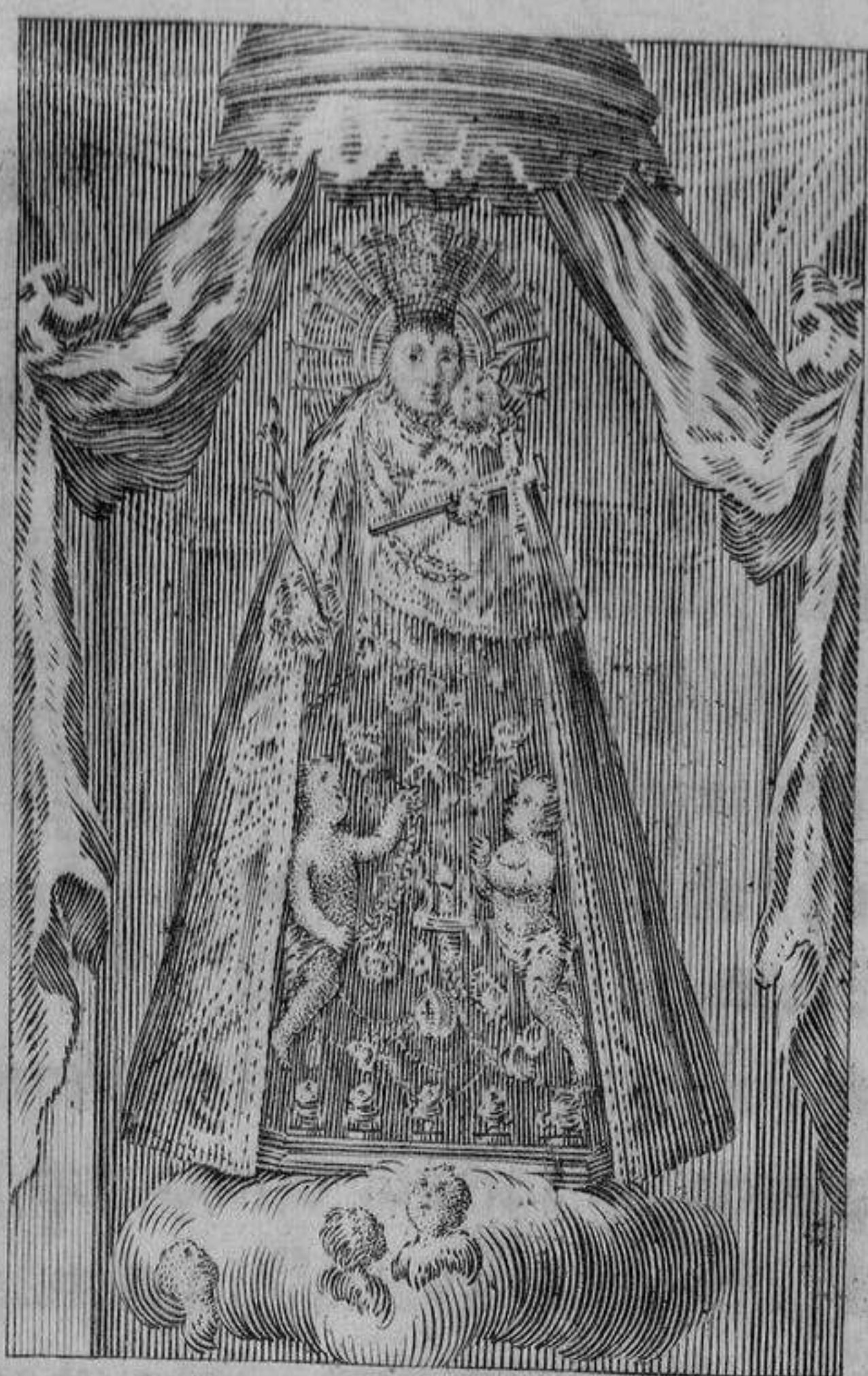
N. ra S. ra de los Desamparados de Val. encia y se venera en el Hospital de Mons. tr de esta Corte. Pouira sculp. V. o