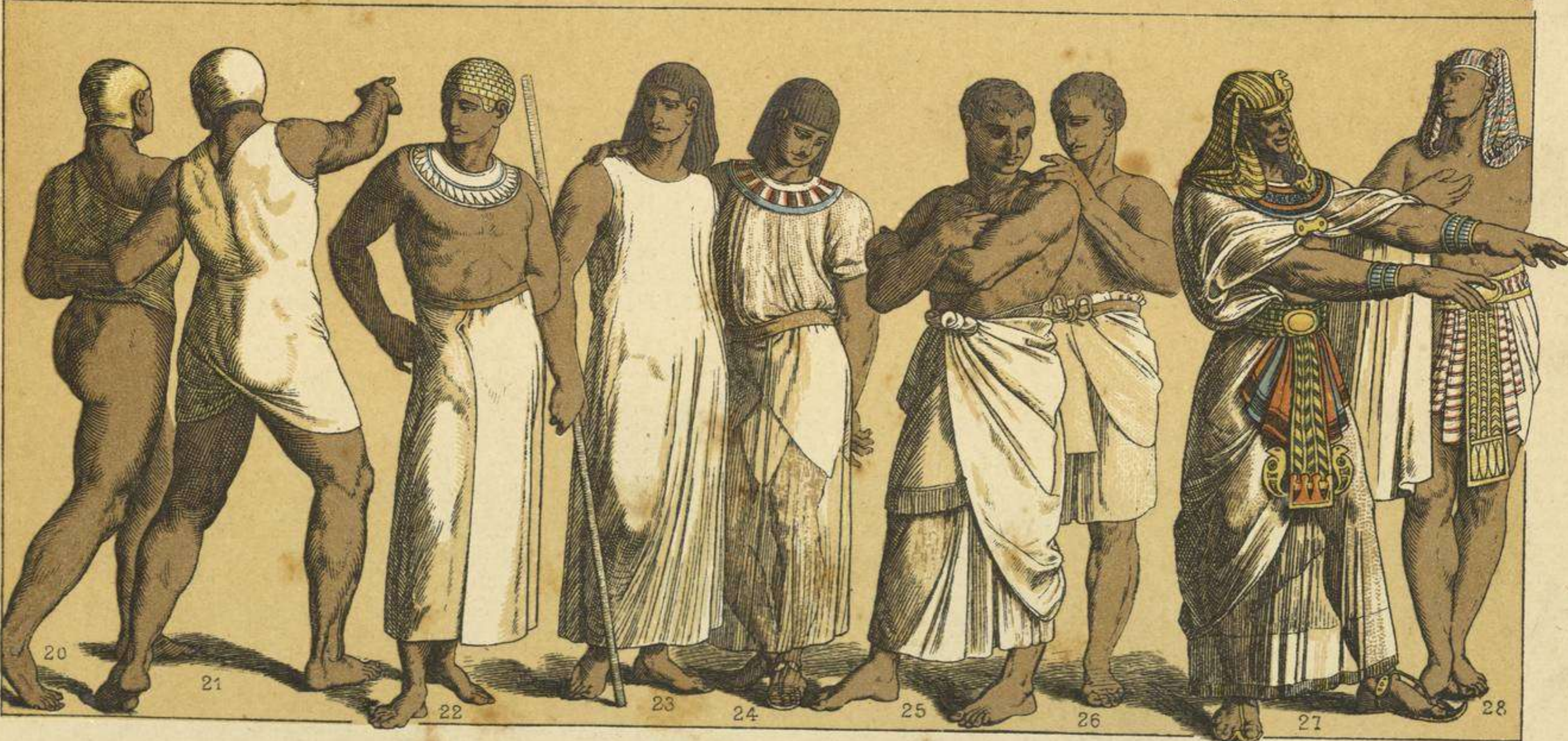
EDAD ANTIGUA.--TRAJES DE LOS PRIMITIVOS EGIPCIOS