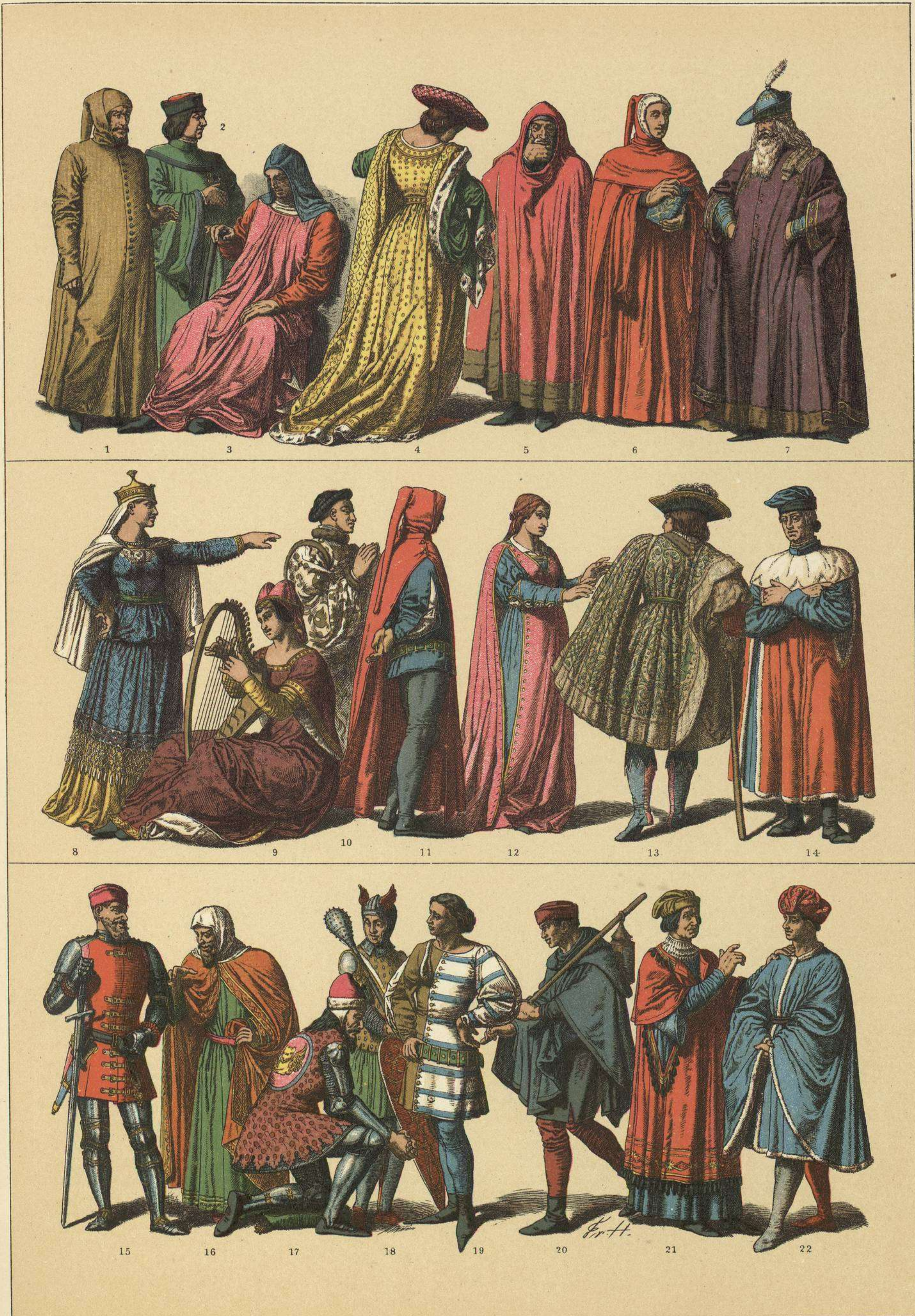
EDAD MEDIA.—TRAJES DE LOS ITALIANOS EN LA SEGUNDA MITAD DEL SIGLO XIV