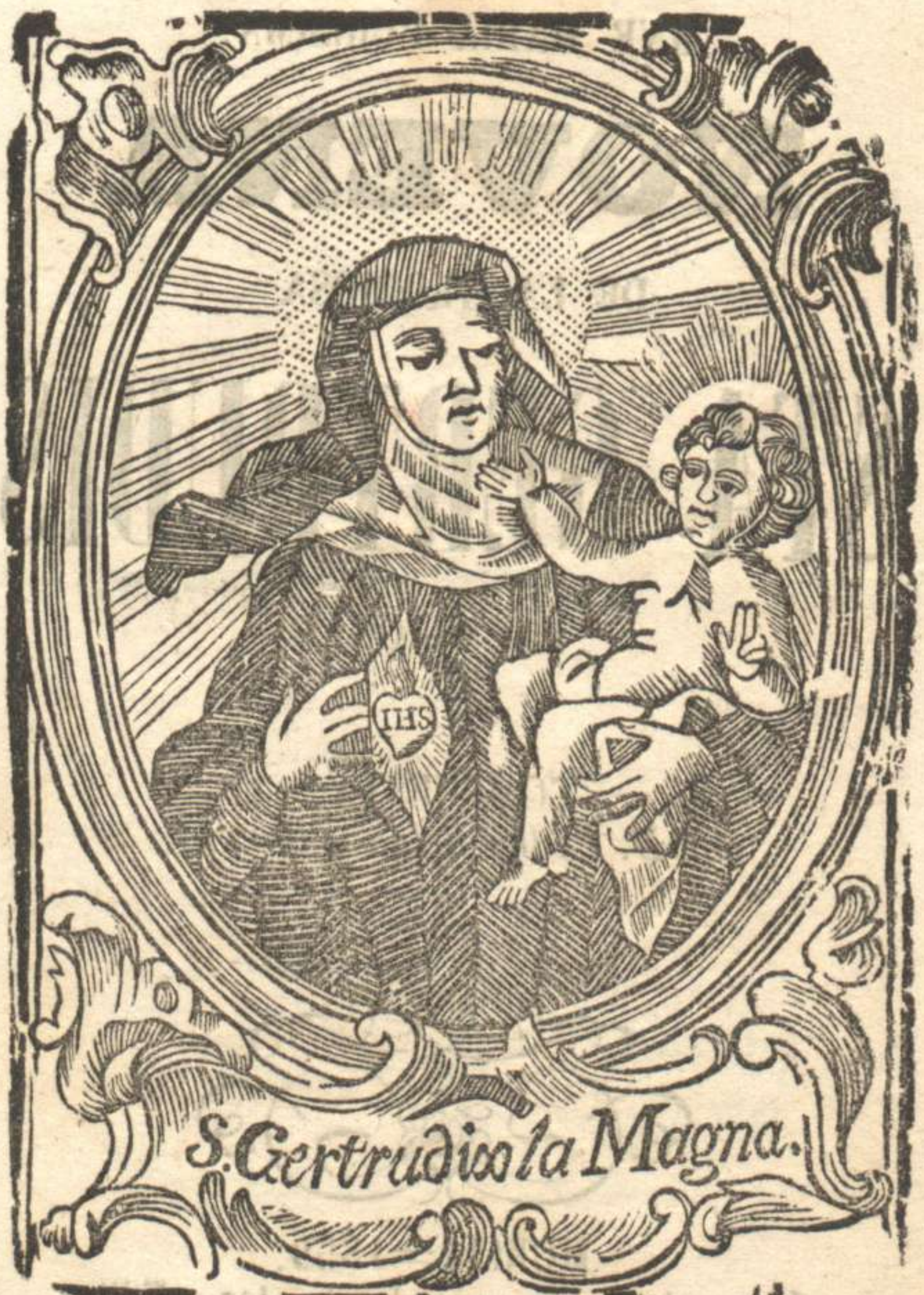
S. Gertrudis la Magna.