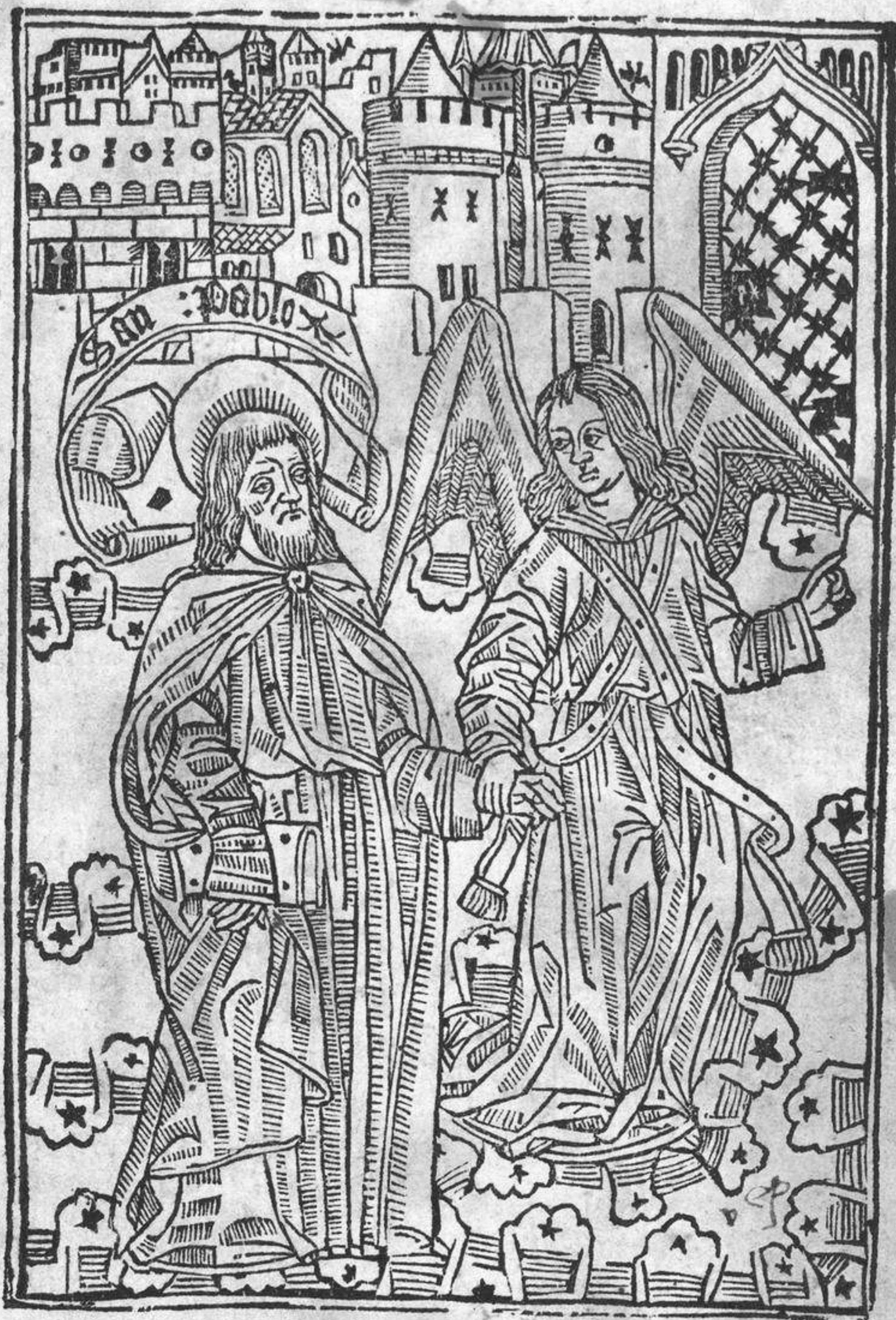
Pauli primi eremire vita