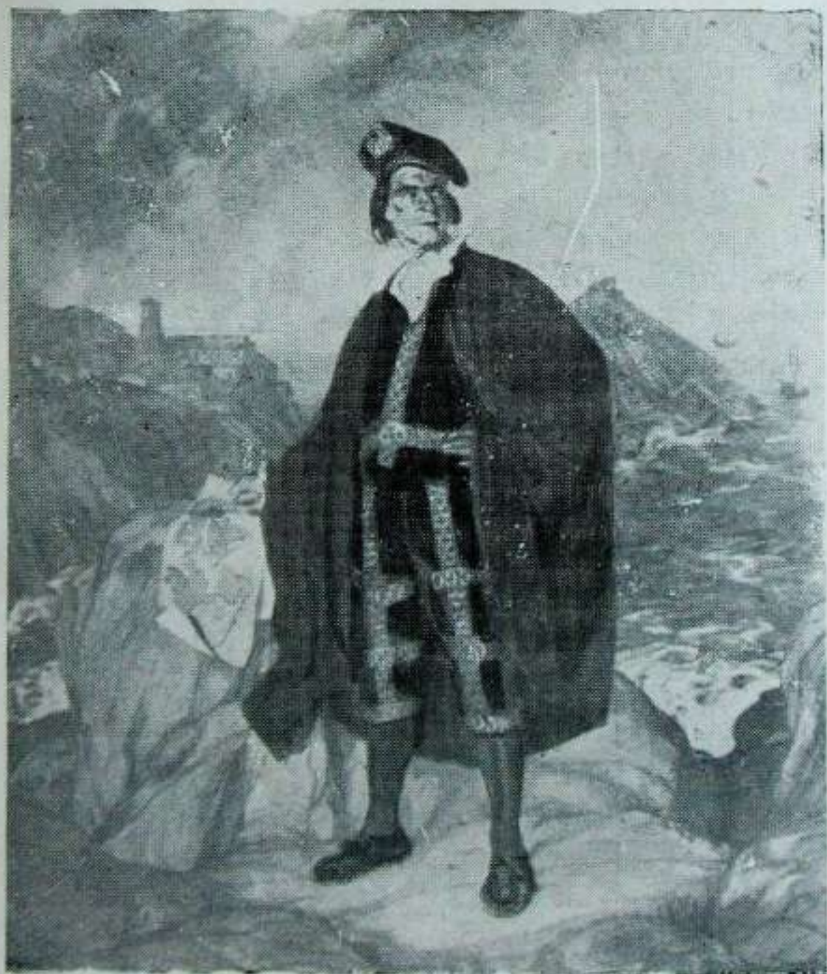
JUAN SEBASTIÁN DEL CANO