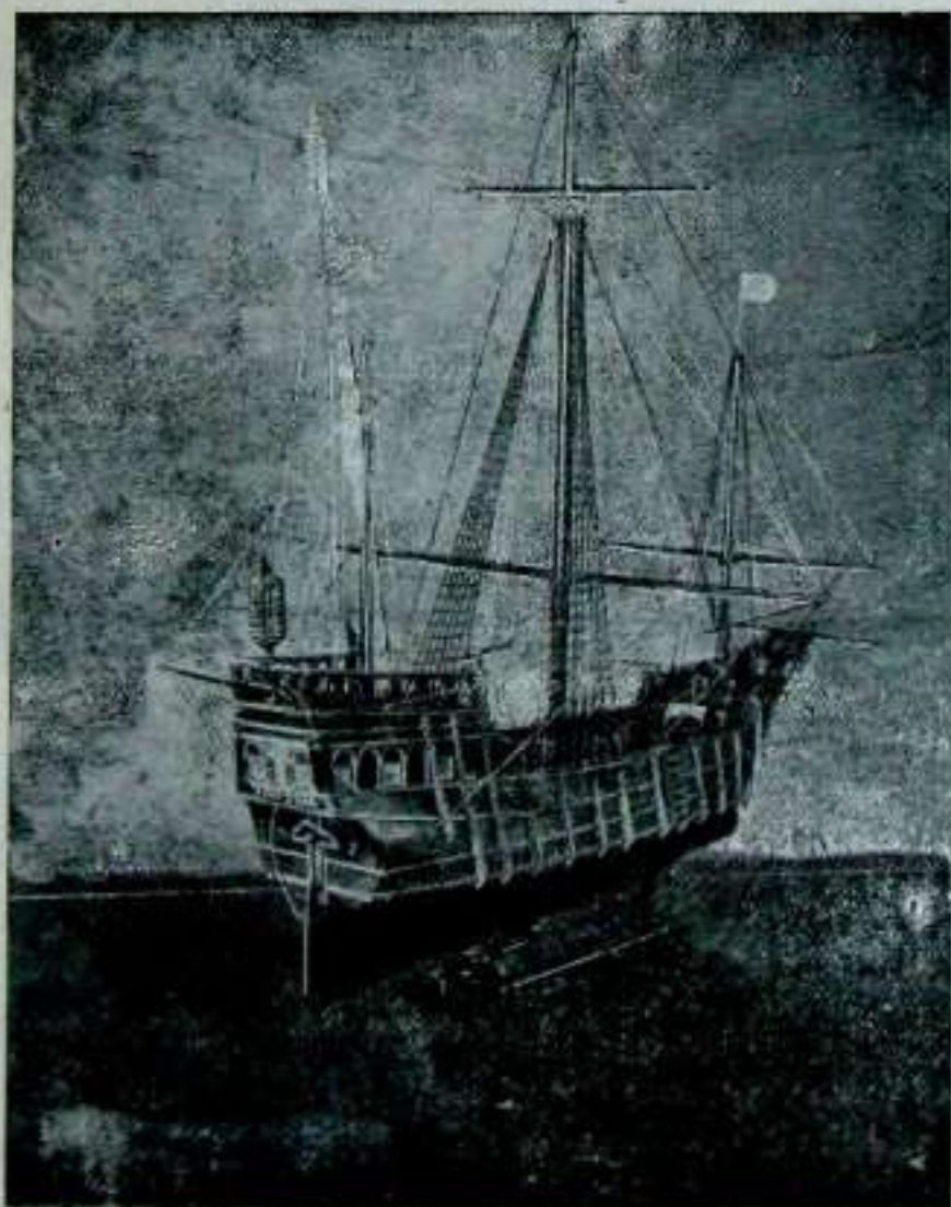
LA NAO «VICTORIA»