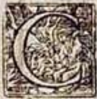
TABLA DE LOS CAPITVLOS DEL PRIMER LIBRO.

Capitulo primero, de como y quando fue delmembreada la Prouincia de Aragon de la de España, y del estado que los Conuentos della tenian en aquel tiempo, folio 1. pagina 1.