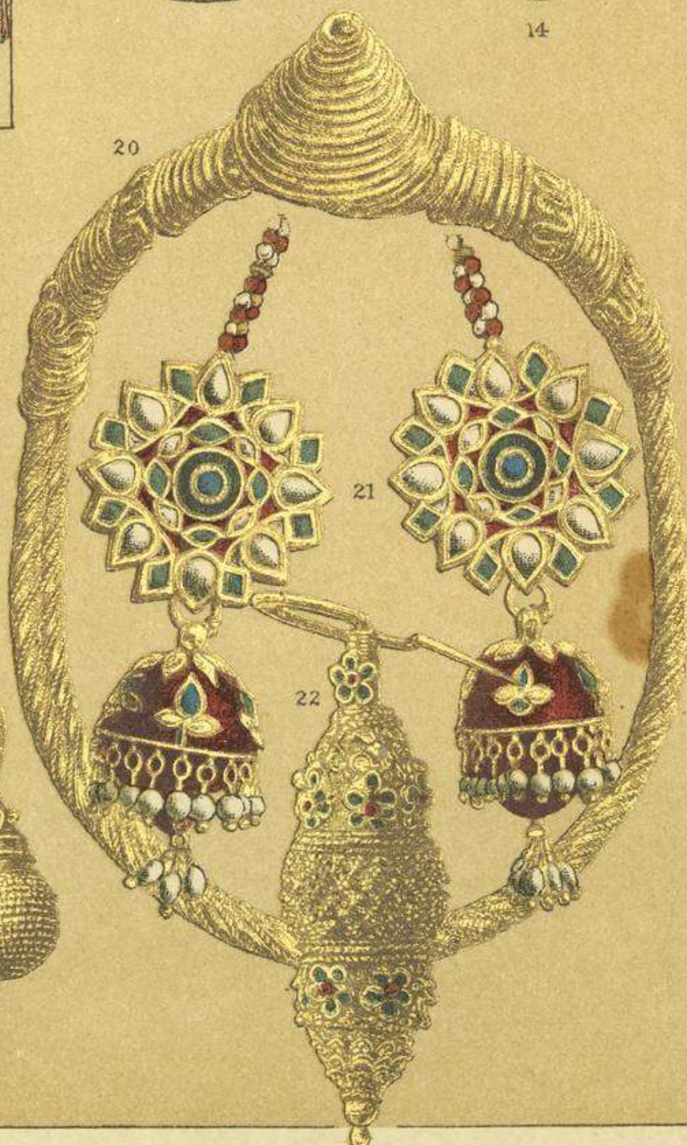
EDAD MODERNA. - TRAJES DE LOS CINGALESES Y JOYAS INDIAS