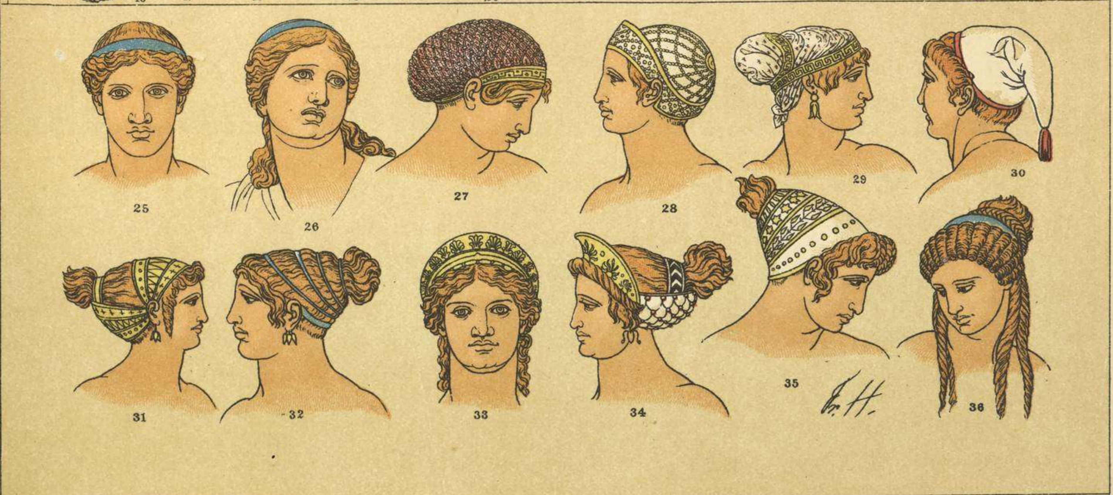
EDAD ANTIGUA.-ESCENAS DE COSTUMBRES, TRAJES Y TOCADOS DE LOS GRIEGOS