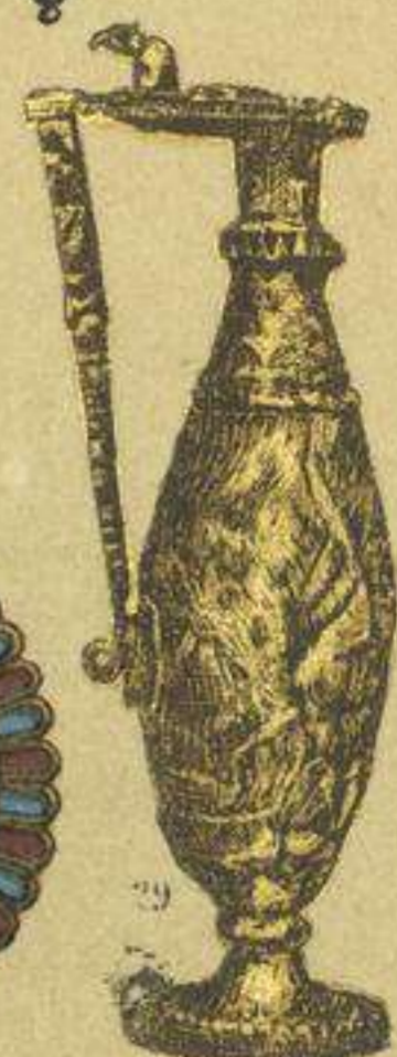
EDAD MEDIA. - TRAJES, ARMAS, ESCULTURAS, ADORNOS Y VASIJAS DE LOS GODOS