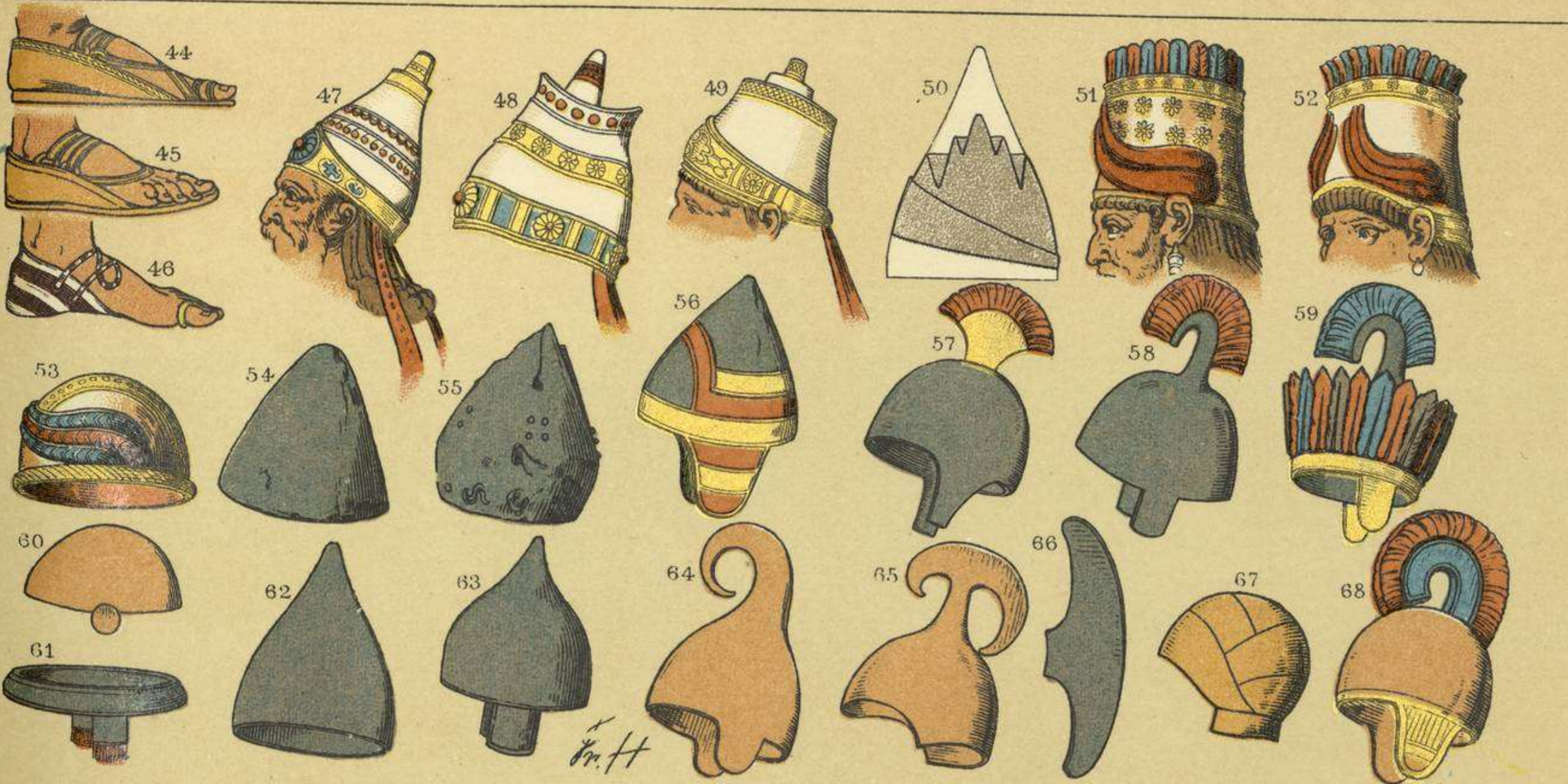
EDAD ANTIGUA.-OBJETOS DE ADORNO, TOCADO Y CALZADO DE LOS BABILONIOS Y ASIRIOS