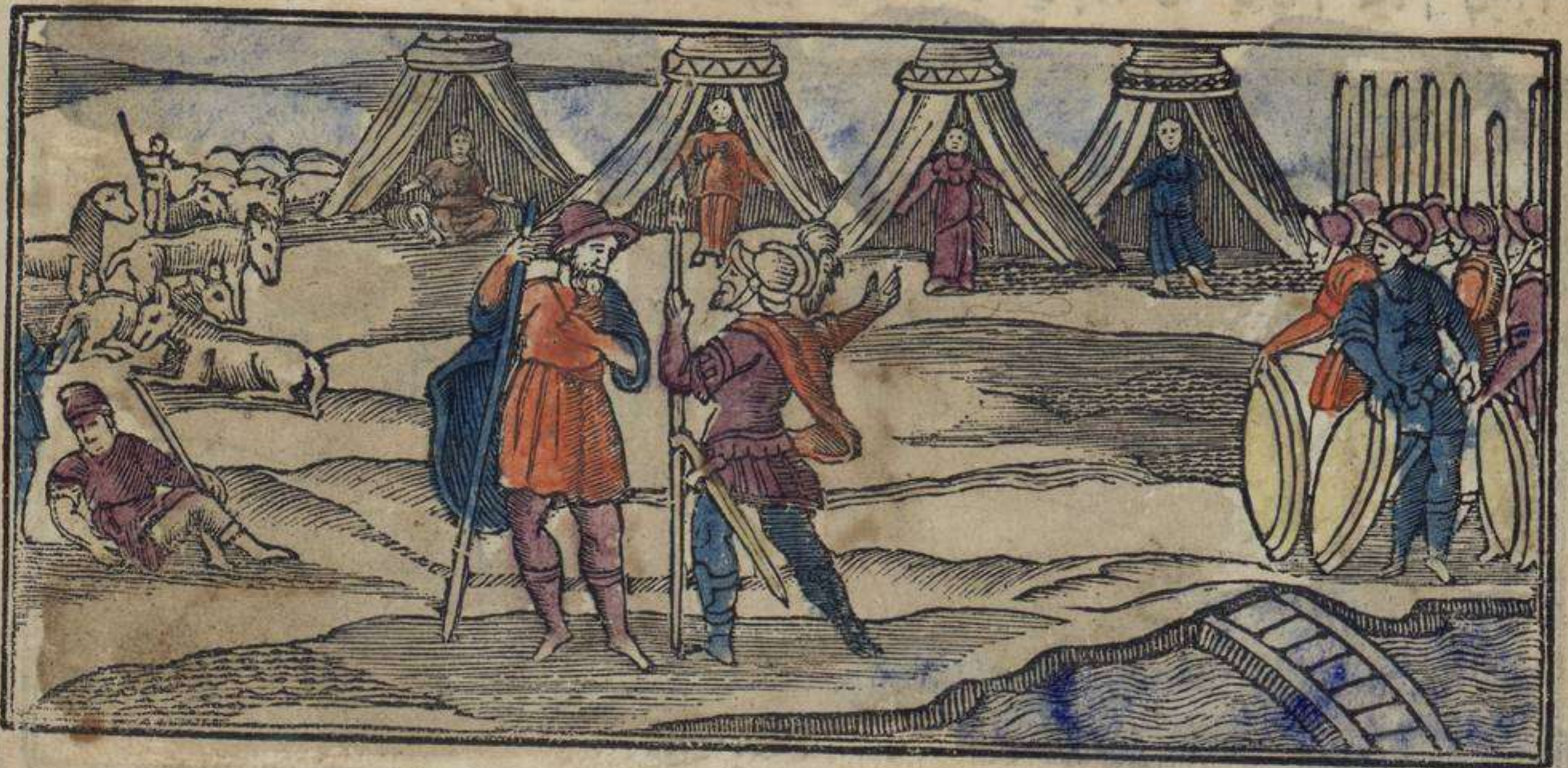
לבן איר ארמי קואנרו פירסינאו אה יעקב

צא סארי אי אפרינדי לו קי בושקי לבן איר ארמי פור פאזיר אה יעקב נואישטרו פארדי קי פרעה נו שינטינסיו שאלכו שירי לוש מאניש: זי לבן