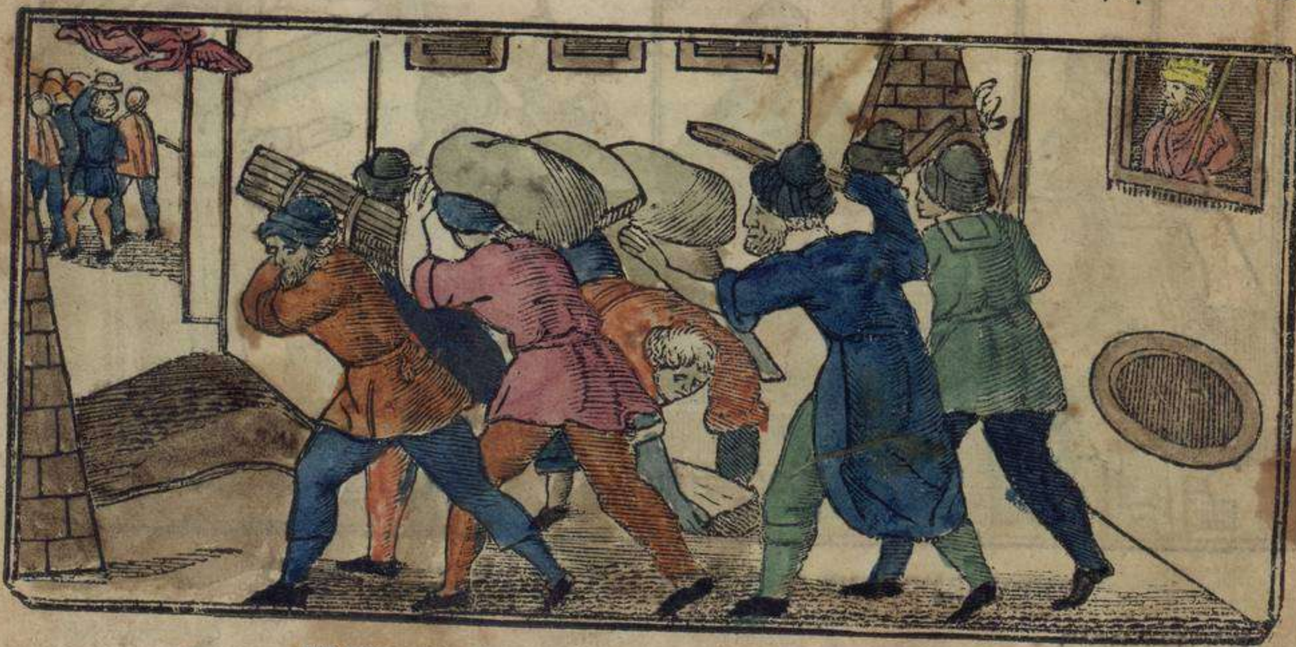
דוש נודיוש איסקלאבוס הא פרעה אין אניפטו

מה קואנטו פואי דיטודאדה לה נוגי לה אישטה מאש קי טודאש לאש נוגיש קי אין טודאש לאש נוגיש נו נוש אינטייטיש אפירו ויו אונה אי לה נוגי לה אישטה דוש ויוש קי אין טודאש לאש נוגיש נוש קומיינטיש לייכרו או סינסיינטיא אי לה נוגי לה אישטה טודו סינסיינטיא קי אין טודאש לאש נוגיש נוש קומיינטיש רישטו די וירדודאש • אי לה נוגי לה אישטה אמרונה קי אין טודאש לאש נוגיש נוש קומיינטיש אי ביינטיש טאנטו אסינטאדוש אי טאנטו רישקובדאדוש אי לה נוגי לה אישטה טודוש נוש רישקובדאדוש : אי טורנארן איל פלאטו אי דיראן : עבדים סיירכוש פימוש אה פרעה אין אנפשו אי סאקוניש יי נואישטרו דיו די אאי