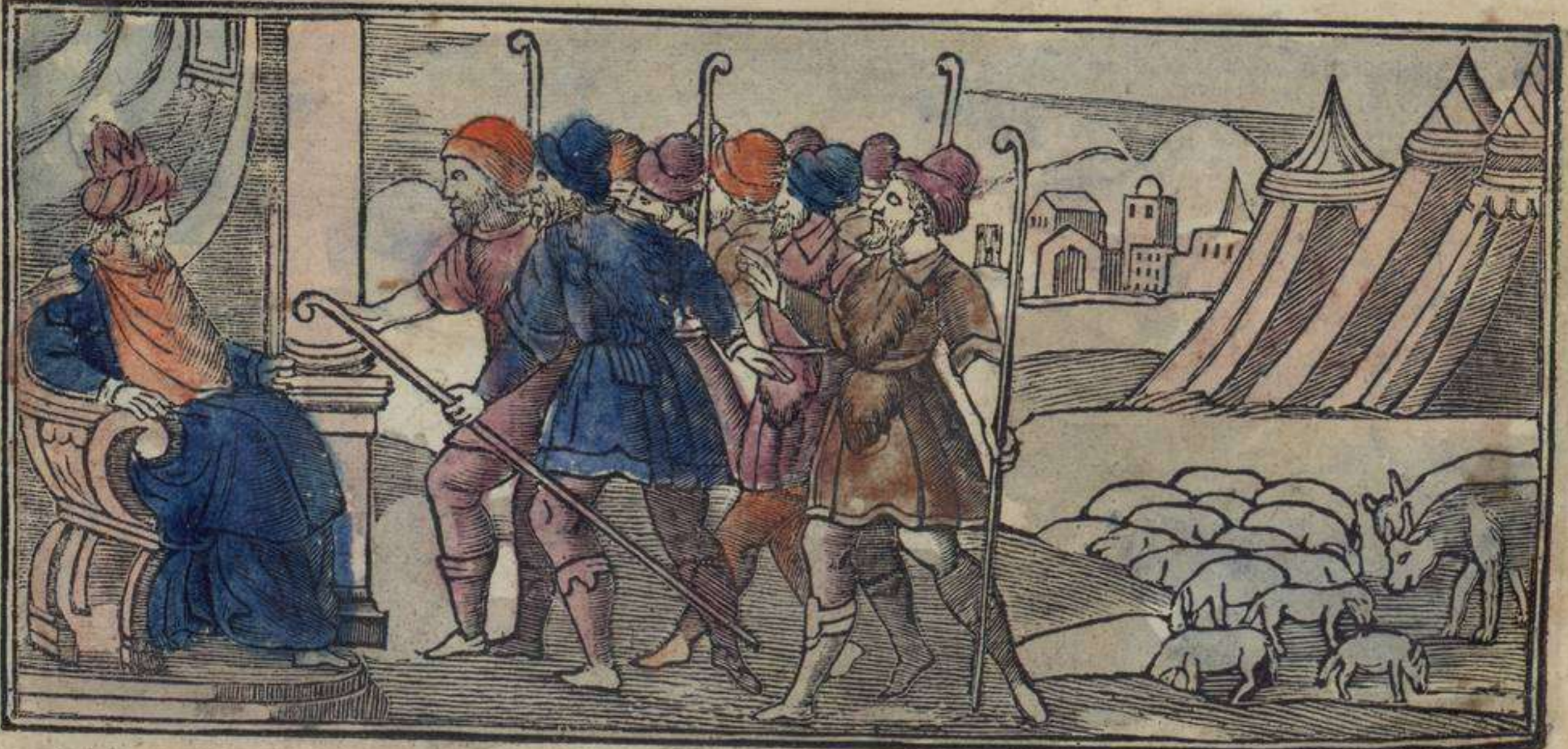
דוש אירמנוש די יוסף קואנרו דינרון אה פרעה פור פילגרינאר אין לה טיירה וינימוש אליו

במתי קון גינטי פוקה קומו דייו איל פסוק קון שיטינטה אלמאש דיסינדירון טוש פאדריש אה אנפטו אי אנורה פוויטי יי טו דייו קומו אישטרידיאש די לושסירוס