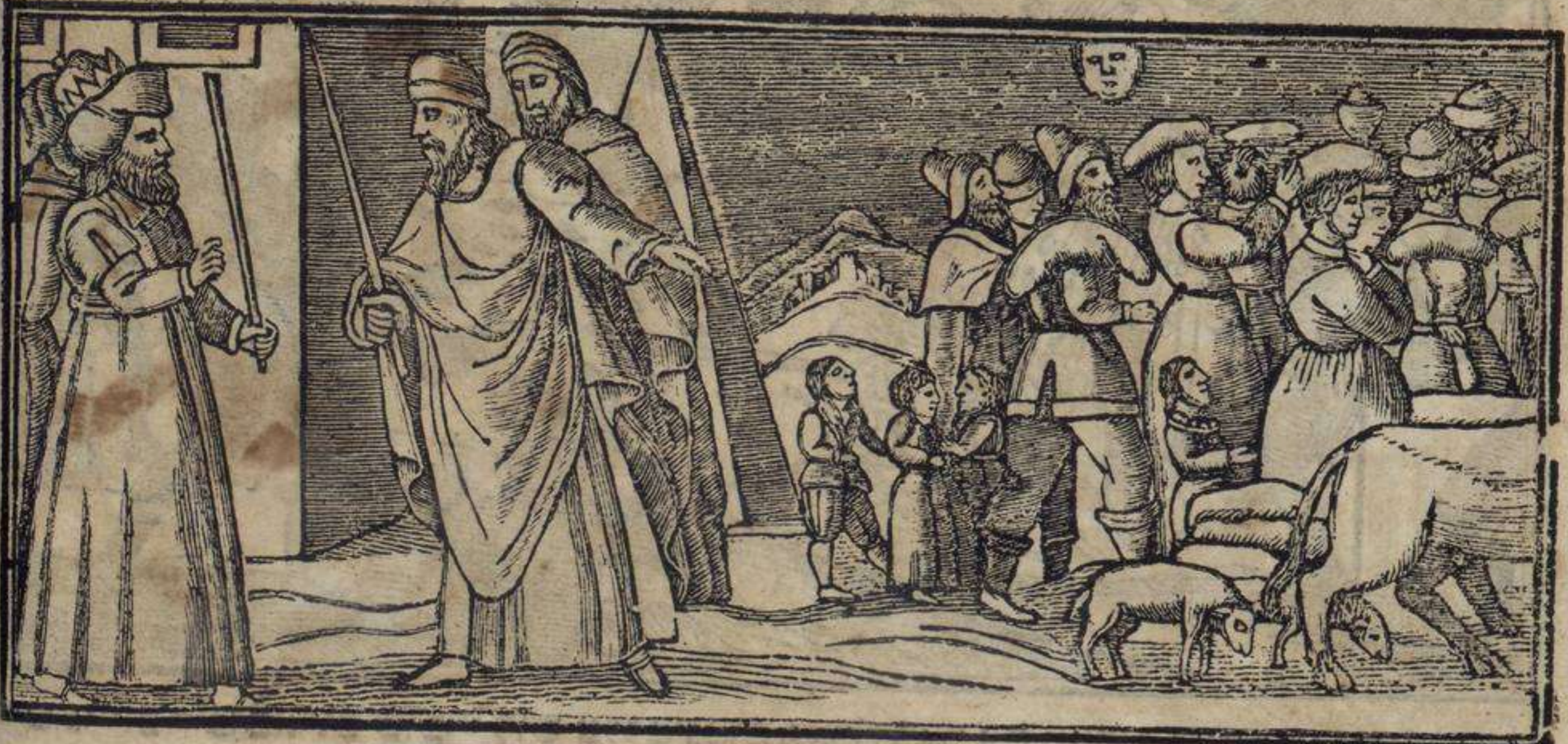
אין סאדיר איל פואיבלו די ישראל די איניפמו

כַּטַּח קוֹאֲנְטוּשׁ גְּרֵאֲרוּשׁ בּוֹאִינוּשׁ אַה אֵיל קְרִיאָדוֹר שׁוֹכְרֵי נוּשׁ שִׁי נוּשׁ סְאֲקָאָרָה דִּי אֵינִיפְטוֹ אֵי נוּ אֵיזִיָּדָה אֵין אֵילִיוּשׁ גּוֹאִיזִיוּשׁ אֲבֵאֲשֶׁאֲרָאנוּשׁ : שִׁי אֵיזִיָּדָה אֵין אֵילִיוּשׁ גּוֹאִיזִיוּשׁ אֵי נוּ אֵיזִיָּדָה אֵין שׁוּשׁ דִּיזִיוּשׁ אֲבֵאֲשֶׁאֲרָאנוּשׁ :