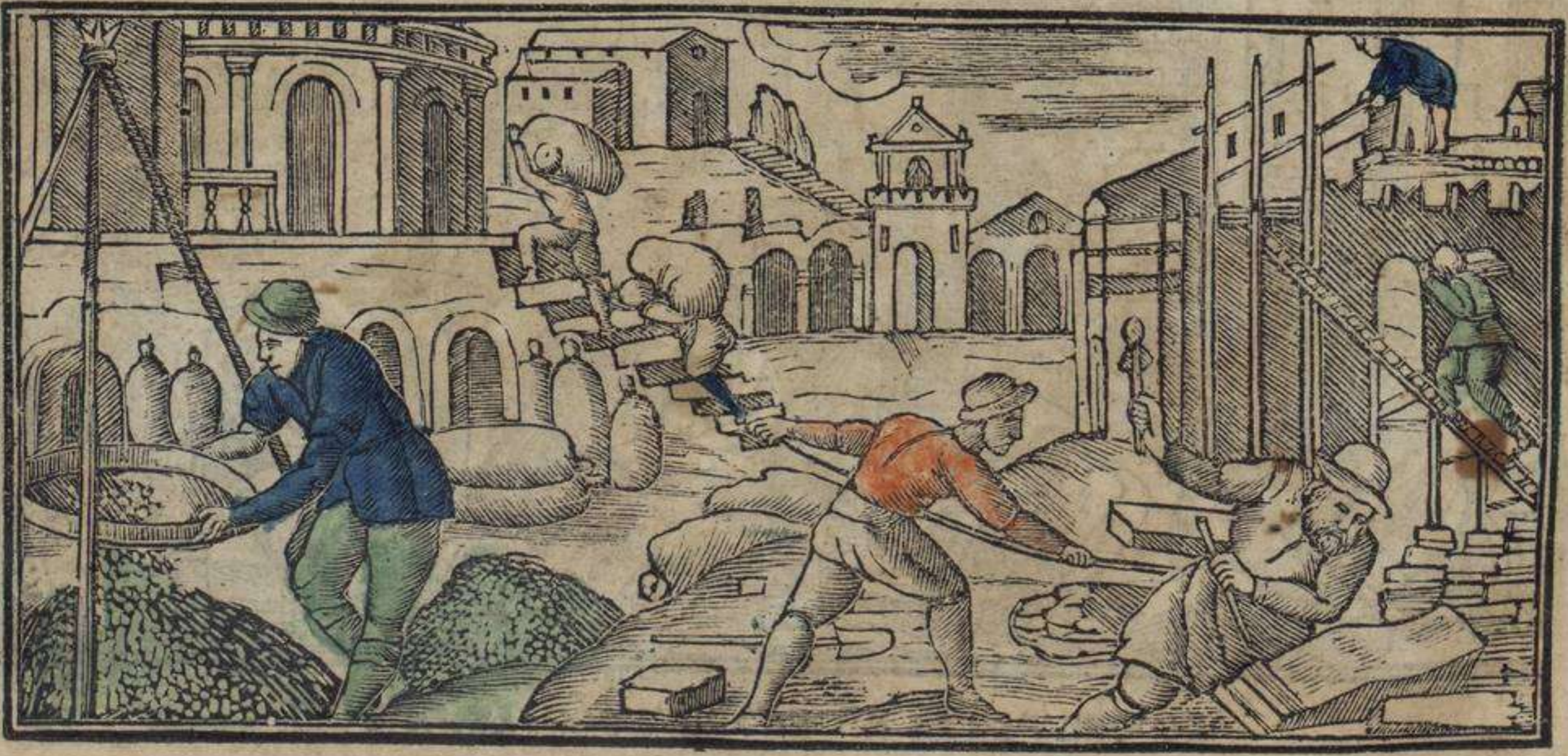
לאש אינקאשטיילירוראש קי פראגוארון אין איניפטו פיתום אי רעמסס

וְרַב אִי מוֹנֵוּ קוֹמוּ דִּיזִי אֵיל פְּסוּק מִלְאָרְיָא קוֹמוּ אִירְמוֹלִיזִי דִּיל קְאָמְפוּ טִי דִּי אִי מוֹגִינוֹא־שְׁטִי אִי אִינְרֵאנְדִּיסִישְׁטִי אִי טְרוֹשִׁישְׁטִי קוֹן אִפִּיטִי דִּי אִפִּיטִישׁ טִיטֵאשׁ פּוֹאִירִזִּין קוֹמְפּוֹאִיסְטֵאשׁ אִי טוֹ קְאָבִילִיזִי אִירְמוֹלִיזִיזִי אִי טוֹ דִּישְׁנוֹדָא אִי דִּישְׁקִיבִירְטֵא : וַיִּדְעוּ אִי אִינְמֵאִלִּישְׁיִירִזִּין אָה נּוֹשׁ לּוֹשׁ אִינְפִּסִיָּאנּוֹשׁ אִי אִפְלִירִזִּינוֹשׁ אִי דִּירִזִּין שׁוֹבְרִי נּוֹשׁ שִׁירְבִיסִיזִי דּוֹרוֹ : אִי אִינְמֵאִלִּישְׁיִירִזִּין אָה נּוֹשׁ לּוֹשׁ אִינְפִּסִיָּאנּוֹשׁ קוֹמוּ דִּיזִי אִיל פְּסוּק דָּא אִשְׁאֲבִינְטִימוֹנּוֹשׁ אָה אִיל דִּי קוֹאֲנְטוֹ שִׁי מוֹגִינוֹאִי אִי שִׁירָה קוֹאֲנְדוֹ נּוֹשׁ אִקוֹנְטִישִׁירָה פִּירִיָּאָה אִי שִׁירָה אֲנִיִּדִירִזִּין טְאֲנִבִיזִין אִיל שׁוֹבְרִי נּוֹאִישְׁטְרוֹשׁ אִבּוֹרִיסִינְטִישׁ אִי פִּירִיָּאָרָה קוֹן נּוֹשׁ אִי שׁוֹבְרָא דִּי לָה טִיירָה : אִי אִפְלִירִזִּינוֹשׁ קוֹמוּ דִּיזִי אִיל פְּסוּק אִי פּוֹזִירִזִּין שִׁיבְרִי אִיל מְאִירֵאִלִּישׁ דִּי פִּינְטֵאשׁ פִּיר אִפְלִירִזִּירִזִּין שׁוֹשׁ נְלֵאזִירִיָּאשׁ