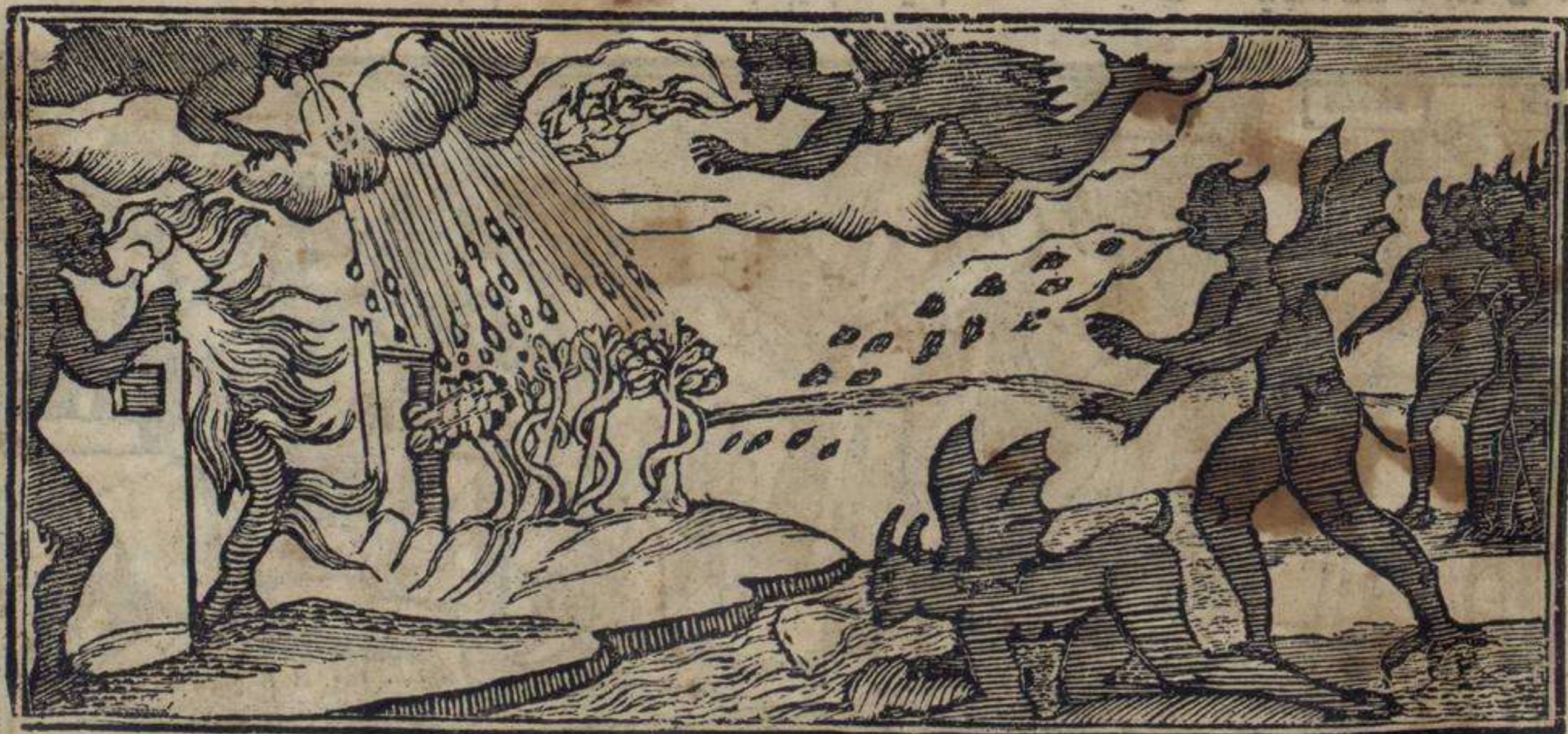
דימוניוס דיפוטארוס שוכרי לוש אלי מינטוס פארה דאר אה מצרים פינאס אי טורמיינטוס פירידאש

רבי עקיבא דיונין די ארונדי סי פרואיכה קי טודה פירידה אי פירידה קי טרושו איל שאנטו בינדינו איר שוכרי לוש איגיפסיאנוס אין איגיפטו אירה די סינקו