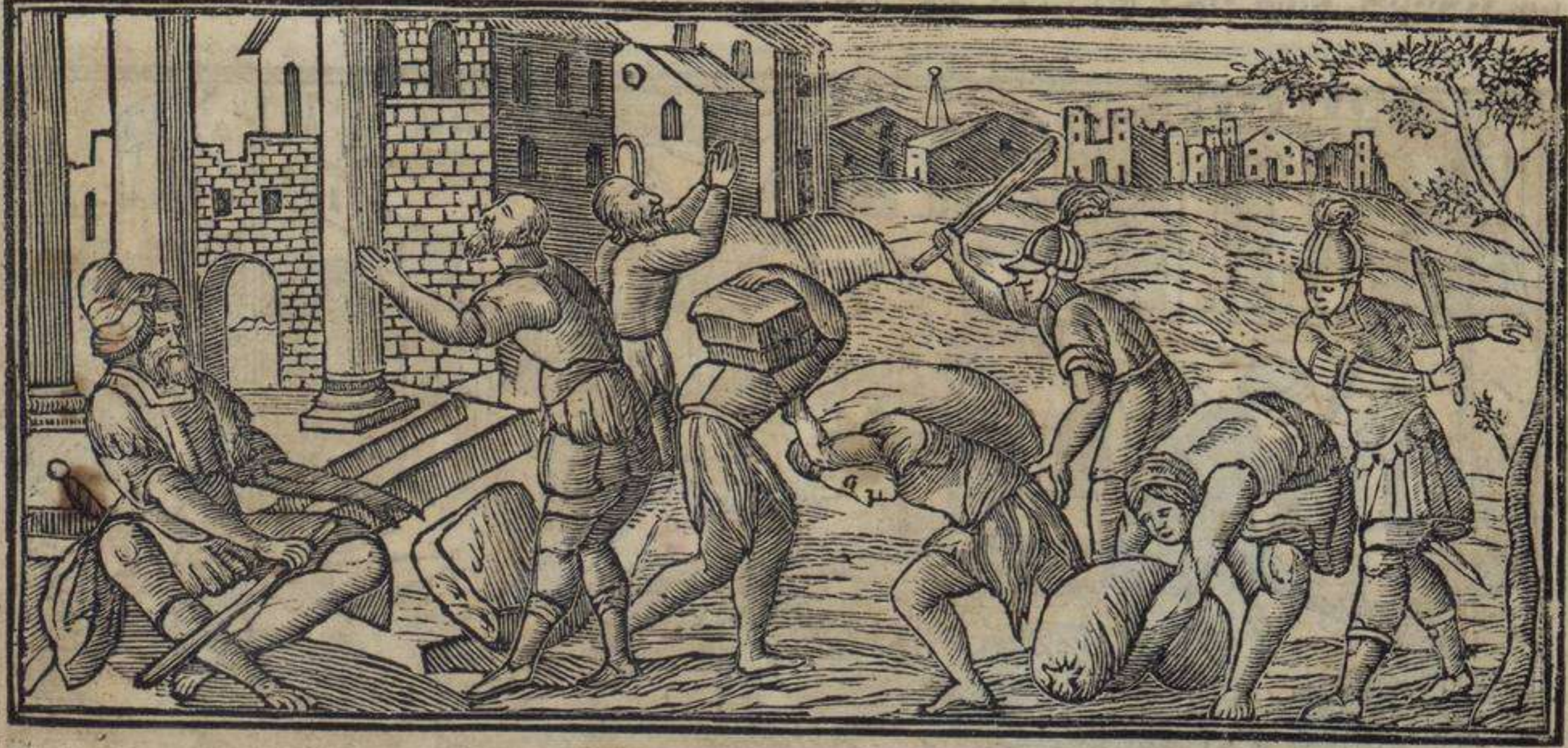
לה מונה אפליאסיון אי לאזיריא אי אפריטאמיינטו קי אין אנפטו ליש דאבאן קון גראנדי טורמיינטו :

והי נואישקלאמאוש אה יי דייו די נואישטרוש פארדיש קוטו דיני איל פסוק נוי פואי נין לוש דיאש לוש מנוש לוש נישוש נוי טוריו די נואפטו נוי שושפירארון נוינוש די ישראל דיר