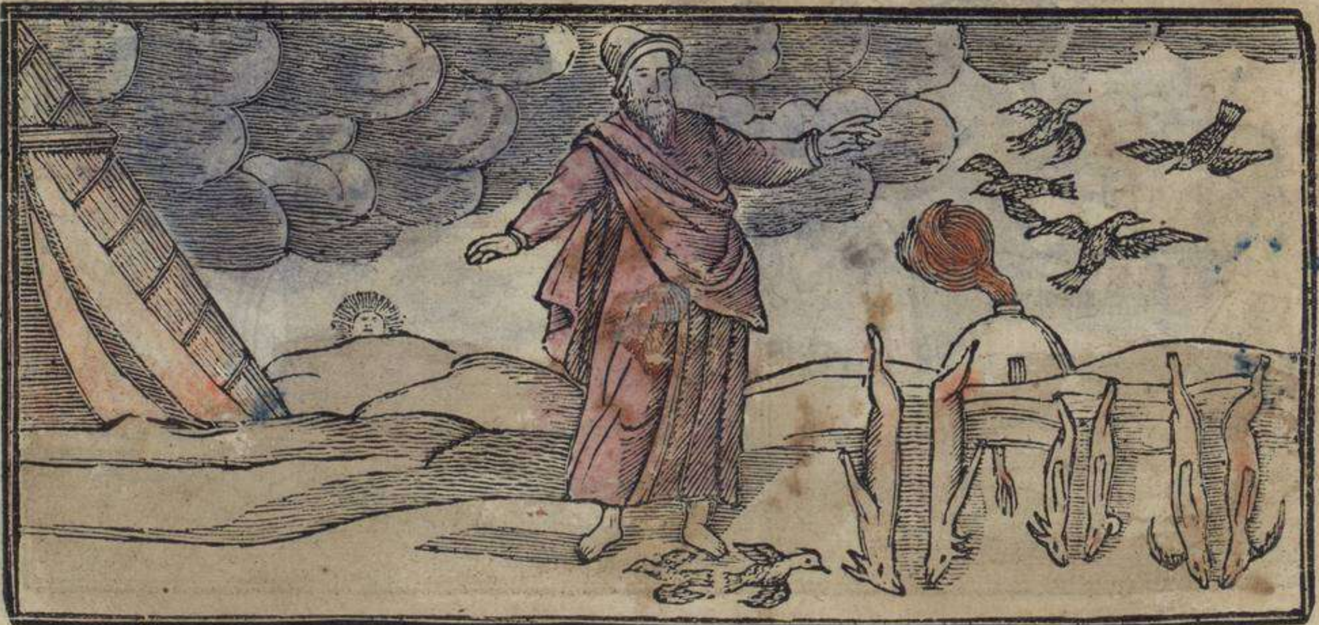
איל פִּרְמֵאֲטִינְטוֹ אִינוּ קוֹן אֲבֹרָהִם אִינוֹטְרֵי לוֹשׁ אִישְׁפֶּאֲרֻטִימִינְטוֹשׁ

וַאֲקַח אִי טוֹמֵי אֵה וּוְאַשְׁטְרוּ פֶּאֲדְרֵי אֵה אֲבֹרָהִם דִּי פֶּאֲרֻטֵי דִיל רִיאוּ אִי לְיִיבֵי אֵה אִיל פִּוּר טִיִּדָה טִיִּדָה דִי כְּנָעַן אִי מוֹנִיגוֹאֵי אֵה שׁוֹ שִׁימִין אִי דִי אֵה אִיל אֵה יִצְחָק אִי דִי אֵה יִצְחָק אֵה יַעֲקֹב אִי אֵה עֵשׂוֹ אִי דִי אֵה עֵשׂוֹ אִיל מוֹנִטֵי דִי שֵׁעִיר פִּוּר אִירִידָאָר אֵה אִיל אִי יַעֲקֹב אִי שׁוֹשׁ אִינוֹשׁ דְּסִינְדִירִין אֵה אֲנִיפְטוּ: כְּרוֹךְ בִּינְדִינֵנוּ נוֹאֲרָדָאן שׁוֹ פִּיאֹוִיָא אֵה יִשְׂרָאֵל בִּינְדִינֵנוּ אִיל קִי אִיל שֶׁאֲנָטוּ בִּינְדִינֵנוּ אִיל קוֹנְטָאן אֵה אִיל פִּין פִּוּר פֶּאֲזִיר לוֹ קִי דִישׁוֹ אֵה אֲבֹרָהִם נוֹאֲיִשְׁטְרוּ פֶּאֲדְרֵי אִינוֹטְרֵי לוֹשׁ אִישְׁפֶּאֲרֻטִימִינְטוֹשׁ קִי אֲנָסִי דִיוִי אִיל פֶּסוּק אִי דִישׁוֹ אֵה אֲבֹרָהִם סֶאֱבִיר סֶאֱבִירָשׁ קִי פִילִיגְרִינוּ שִׁיִּדָה טוֹ שִׁימִין אִין טִיִּדָה