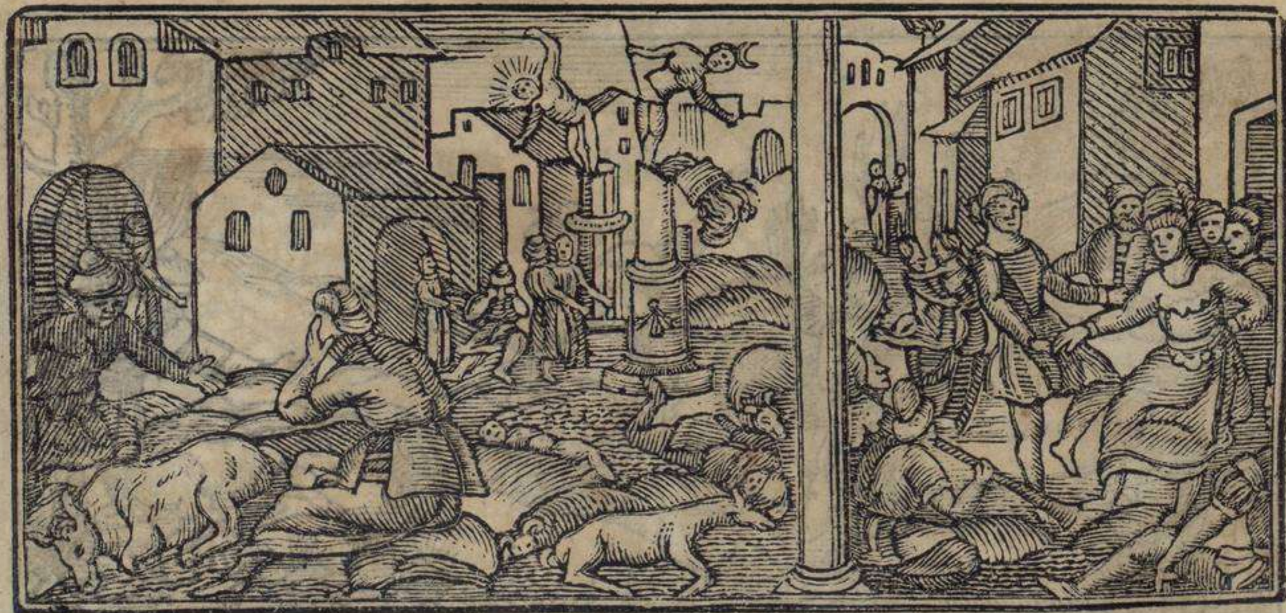
לה דישטרוסיון די לוש אידולוש אי טודוש פרימוחיניטוש די אניפטו

קומו דיין איל פסוק אי פאשרי אין טיירה די אניפטו אין לה נוי לה אישטה אי פירי טירו פרימוחיניטו אין טיירה די אניפטו דישרי אומברי אי פאשטה קואטרופיאה אי אין טודוש דיווייש די אניפטו פארי נושטיסייה יו יו : אי פאסרי אין טיירה די אניפטו יו אי נו אנגיל אי פירי טודו פרימוחיניטו יו אי נו ארדירור : אי אין טודו דיווייש די אניפטו פארי נושטיסייה יו אי נו מינשאנירו יו יו יו איל אי נו אוטרו : ביד קין פיריר פואירטי אישטה לה מורטאקראד קומו דיין איל פסוק אינ פיריר די יו קיבראנטאן אין טו גאנארו קי איניל קאמפו אין לוש קאבאליווש אין לוש אנוש