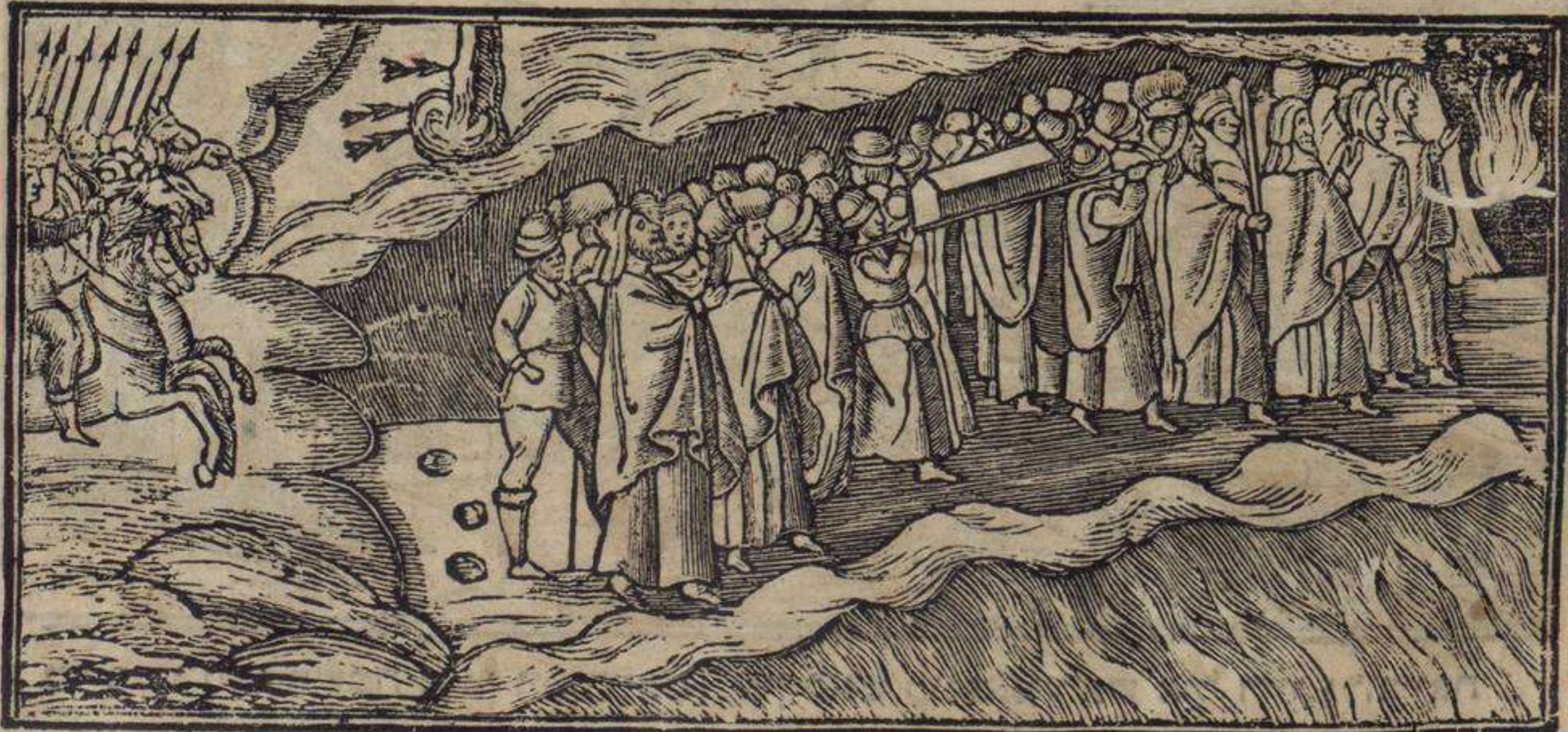
משה קין לה וארה פארטיוו אה לה מאר פארה קי ישראל פוריישין פאשאר שי

שִׁי אִיזְיִירָה אִין שׁוֹשׁ דִּיזִים אִי נוּ מֵאֲמָרָה אָה שִׁישׁ מֵאִירִישׁ אַבְּאֲשְׁטֶאֲרָנוּשׁ : שִׁי מֵאֲמָרָה שׁוֹשׁ מֵאִירִישׁ אִי נוּ דִּיירָה אָה נוֹשׁ אָה שִׁישׁ אֲזִינְדָאֵשׁ אַבְּאֲשְׁטֶאֲרָנוּשׁ : שִׁי דִּיירָה אָה נוֹשׁ אָה שׁוֹשׁ אֲזִינְדָאֵשׁ אִי נוּ פִּרְטִיירָה אָה נוֹשׁ אָה לָה מֵאֲר אַבְּאֲשְׁטֶאֲרָנוּשׁ : שִׁי פִּאֲרְטִיירָה אָה נוֹשׁ אָה לָה מֵאֲר : אִי נוּ נוֹשׁ אִיזְיִירָה פִּאֲסֶאֲר אִינְטְרִי אִיל פּוֹר אִיל שִׁיקוֹ אַבְּאֲשְׁטֶאֲרָנוּשׁ : שִׁי נוֹשׁ אִיזְיִירָה פִּאֲסֶאֲר אִינְטְרִי אִיל פּוֹר אִיל שִׁיקוֹ גִּזִי נוּ גִּזְוִנְדִּירָה נוֹאִישְׁטְרוֹשׁ גִּזְוִנְשְׁטִיאֲדוֹרִישׁ אִינְטְרִי אִיל אַבְּאֲשְׁטֶאֲרָנוּשׁ :