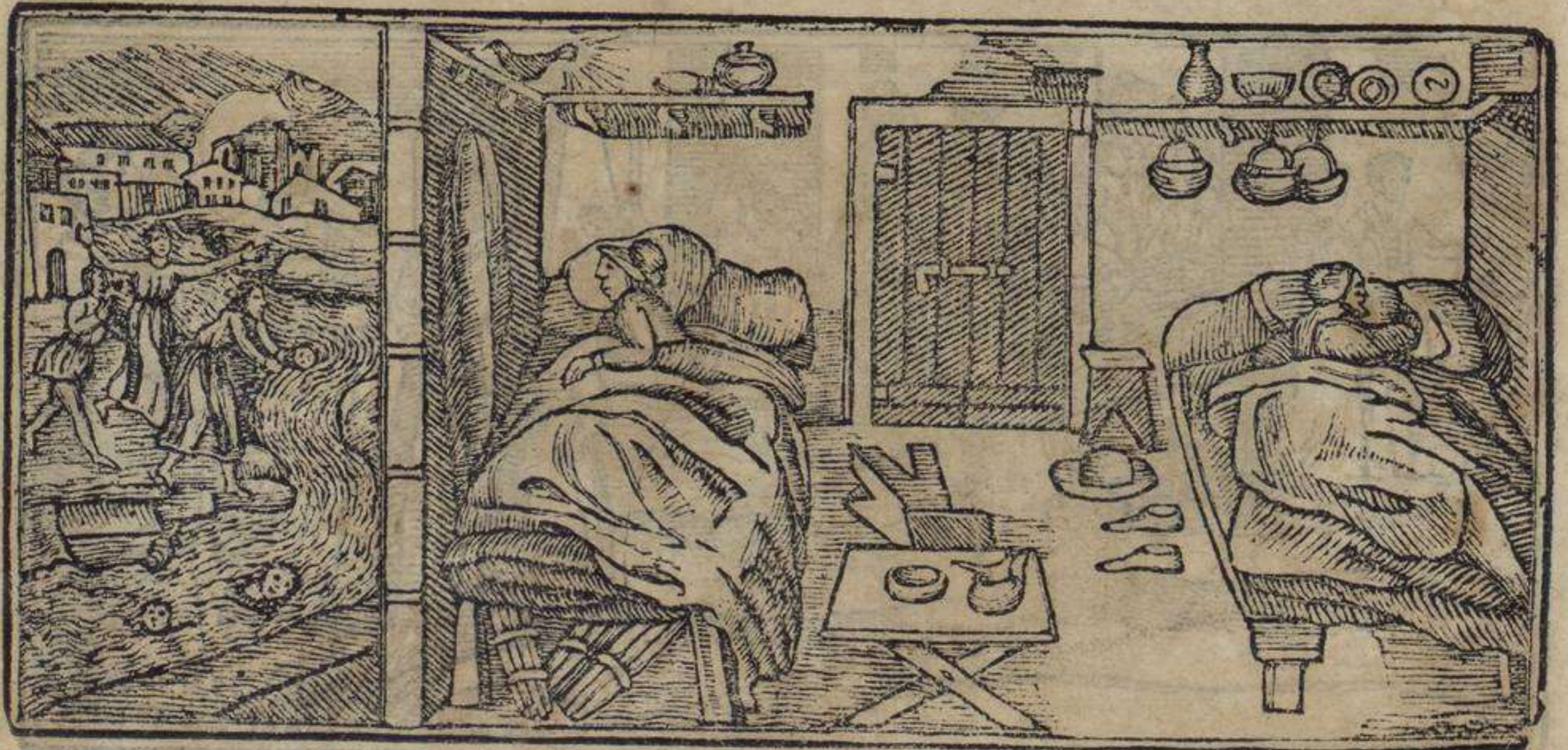
מֶאֲרִירוֹ אִי מוֹנִיר דּוֹאִירֶמִין אִיסְפֶּאֲרֶטִירוֹם פּוֹר נוֹ אִינֶאֶר הָא אִיל רִיאוֹ לוֹס אִיגוֹם נֶאֲסִירוֹם

וְאֵת אִי אַה נוֹאשְׁטֶרָה לֶאזְרִיָּא אִישְׁטוֹשׁ לוֹשׁ אִינֹשׁ קוֹמוֹ דִּיוֹ אִיל פֶּסוֹק : אִי אִינְקוֹמִינְדוֹ