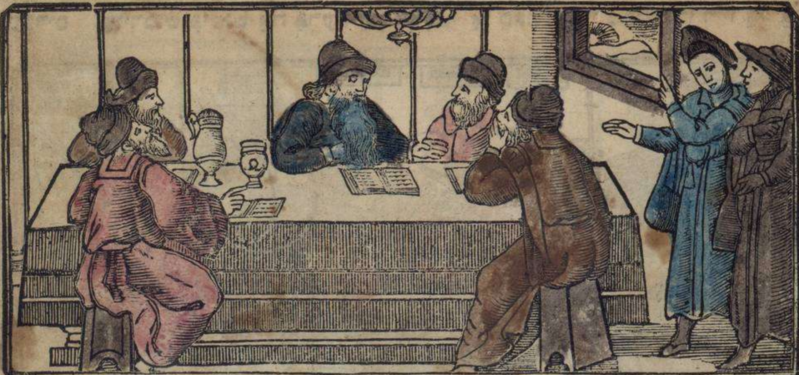
לוֹ קִי אַקוֹנְטִישִׁינְטוֹ אָה רַבִּי אֱלִיעֶזֶר אִי שׁוֹשׁ קוֹנְפֶאנִירֶדוֹשׁ

מַעֲשֵׂה אַקוֹנְטִישִׁינְטוֹ אִין רַבִּי אֱלִיעֶזֶר אִי רַבִּי יְהוֹשֻׁעַ אִי רַבִּי אֶלְעָזָר אִינוֹ רִי עֲזַרְיָה אִי רַבִּי עֲקִיבָא אִי רַבִּי טַרְפוֹן קִי אִירַאן אִרִי־סַקוֹבְרֶאדוֹשׁ אִין בְּנֵי כְּרֵק אִי אִירַאן