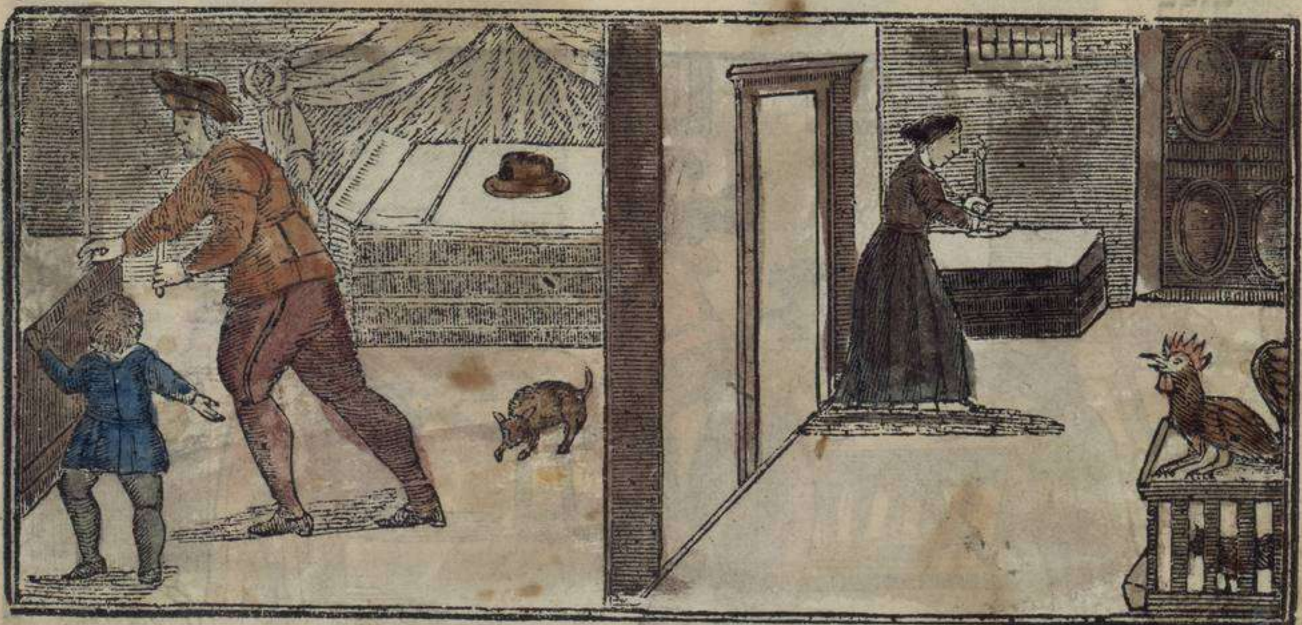
לאש אורדיניש די בוסקאר איל חמץ אי קימאררו

ברוך בינדינו טו יי נואישטרו דיין ריי דיר מונדו קי נוש שנטיפיקו קון שוש אינקומינדאנסאט אי נוש אינקומינדו שיכרי אישנומבראר איל חמץ : ולא אי נו פאלרארה אינטרי לה ברכה אה לה בדיקה אי גוארדארה איל לייכרו קי בושקו אין און ארקה או לו קורני אין ואנו לונאר קי איל ראטון נו פודישטה איניל אי לו באלרארה קון אישטאש פאלאבראש : כל טורו איל לייכדו קי איי אין מי פודיר קי נו לו וידי אי קי נו לו אישנומרי שיאה באלדאדו אי אישטימדו קוטו פולכו די לה טירה : למחר פור לה מאניאנה אין לה אורה קינטה לו קימארה אין פוינרא סיפארה אינפארטי אי אינארה סי סיניזה אי לו באלרארה אי דירה :