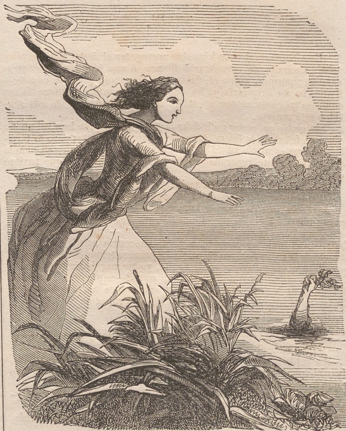
Y sacando un brazo arrojóle las flores azules.—Pág. 7.

Leímos el tal periódico, y entre otras críticas literarias el articulista nos censuraba agriamente:—1.º—Haber pasado el verano en un puerto de mar:—2.º—haber andado con los piés desnudos:—3.º—usar un cinturón rojo en nuestras faenas de marinero.—4.º—llevar los cabellos en desorden:—5.º—guiar por nosotros mismos un barquichuelo pintado de amarillo.