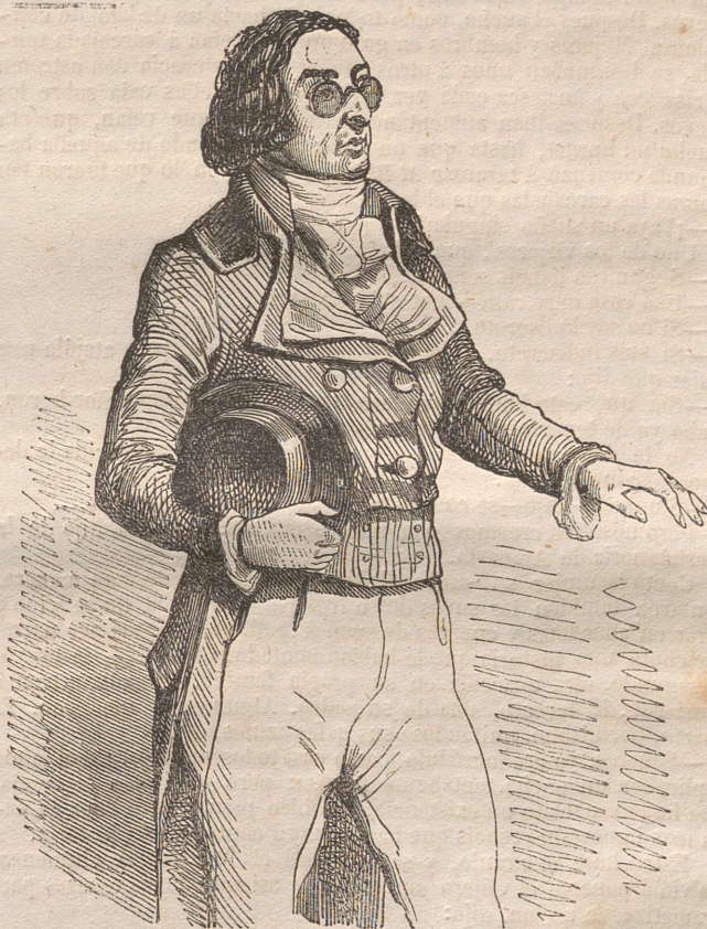
El viajero de las gafas azules.

Censurábamos sobremanera el ilustre anónimo por haber hecho de Mauricio un ser que fluctua siempre en la incertidumbre, como la hoja de contrarios vientos agitada, en vez de hacerle un filósofo. Ciertamente que la tal censura ni debe de tomarse ad pedem literæ , ni es otra cosa que un delicadísimo elogio. Así como jamás se ha criticado á un pintor el que ponga color de encarnado donde no le dá la gana de poner verde, así por este oportuno rodeo nos dá á entender el crítico que hemos hecho un retrato muy parecido. Con efecto, nada mas comun en la sociedad que estos caracteres, que estos hombres que conocen lo verdadero y eligen lo falso, estos hombres que despilfarran su talento y su energia en proyectos que nunca se atreven á realizar. ¿Quién sabe si el ilustre anónimo, si el mismo M. A. H. no es uno de estos tipos? ¿Quién sabe si al comenzar su carrera casi literaria de crítico, no se dijo para su capote?