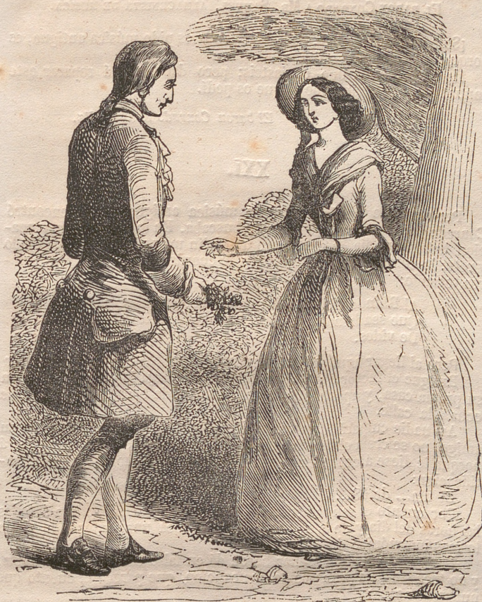
Tenia yo en la mano el ramillete.—Pag. 3.

Conocieron los enamorados que era preciso separarse, y queriendo María conservar un recuerdo de esta noche divina, señaló con la mano á Henreich las florecillas azules de la orilla del río. Comprendióla su amado, y cogió las flores, pero los piés le faltaron, y se hundió en el agua. Dos veces las ondas se entreabrieron, y él subió á flor, luchando desfallecido con los ojos fuera de las órbitas; pero otras dos veces el río volvió á guardar su presa.