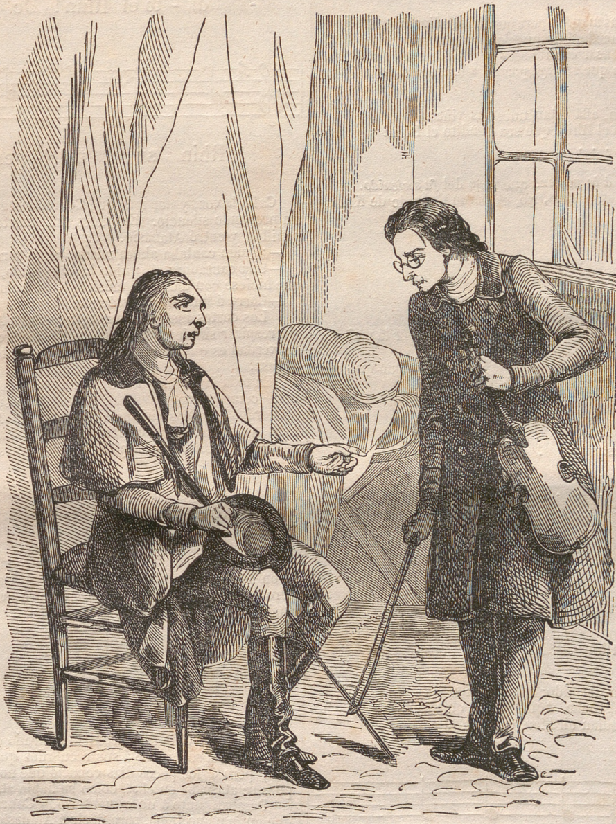
Caballero, le dijo Conrado, hacedme el gusto de cantar la copla en cuestión.—Pág. 16.

—Tienes razón, voy á hacer testamento. Vete.