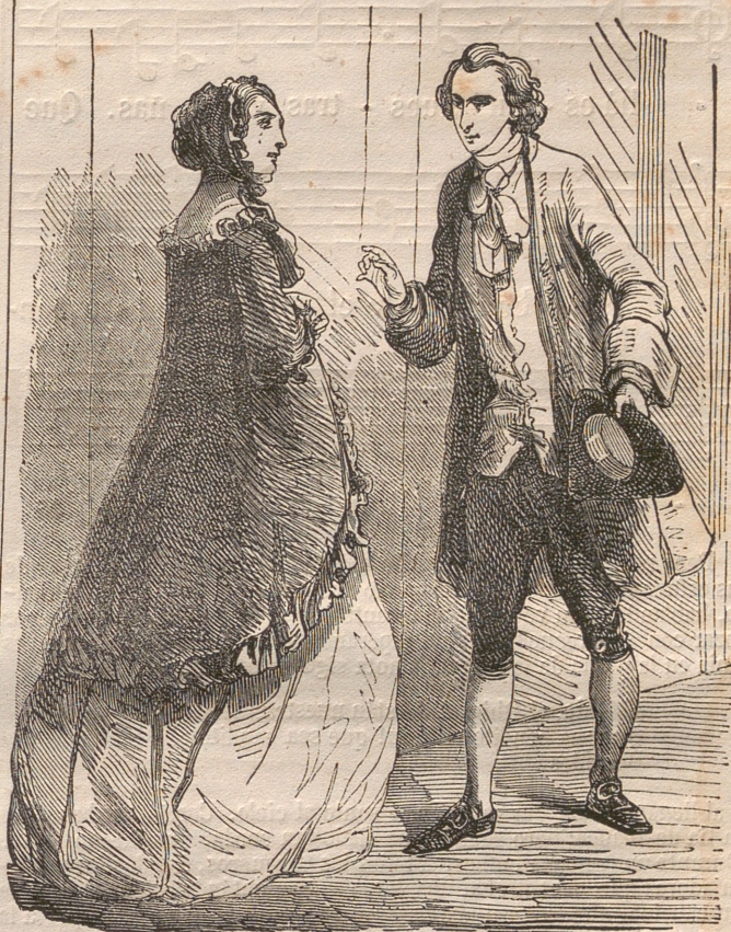
¿Por qué no nos abrazamos?—Pág. 4.

En el gabinete encerró Krumpholtz este recuerdo; pero como era demasiado vivo, como antes de llegar á él no pasaba por otras manos para desvirtuarse, al cabo de algun tiempo le hacia el mismo efecto que una taza de porcelana ú otro mueble cualquiera de uso diario. La desdicha de Conrado llegó á su colmo.