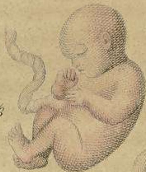
Feto de 3 meses.