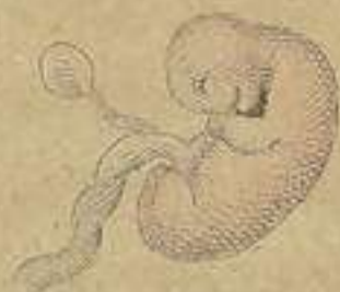
Feto de 1 mes.