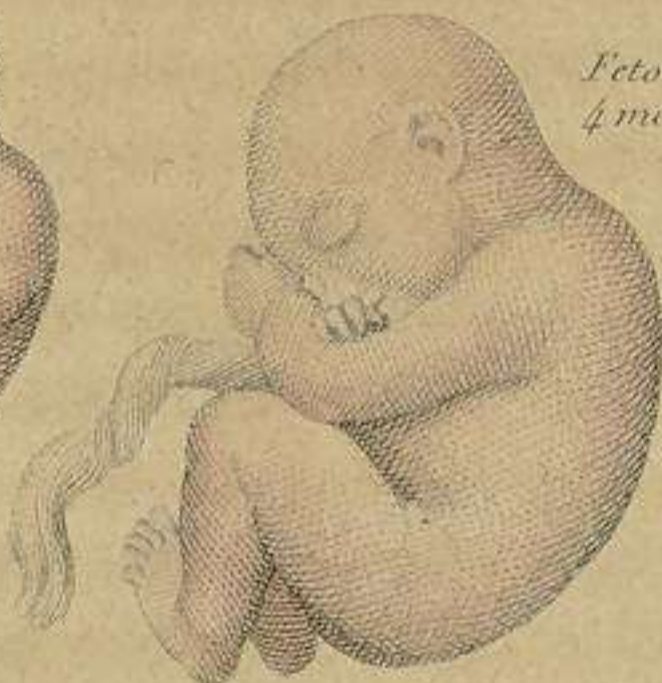
Feto de 4 meses.