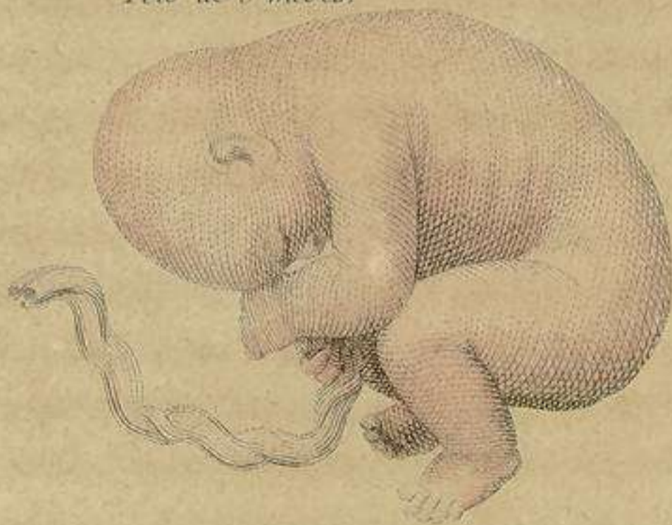
Feto de 5 meses.