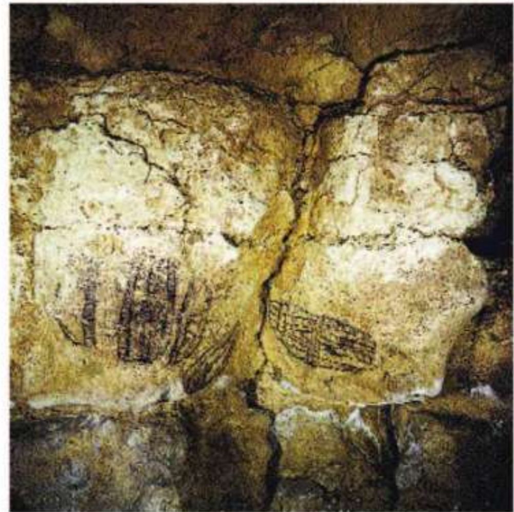
Fotografía de algunos dibujos de la cueva de Altamira reproducidos por Sanz de Sautuola en lámina 4. a