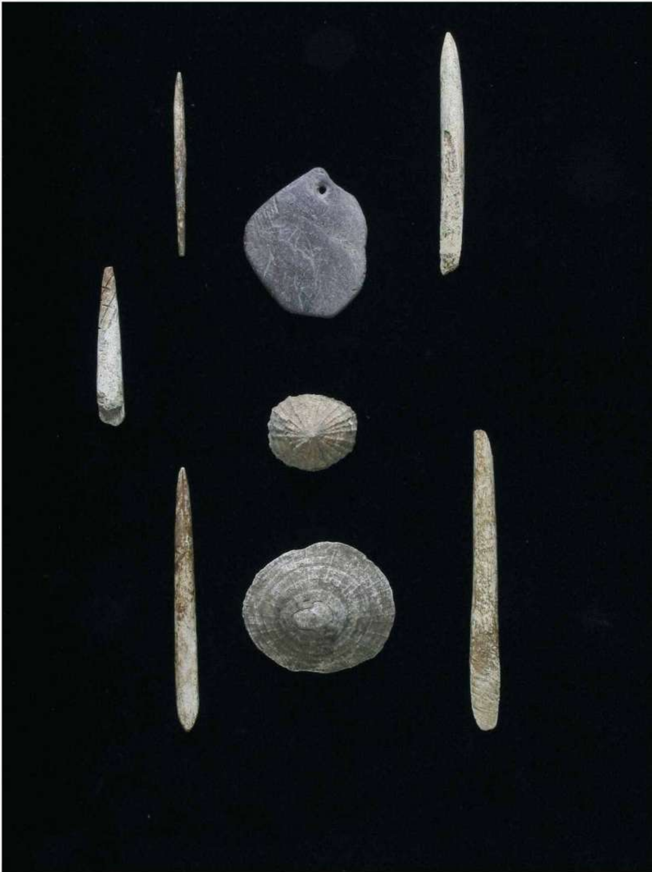
Fotografía de objetos hallados en Altamira y publicados por Sanz de Sautuola en lámina 2. a