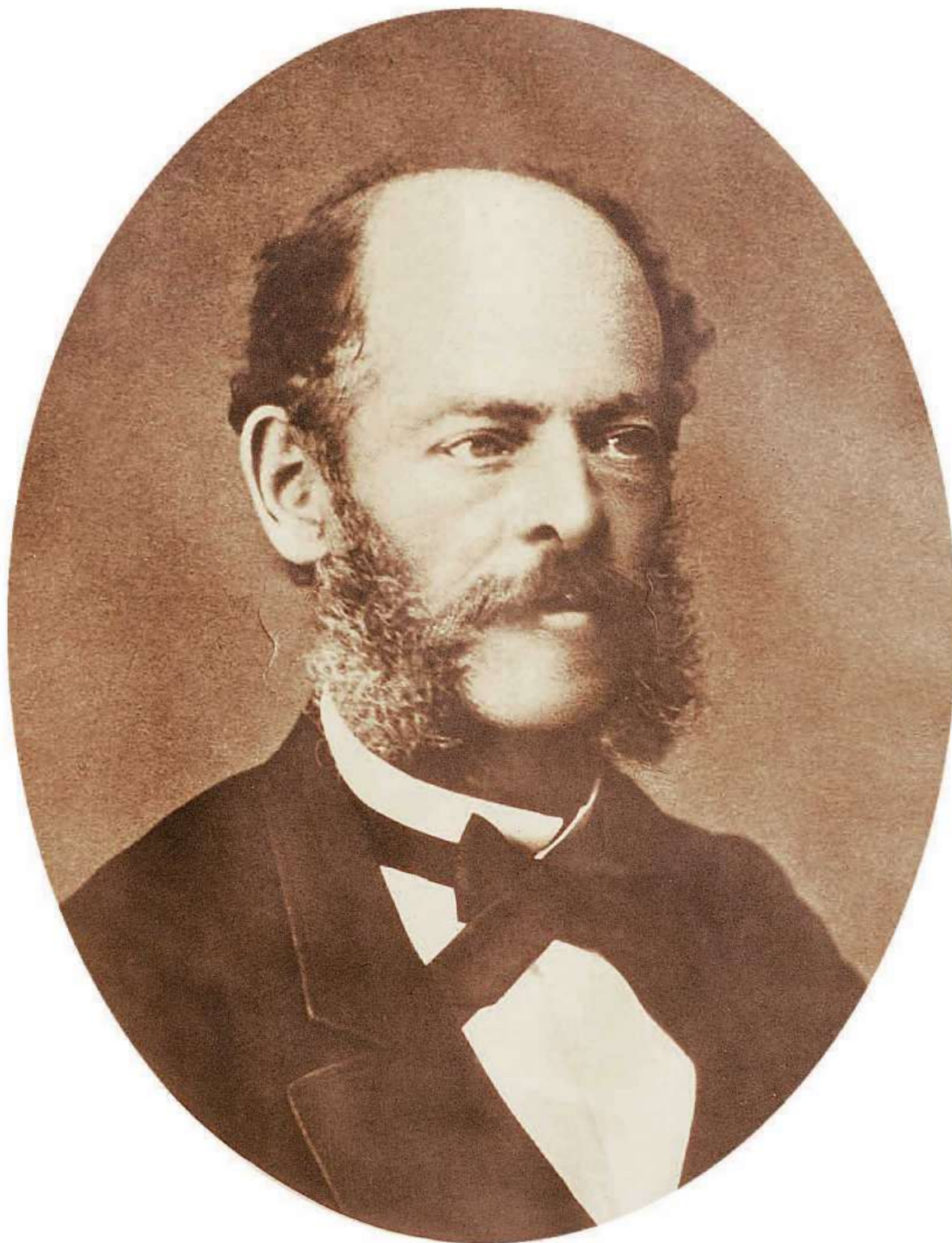
Marcelino Sanz de Sautuola (1831-1888)