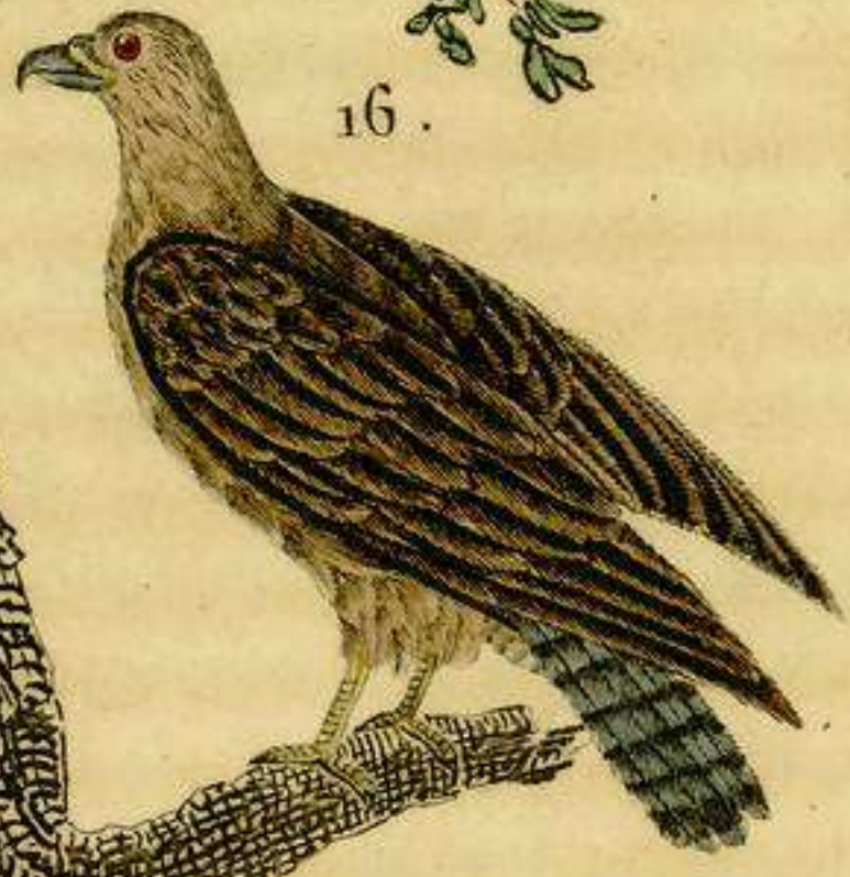
15 El Milano. 16 El Alfaneque ó Ave zorra.