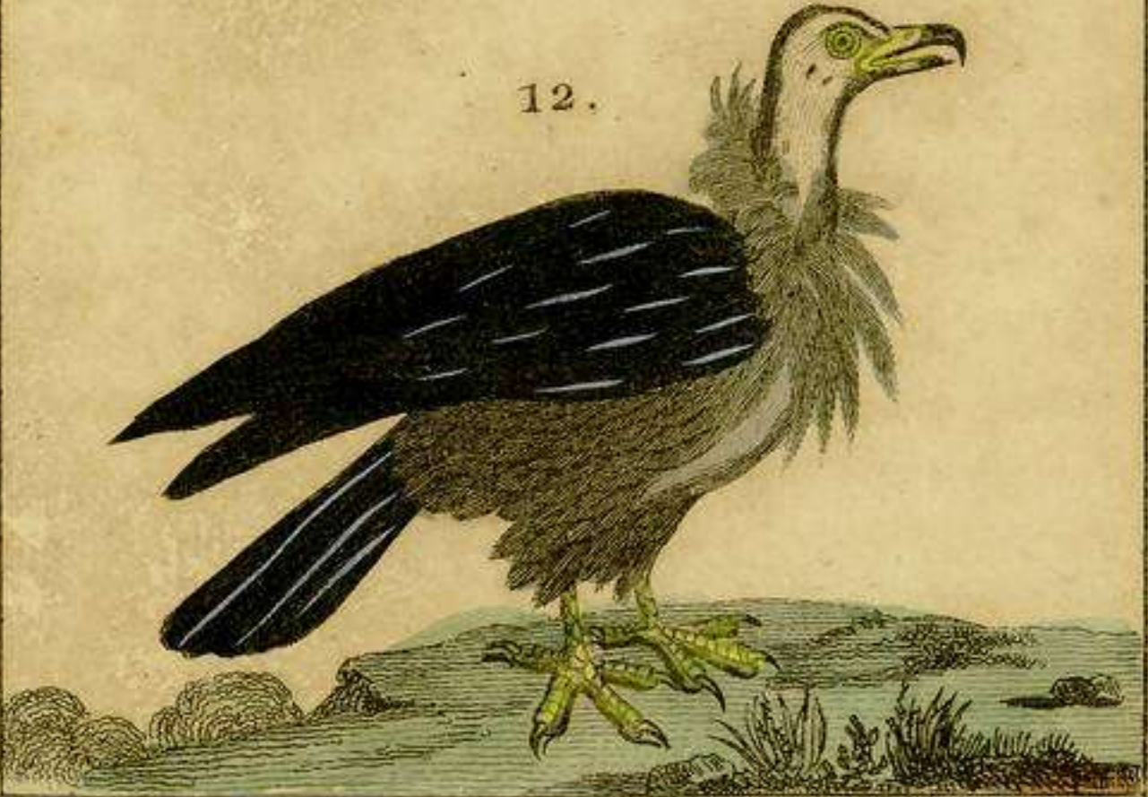
11 El Buitre con penacho. 12 El Buitre pequeño.