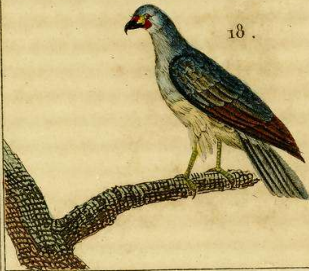
17 El Borni. 18 El Ave San Martin.