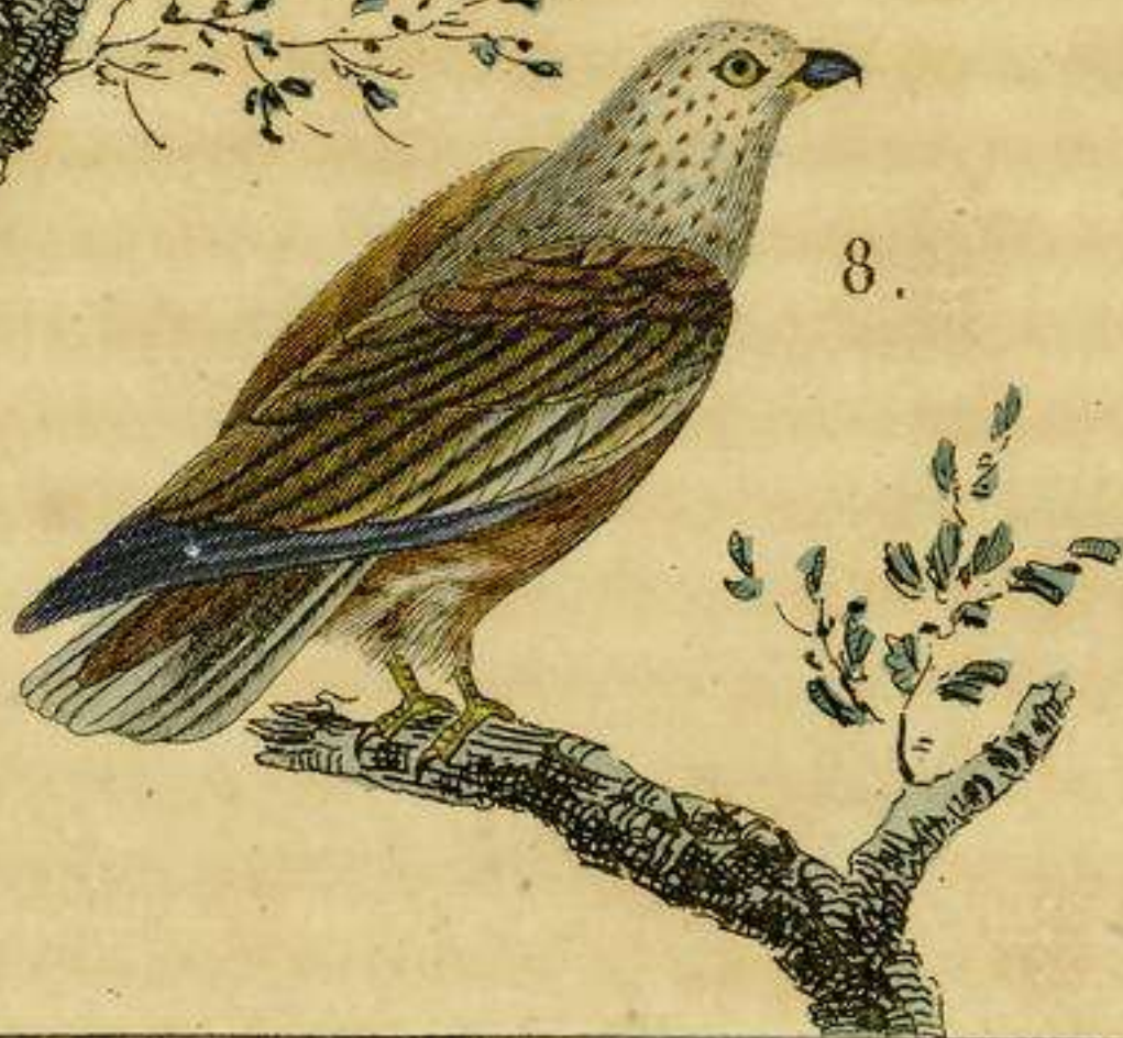
7. La Atakorma 8. La Arpella.