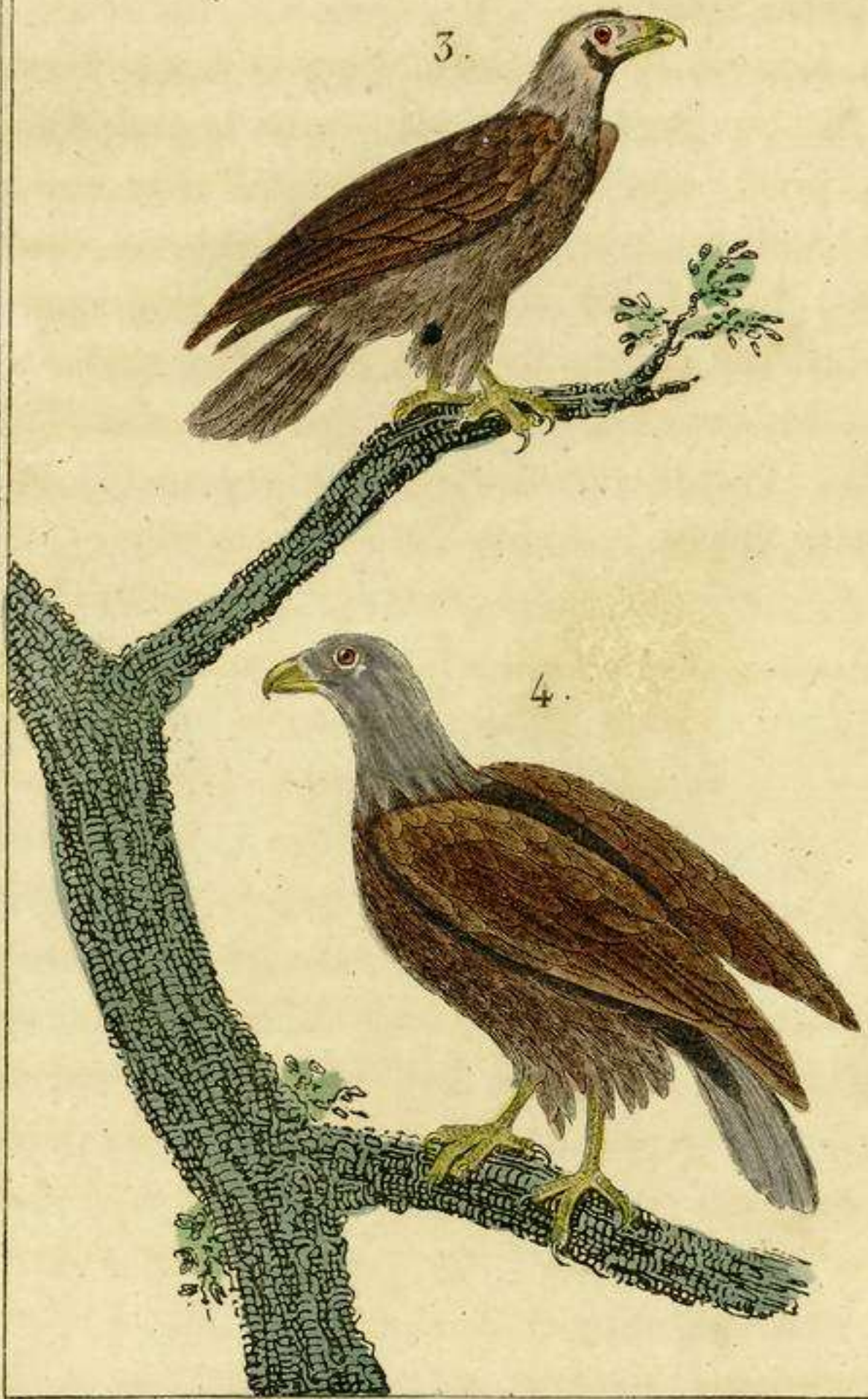
3 Aguila pequeña 4 El Pigargo