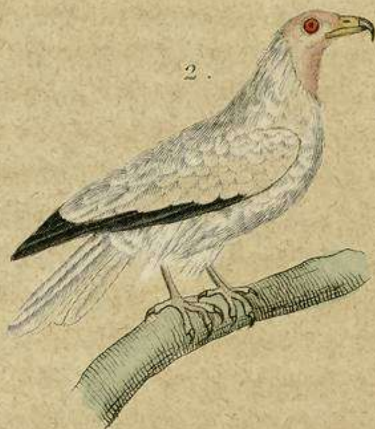
1. Buitre de Malta. 2. Saere de Egipto.