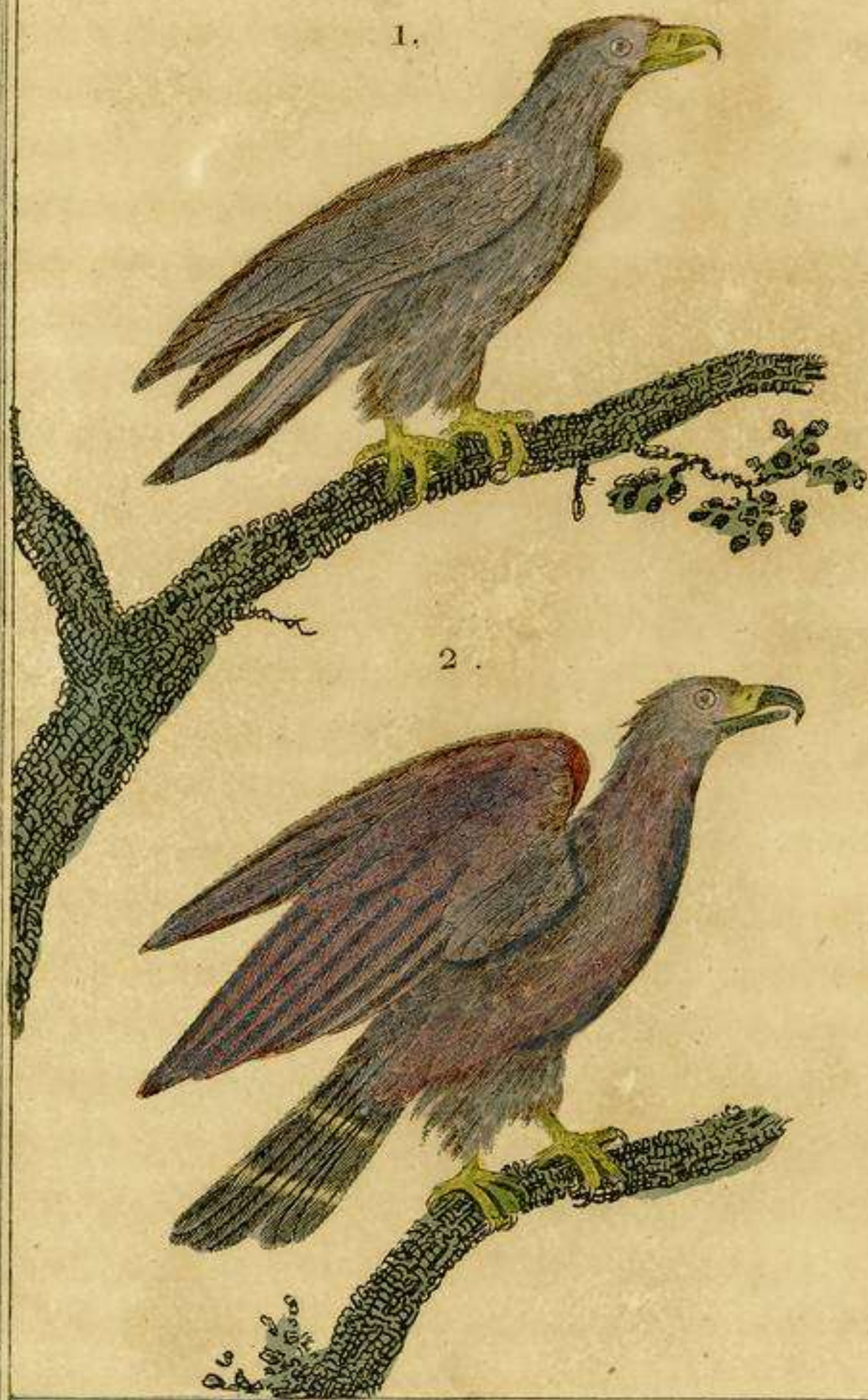
1 Aquila comun 2 Aquila real