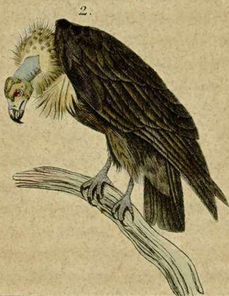
1. Aguila pequeña de America. 2. Buitre pardo.