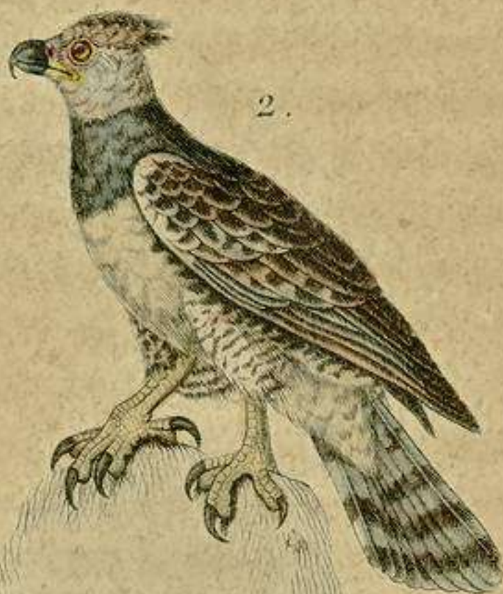
1. Aguila de las Indias Orientales. 2. Aguila del Orinoco.