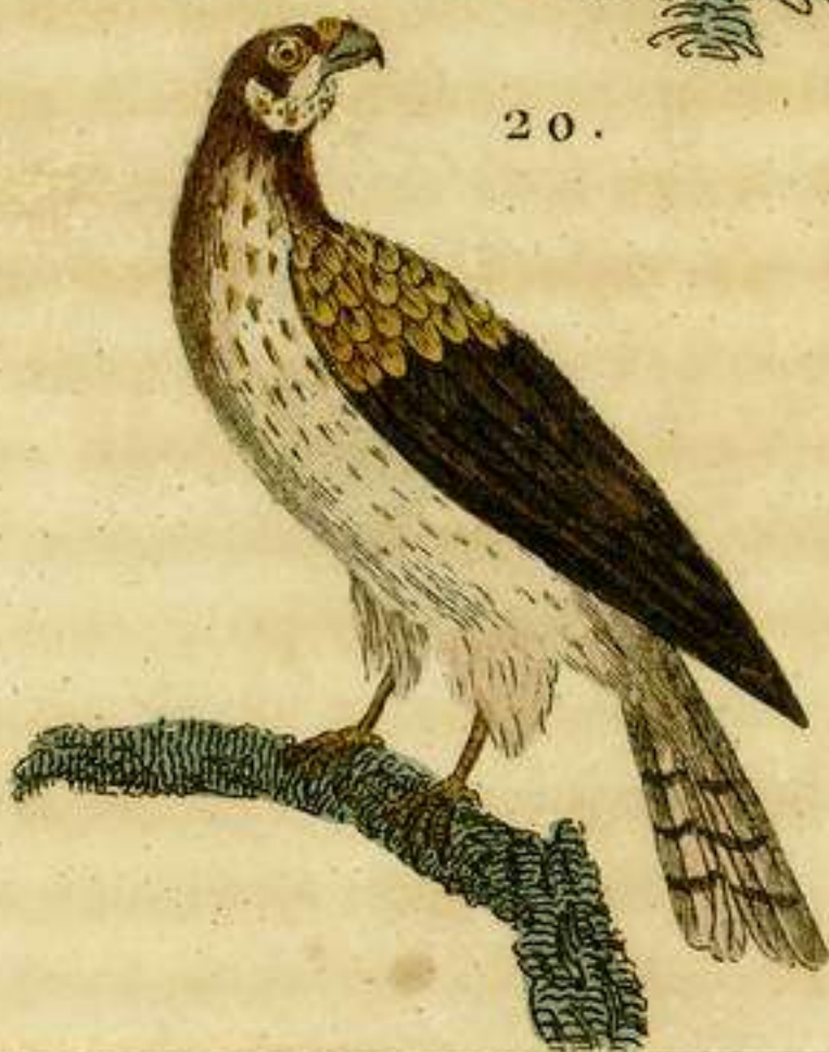
19 El Pigargo xonxo. 20 El Esmaril.