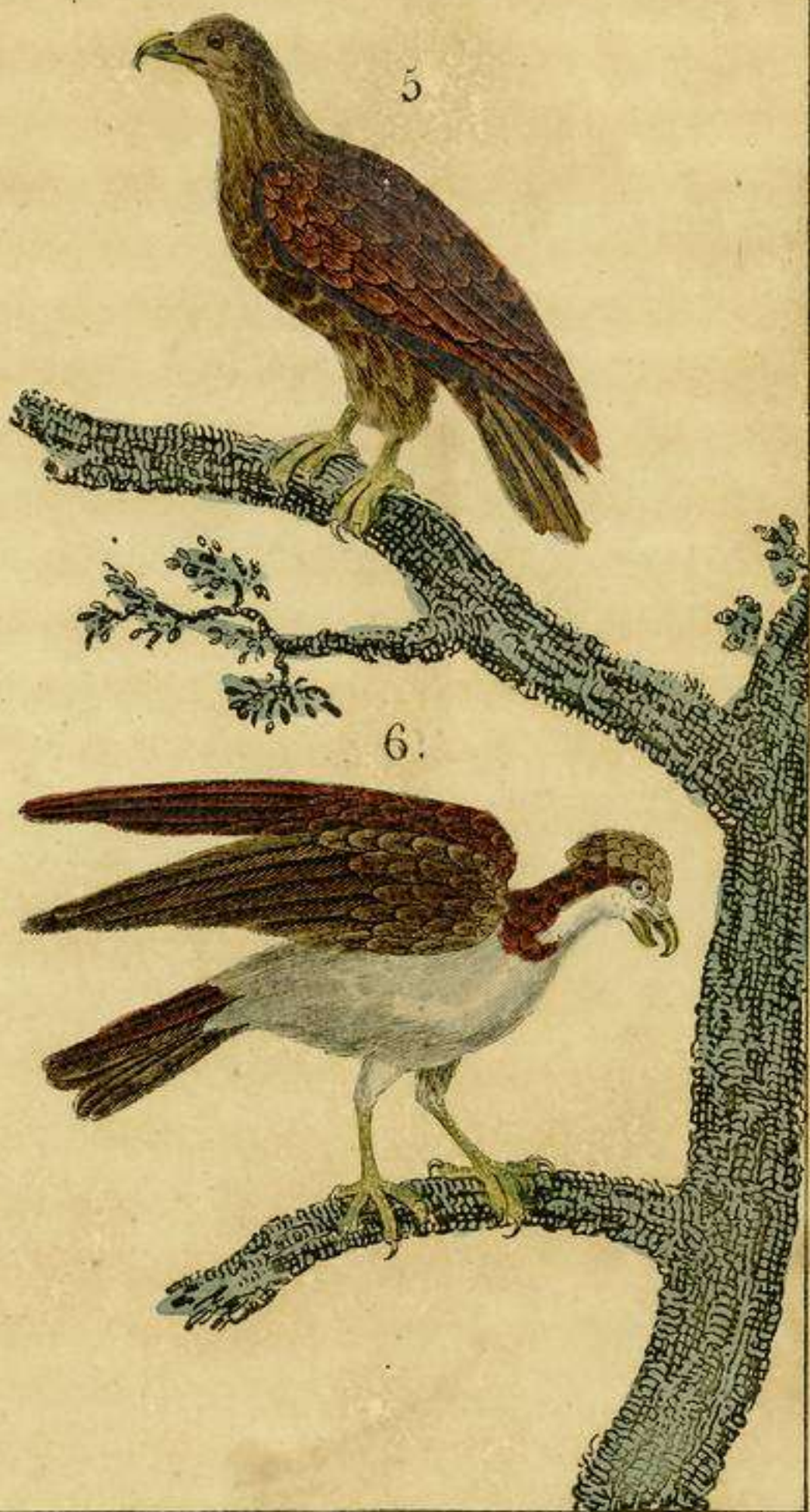
5 El Sangual 6 El Hualito.