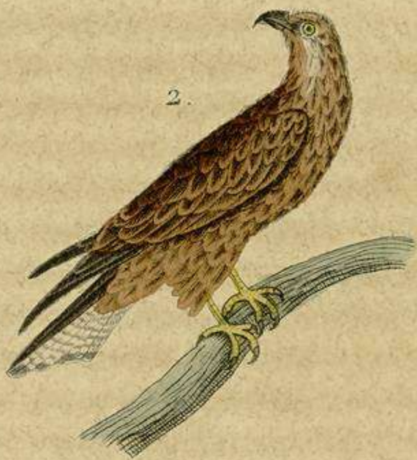
1. El Corder. 2. Milano negro.