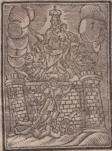
LA VIRGEN SANTISSIMA de el PORTILLO.