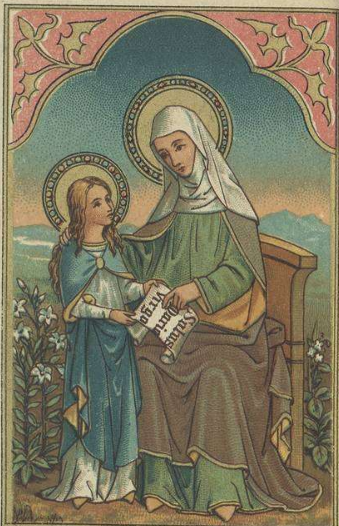
Edmucacion de la S.S. Virgen Maria