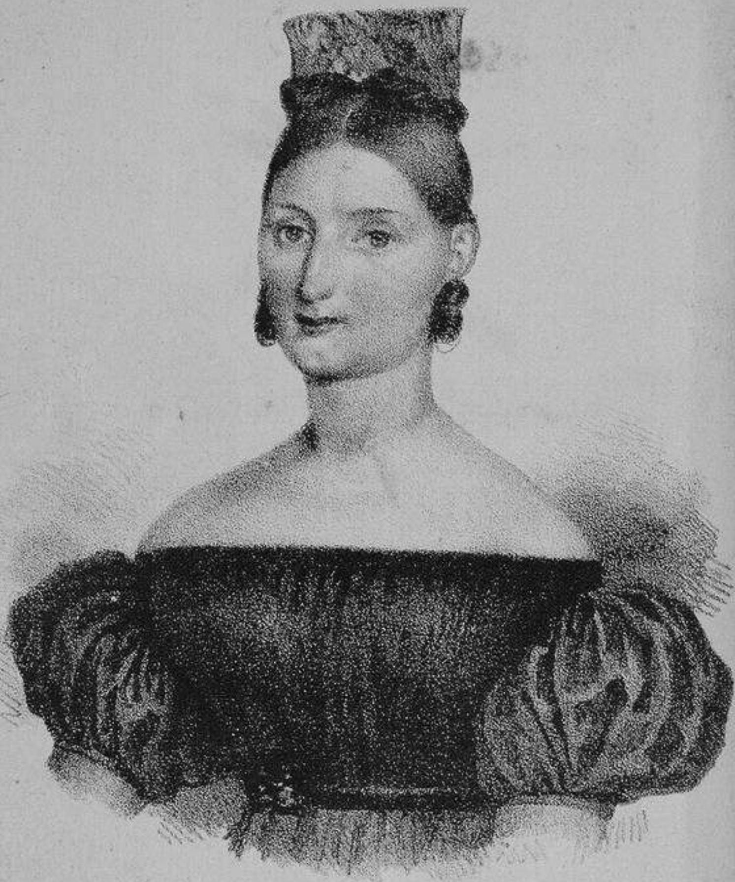
D. a MARIANA PINEDA.