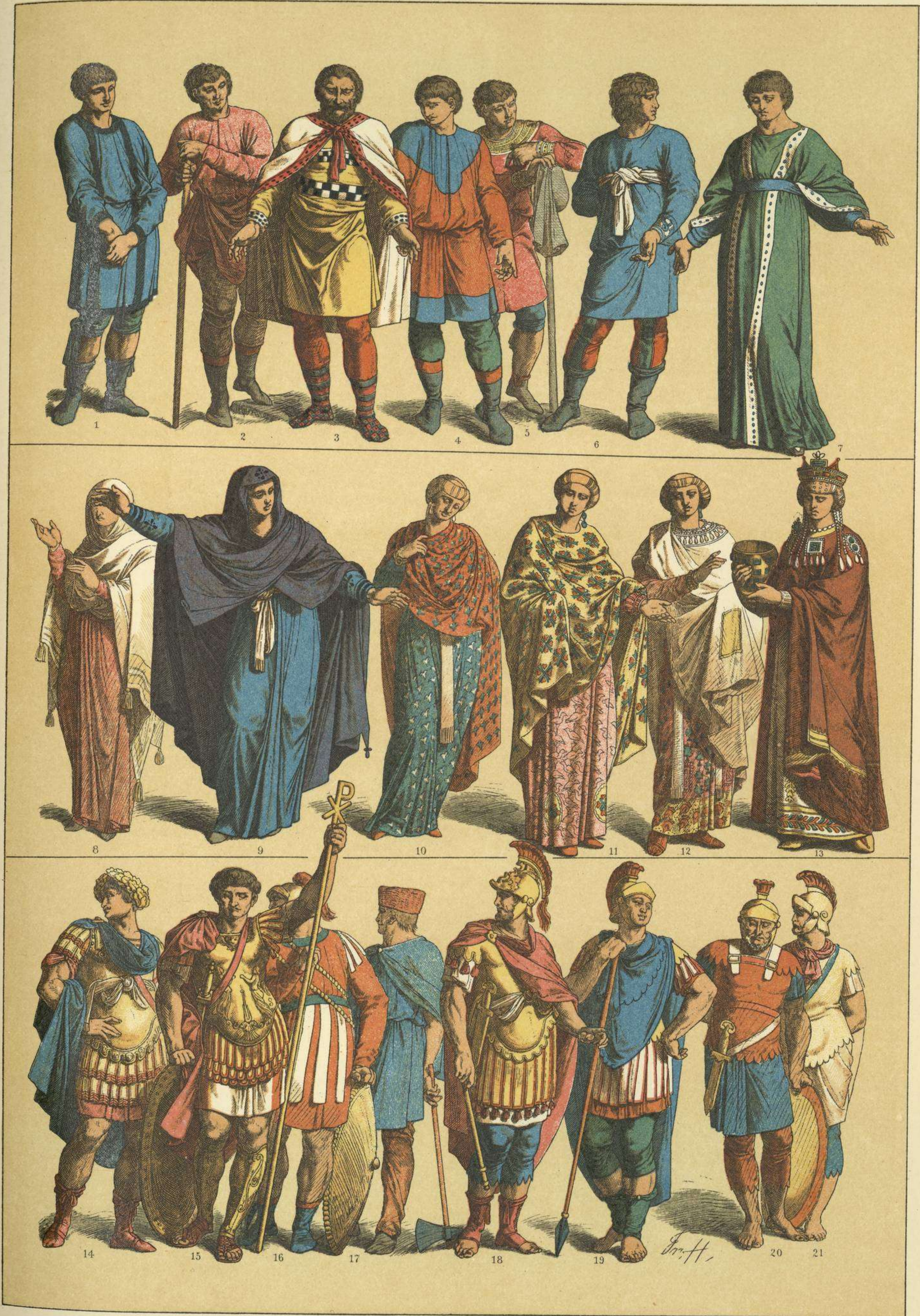
EDAD MEDIA. - TRAJES Y ARMAS DE LOS BIZANTINOS DESDE EL AÑO 400 AL 600