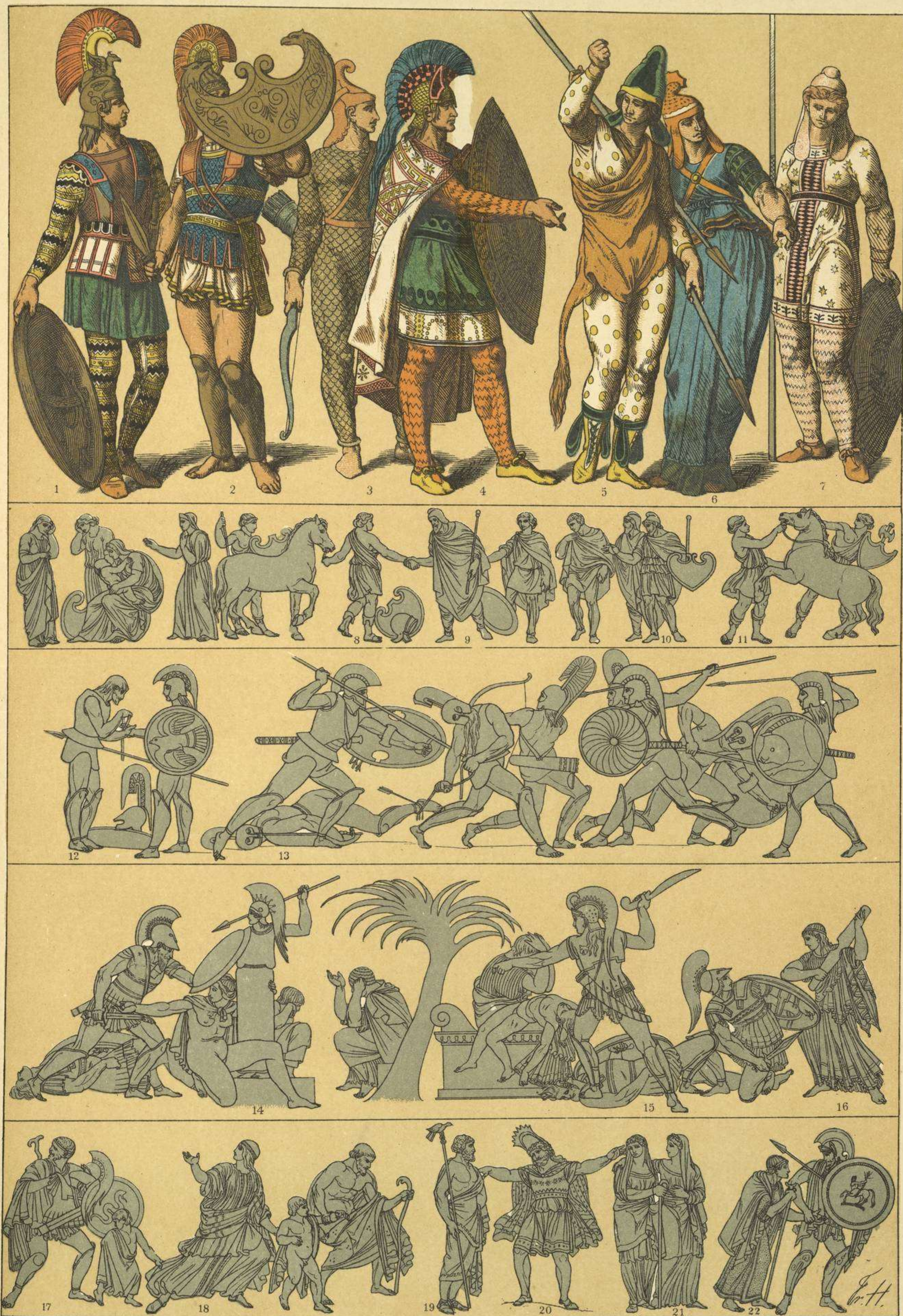
EDAD ANTIGUA.—TRAJES Y ARMAS DE LOS TROYANOS Y DE LAS AMAZONAS