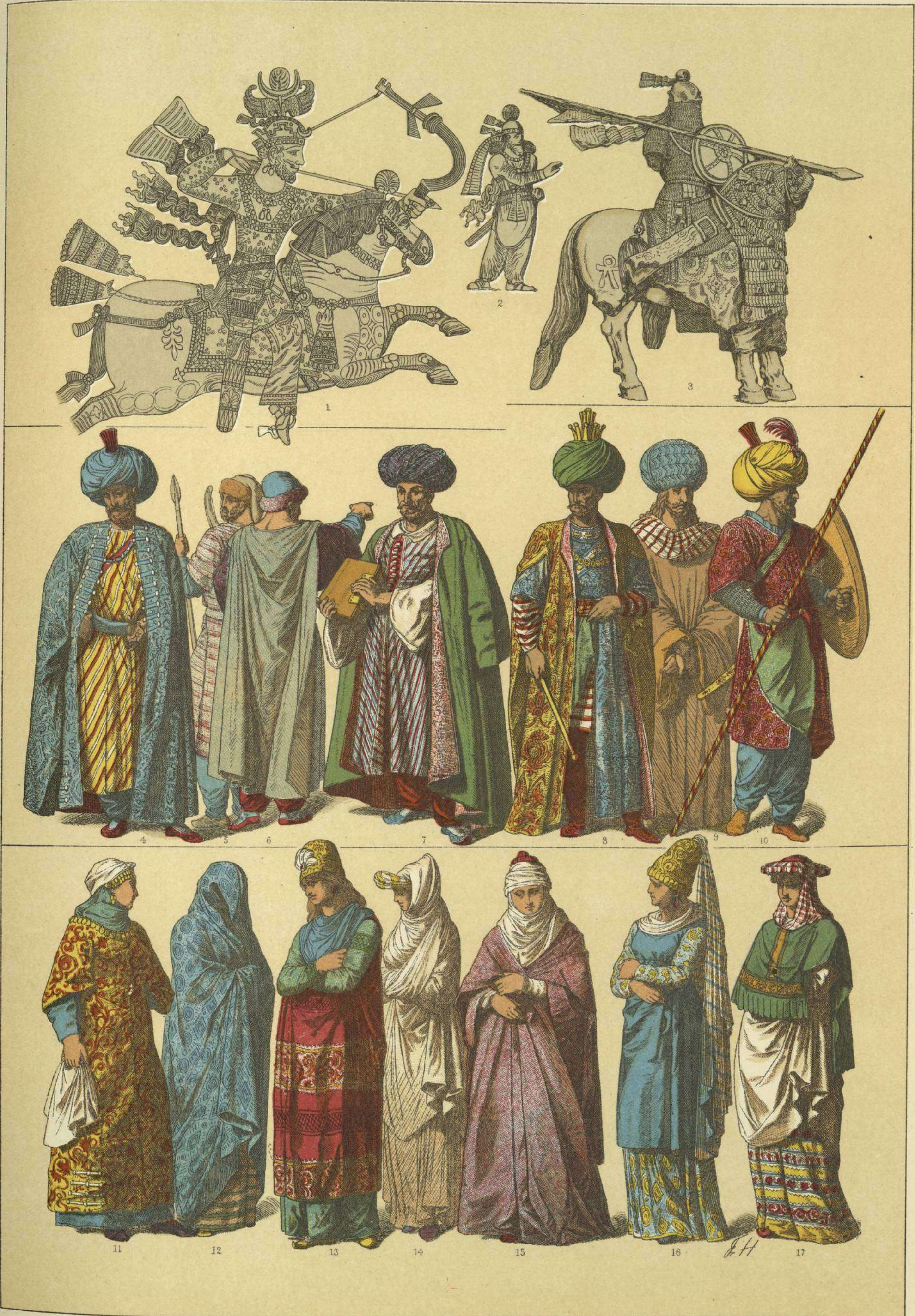
EDADES MEDIA Y MODERNA.-TRAJES Y ARMAS DE LOS PERSAS DE LOS SIGLOS XVI Y XVII