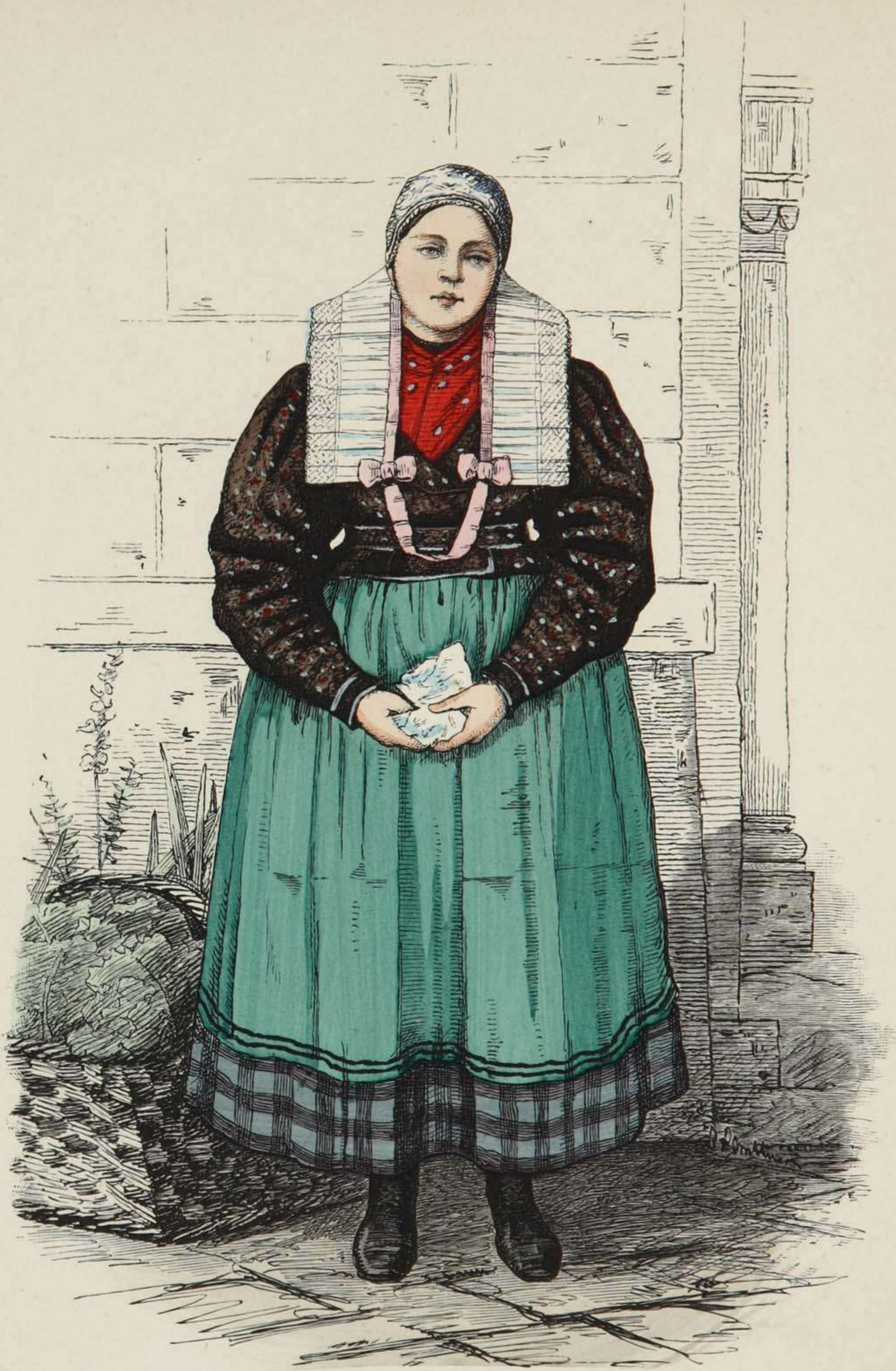
Bauernmädchen aus Neuland bei Neisse, Schlesien.