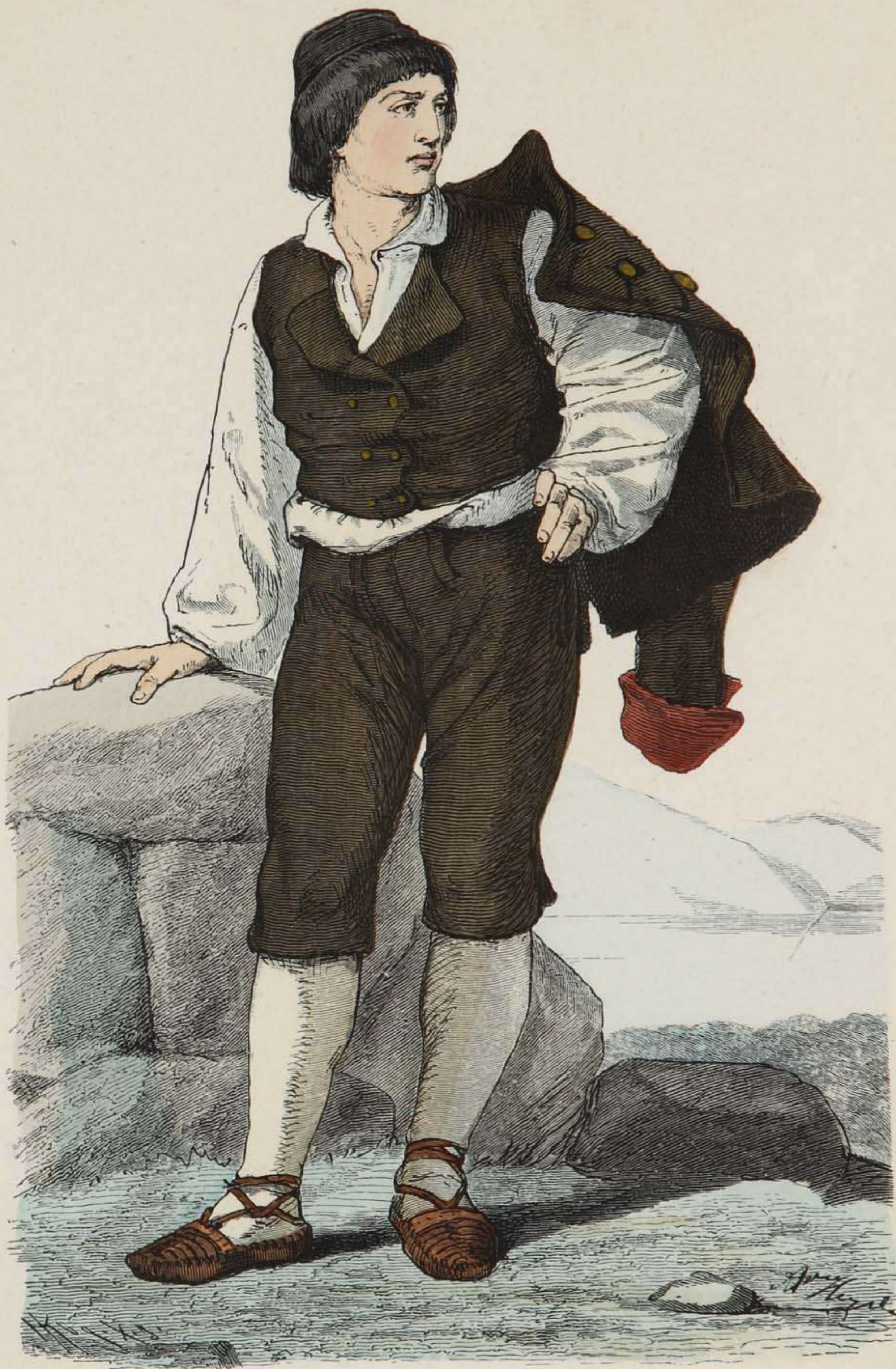
Bauer aus Albona in Istrien.