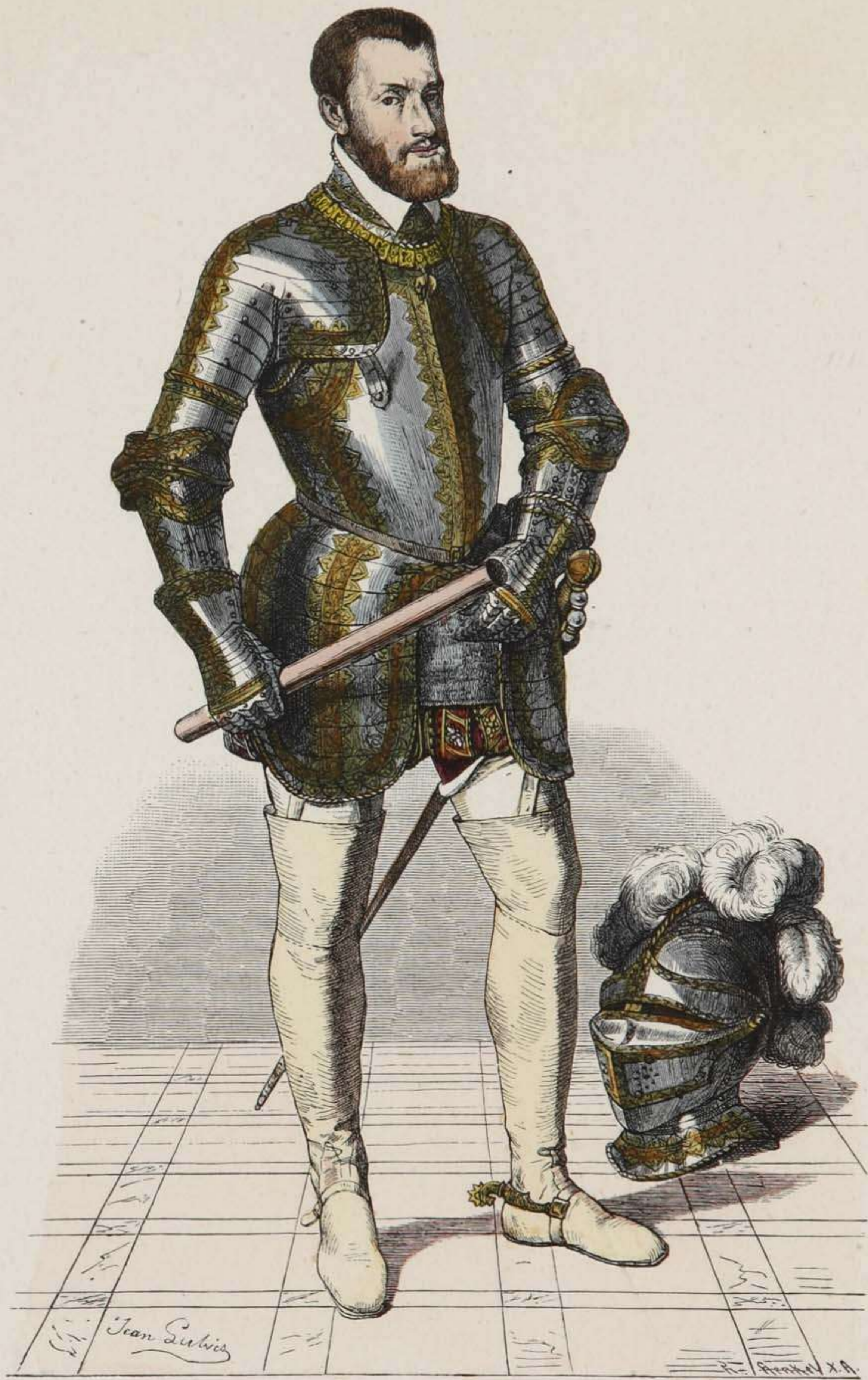
Karl V., deutscher Kaiser.