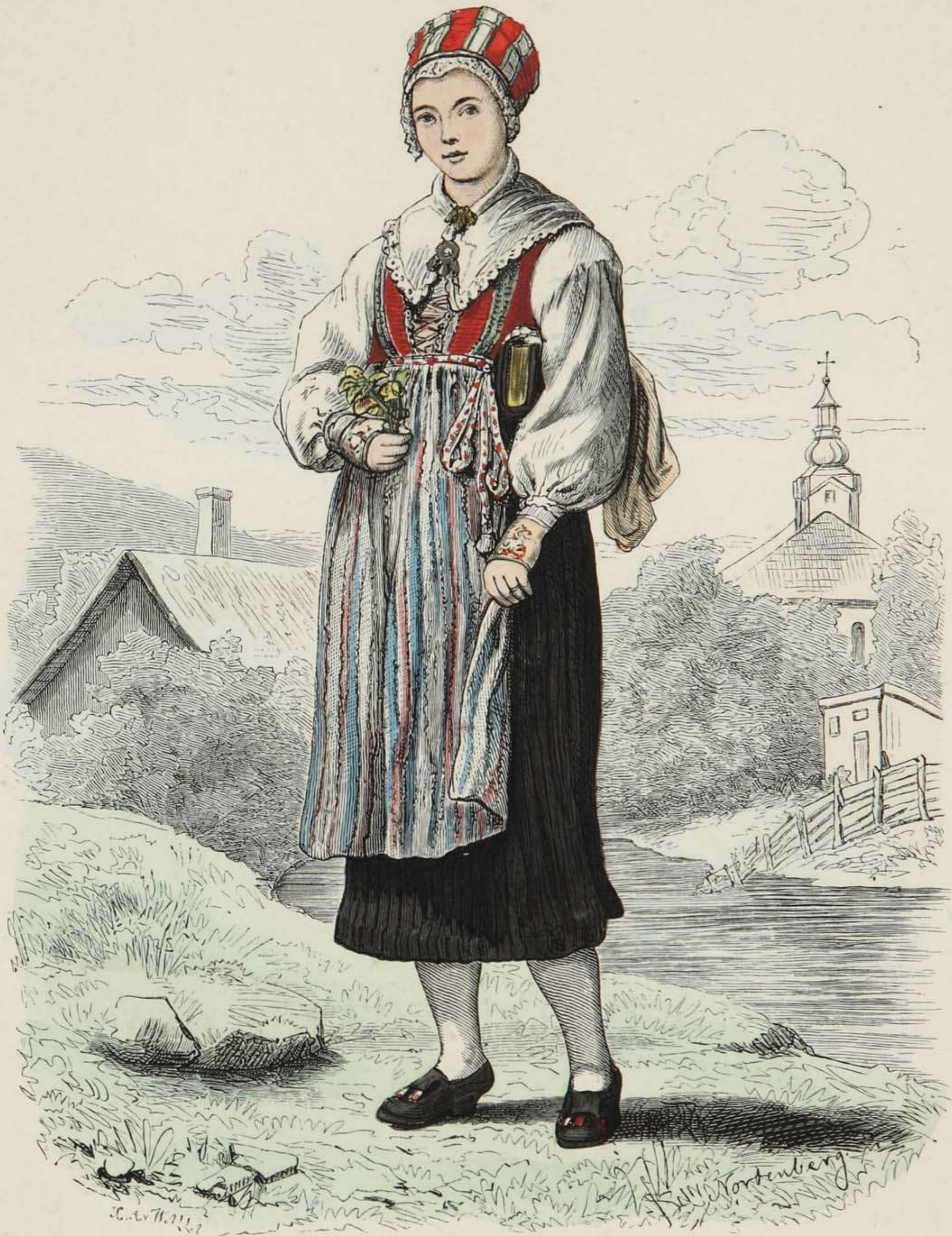
Mädchen aus Leksand in Dalekarlien, Schweden.