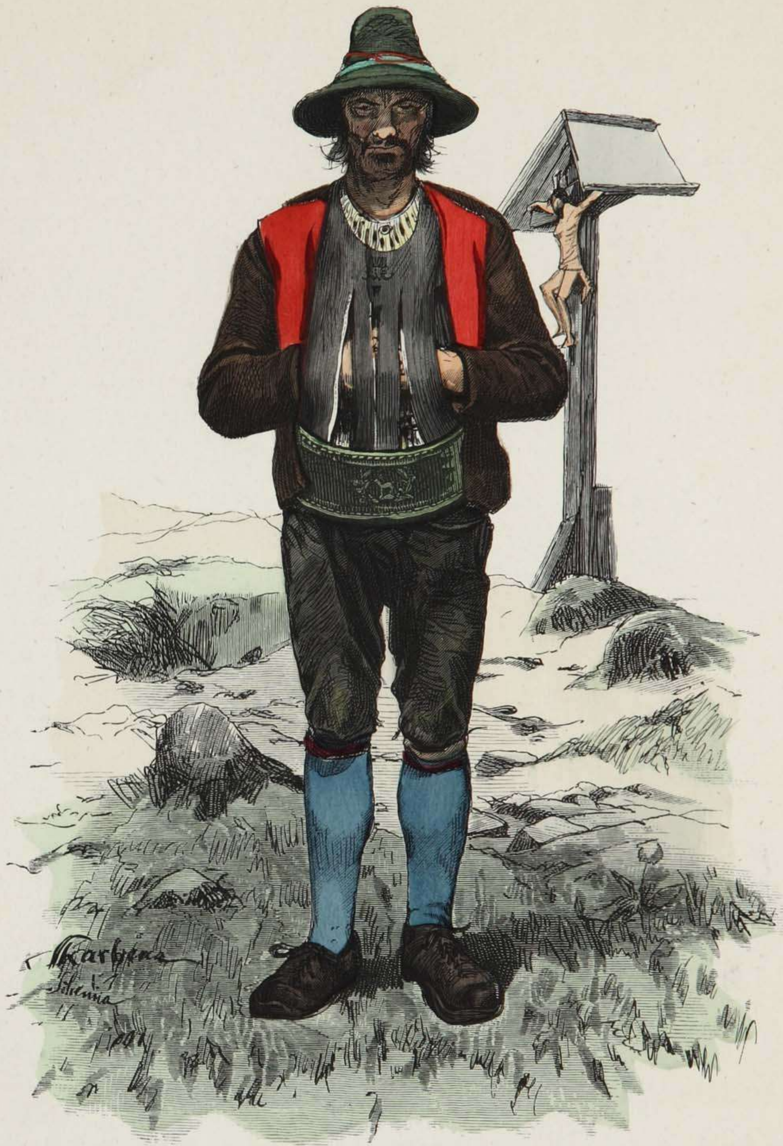
Bauer aus Schönna bei Meran, Südtirol.