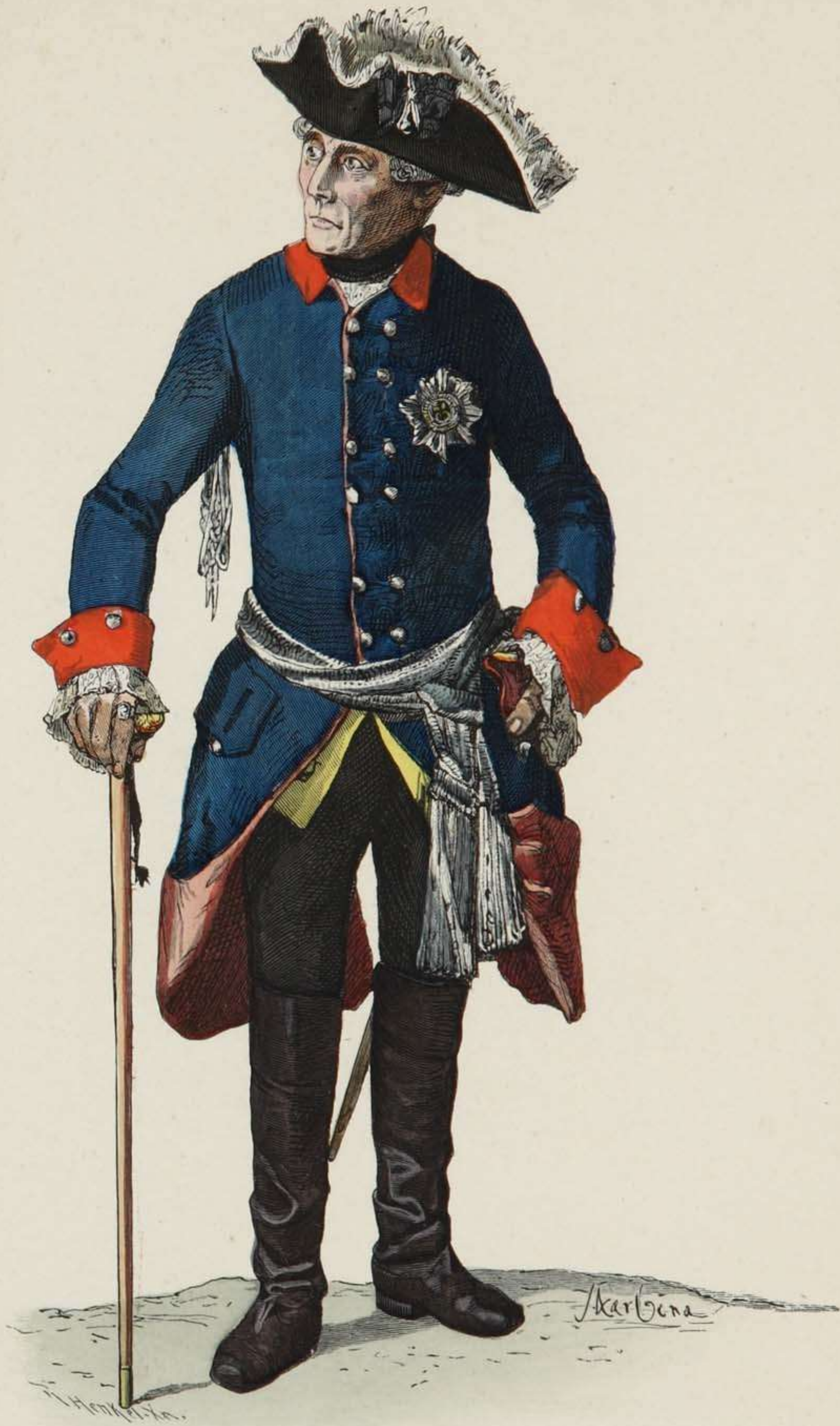
Friedrich der Grosse in Uniform (Interimsrock der Potsdamer Garde). Um 1780.