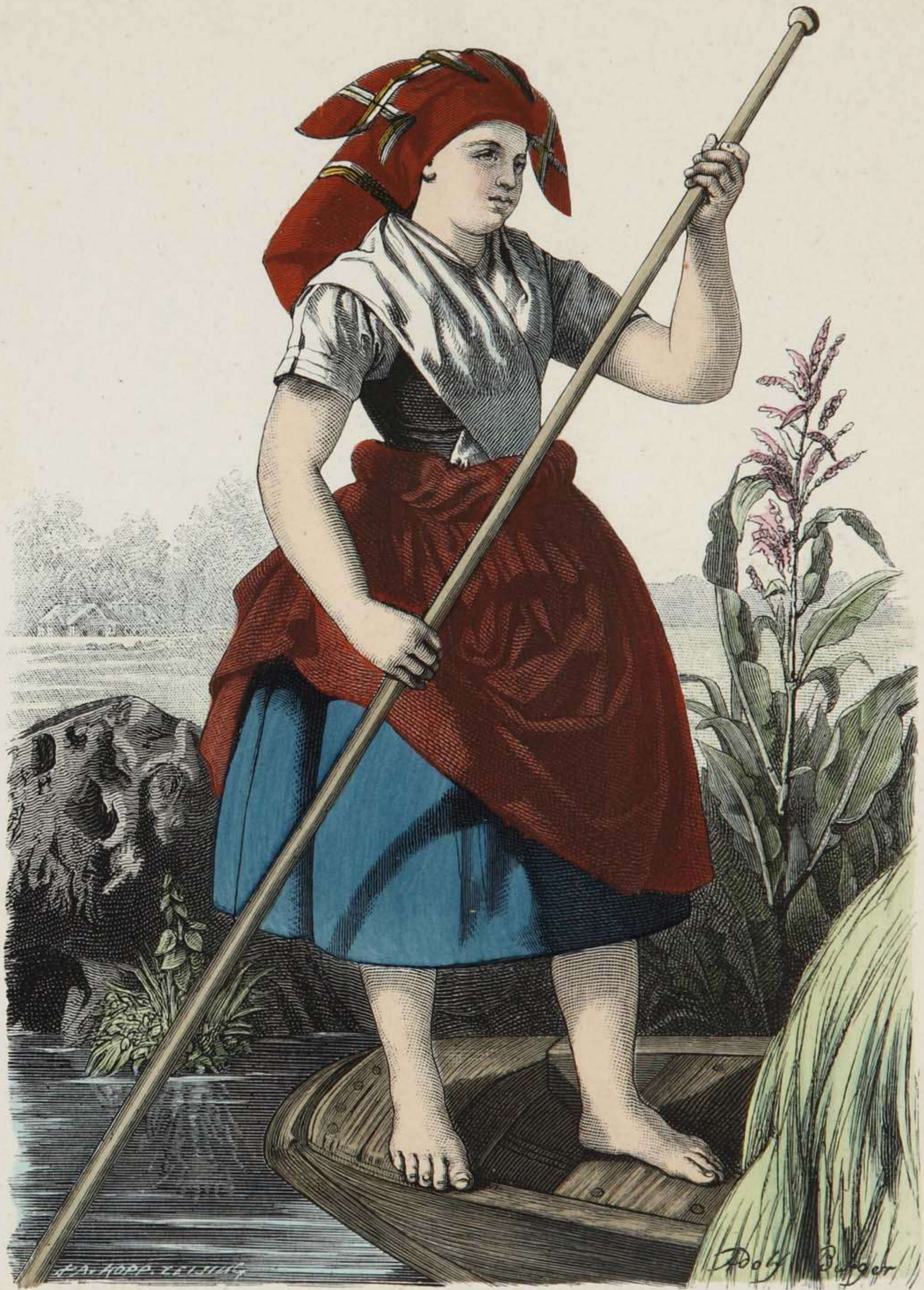
Wendisches Bauernmädchen (Arbeitstracht) aus dem Spreewalde.