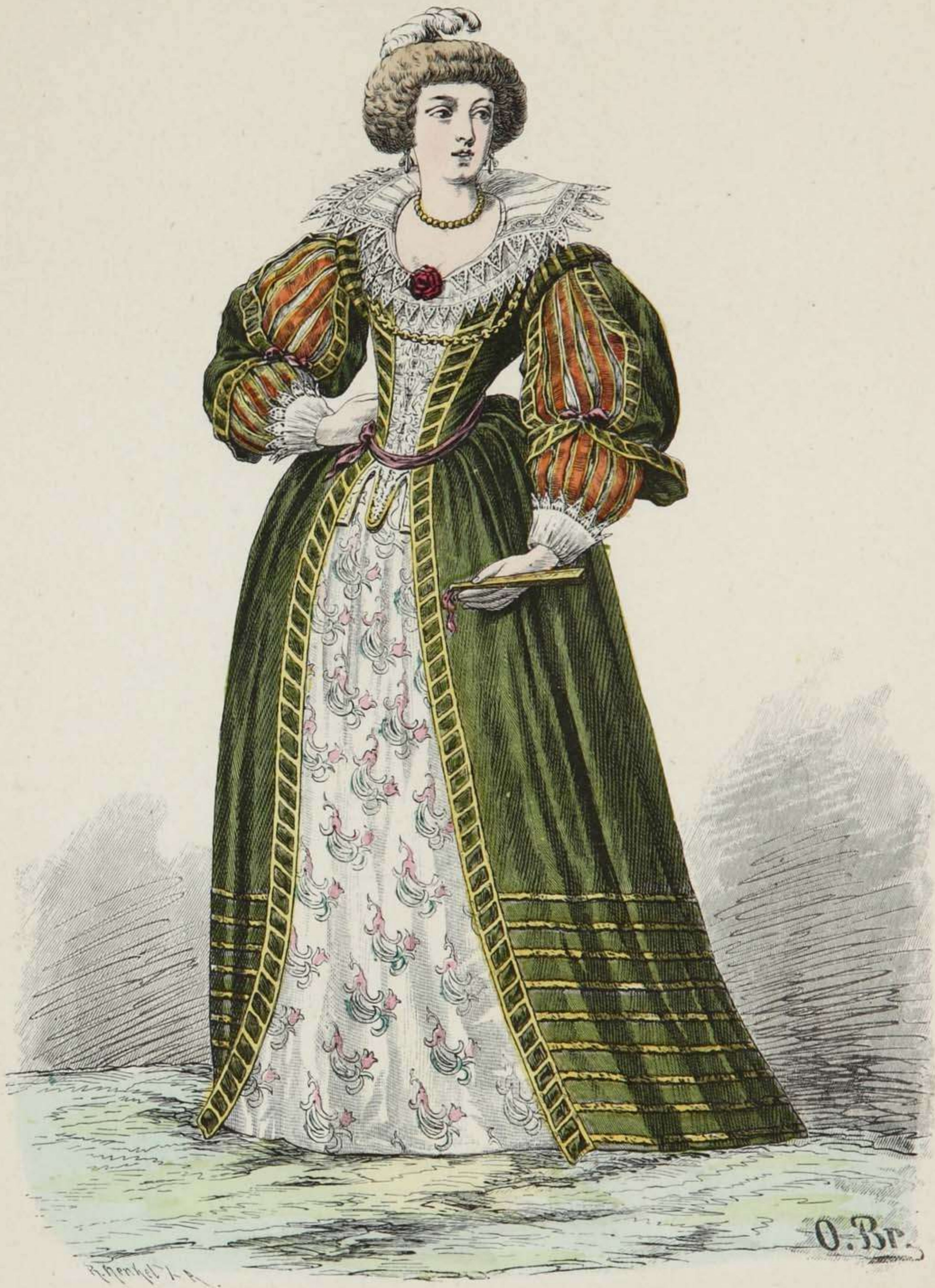
Französische Edeldame. Mitte des XVII. Jahrhunderts.