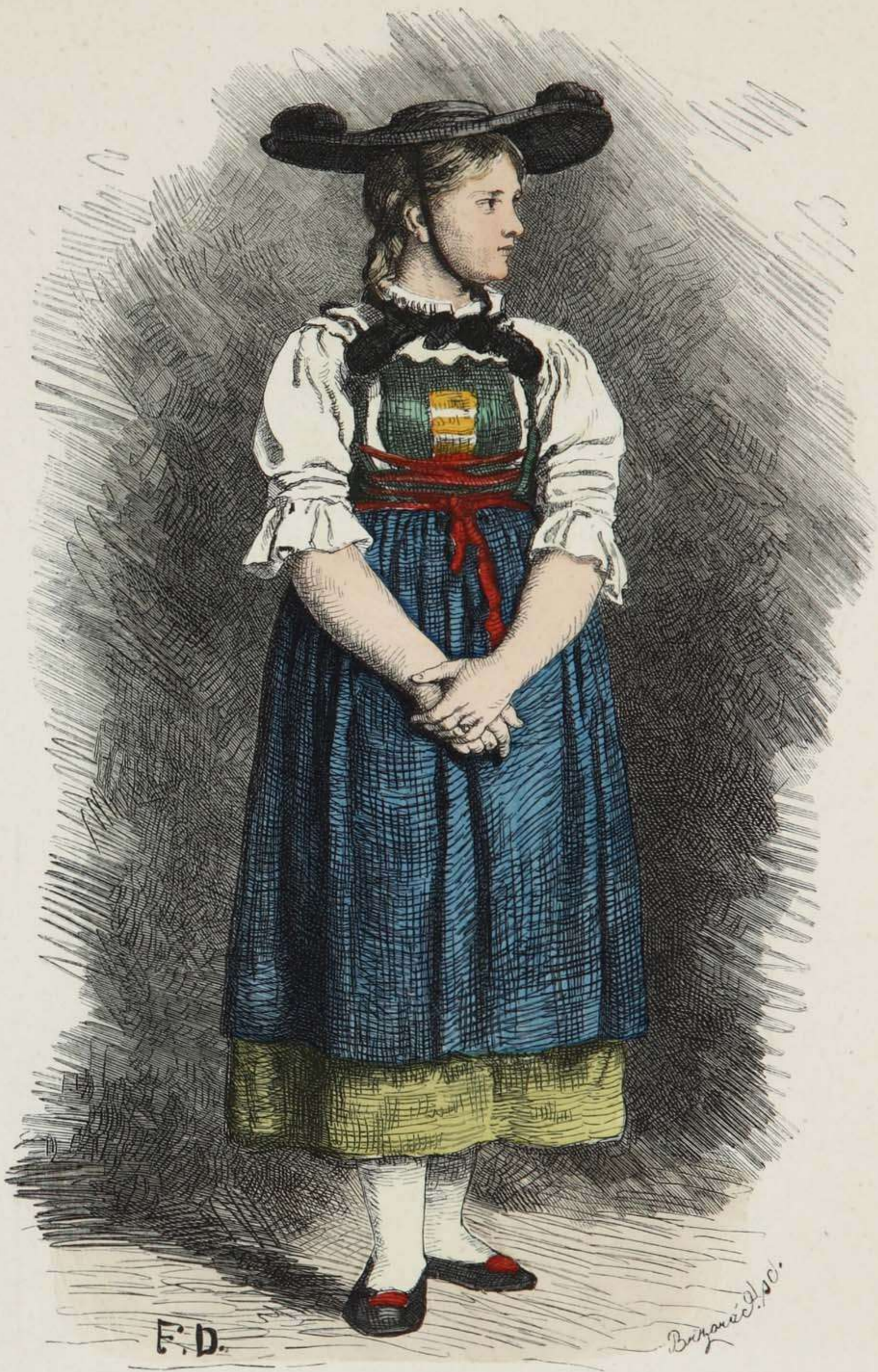
Mädchen aus dem Pusterthale, Tirol.