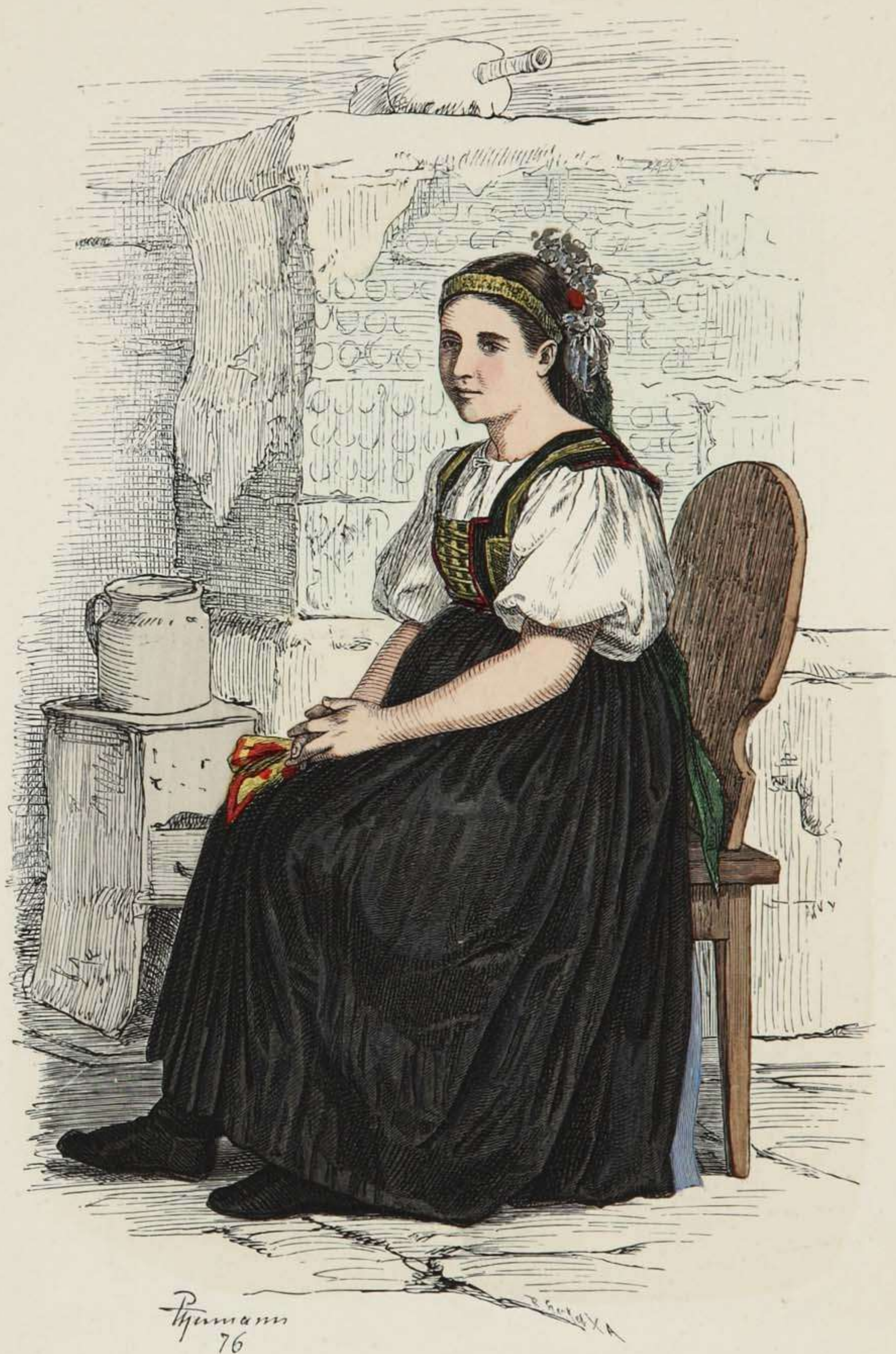
Slovakin aus der Gegend von Kaschau.