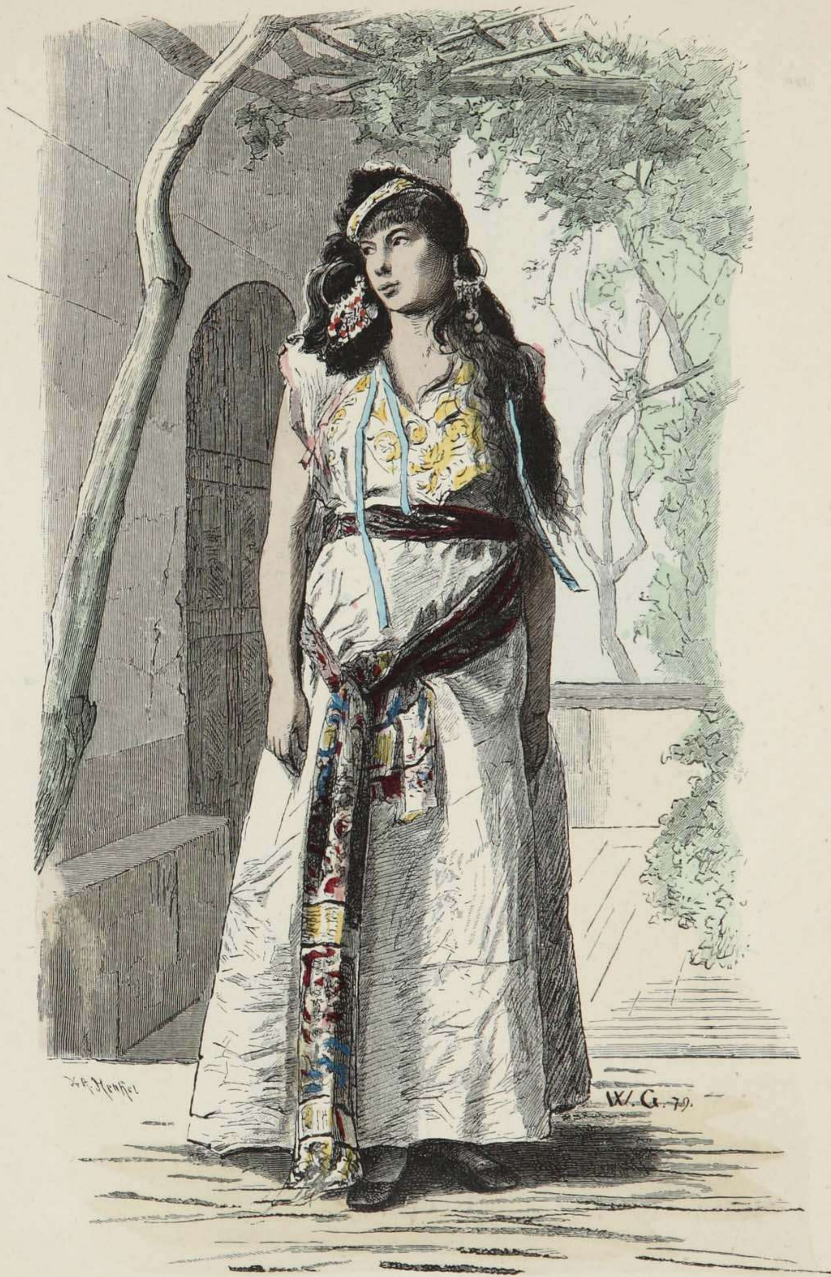
Jüdische Jungfrau aus Marokko.