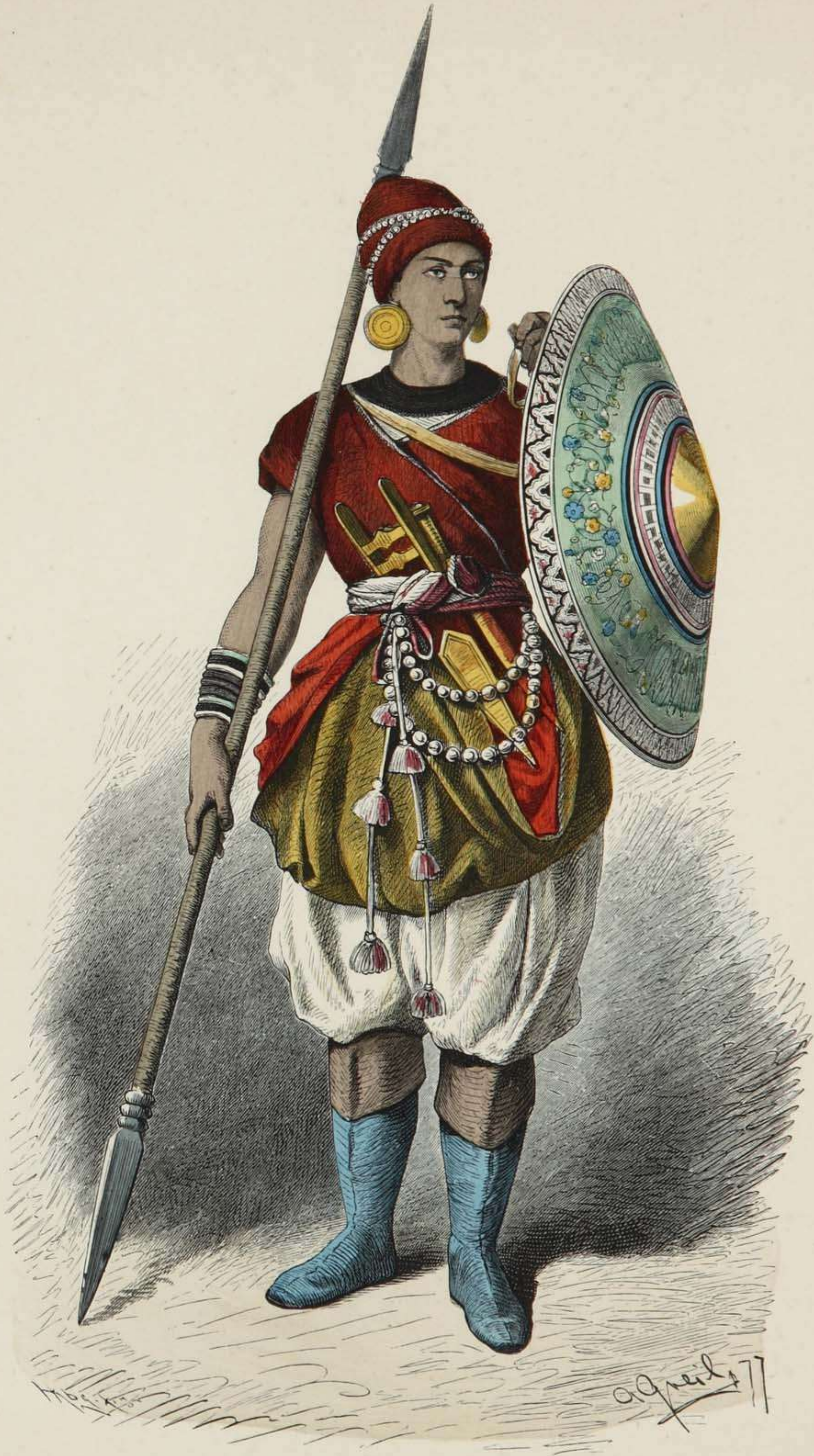
Indischer Lanzenträger. XV. Jahrhundert.