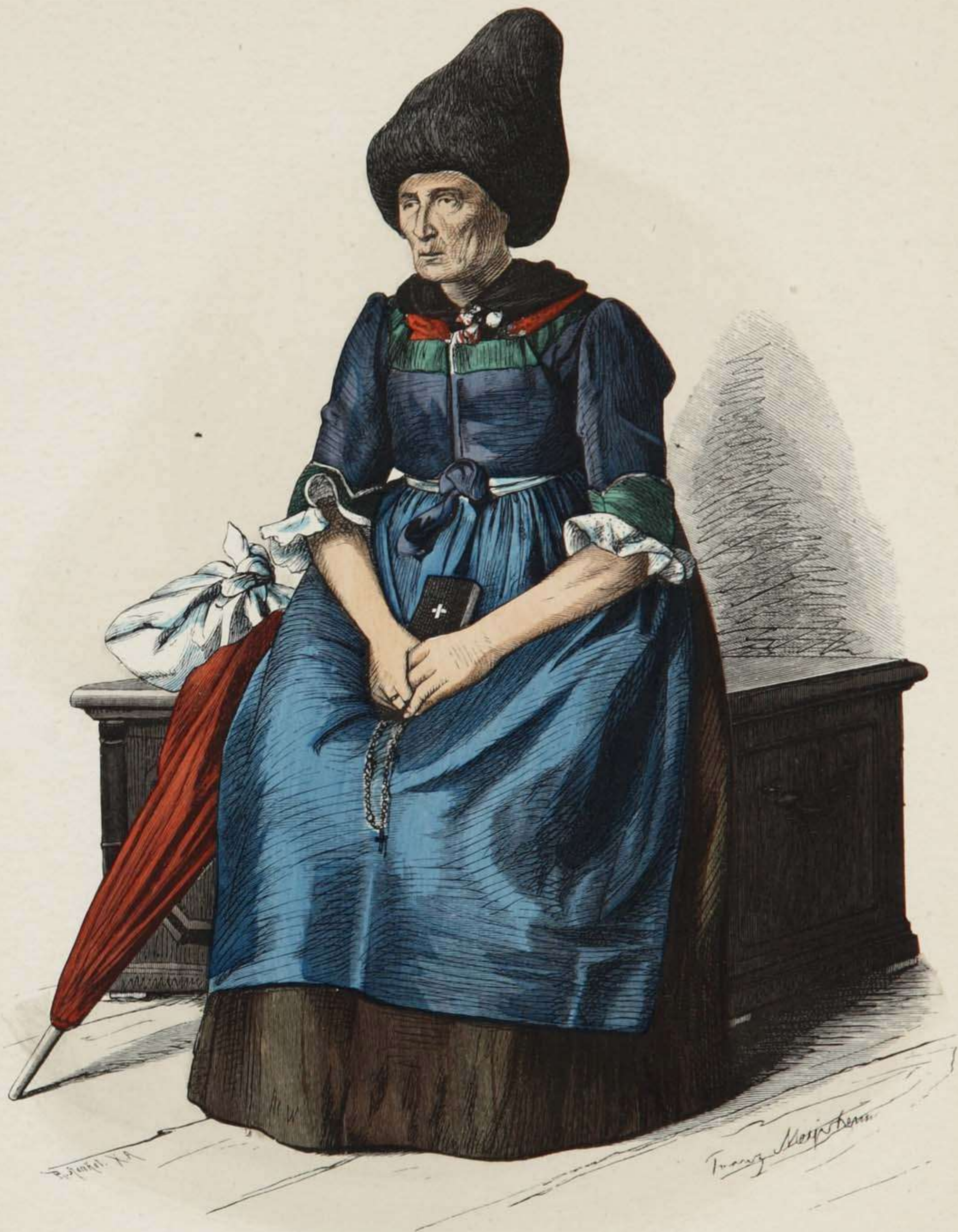
Alte Frau aus dem Vintschgau, Tirol.