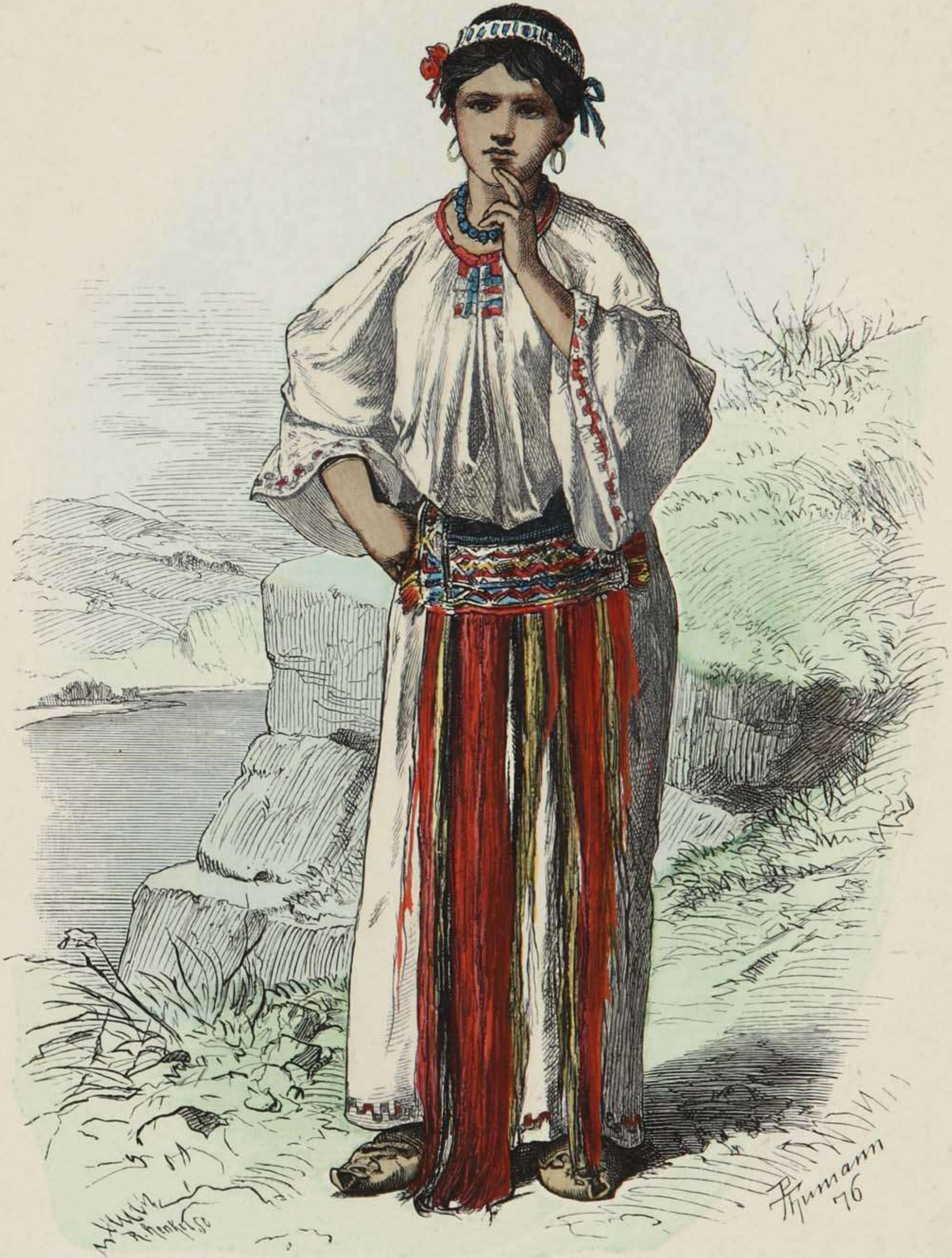
Walachin aus Orsova, Ungarn.