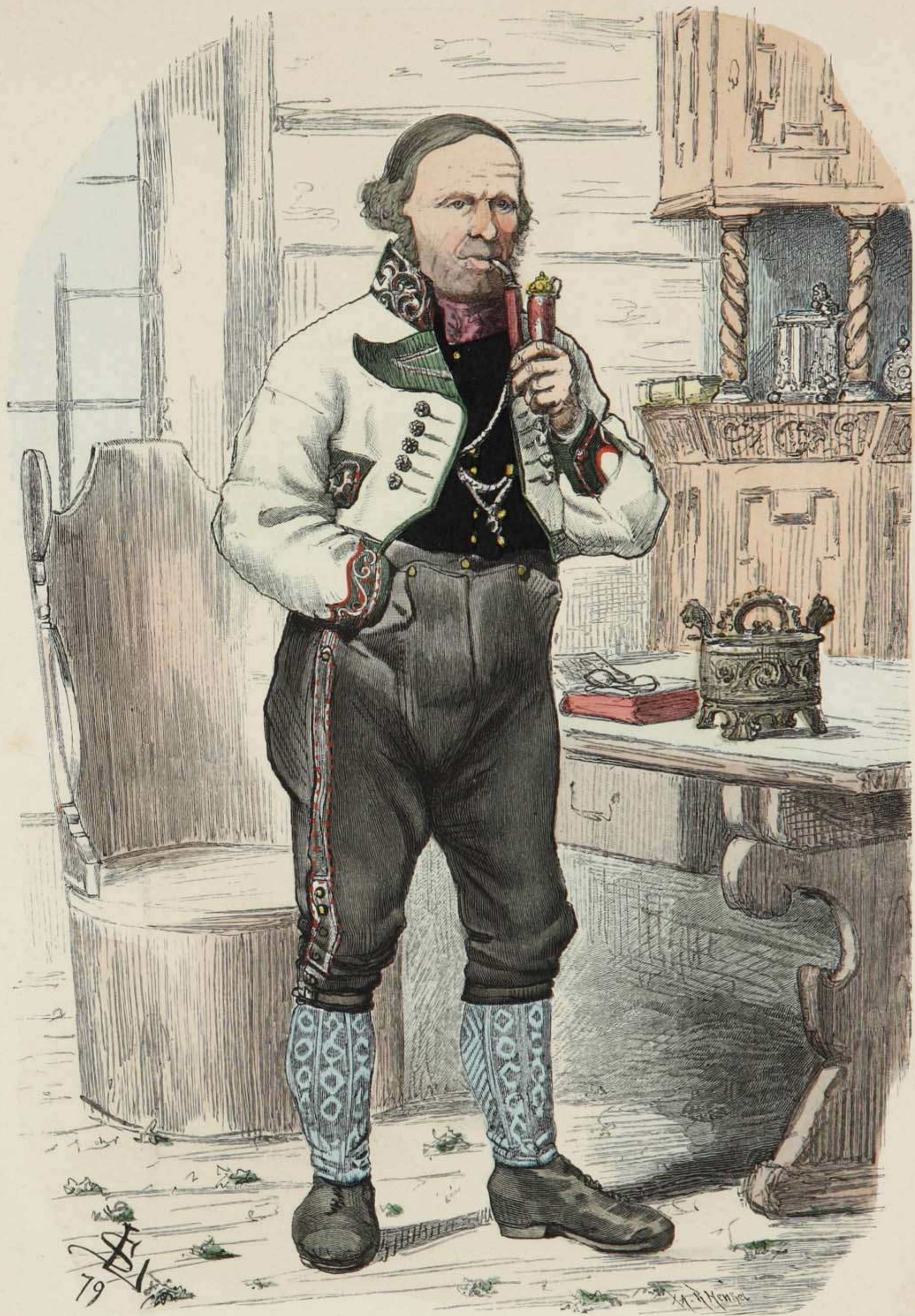
Bauer aus Hitterdal in Thelemarken, Norwegen.