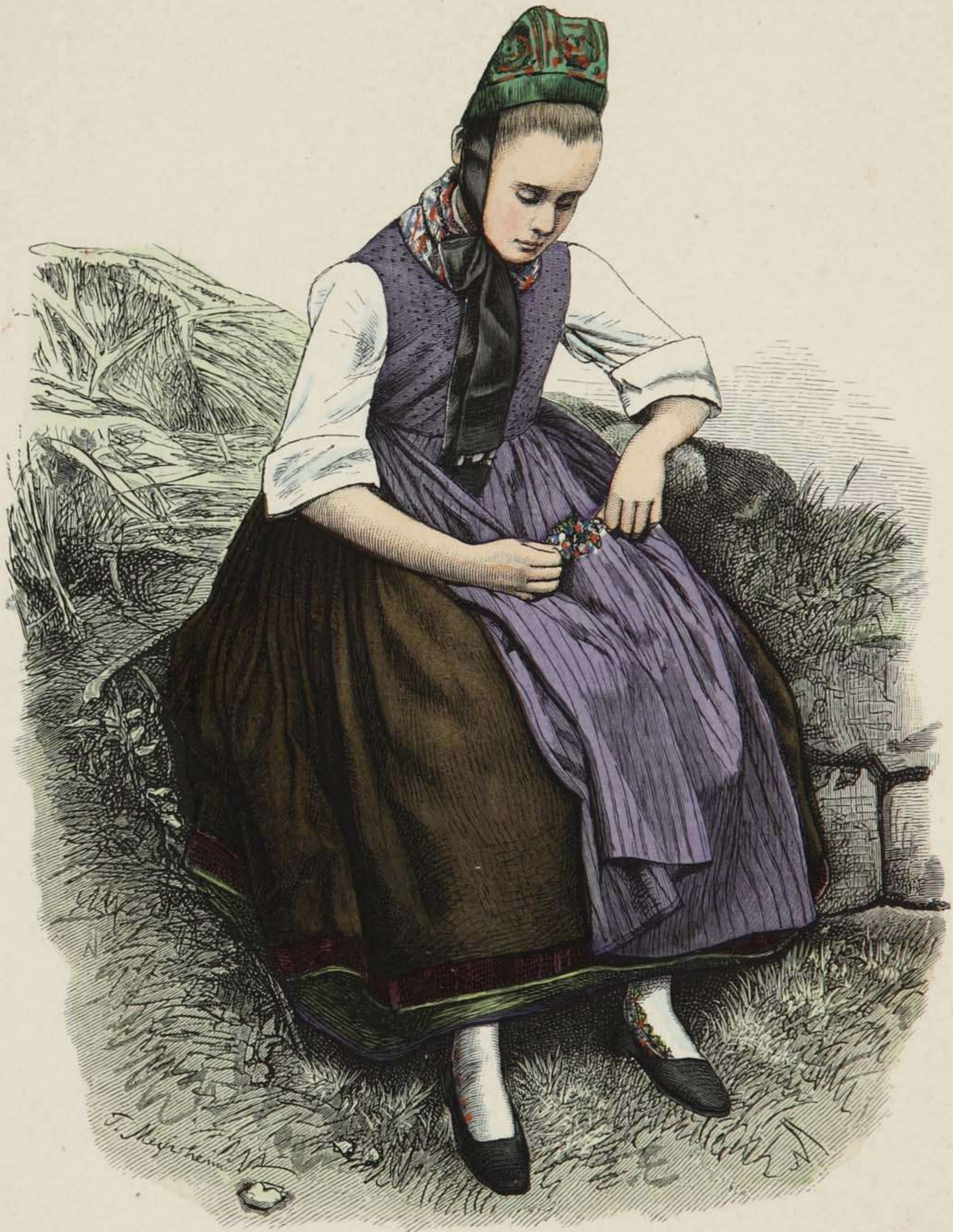
Bauernmädchen aus Ockershausen bei Marburg, Kurhessen.