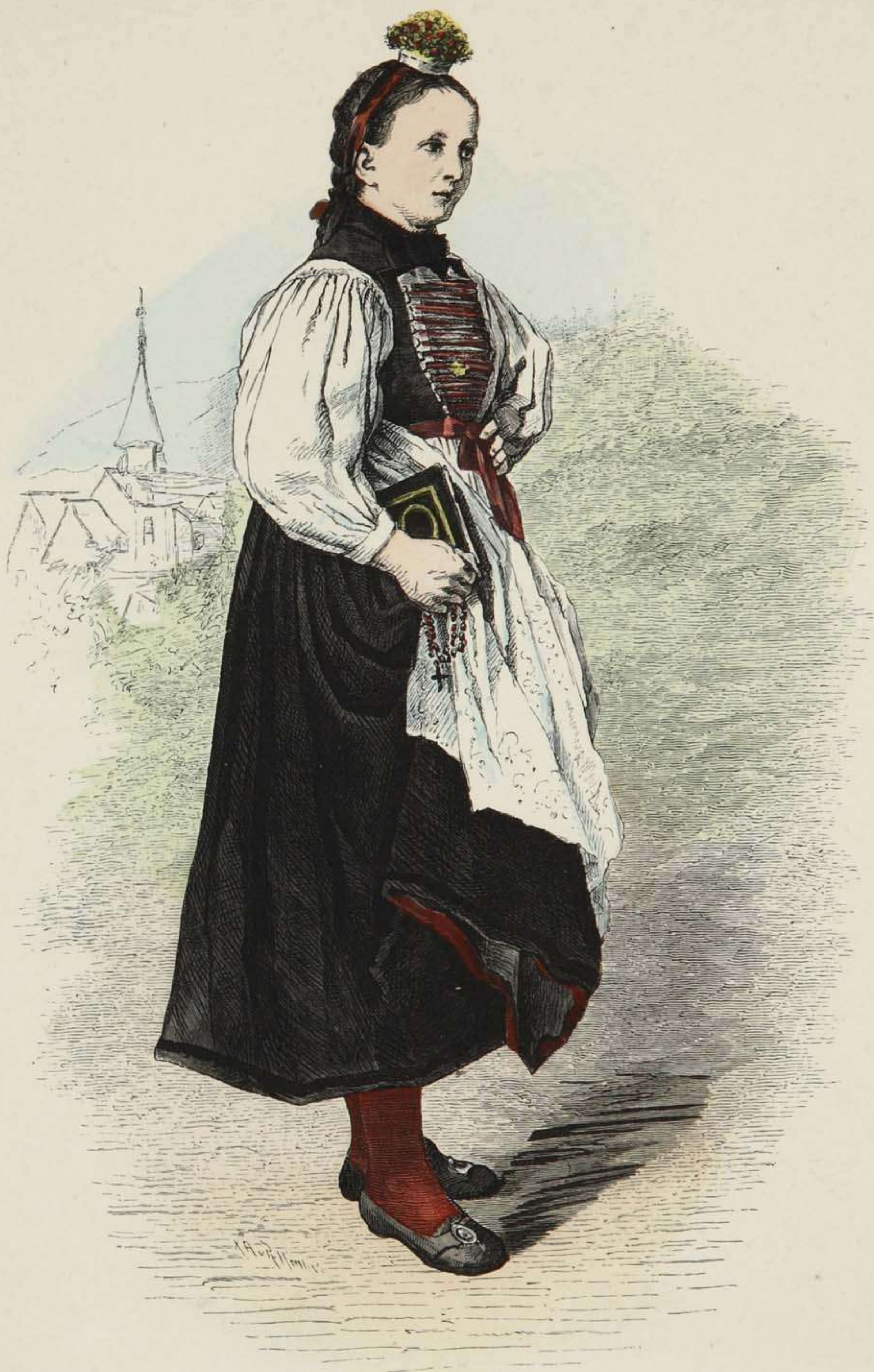
Kranzjungfer (Schäppelmeiggi) aus Montafun, Vorarlberg.