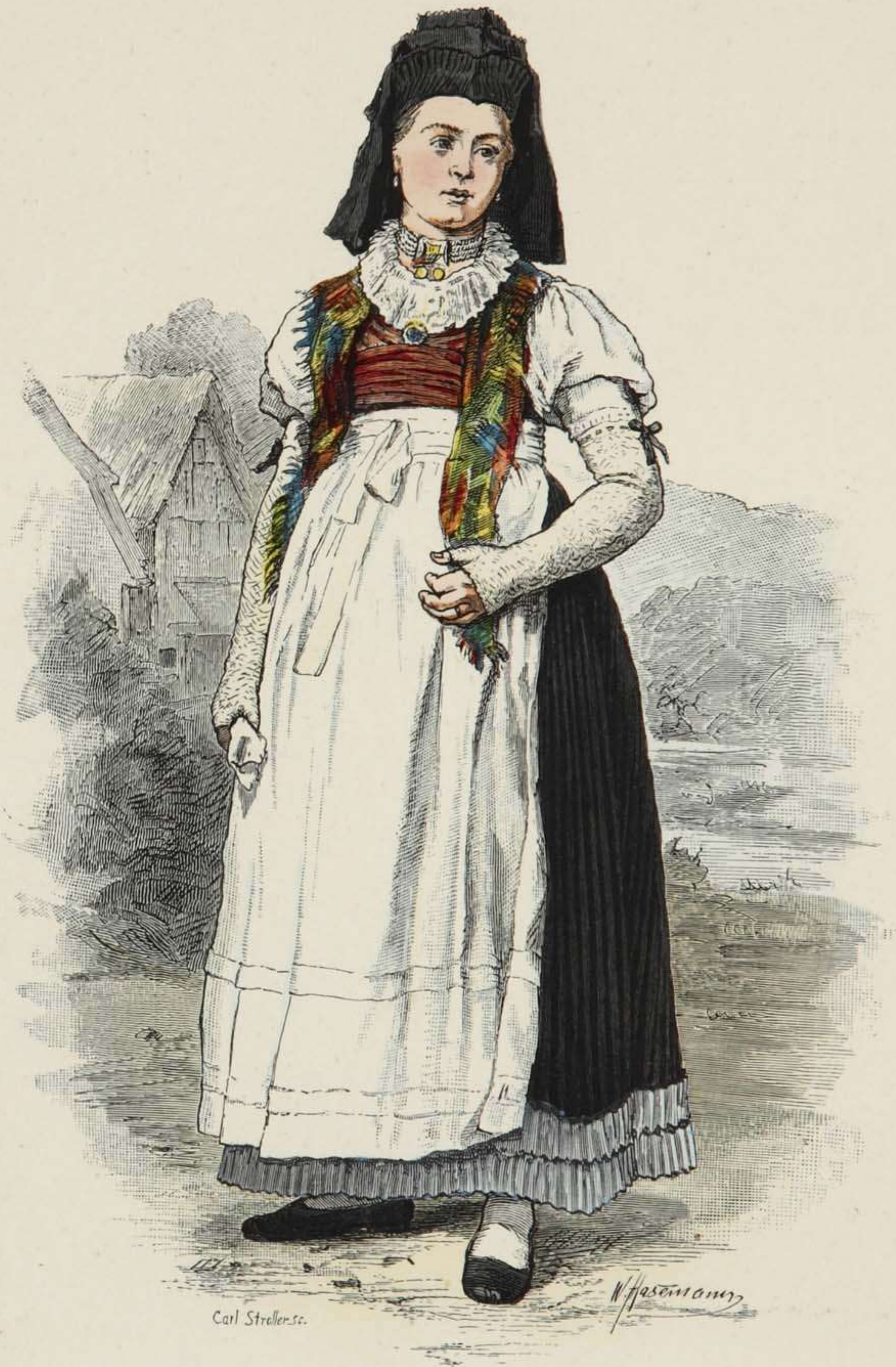
Frau in älterer Tracht aus Brotterode in Thüringen.