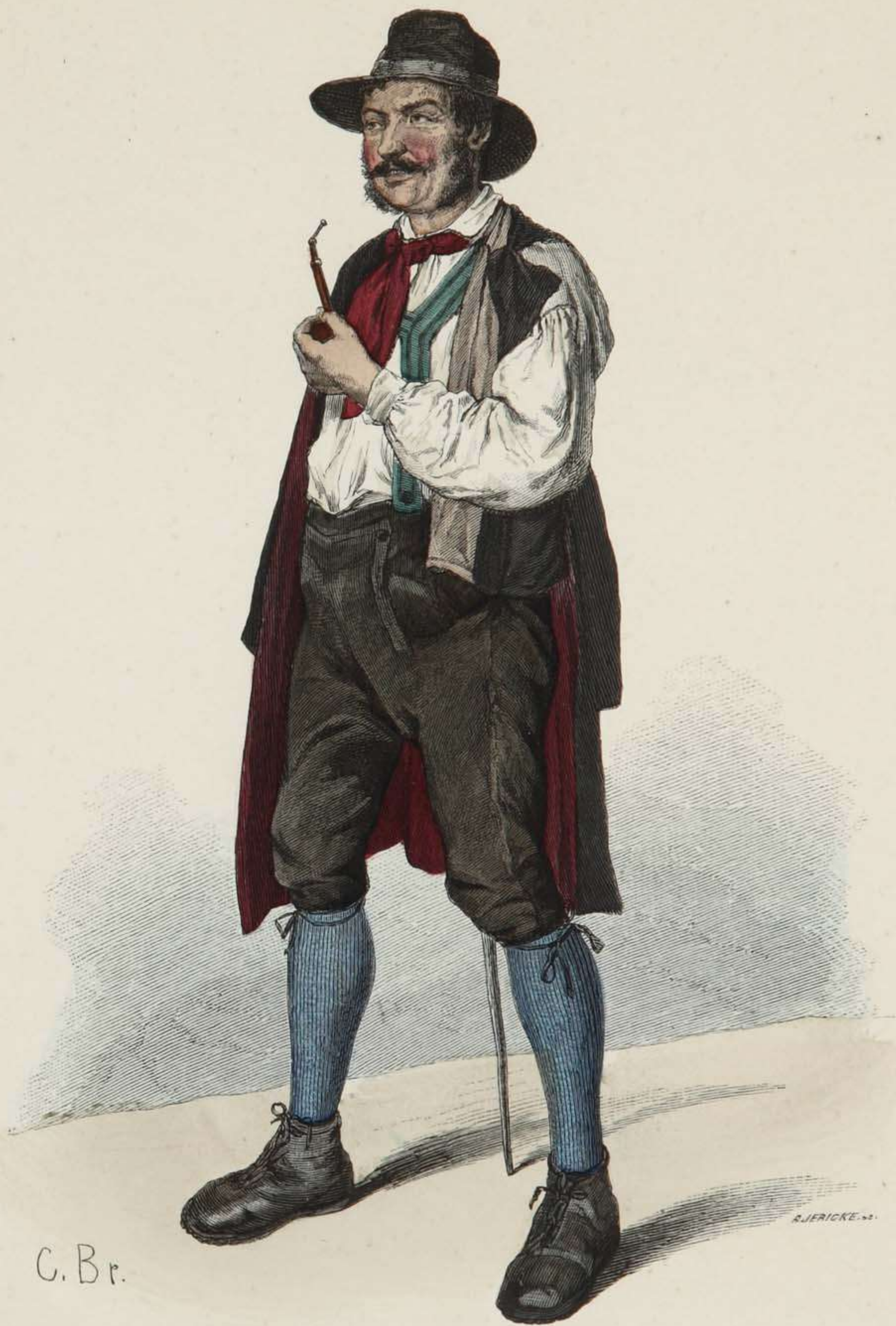
Bauer aus dem Gutachthale im badischen Schwarzwalde.