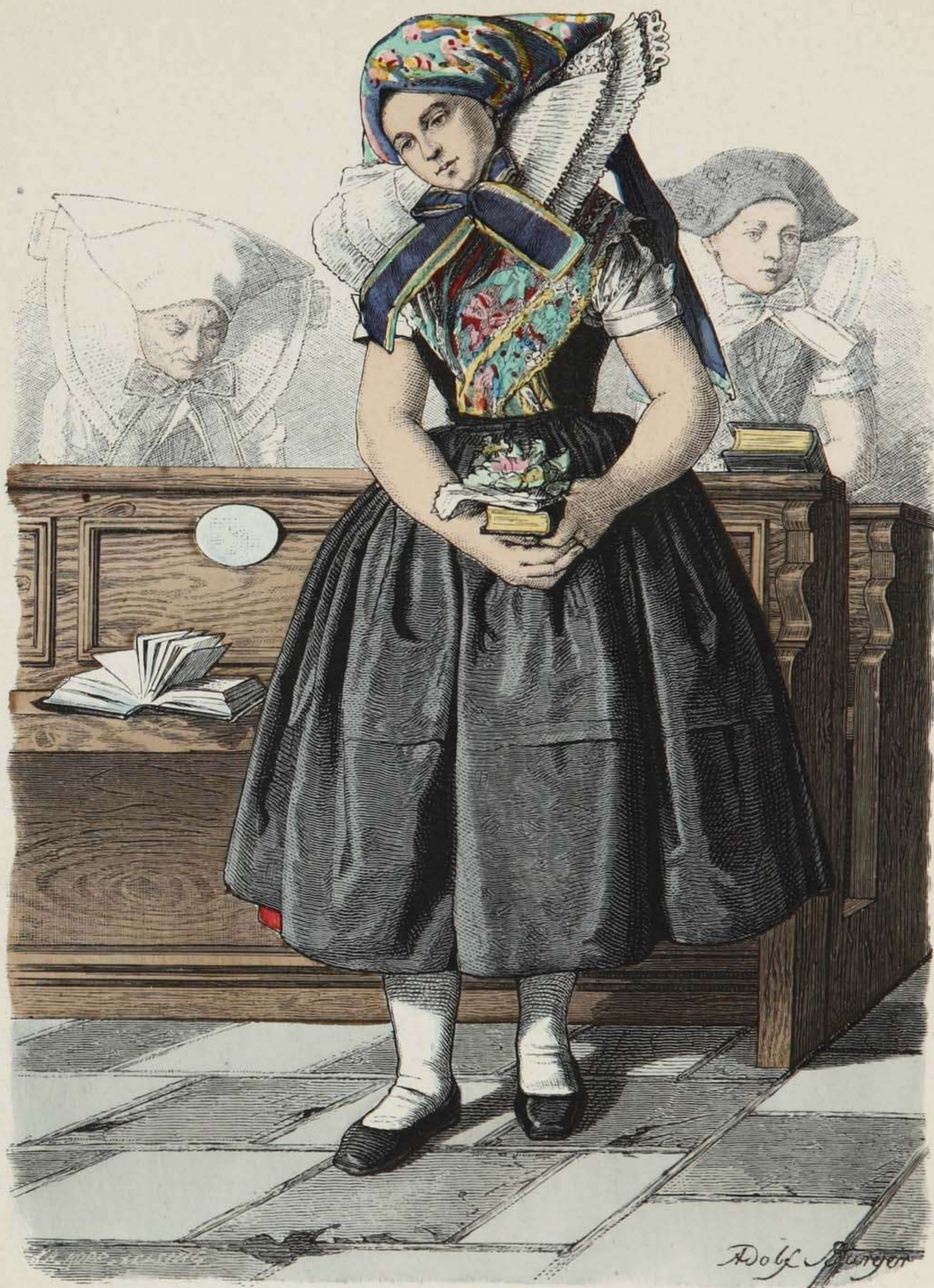
Wendisches Bauernmädchen (Sonntagstracht) aus dem Spreewalde.