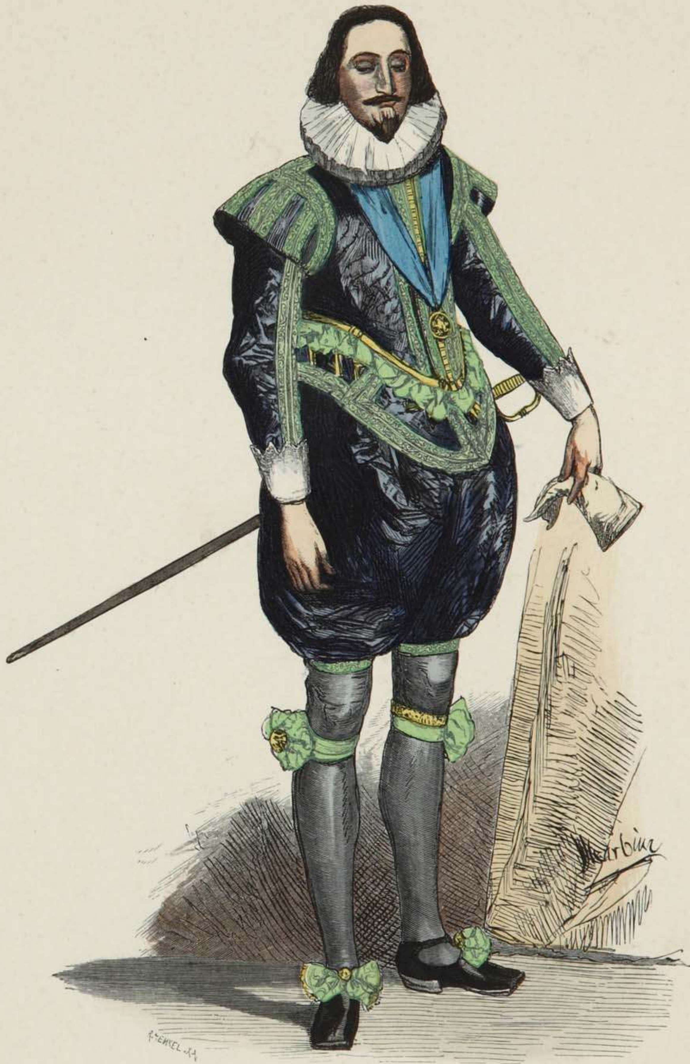
König Karl I. von England.