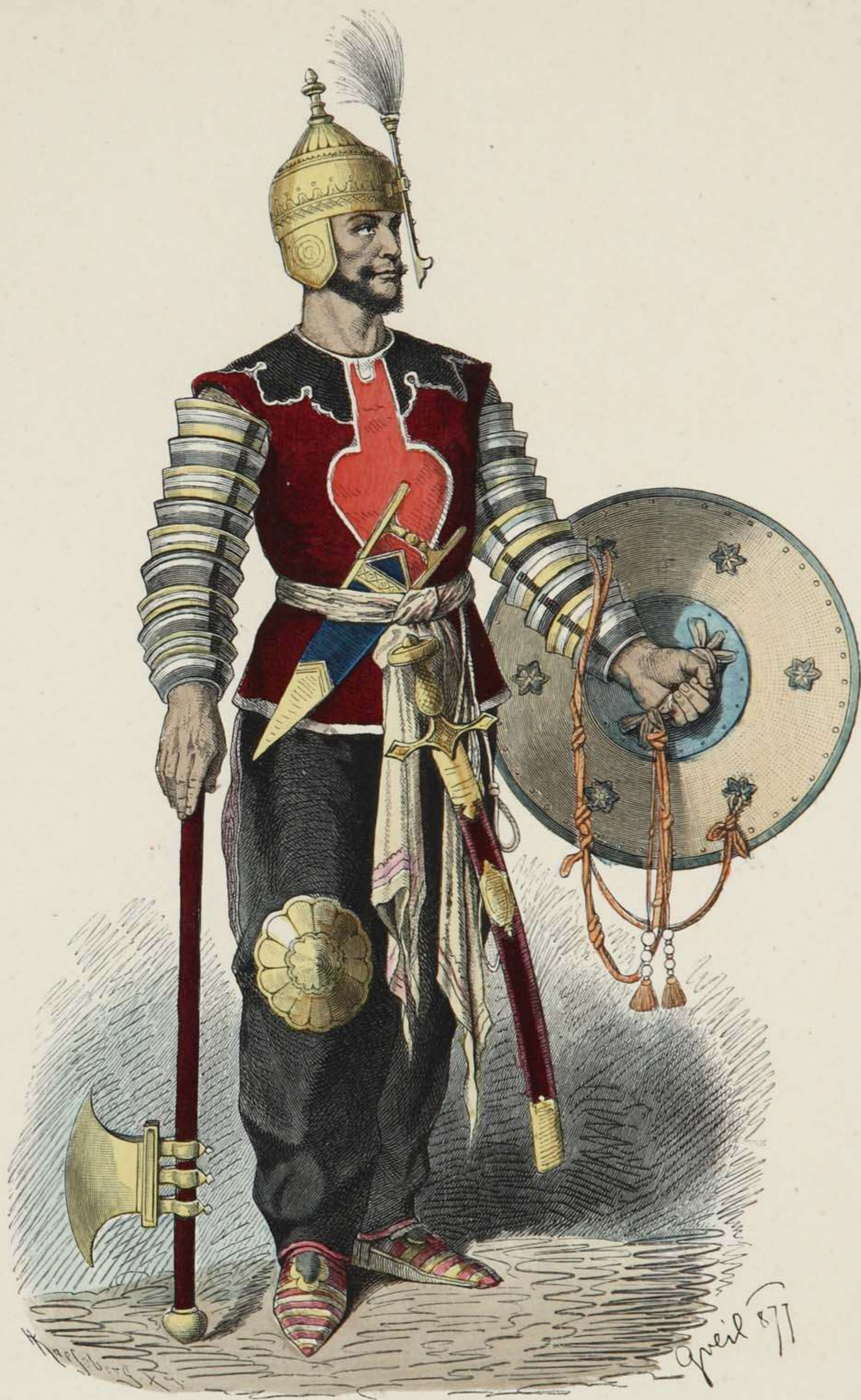
Persischer Krieger. XV. Jahrhundert.