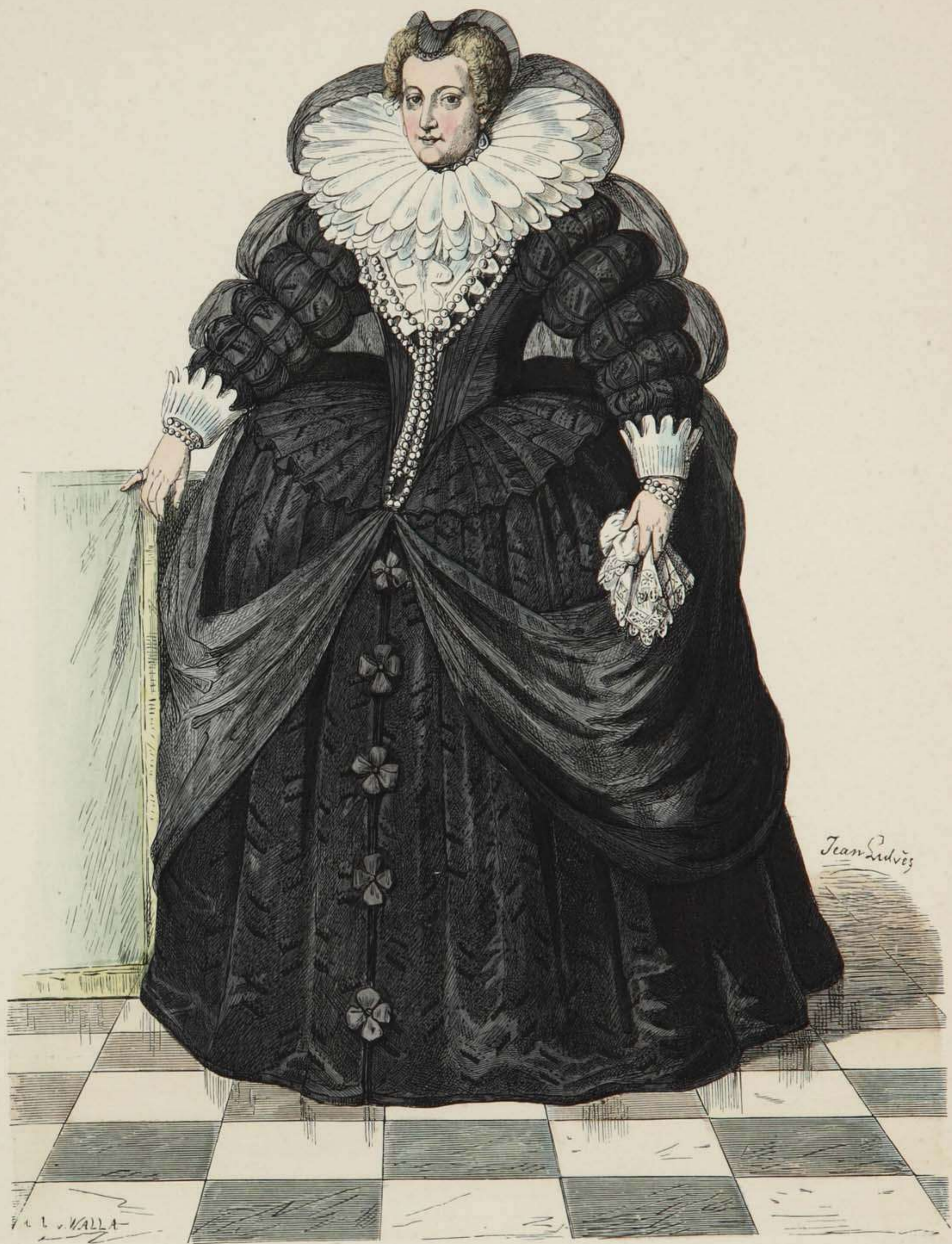
Maria von Medicis, Königin von Frankreich. Um 1610.