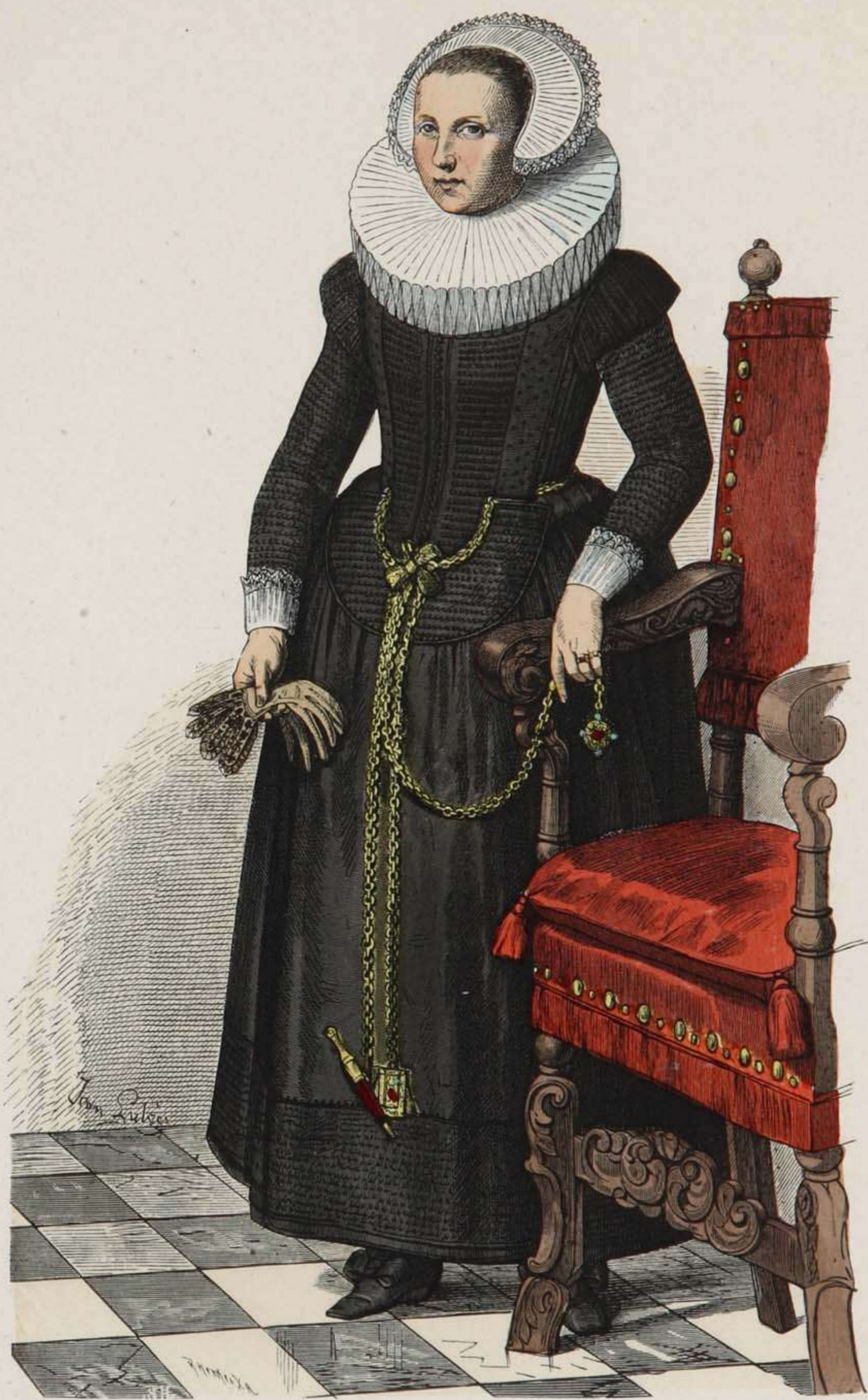
Kölner Bürgerfrau. Mitte des XVII. Jahrhunderts.