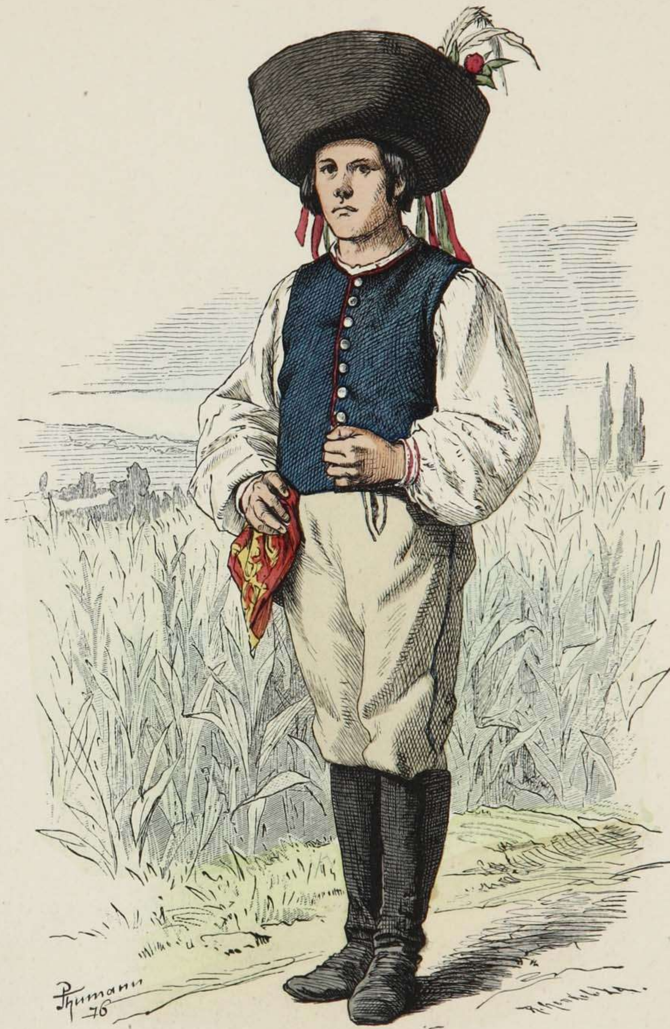
Slovake aus der Gegend von Kaschau.