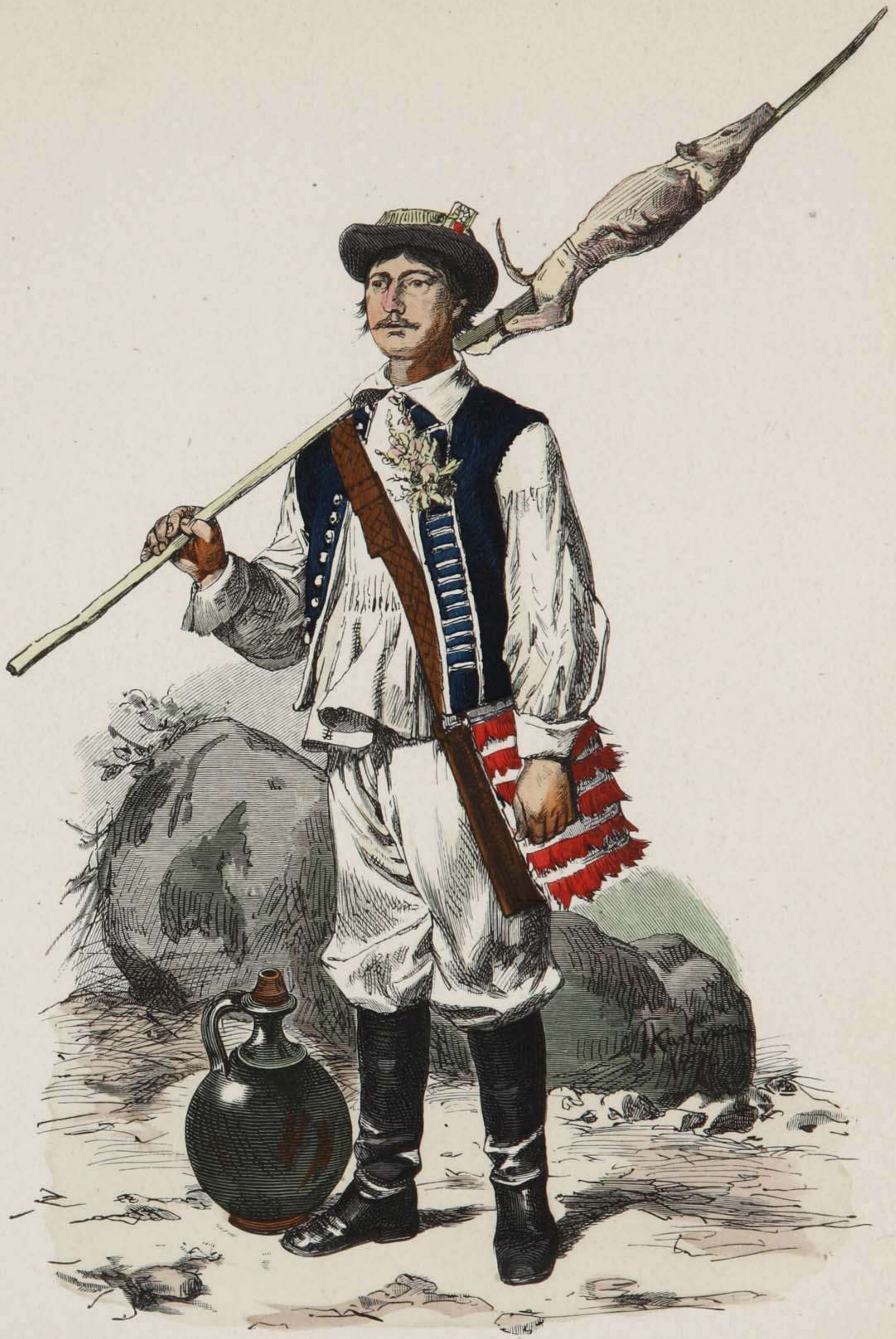
Junger kroatischer Gebirgsbauer.