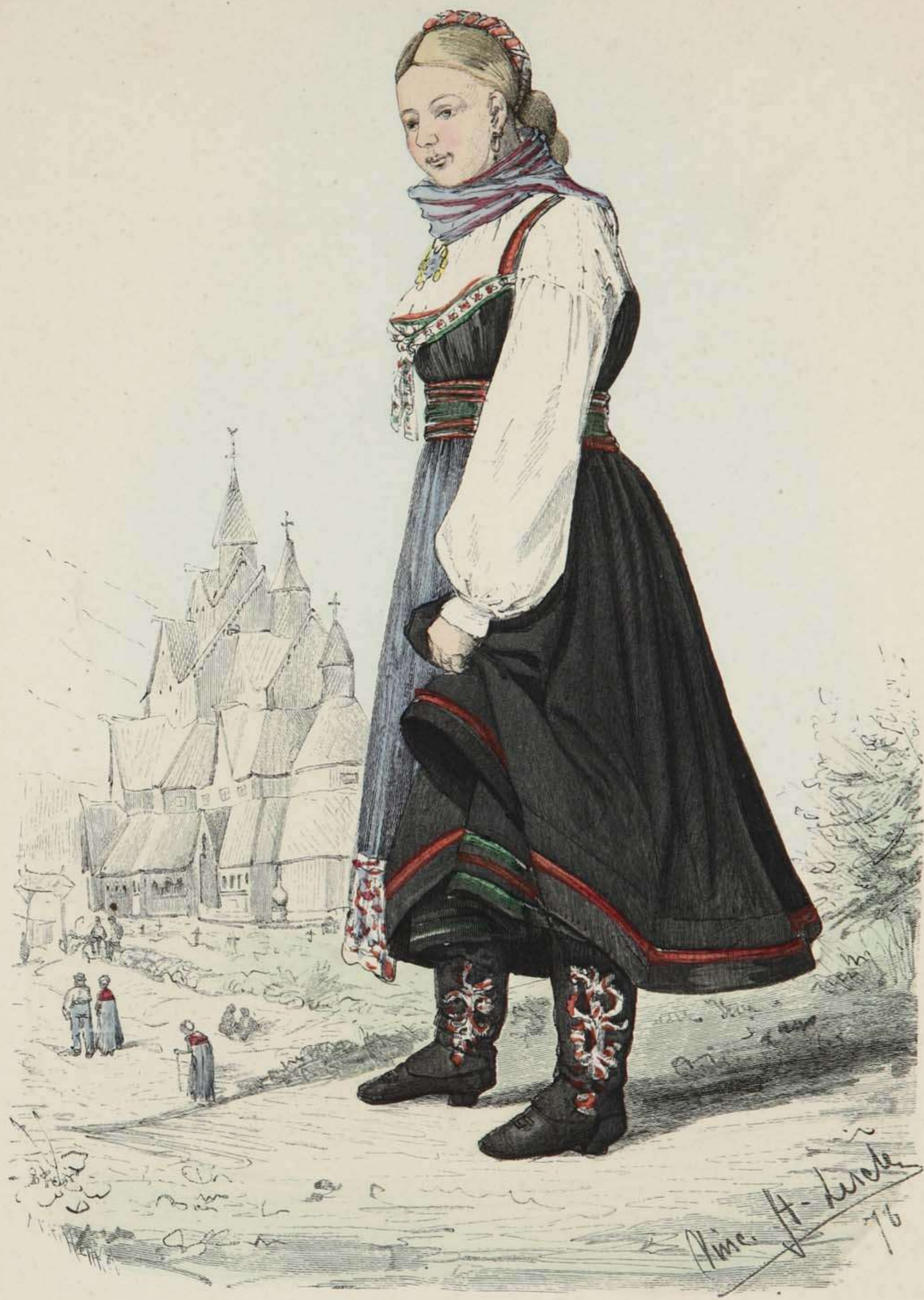
Mädchen aus Hitterdal in Thelemarken, Norwegen.