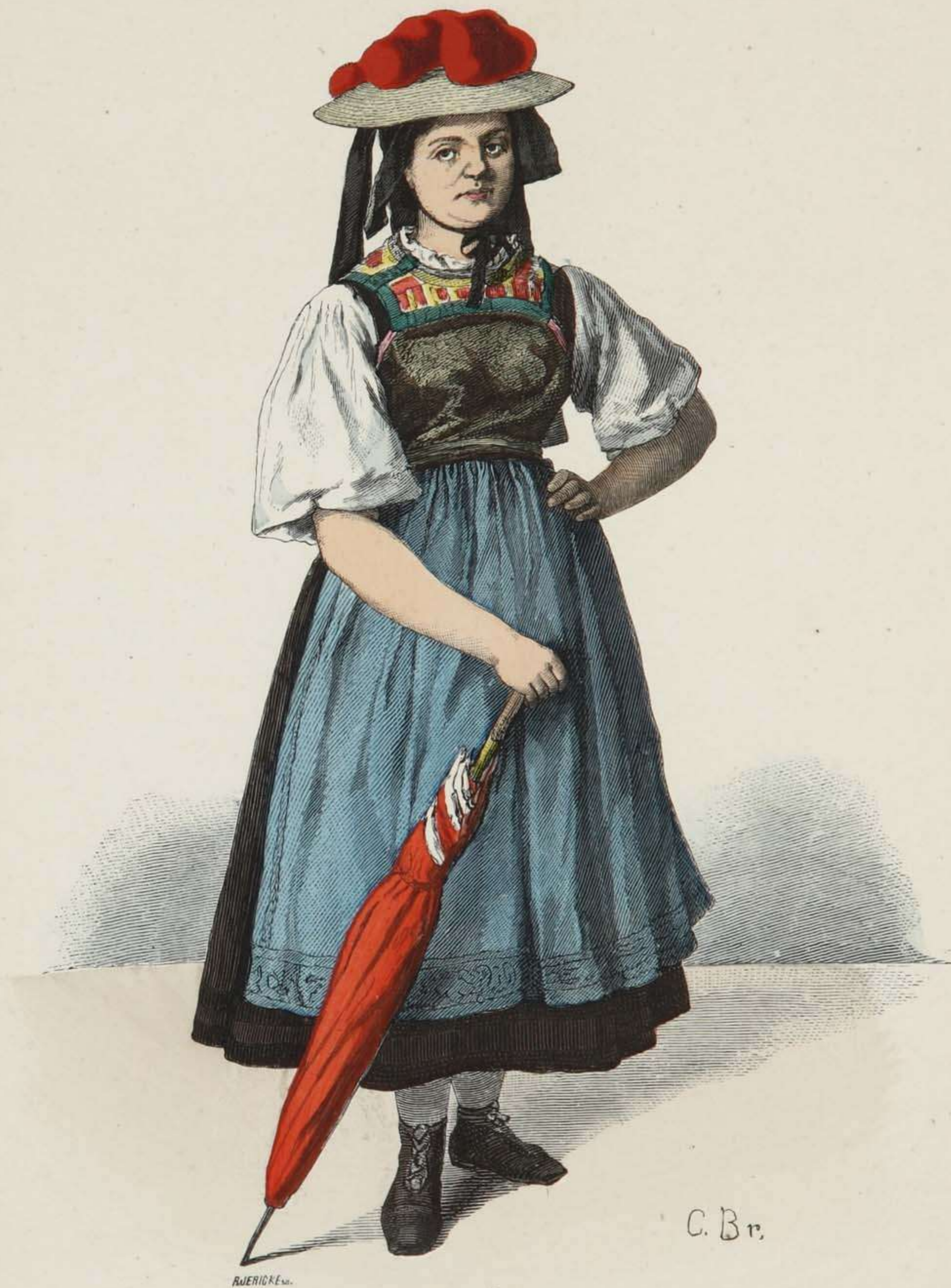
Bauernmädchen aus dem Gutachthale im badischen Schwarzwalde.