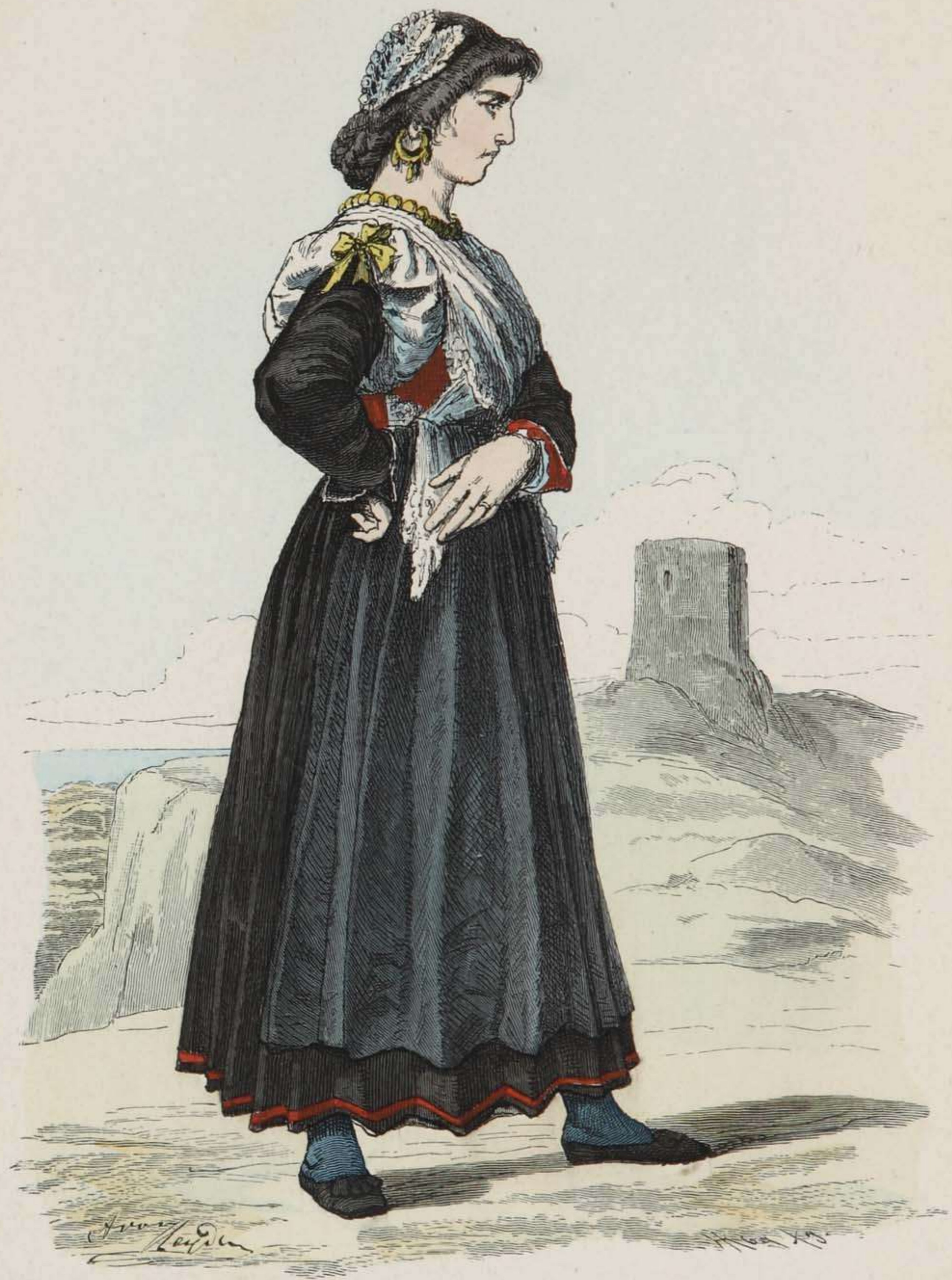
Italienisches Mädchen aus Dignano in Istrien.