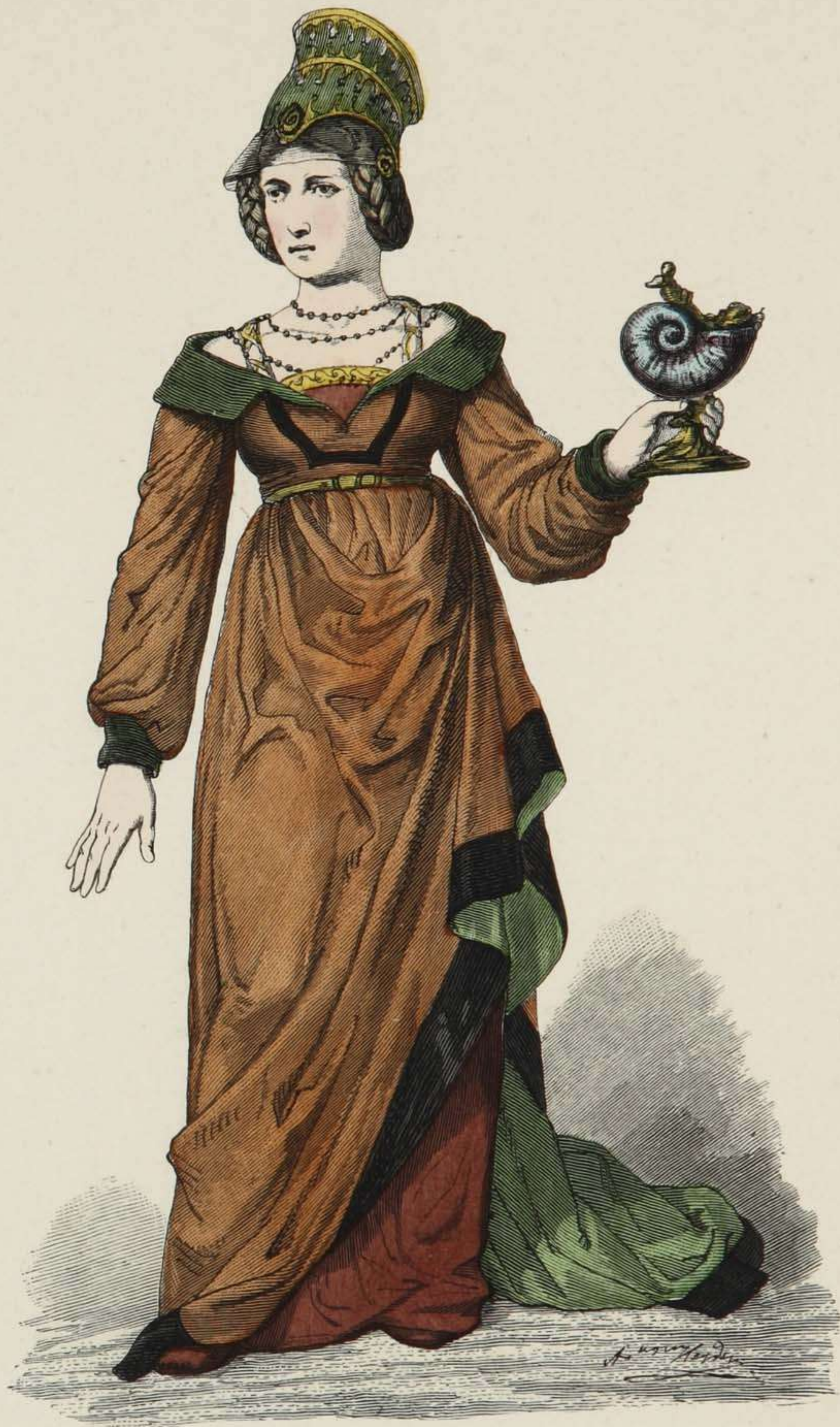
Vornehme deutsche Frau.