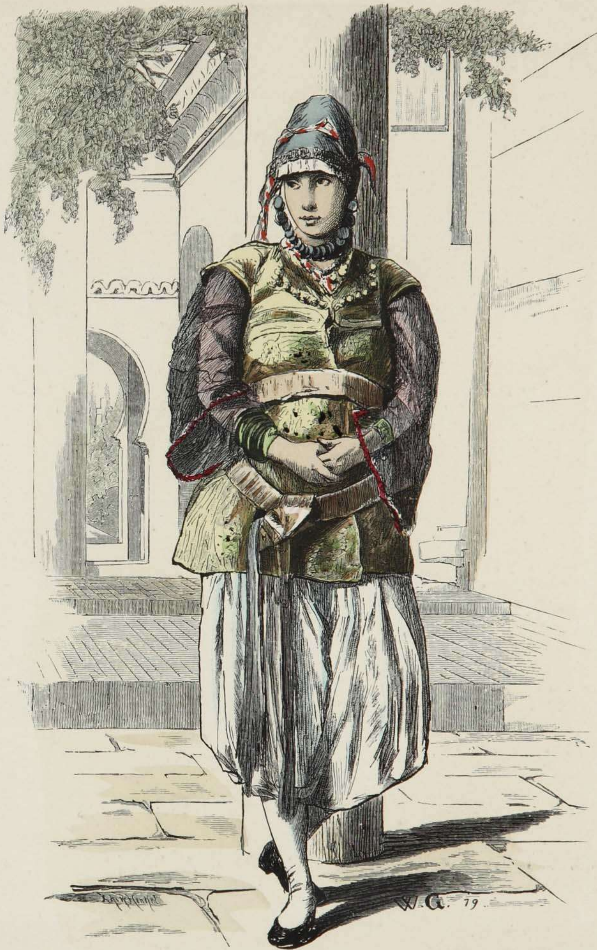
Maurische Frau aus Marokko.