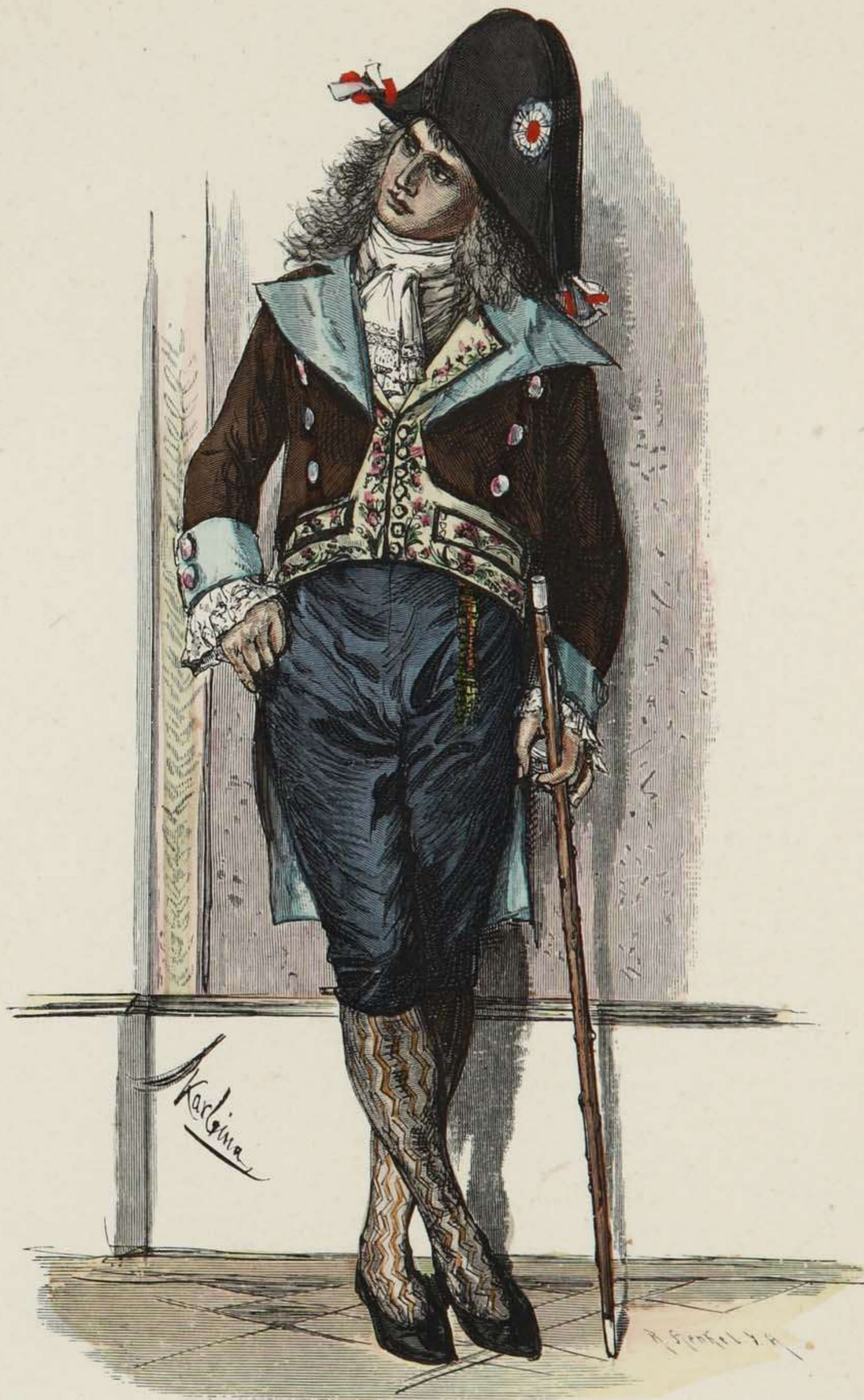
Incroyable. Zeit des Directoriums (1795—99).