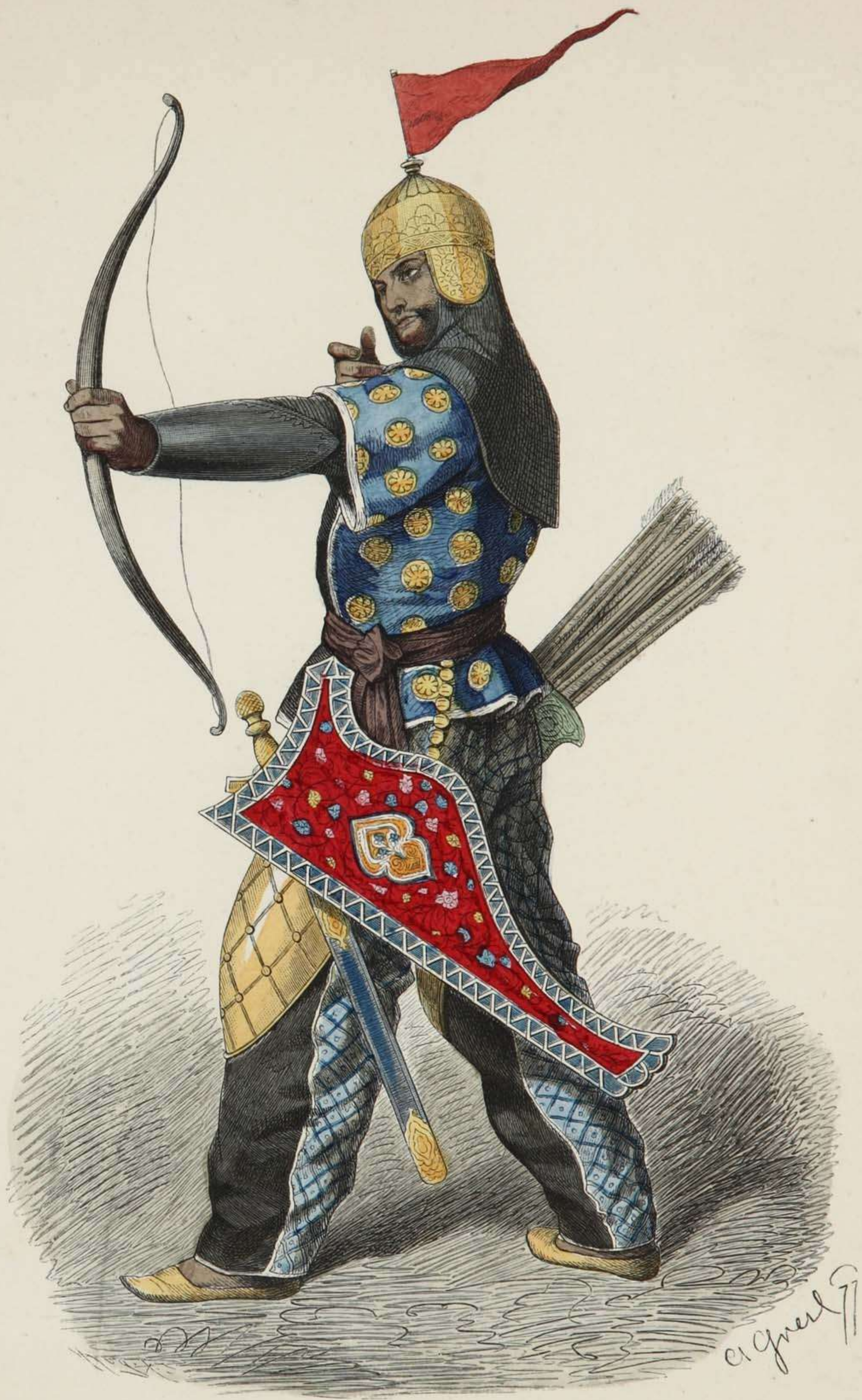
Persischer Bogenschütze. XV. Jahrhundert.