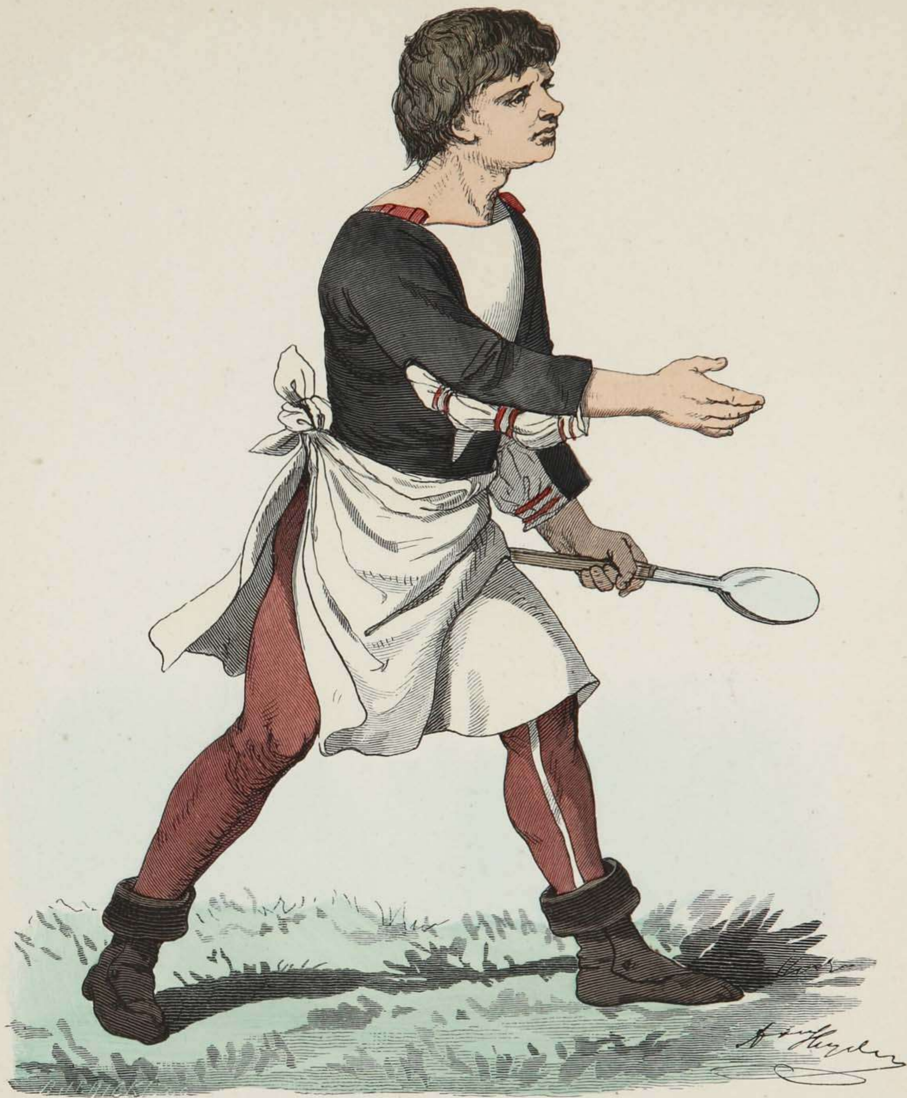
Deutscher Koch. Ende des XV. Jahrhunderts.