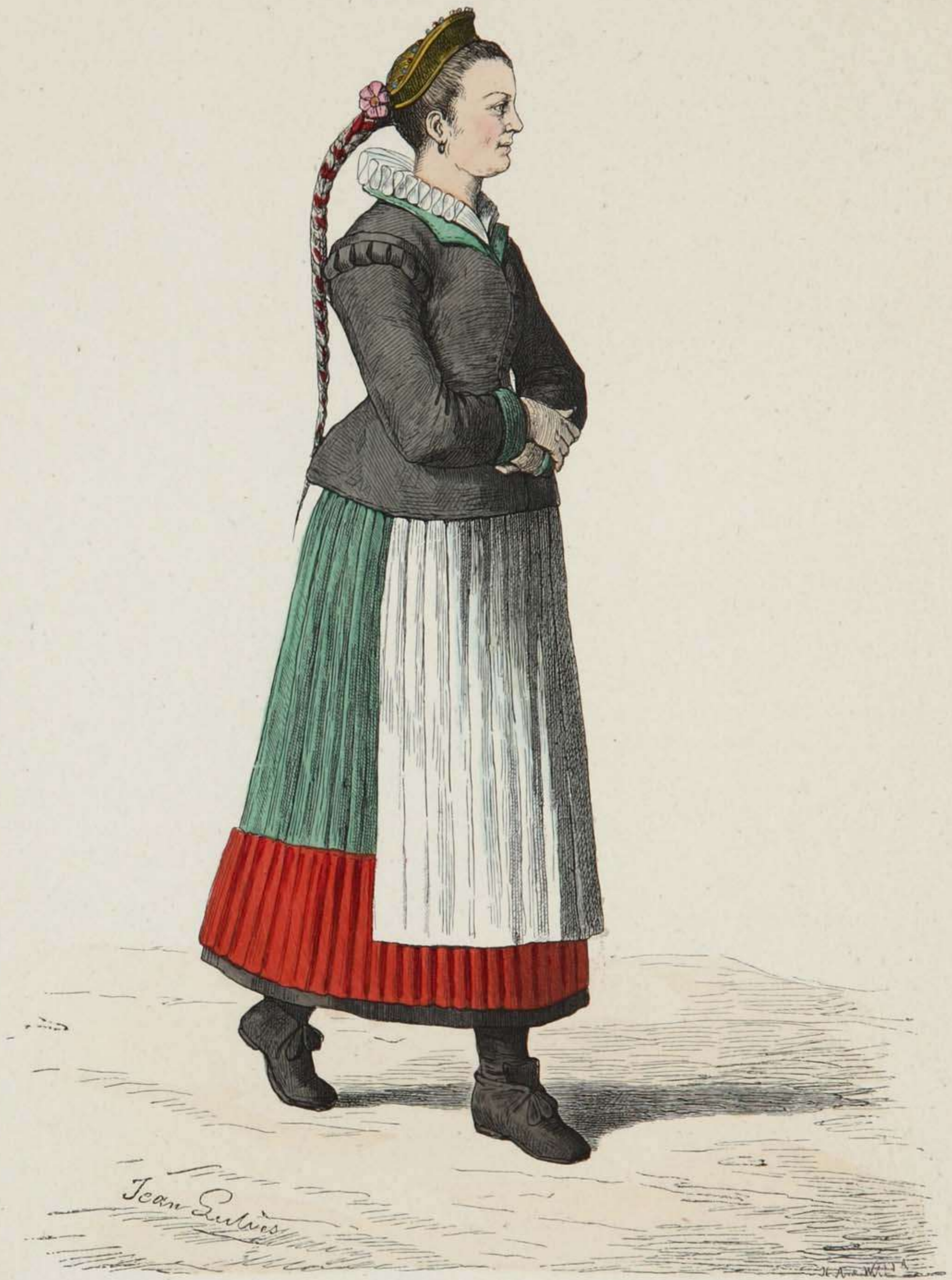
Bauernbraut aus der Nürnberger Gegend.