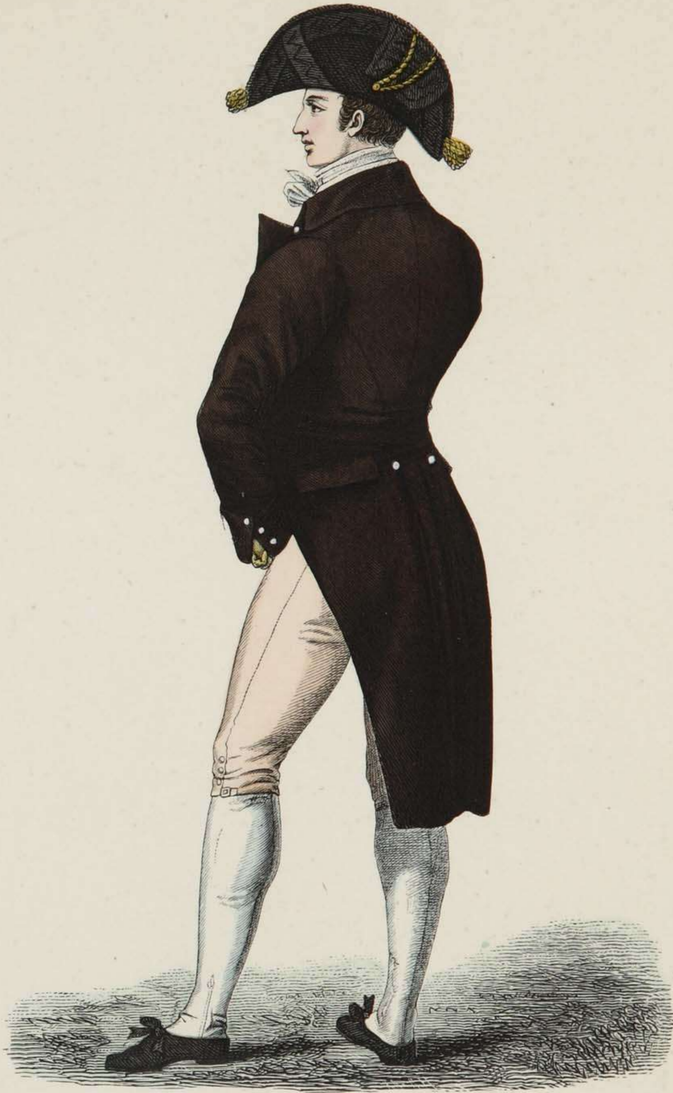
Englischer Herr in vollem Anzuge.