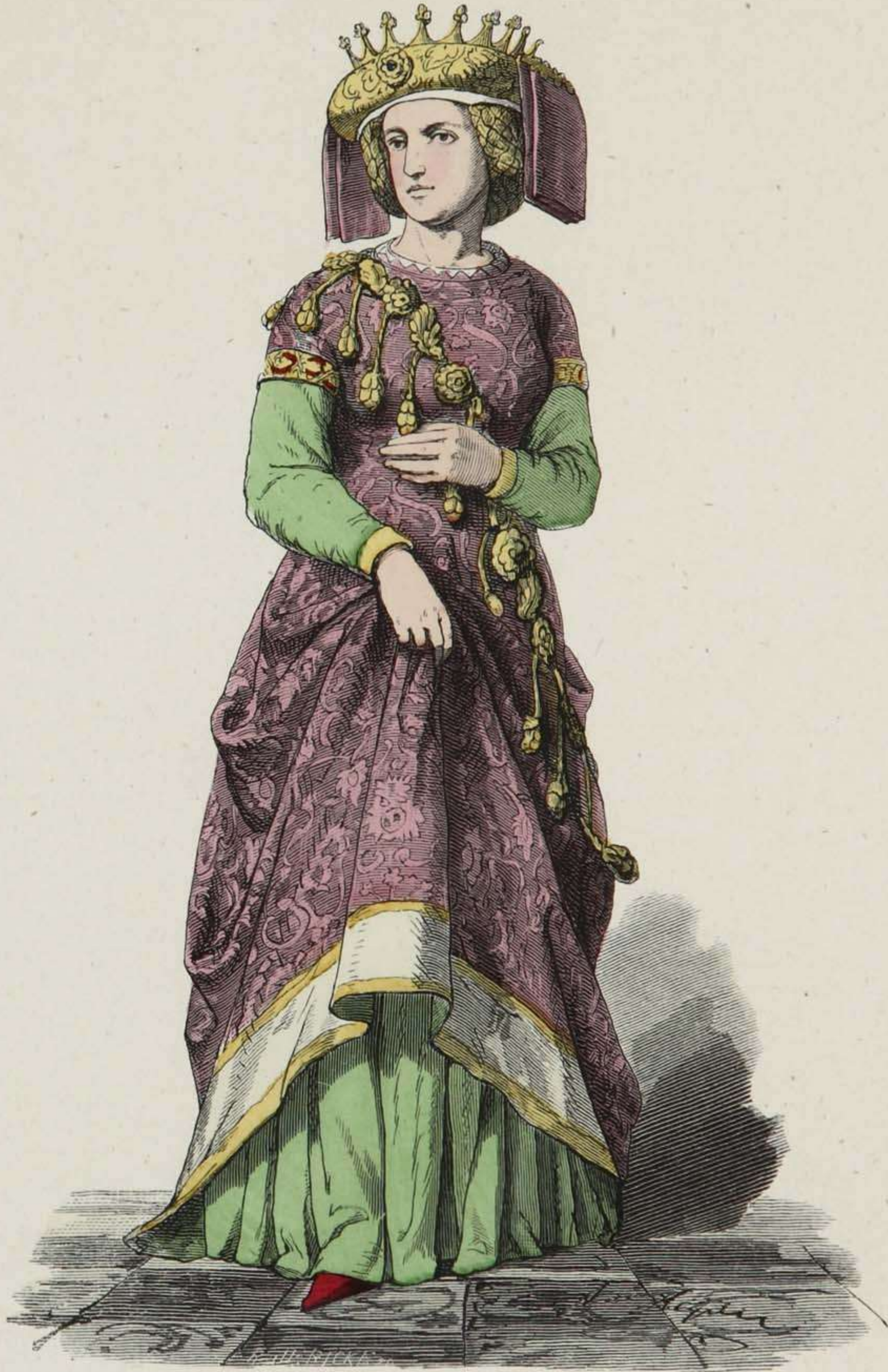
Deutsche Fürstin in Schellentracht.