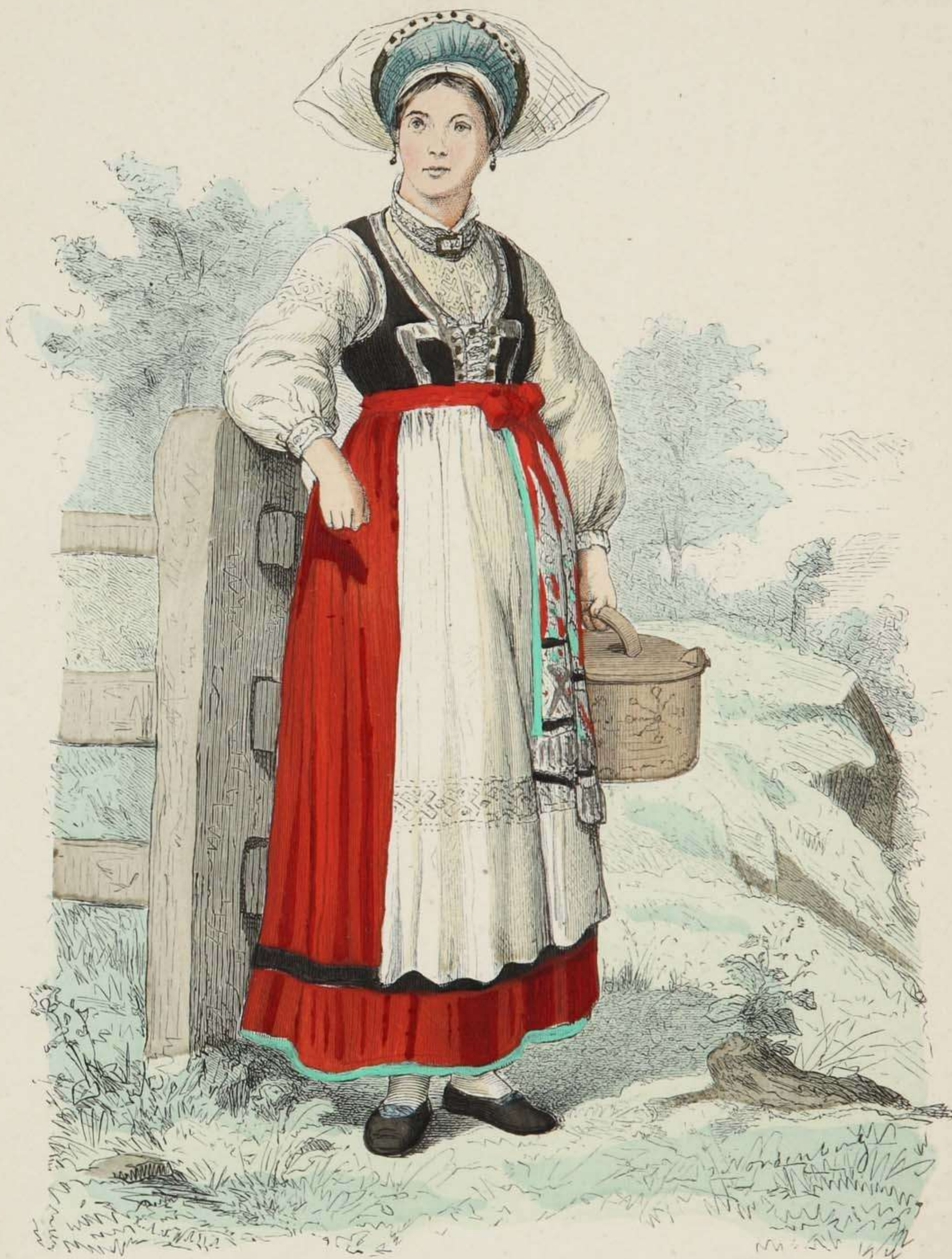
Mädchen aus Blekinge, Schweden.