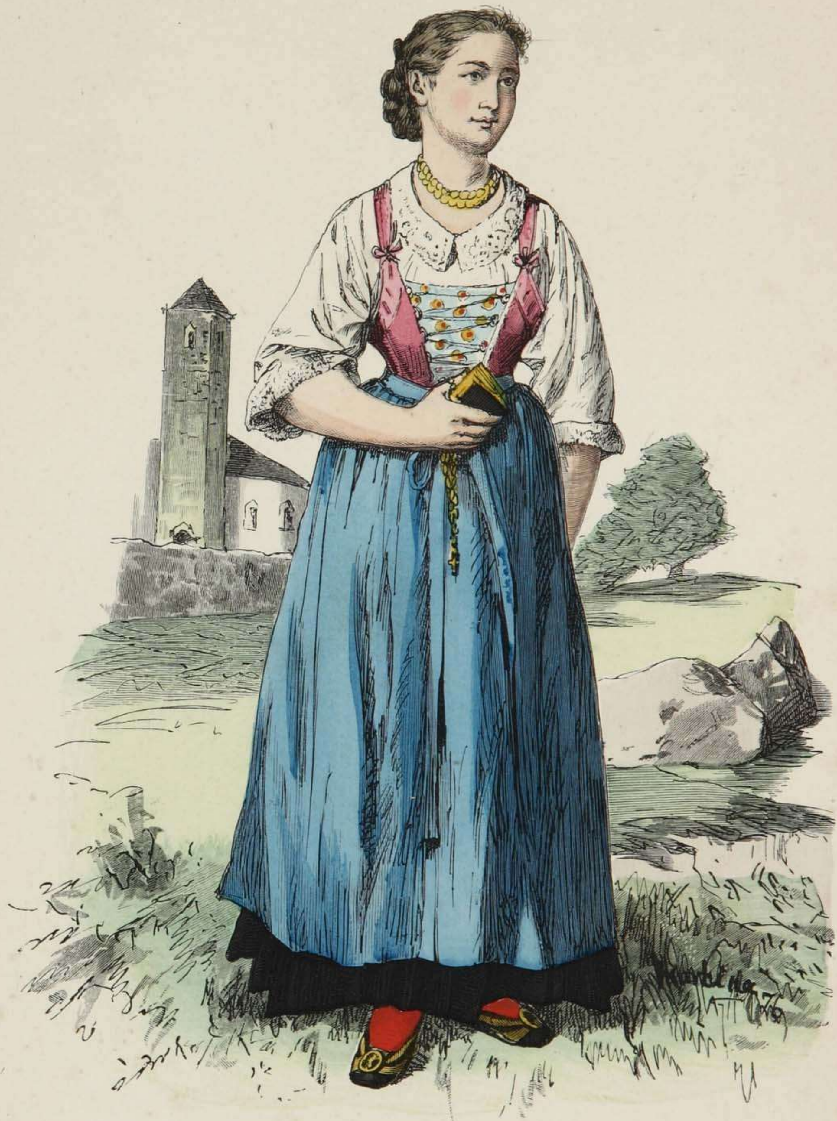
Mädchen aus Schönna bei Meran, Südtirol.