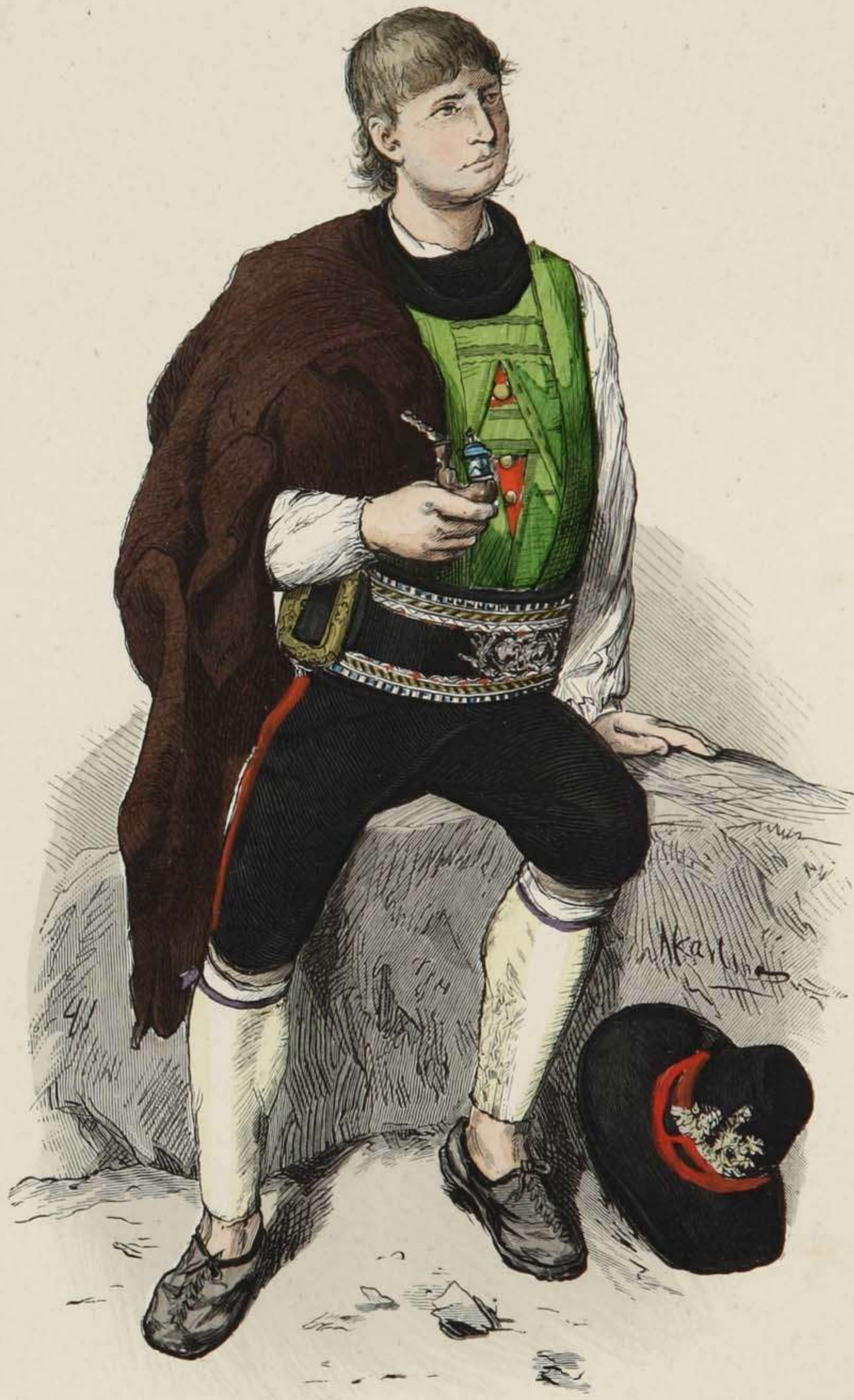
Junger Bauer aus Obermais bei Meran, Südtirol.