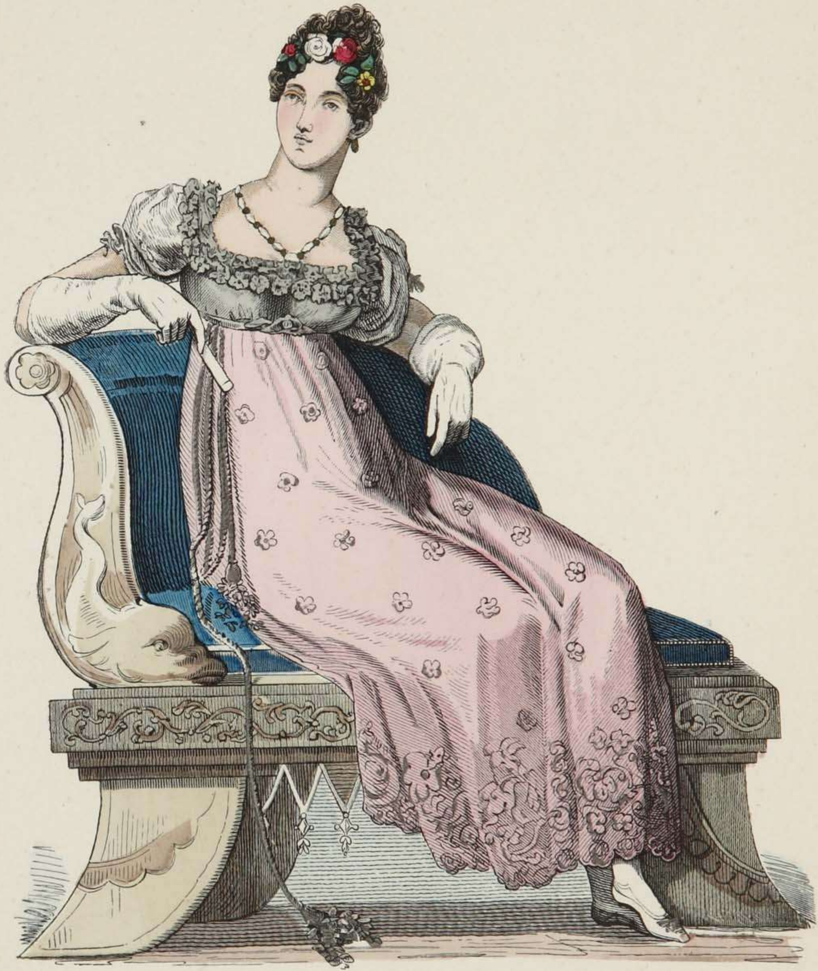
Englische Dame in vollem Anzuge.