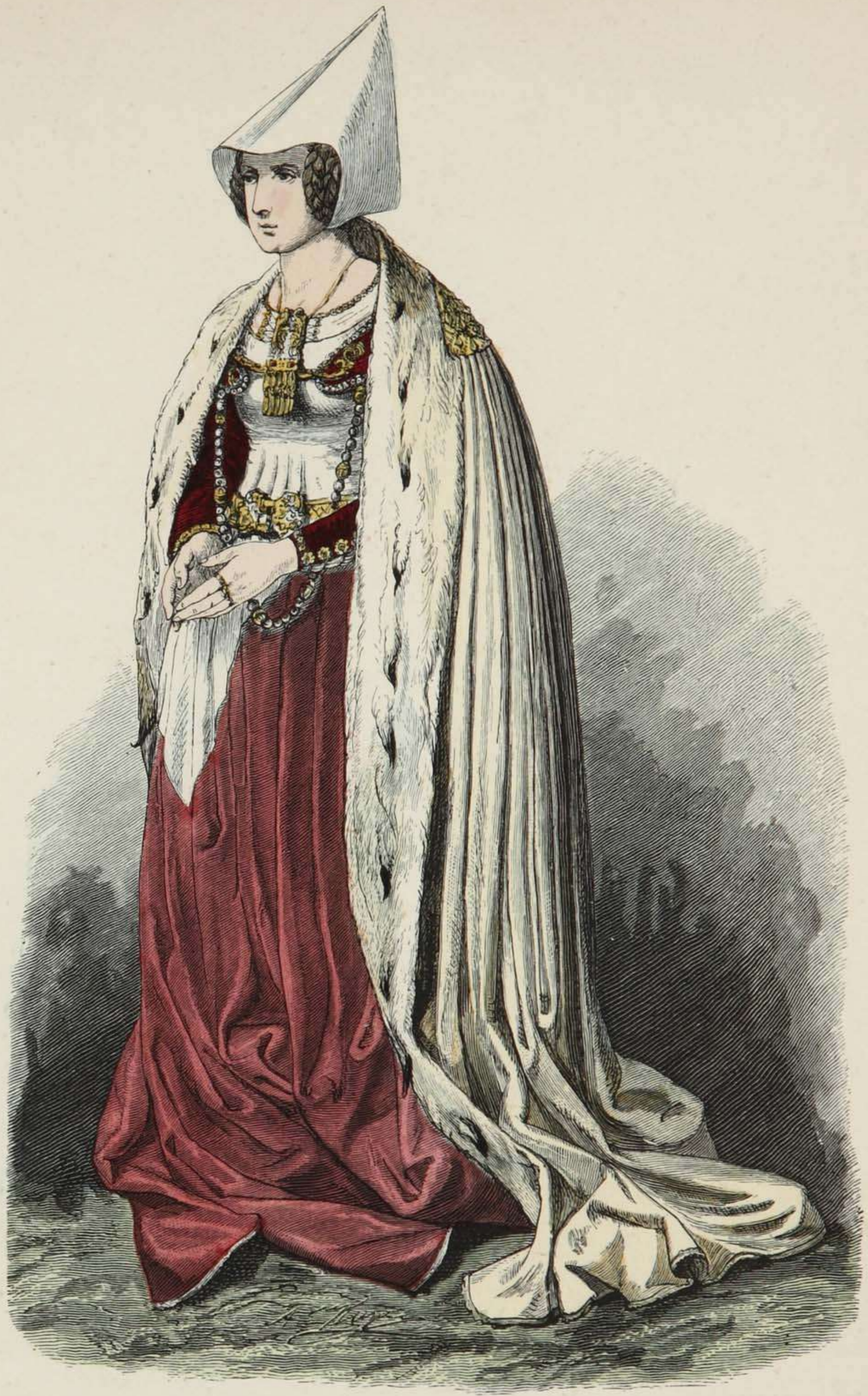
Lübecker Patrizier-Frau. Ende des XV. Jahrhunderts.