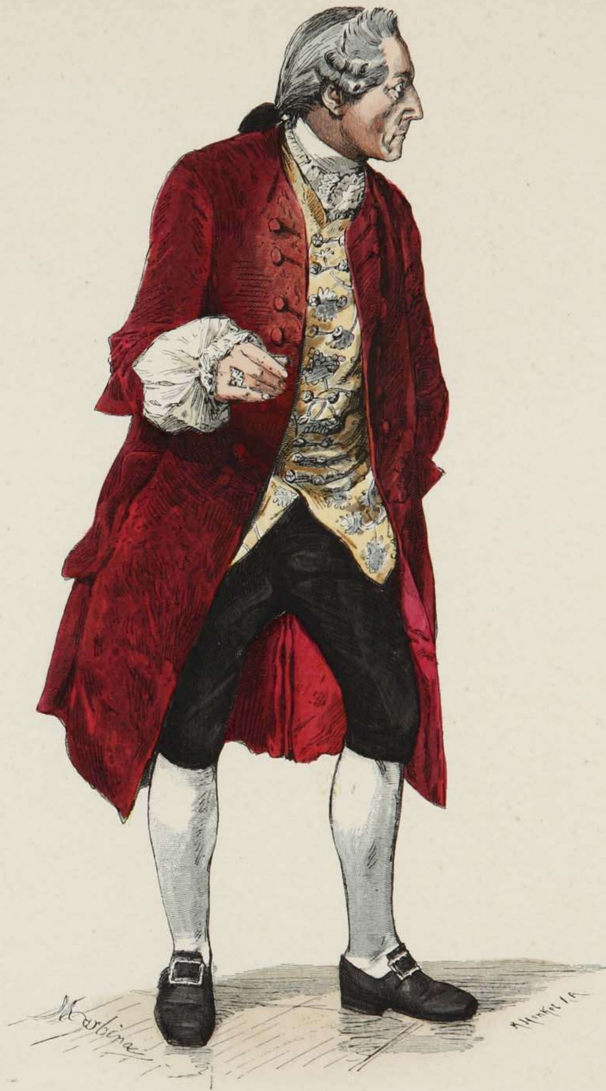
Friedrich der Grosse in bürgerlicher Kleidung.