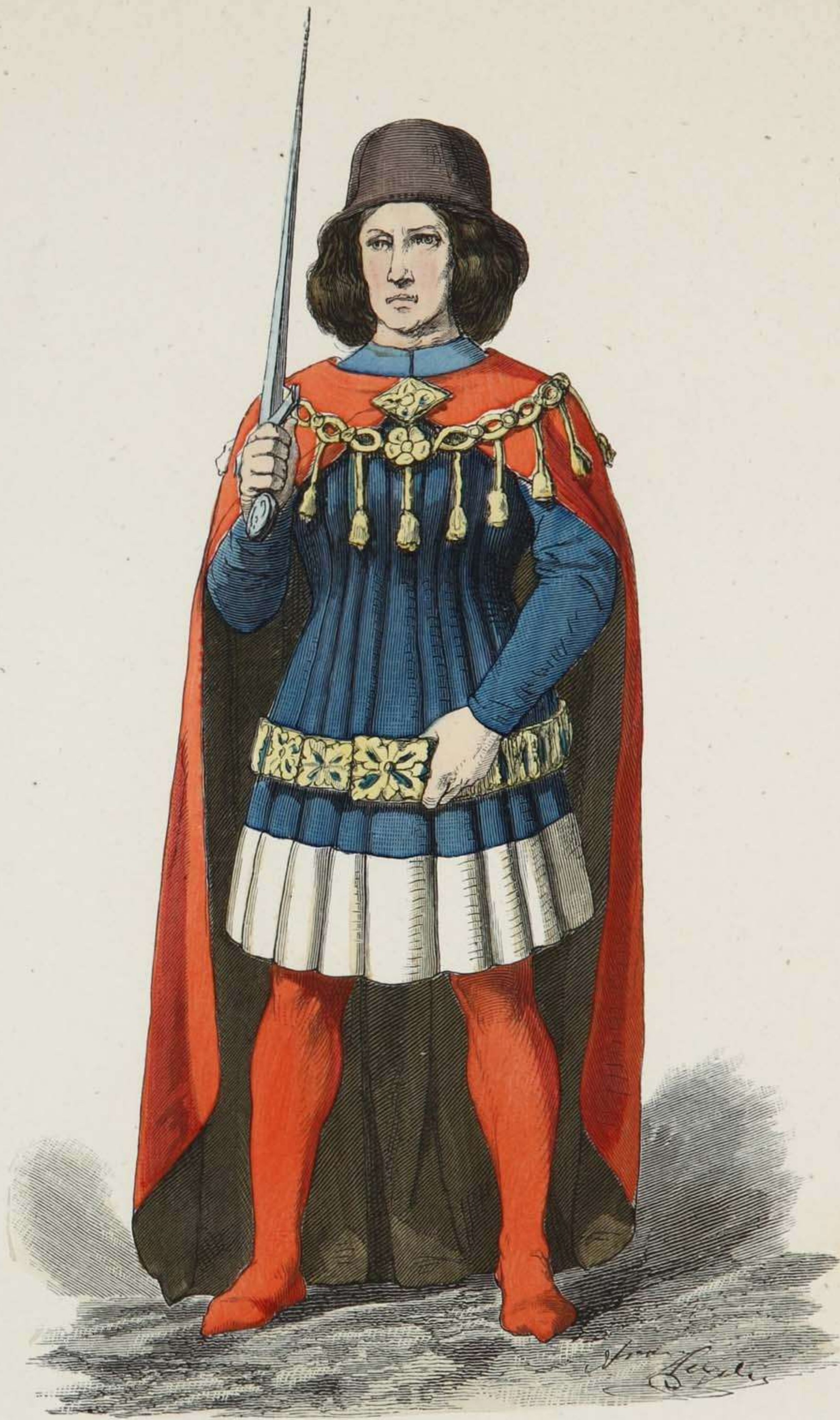
Deutscher Edler in Schellentracht.