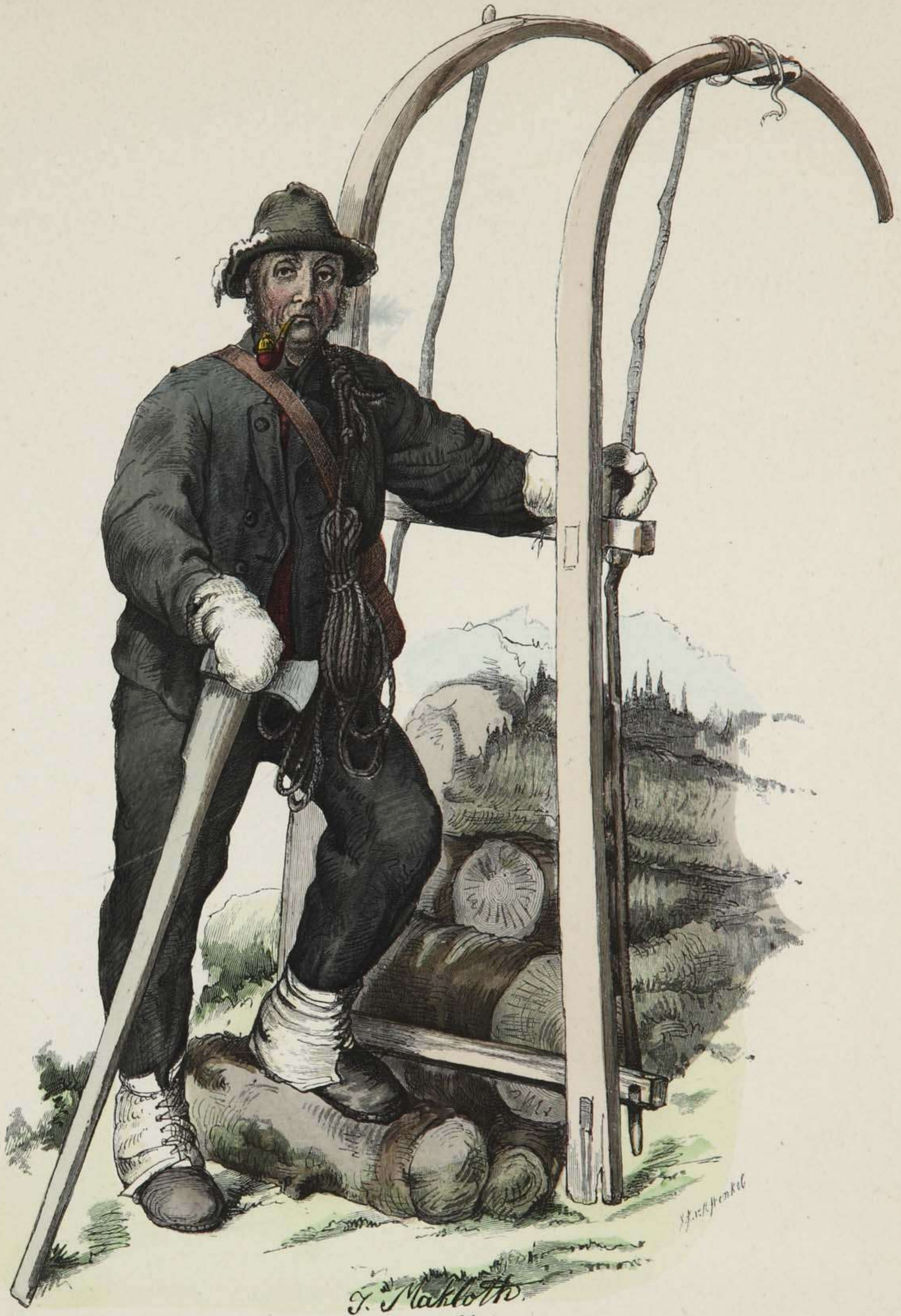
Holzschlitter aus Vorarlberg.