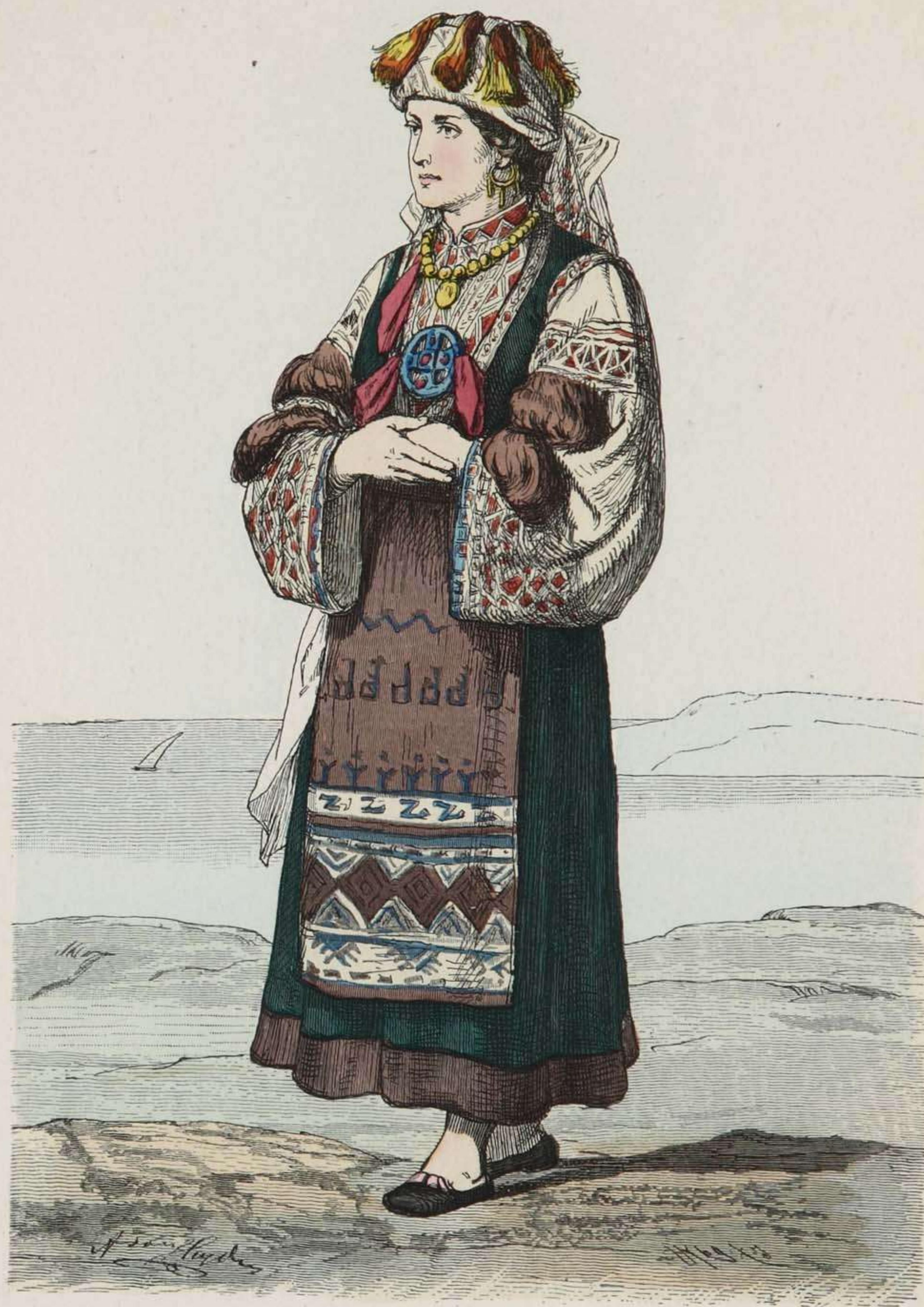
Morlachisches Mädchen (Brautkostüm) aus Istrien.