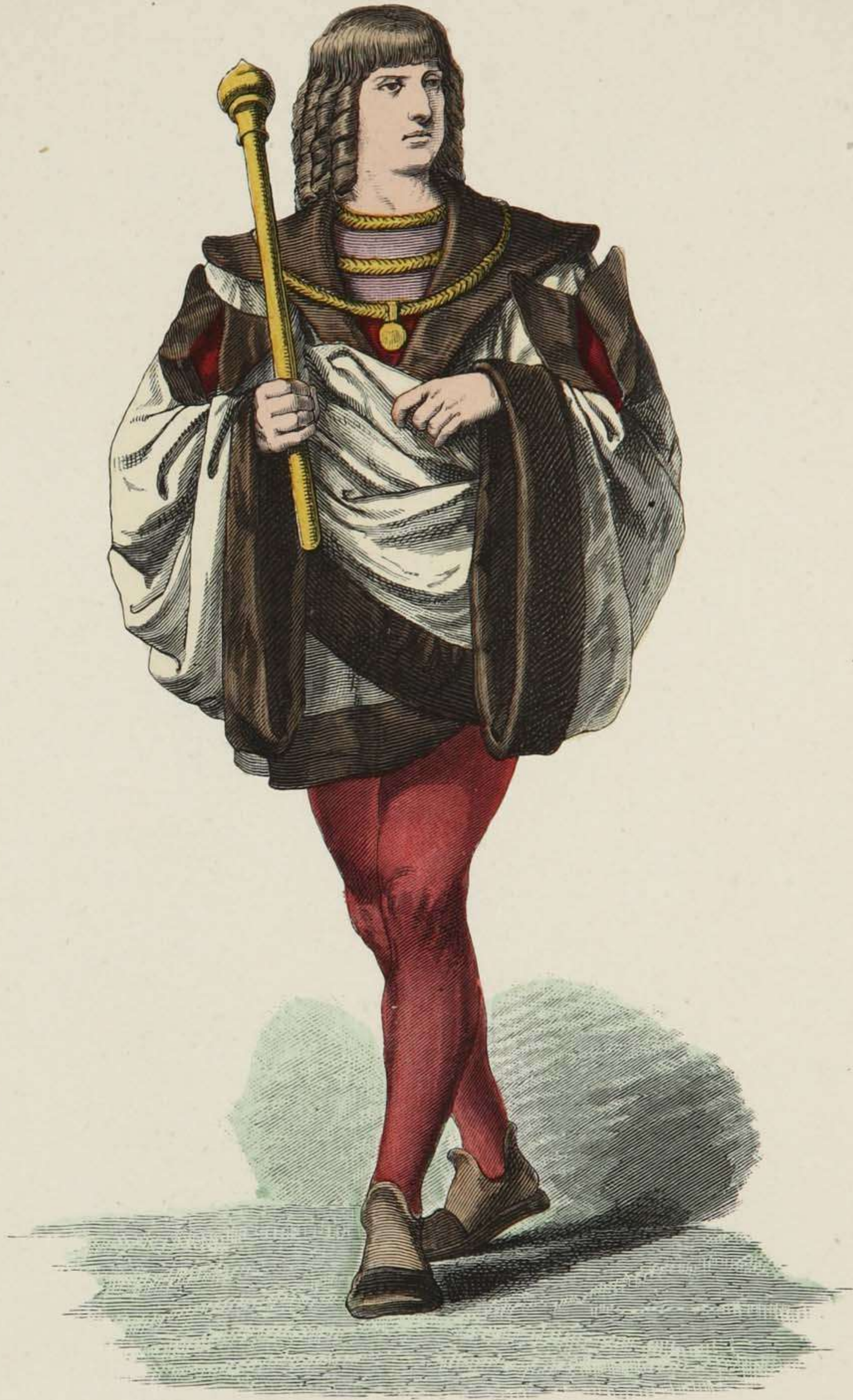
Vornehmer deutscher Mann.