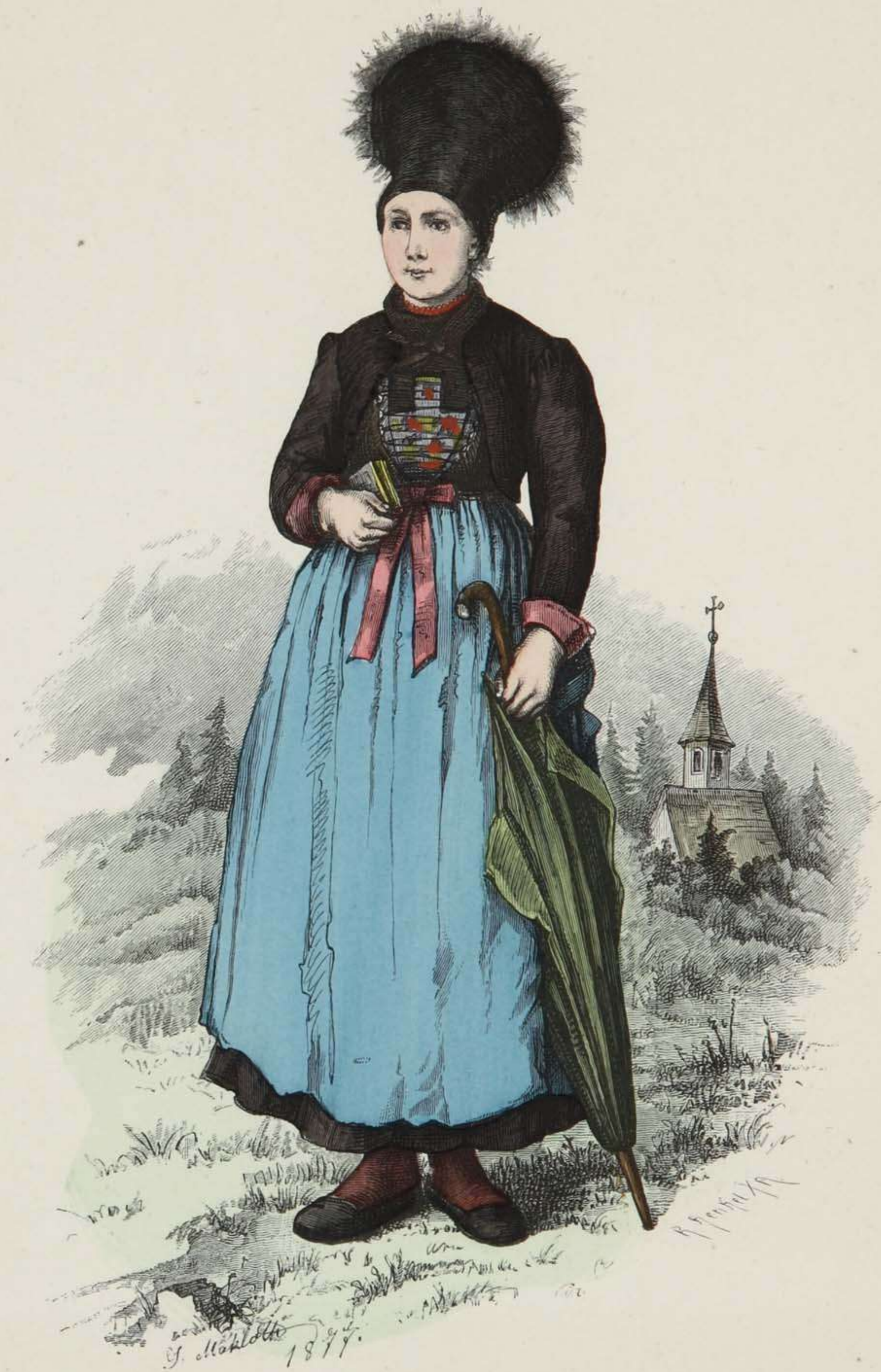
Mädchen aus Montafun in Vorarlberg.