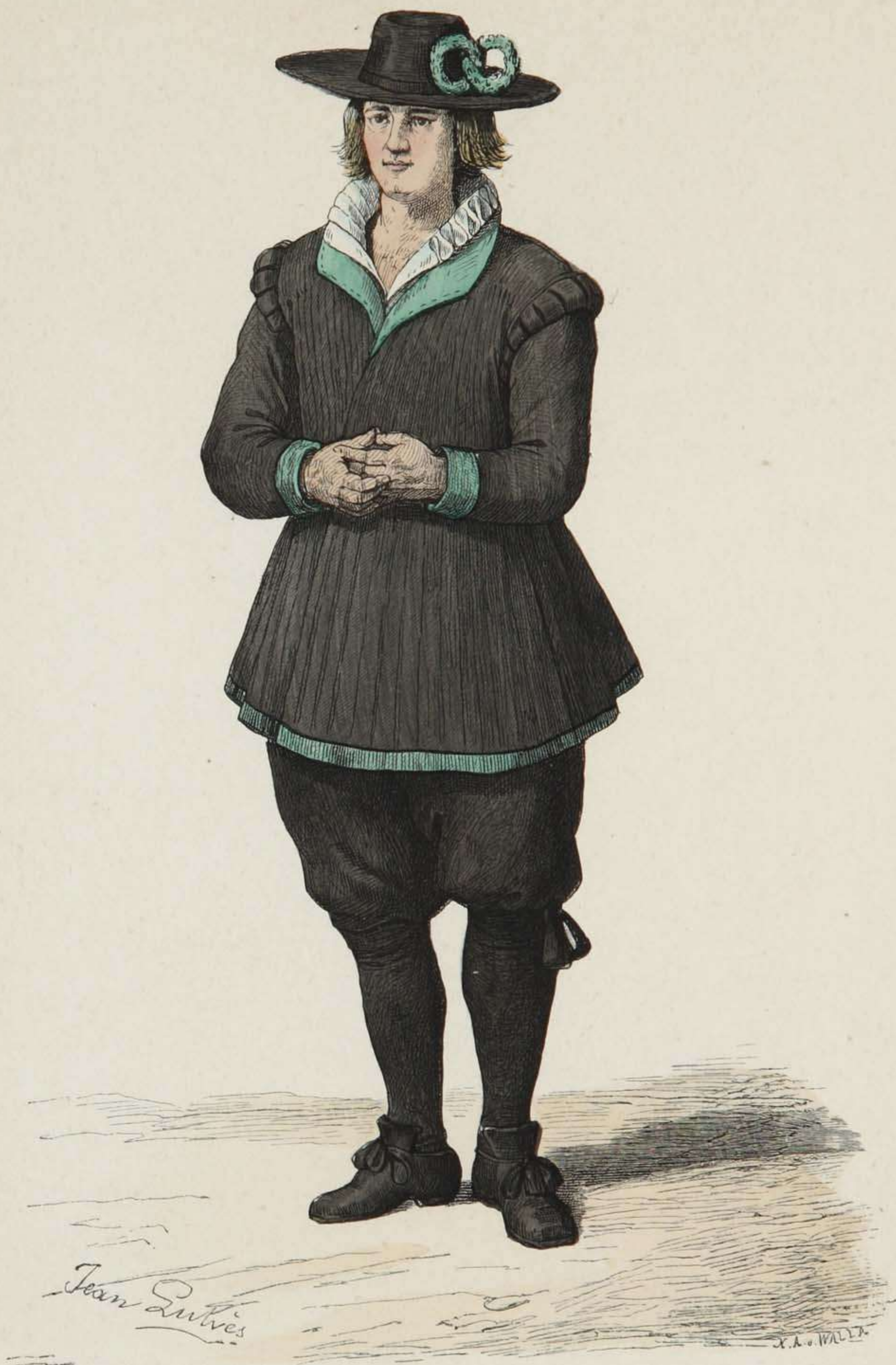
Bauernbräutigam aus der Nürnberger Gegend.