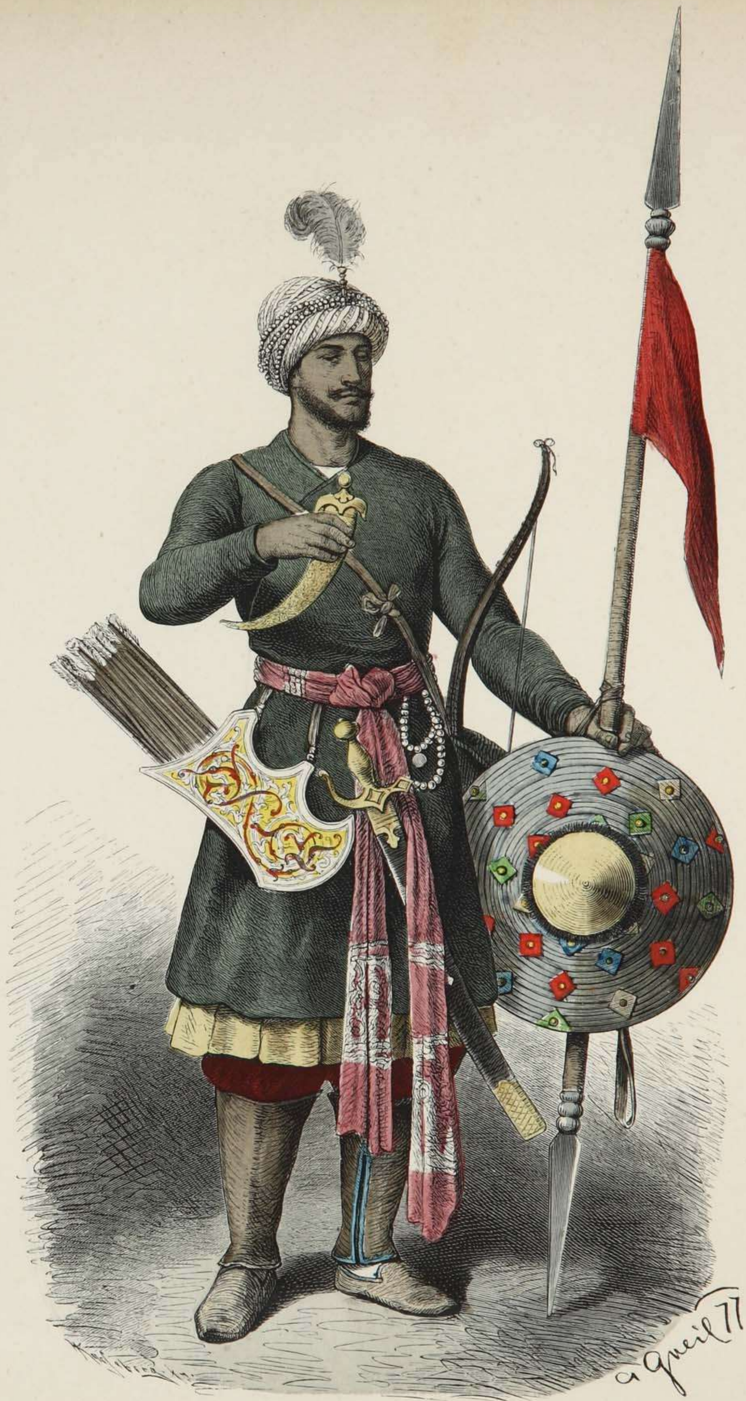
Hindu-Krieger. XV. Jahrhundert.