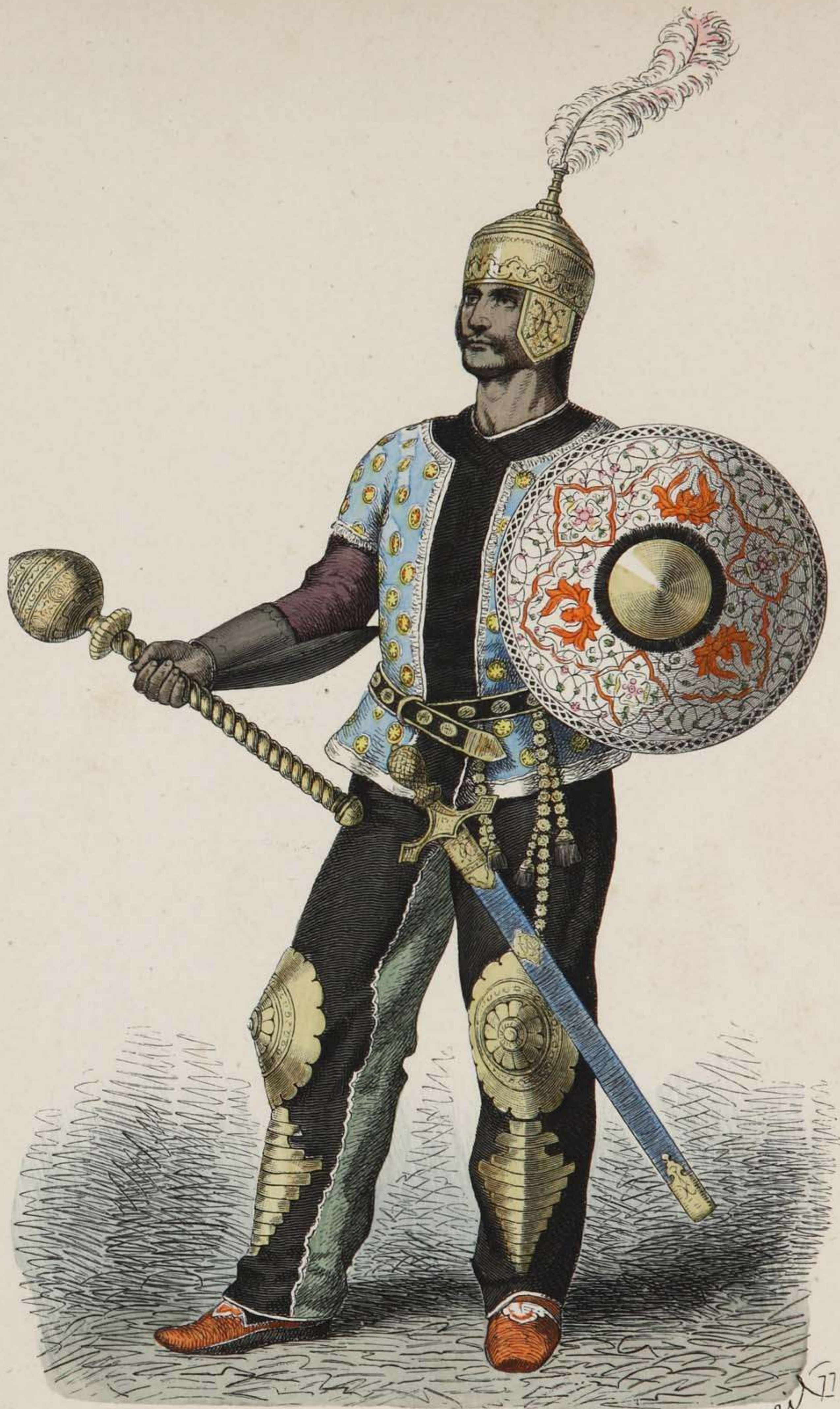
Persischer Heerführer. XV. Jahrhundert.