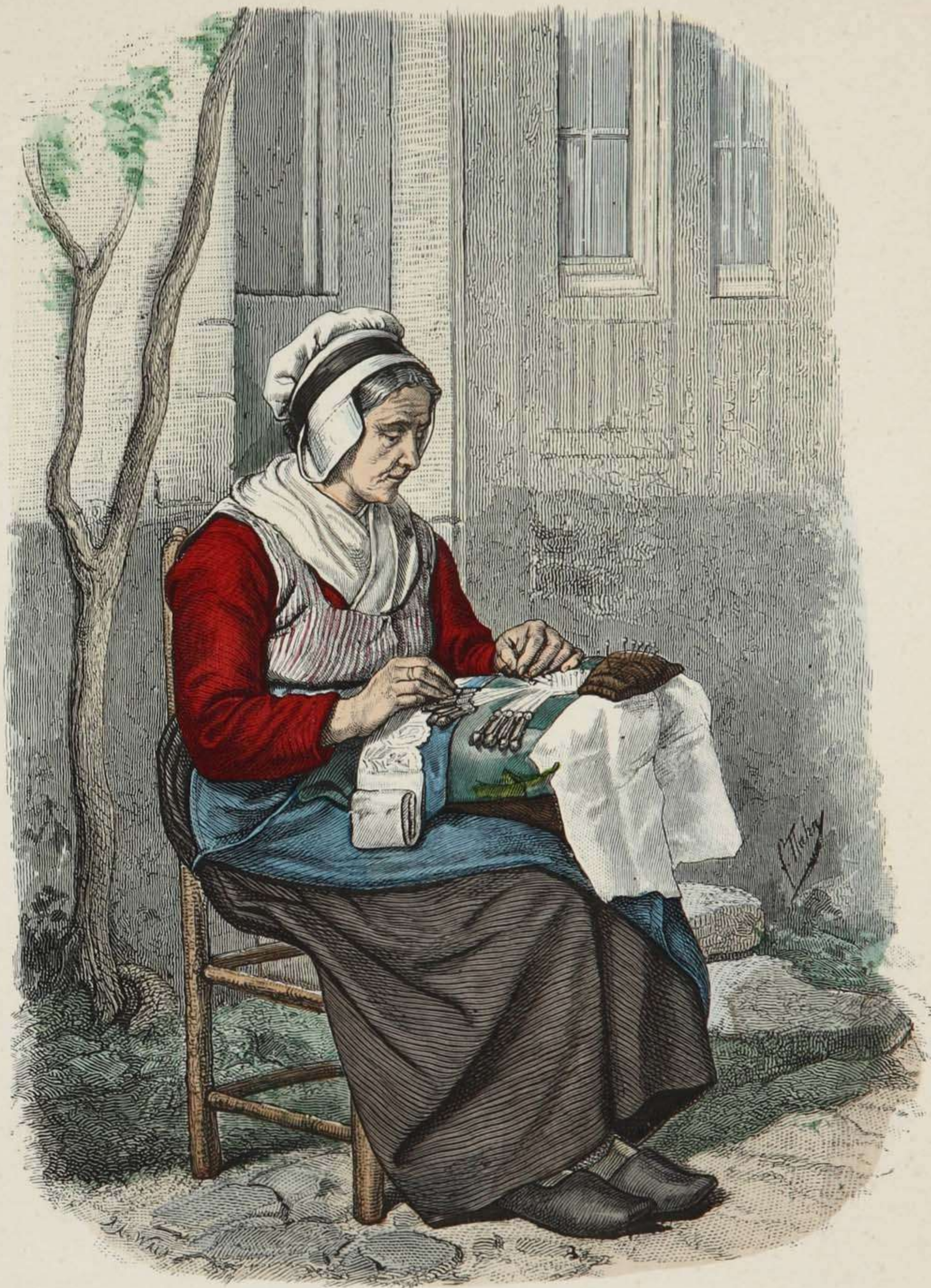
Spitzenklöpplerin aus der Umgegend von Brügge, Flandern.