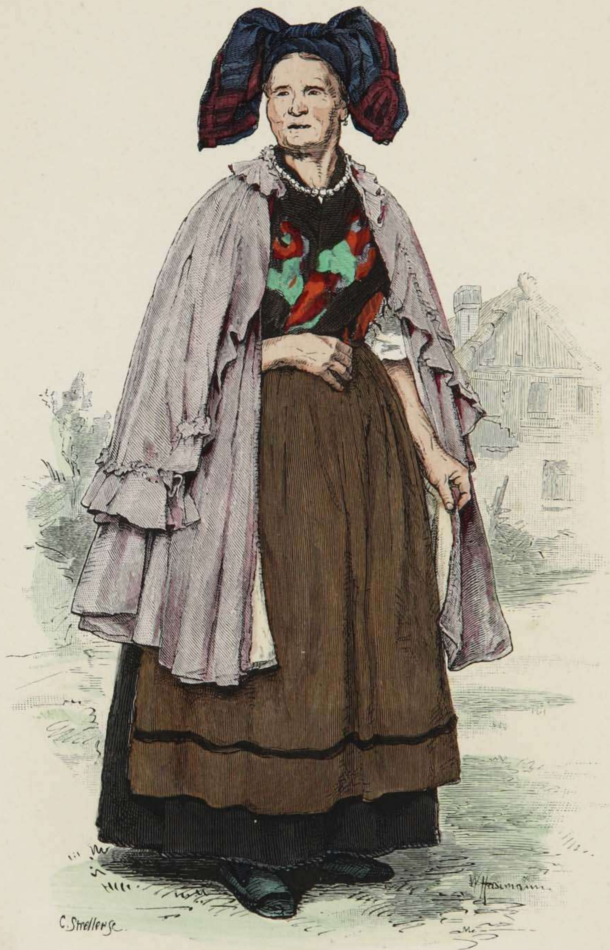
Bäuerin in Werktags-Kleidung aus der Gegend des Ettersberges, Thüringen.