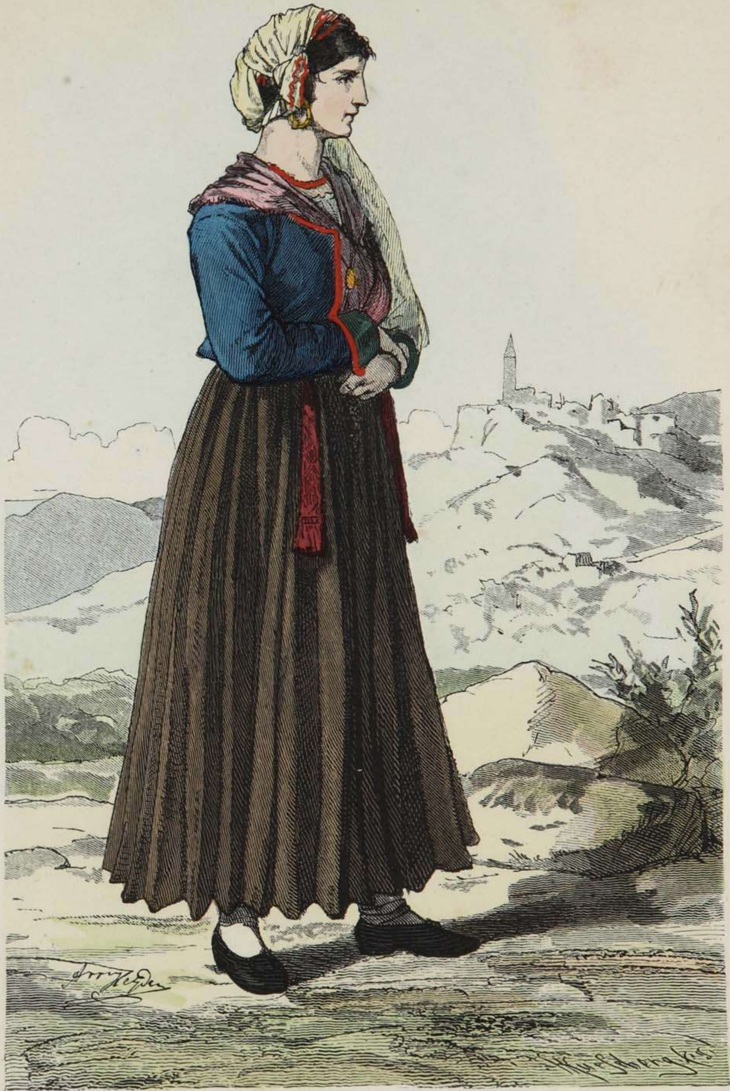
Frau aus Albona in Istrien.