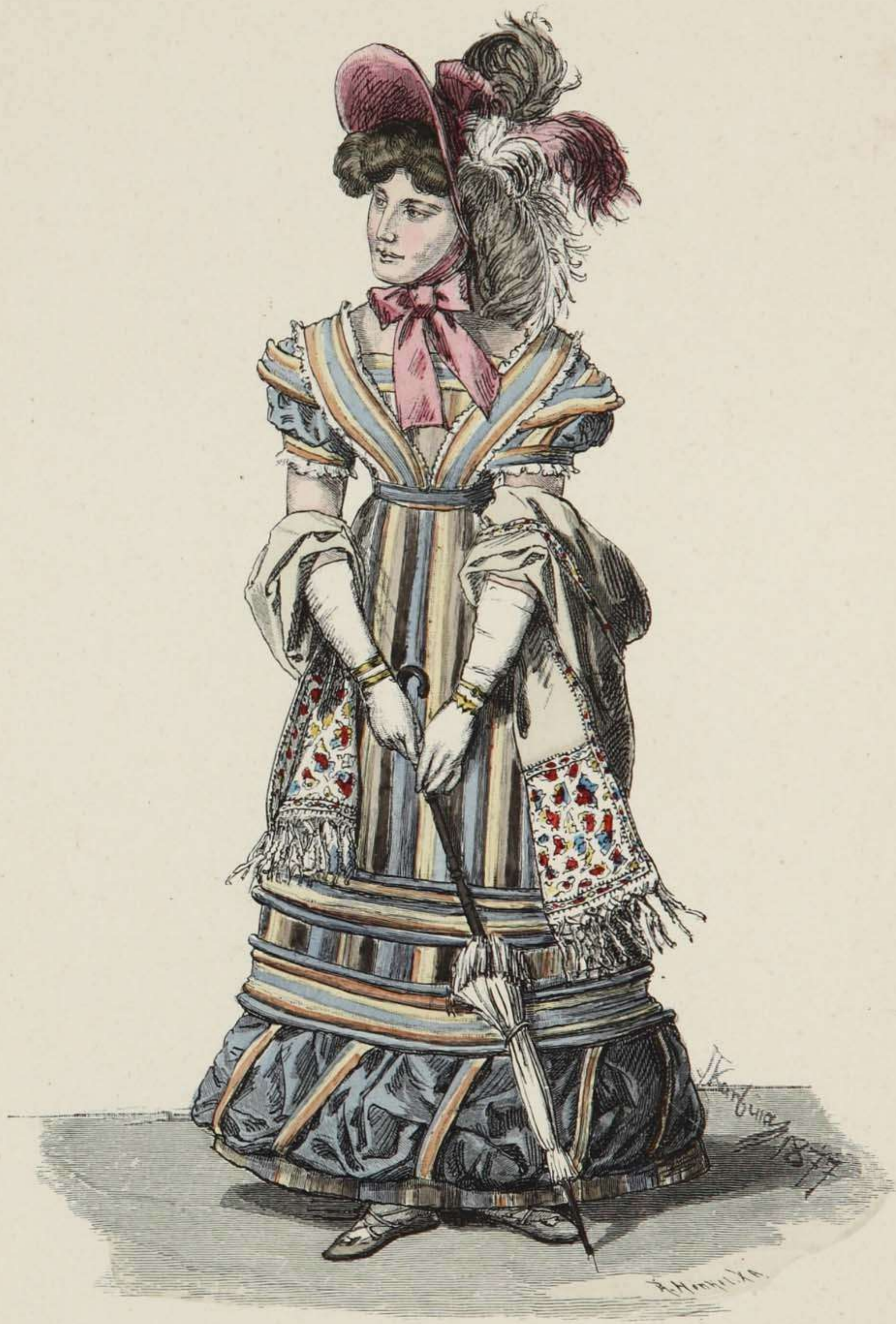
Dame in Pariser Strassen-Kostüm.