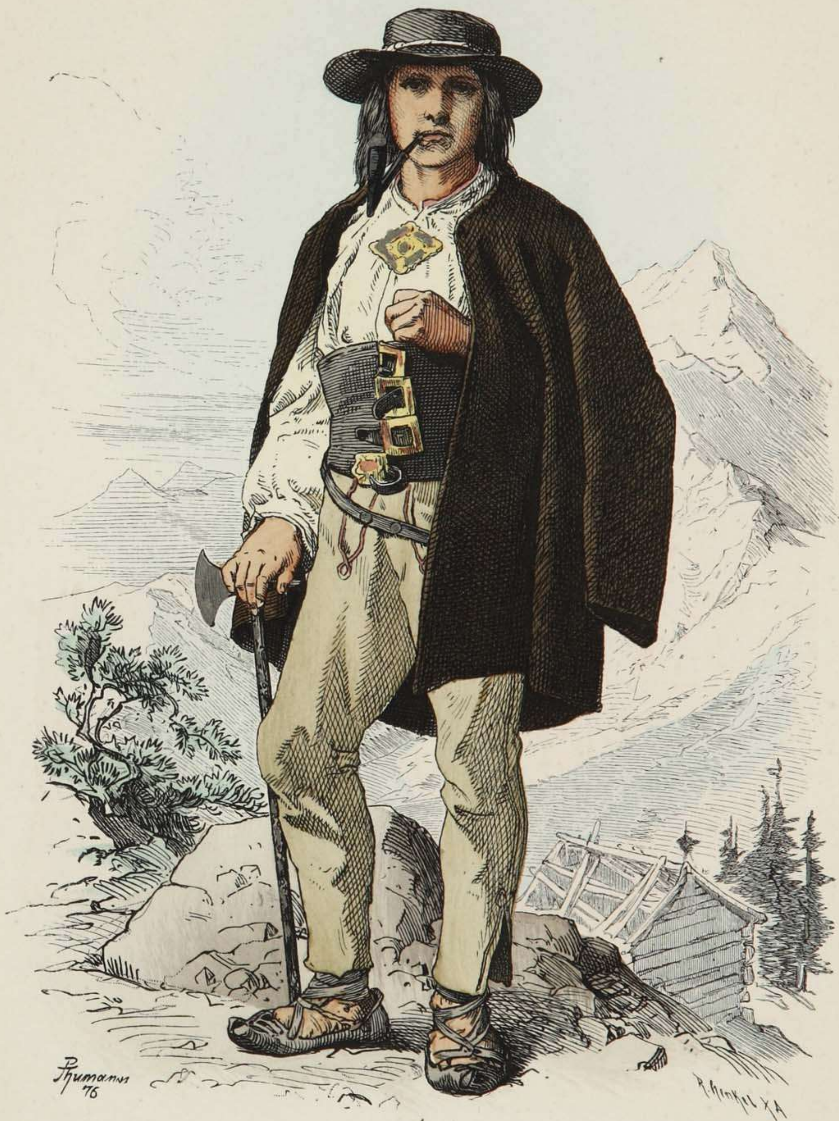
Gorale aus dem Tatra-Gebirge, Ungarn.