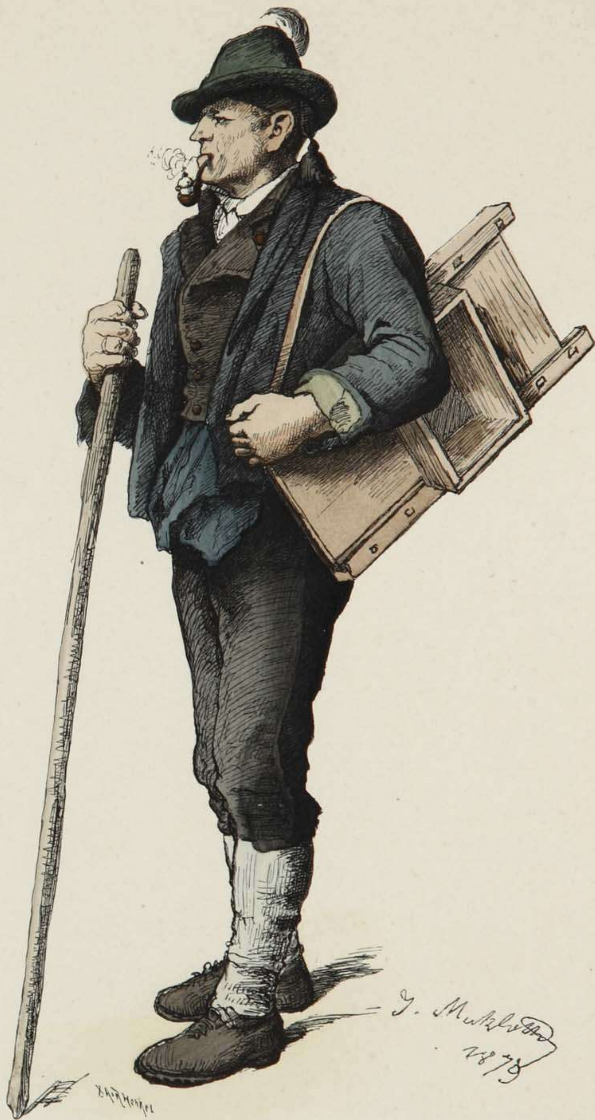
Krautschneider aus Montafun, Vorarlberg.