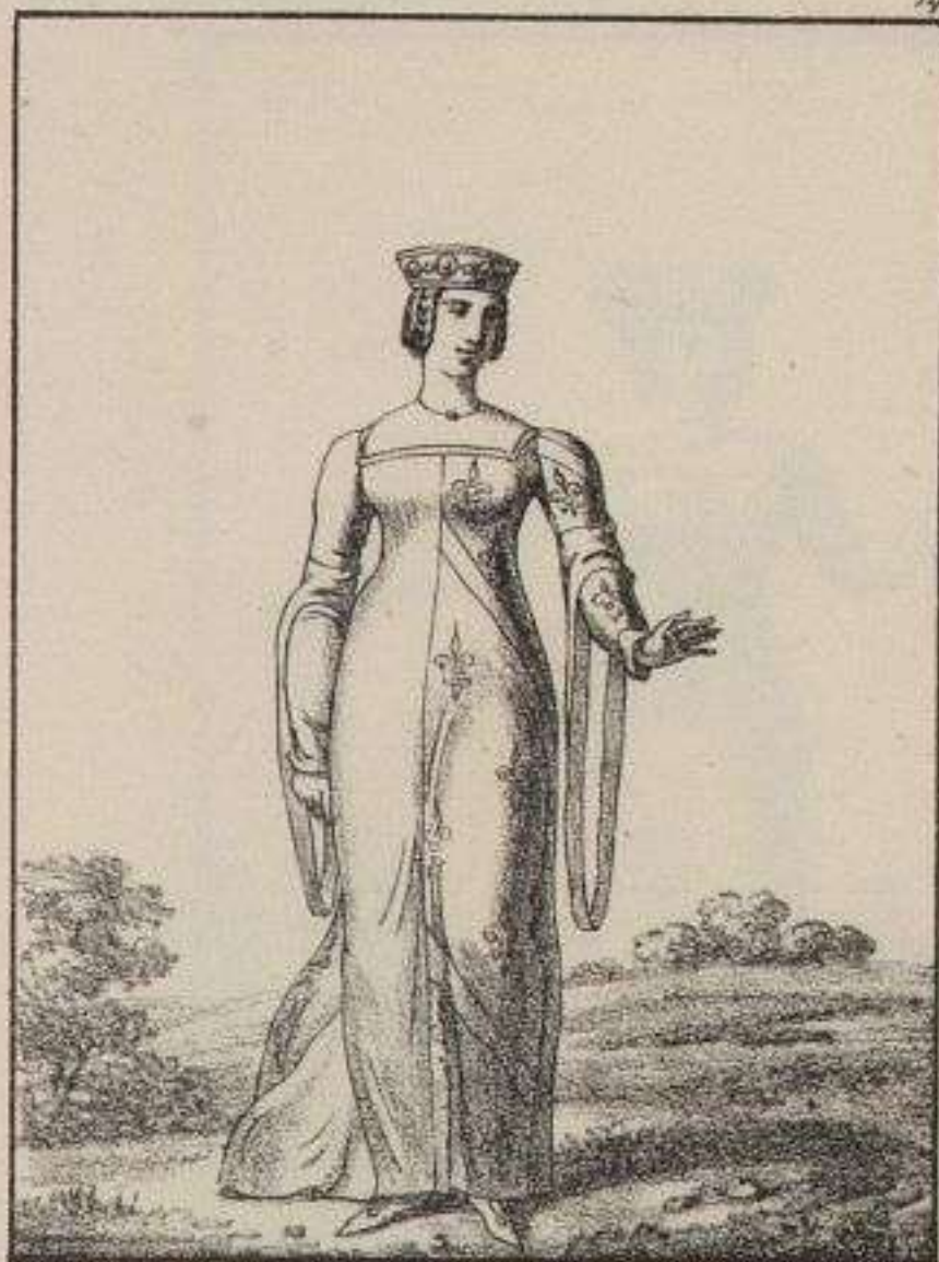
Marguerite de Bourbon. 1370.