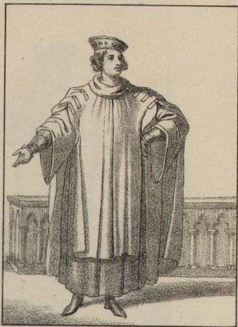
Chancelier de France. 1470.