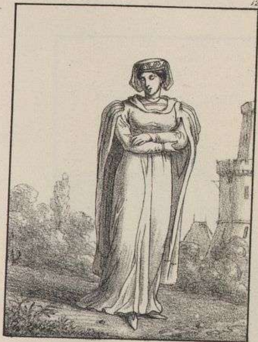
Femme du haut rang. de 1300. à 1330.