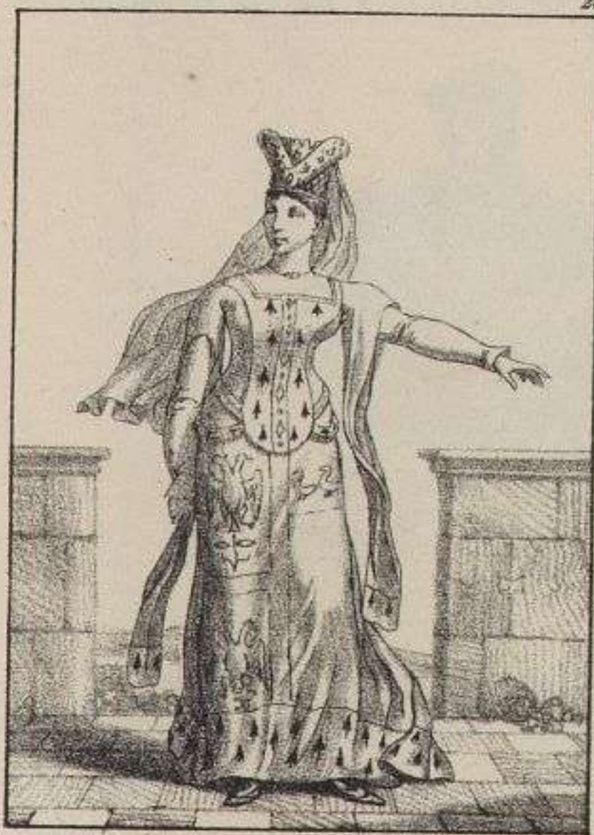
Princesse de la Cour. 1395.