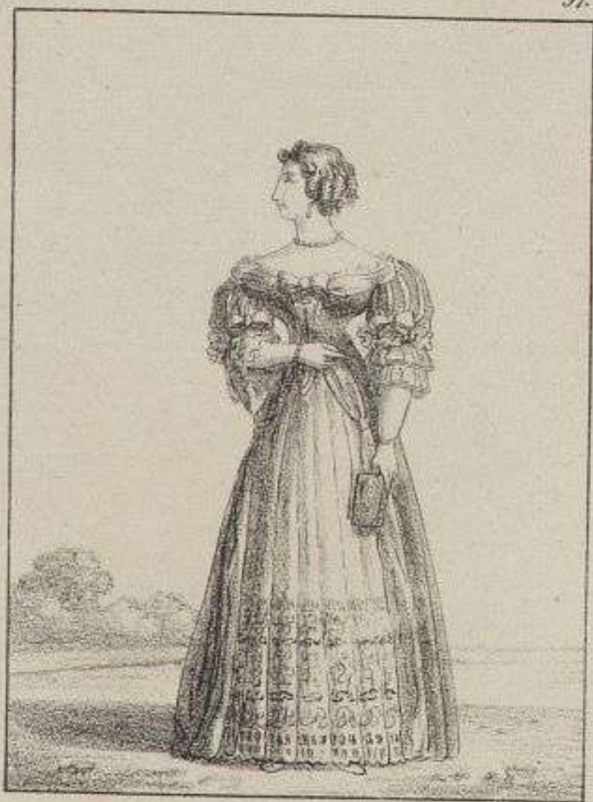
Madame de Maintenon.