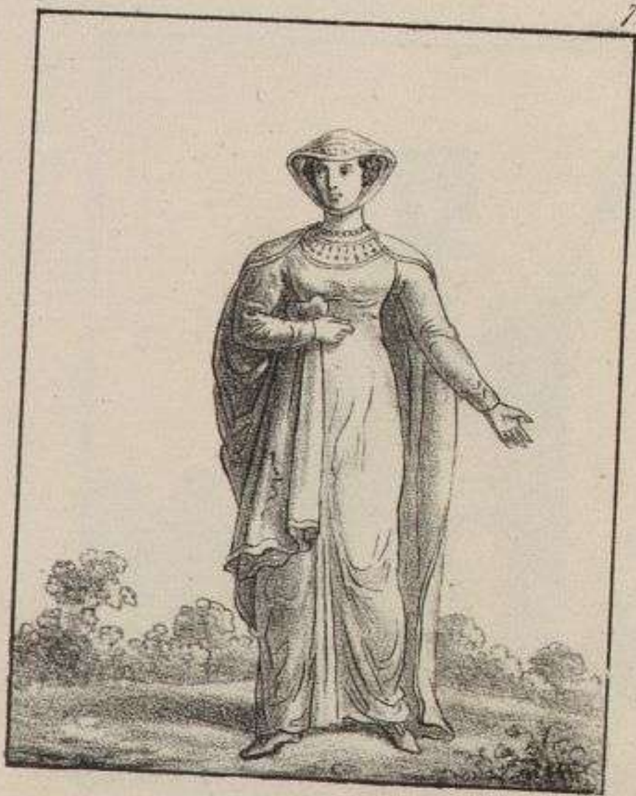
Dame de la Cour. 1280.