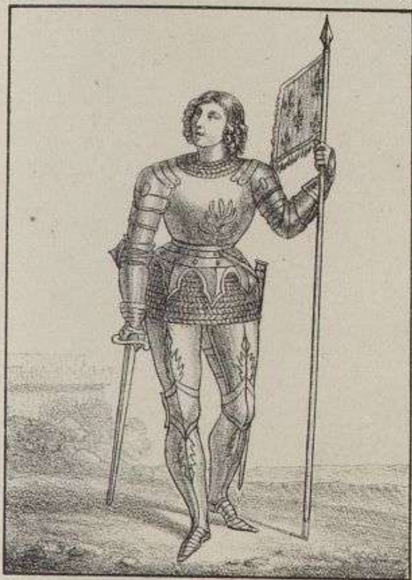
Jeanne d'Arc. 1430.