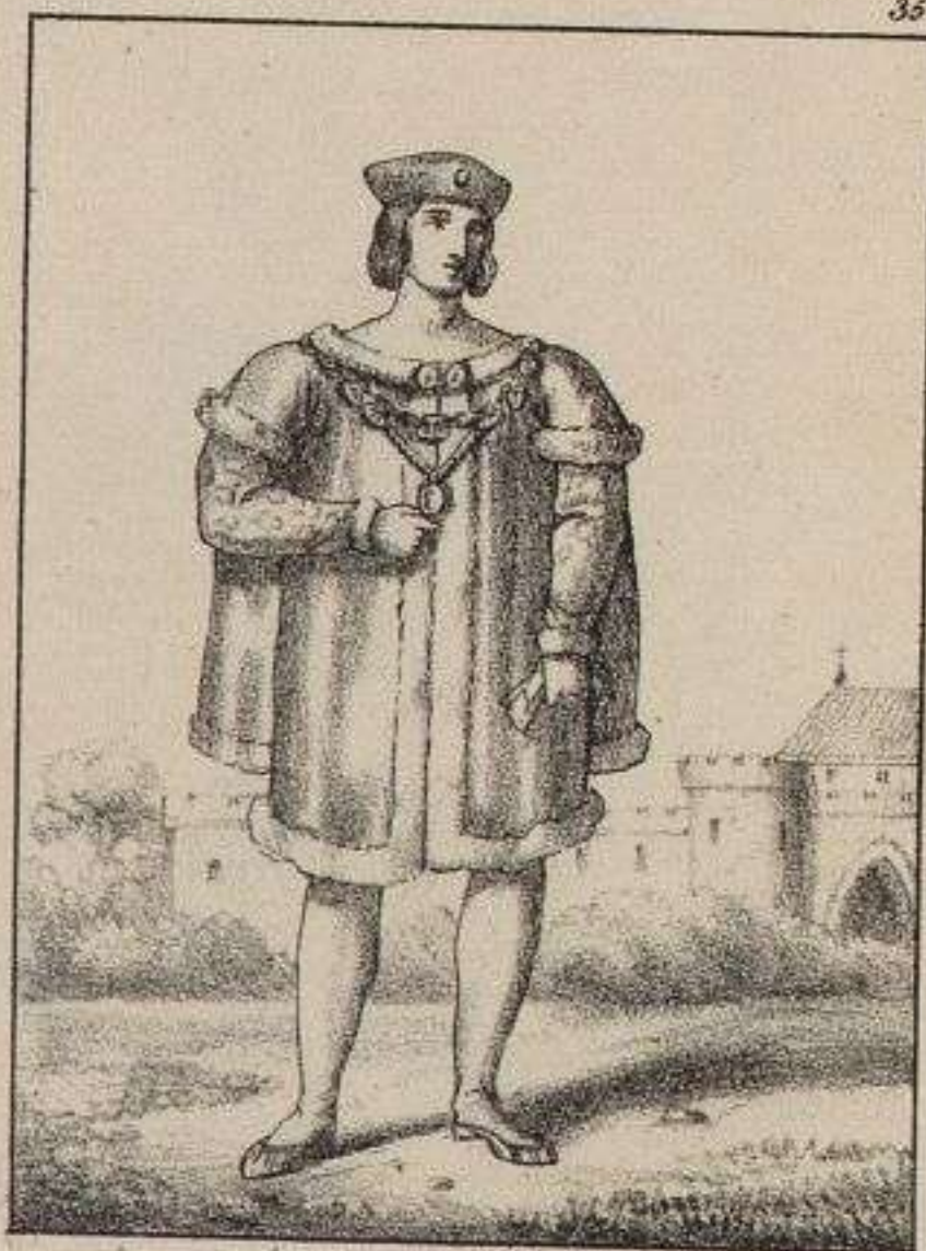
Charles VIII Roi de France. 1490.