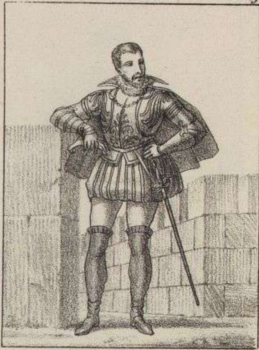
Louis, Duc de Bourbon.