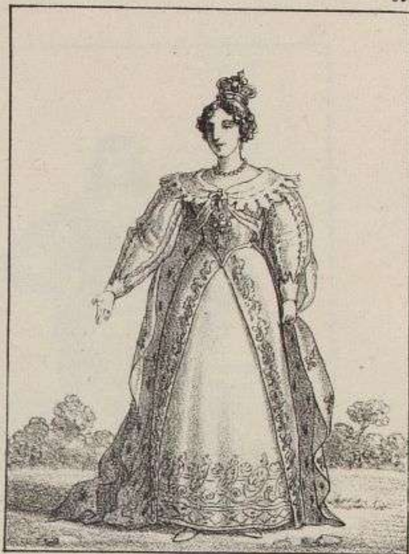
Anne d'Autriche, Reine de France.