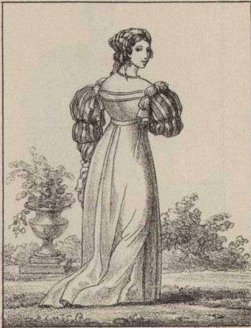
Dame de la Cour.