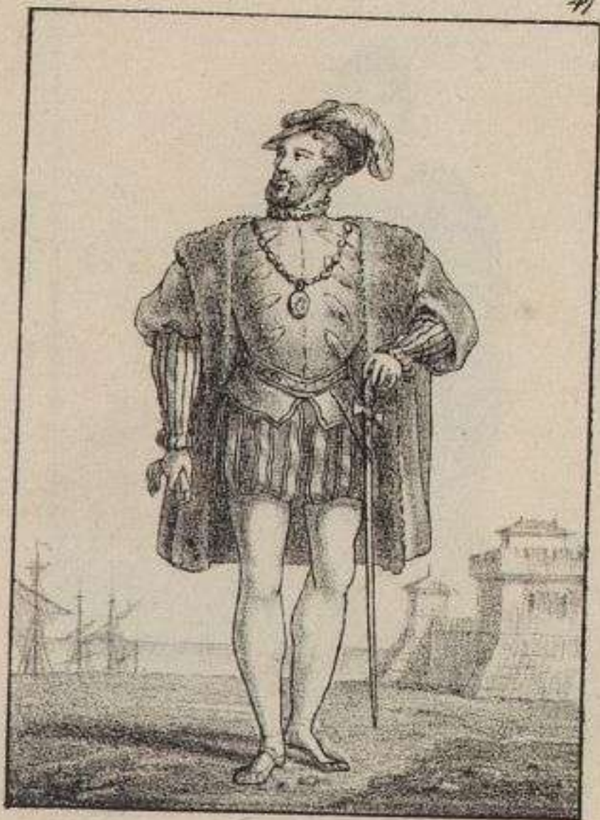
Amiral de France.