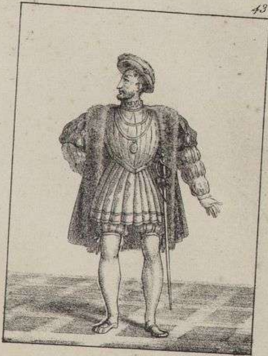
François 1 er Roi de France.