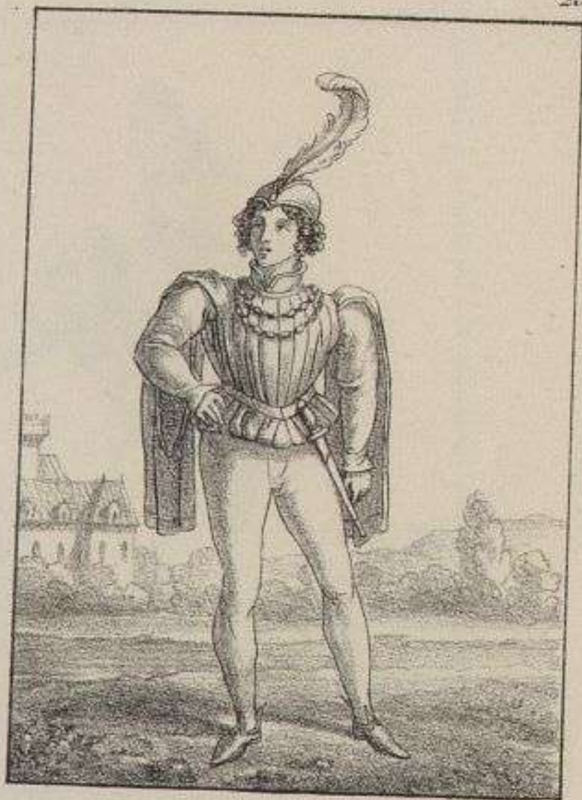
Page du Roi Charles VII.