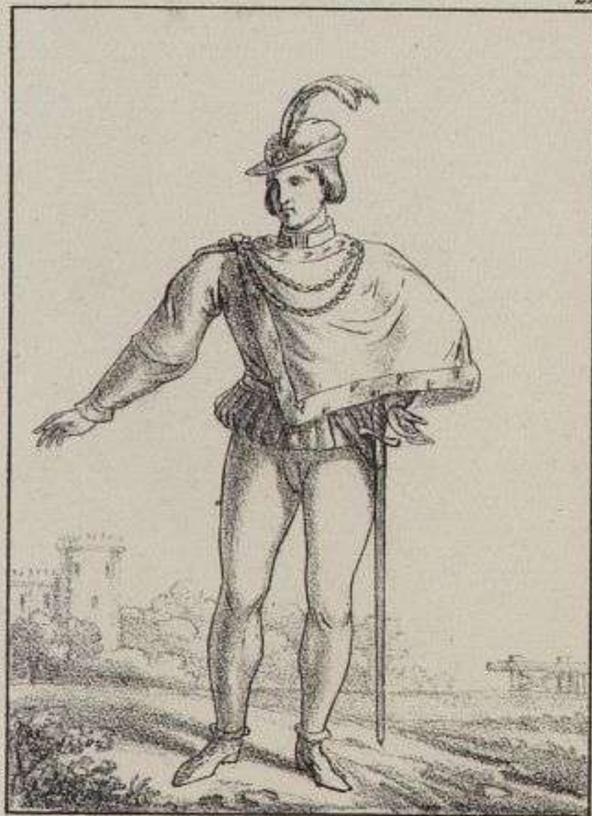
Gerard, Comte de Nevers. 1440.