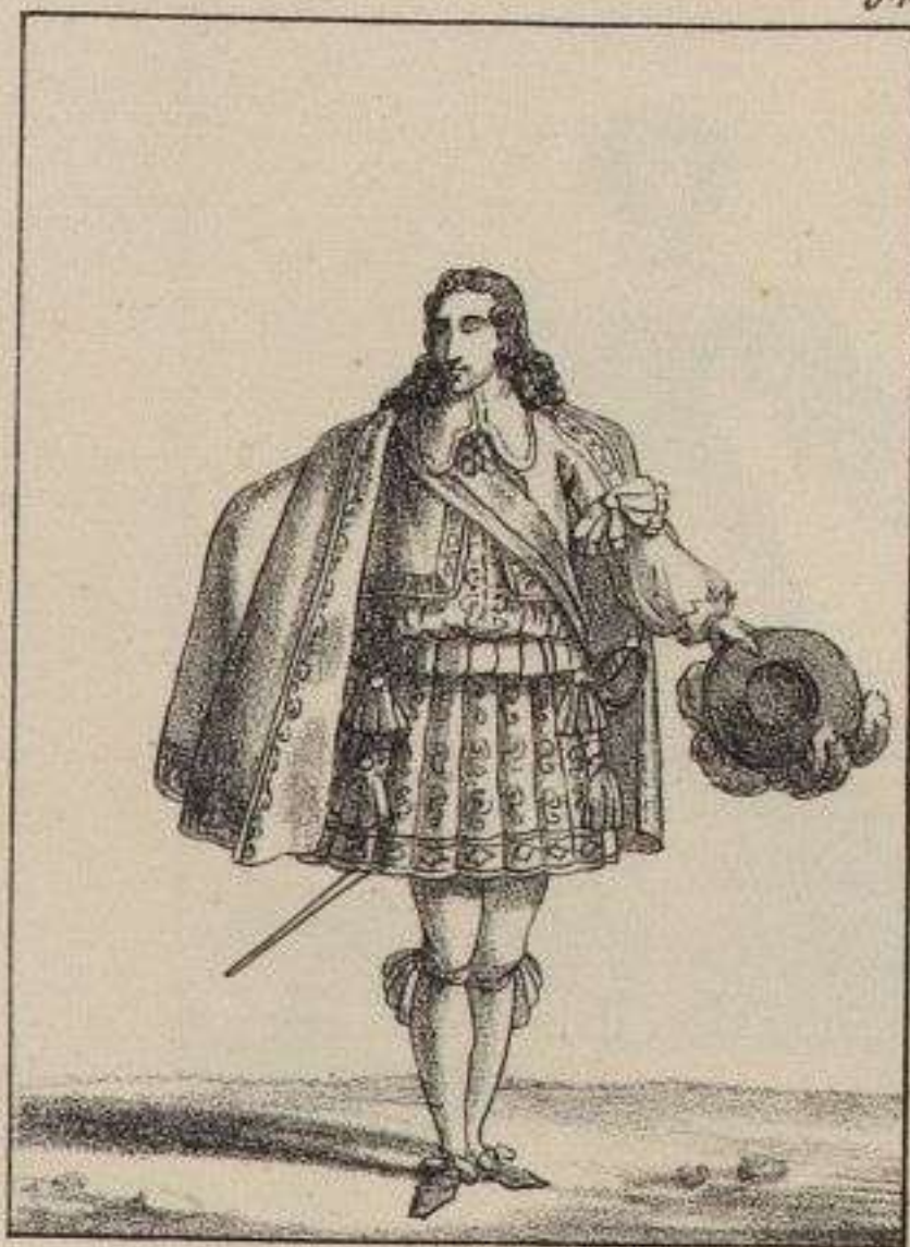
Philippe d'Orléans, Duc de Chartres.