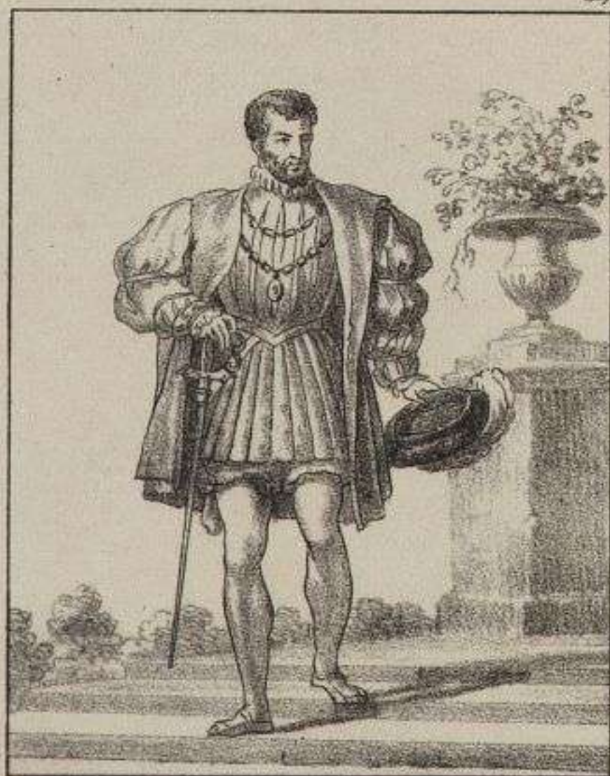
Henry d'Albret Roi de Navarre.