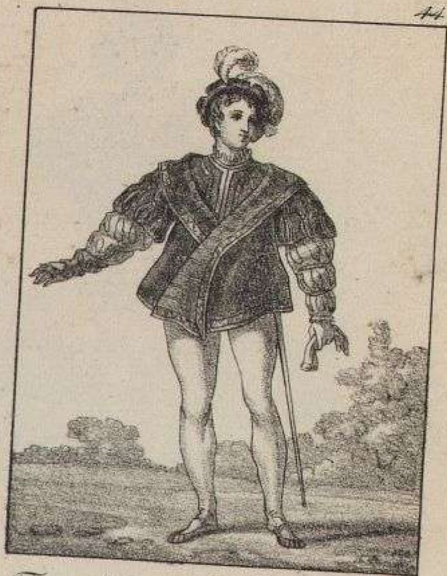
François Dauphin, Duc de Bretagne.