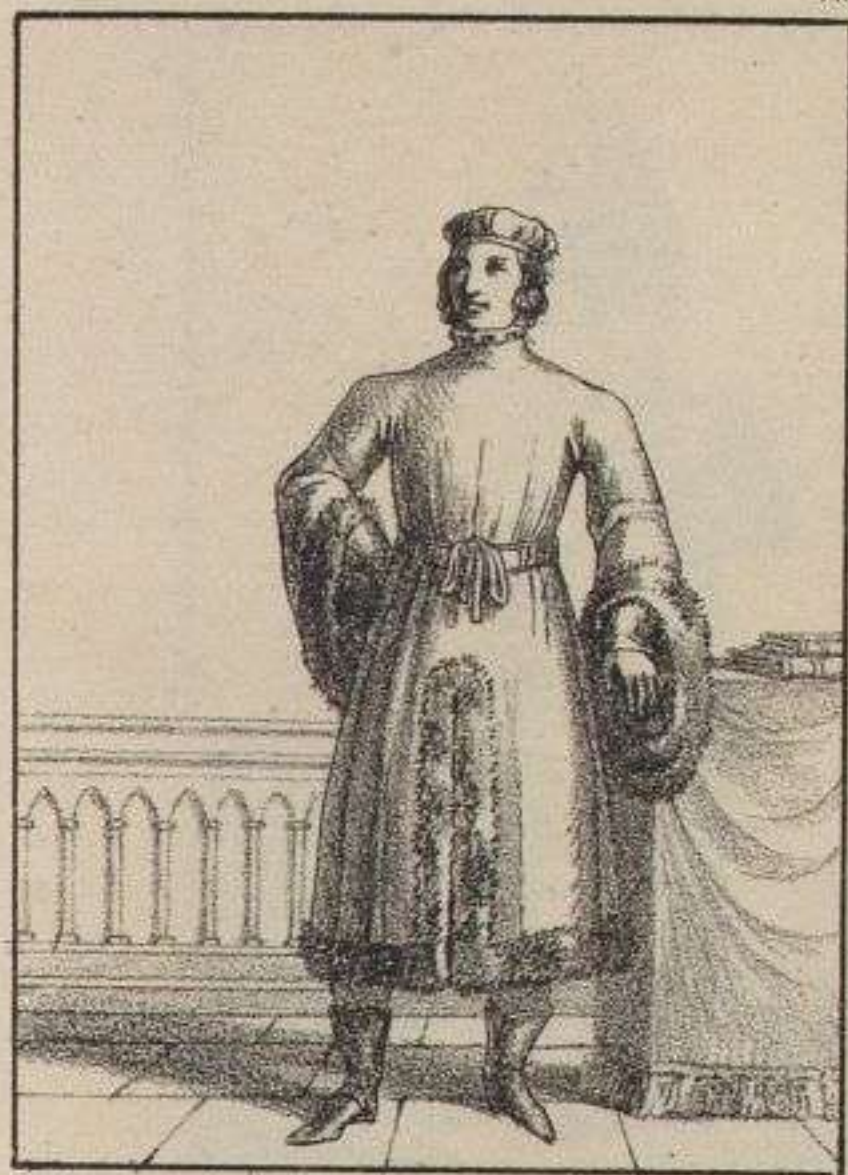
Conseiller du Roi. 1375.