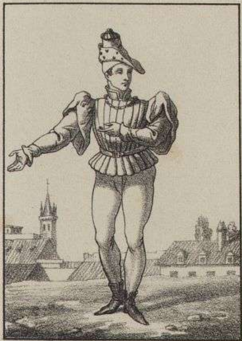
Costume des hommes à la ville.