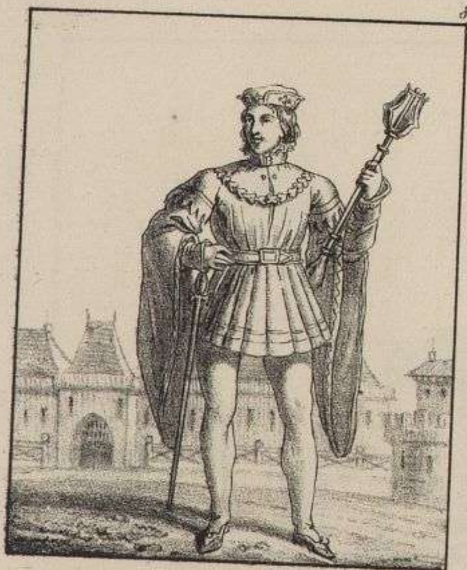
Sergent d'Arme. 1280.