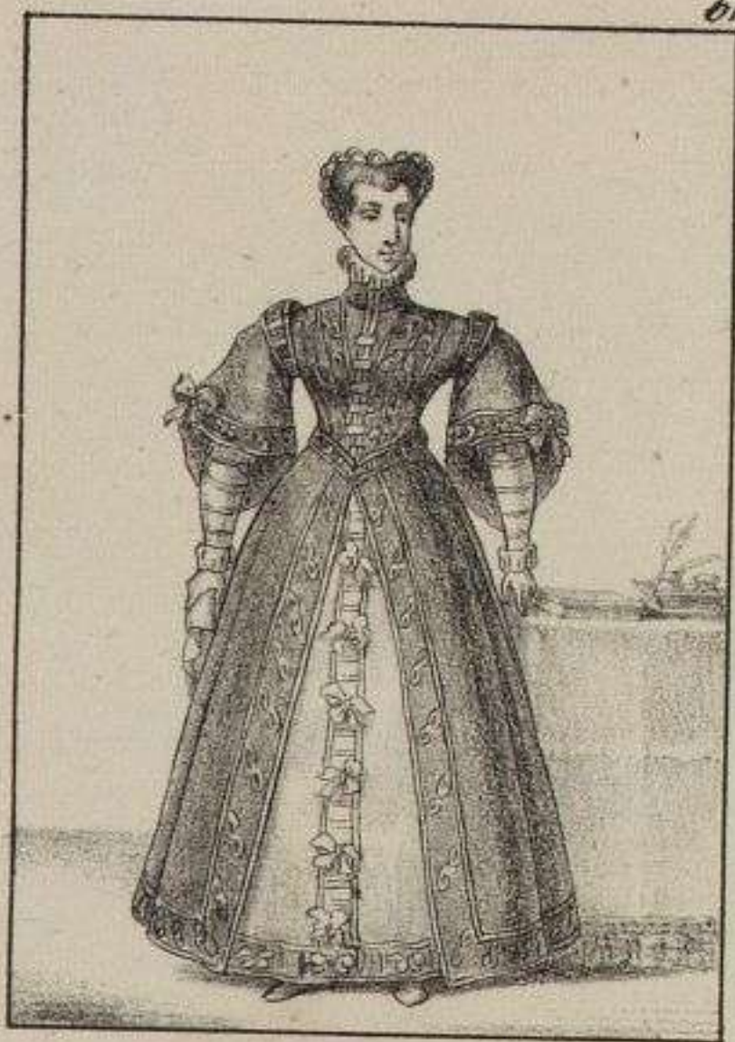
Elisabeth de France.