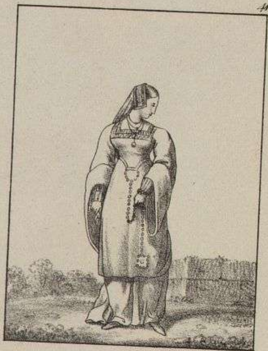
Costume de Jeune fille.