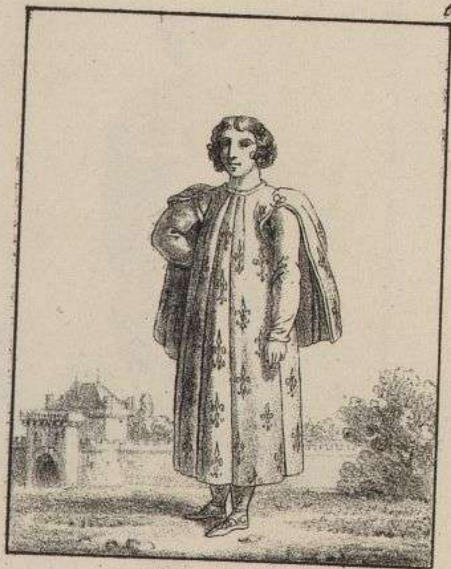
Fils de France.