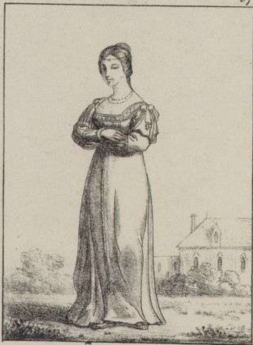
La jécennière M. de de François 1. er