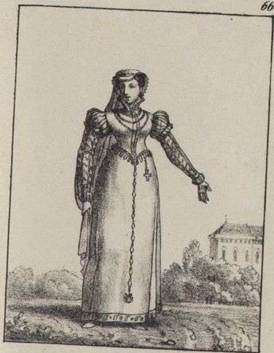
Marie Stuart, Reine de France et d'Écosse.