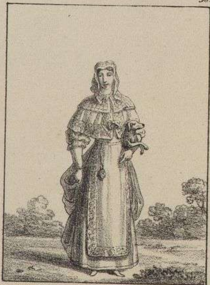
Dame en deshabille du matin.