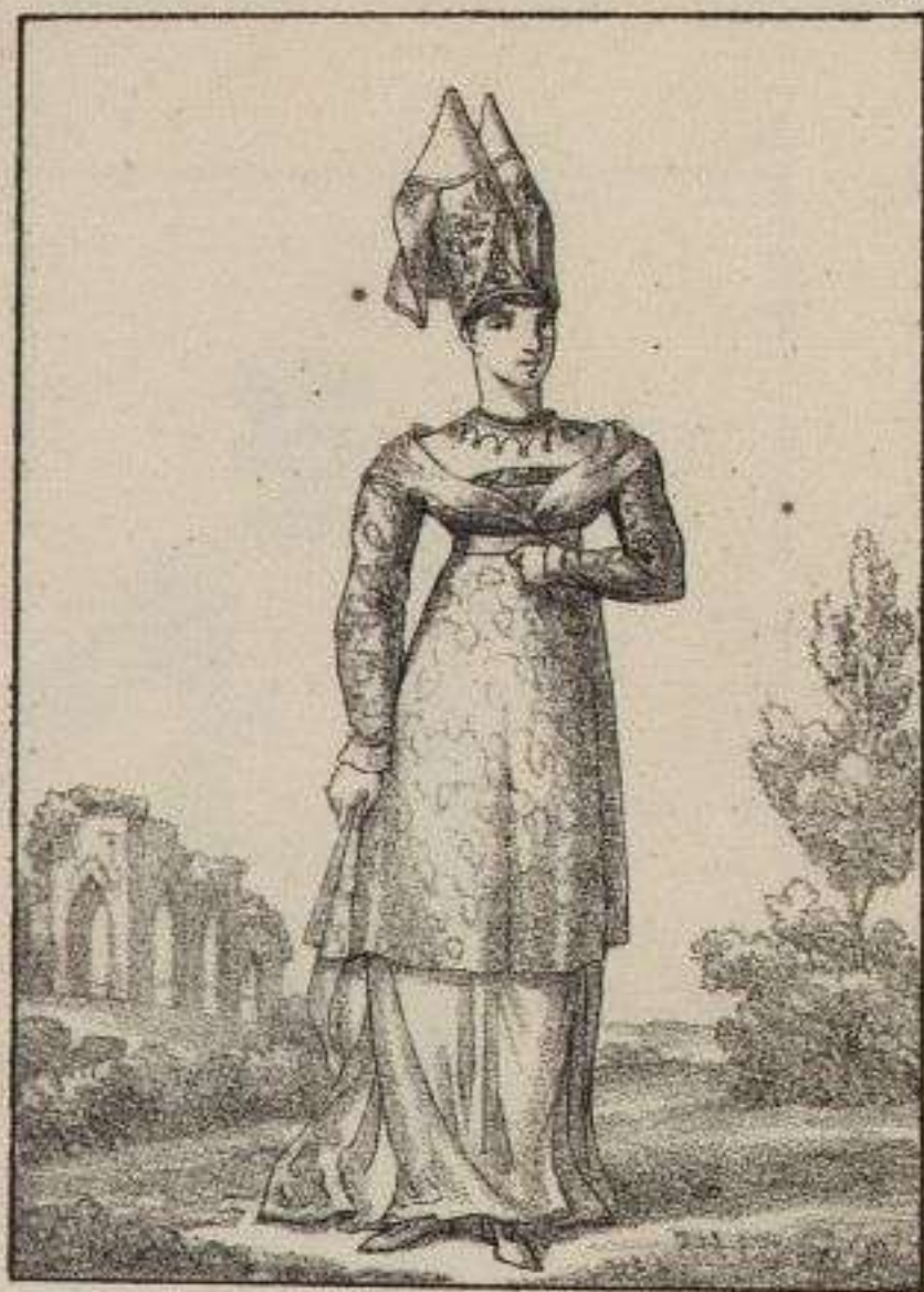
Dame de la Cour. 1890.