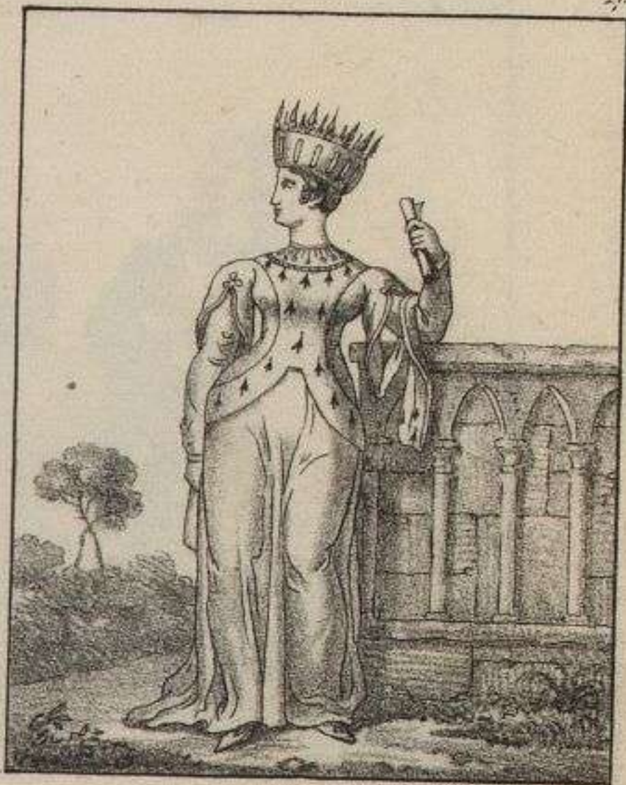
Princesse de la Famille Royale. 1240.