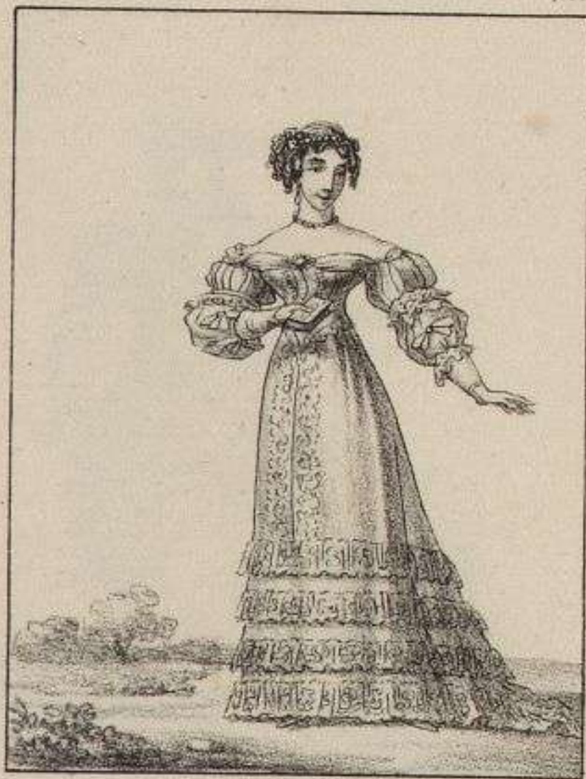
Dame de la Cour de Louis XIV.