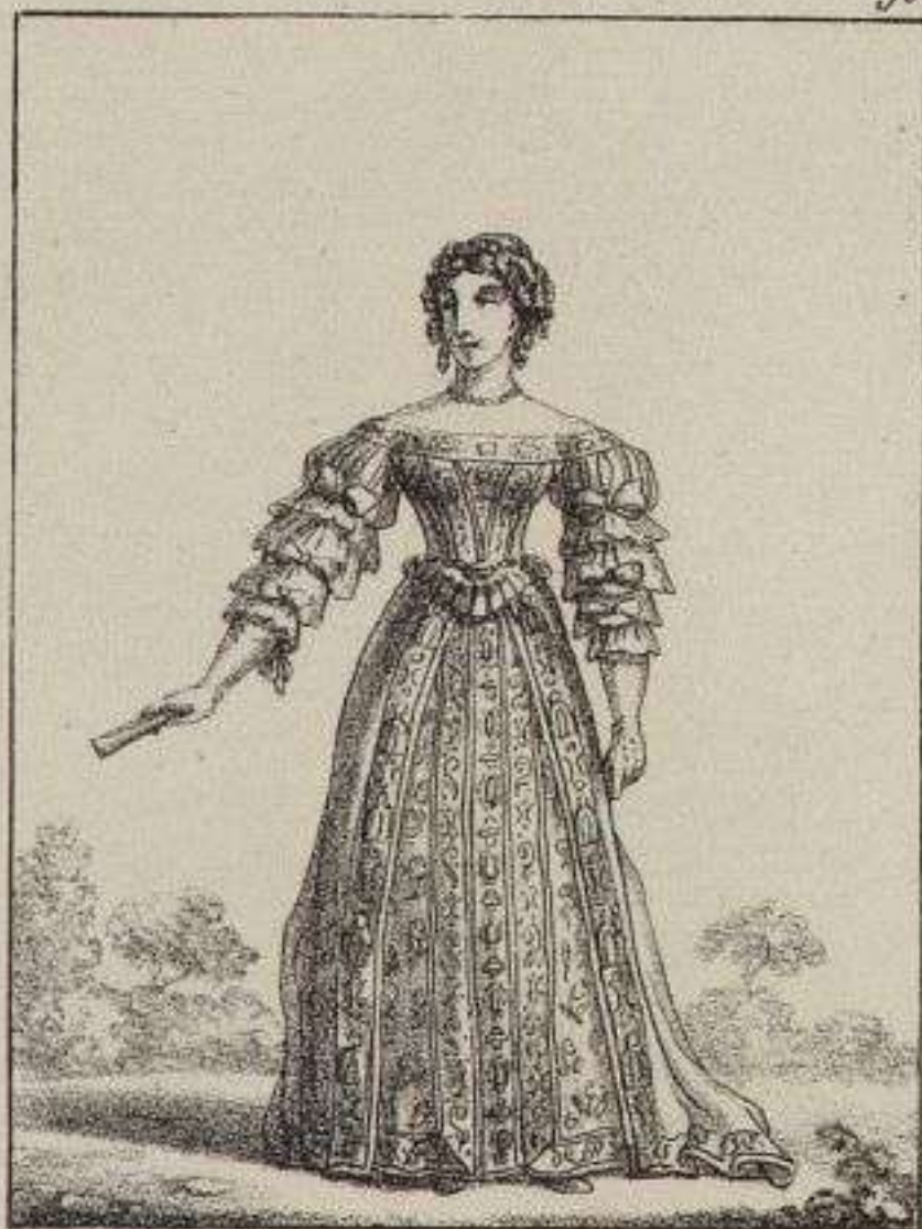
Marie Thérèse d'Autriche. Reine de France.