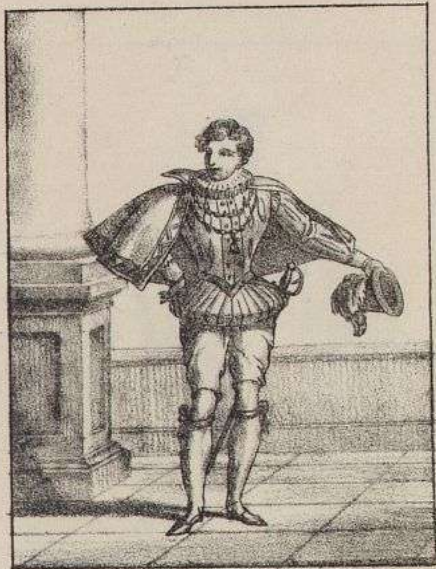
Page du Roi Henry III.