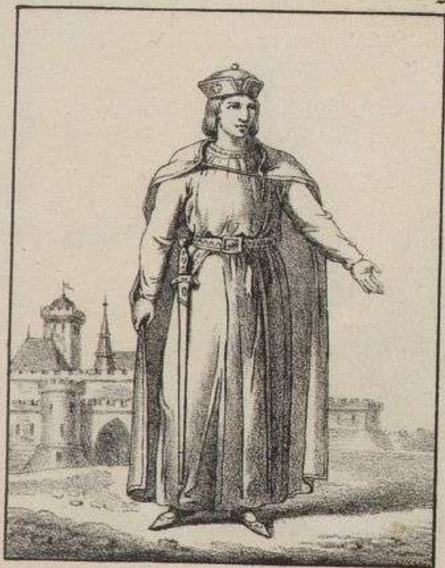
St. Louis. Roi de France.