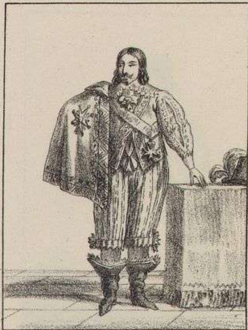
Louis XIII Roi de France et de Navarre.