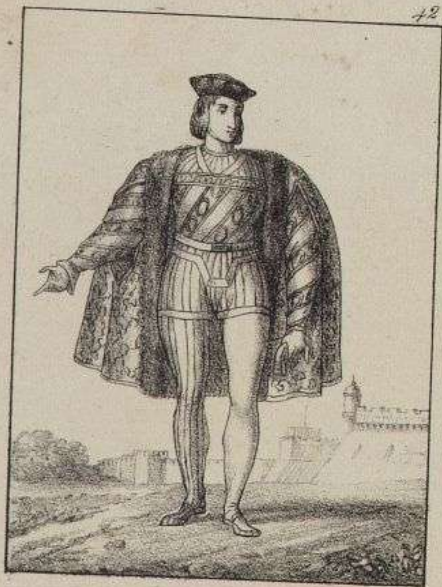
Charles d'Amboise. 1512.