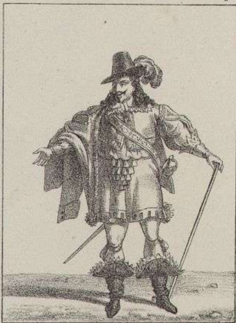
Seigneur de la Cour d'Anne d'Autriche.