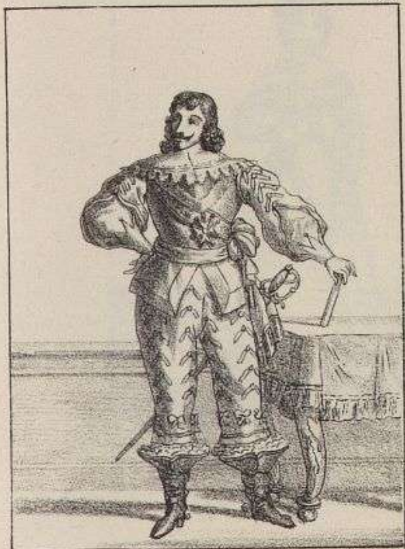
Gaston de France, Duc d'Orléans.