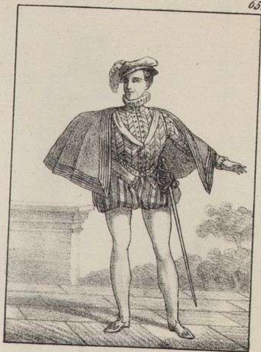
Francis II. Roi de France.