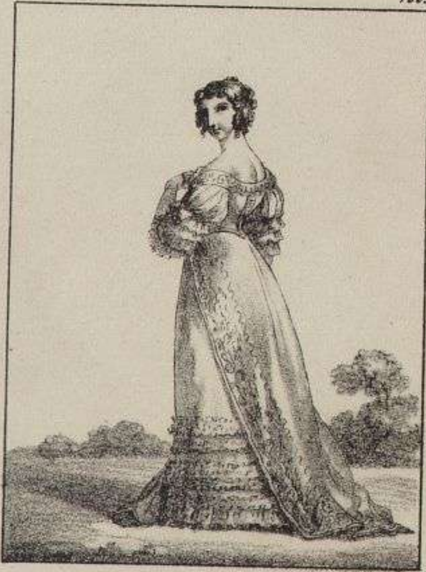
Nonon de Lenelas.