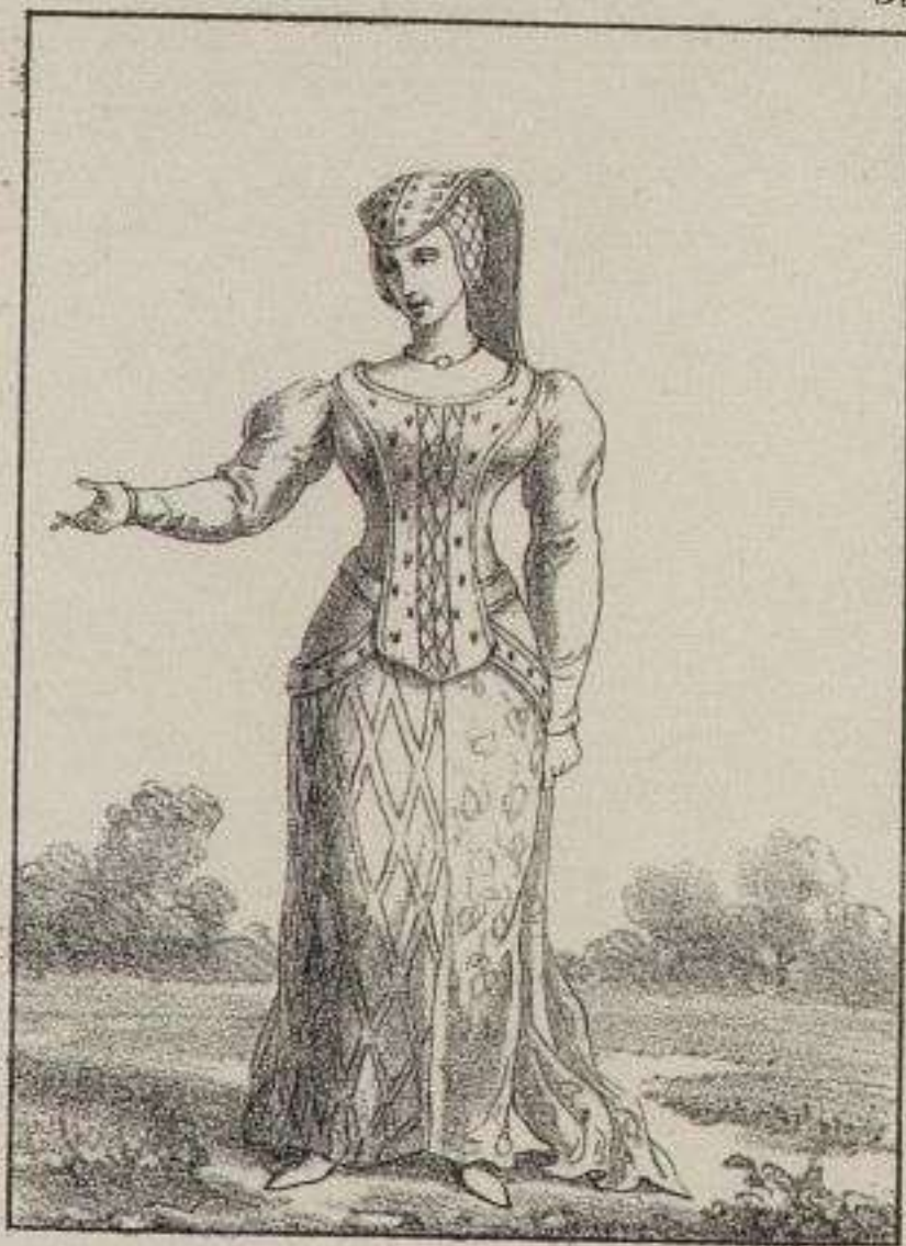
Marie de Bretagne. 1460.