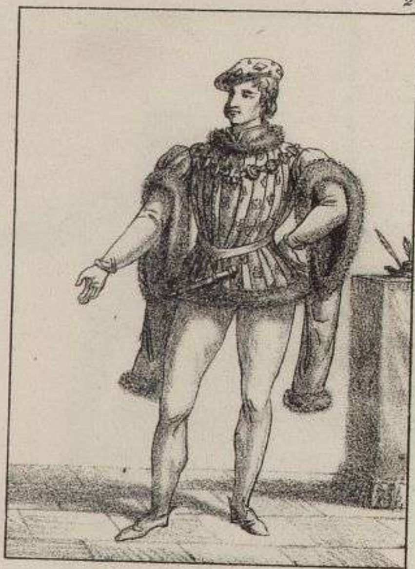
Jean de Montagu. 1409.