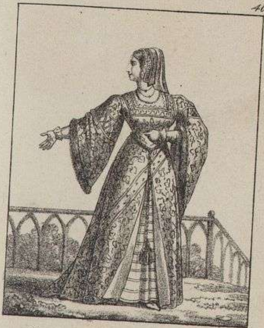
Dame de la Cour de Louis XII. 1512.