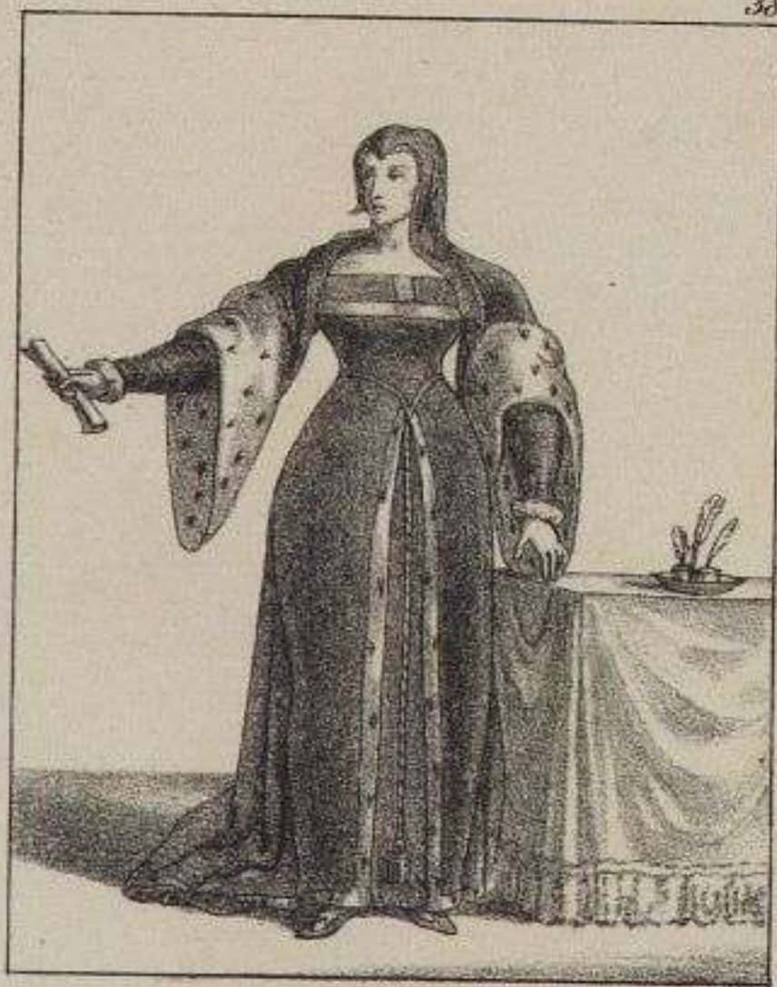
Louise de Savoie D ch d'Angoulême. 1500.