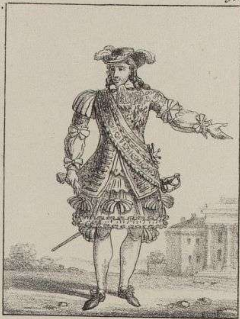
Louis, Dauphin de France.