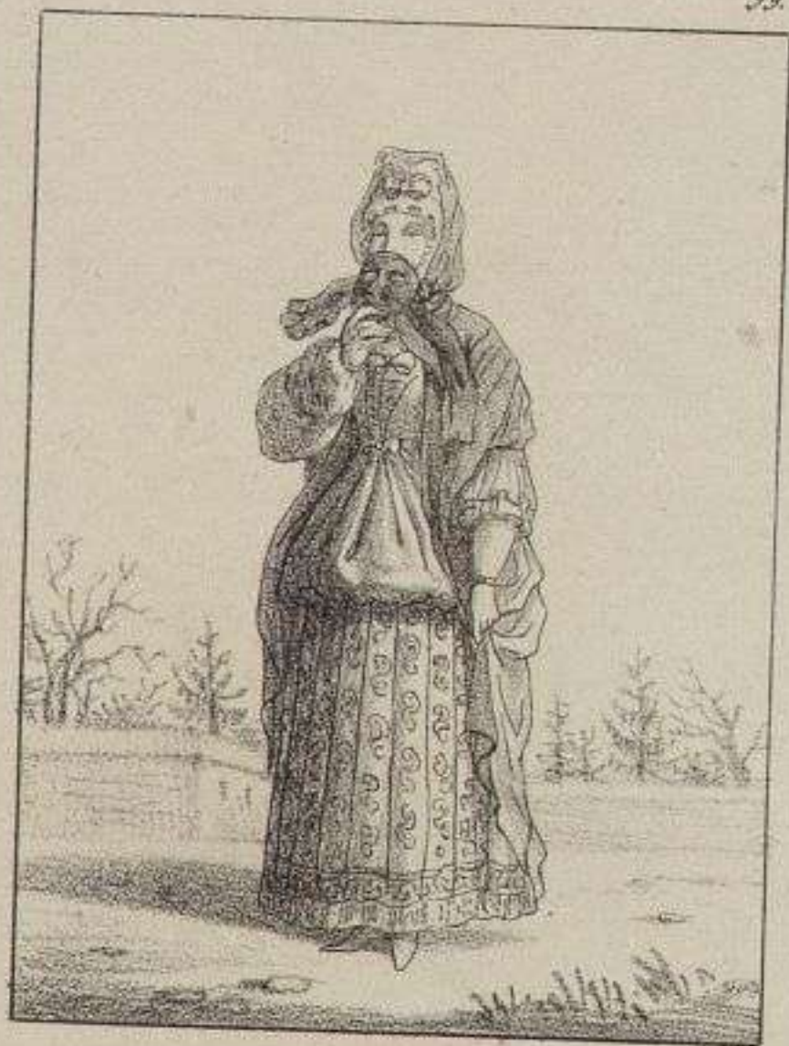
Jeune Dame en Costume d'hiver.