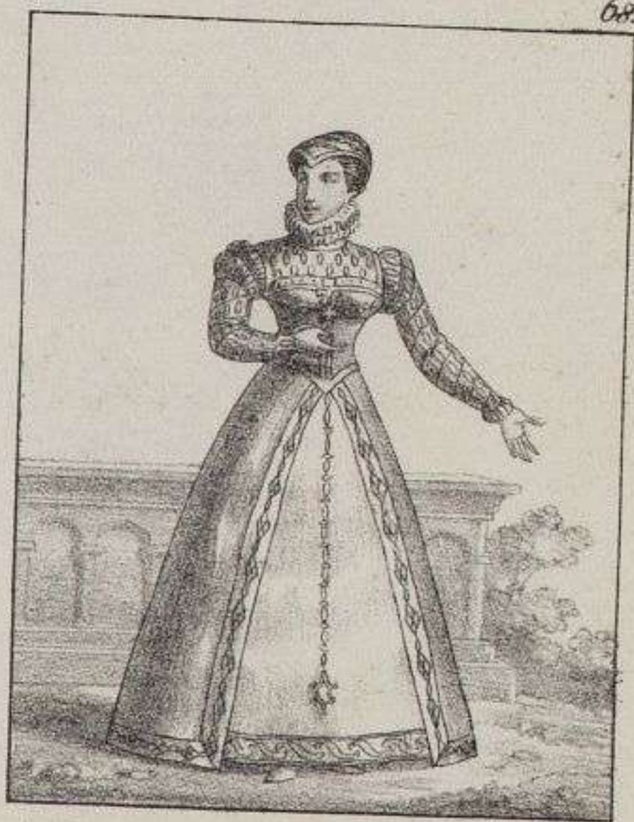
Elizabeth d'Autriche, Reine de France.