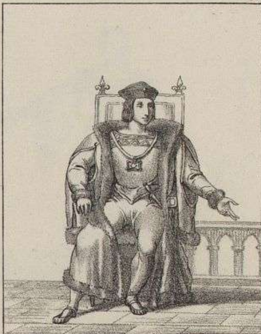
Louis XII. Roi de France. 1500.