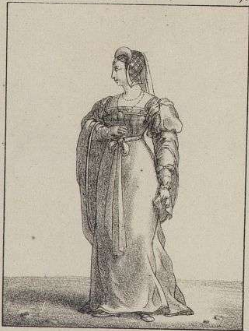
Fille d'honneur de la Reine.