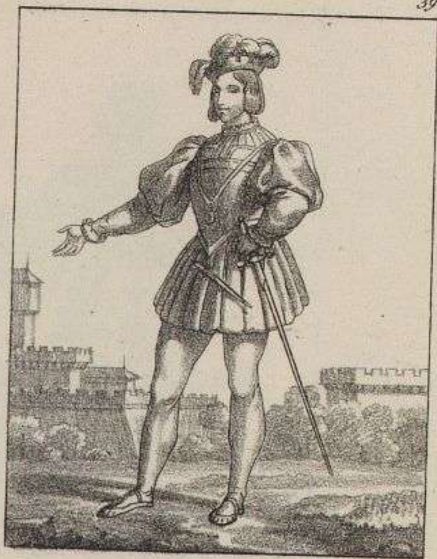
Gaston de Foix Duc de Nemours. 1512.