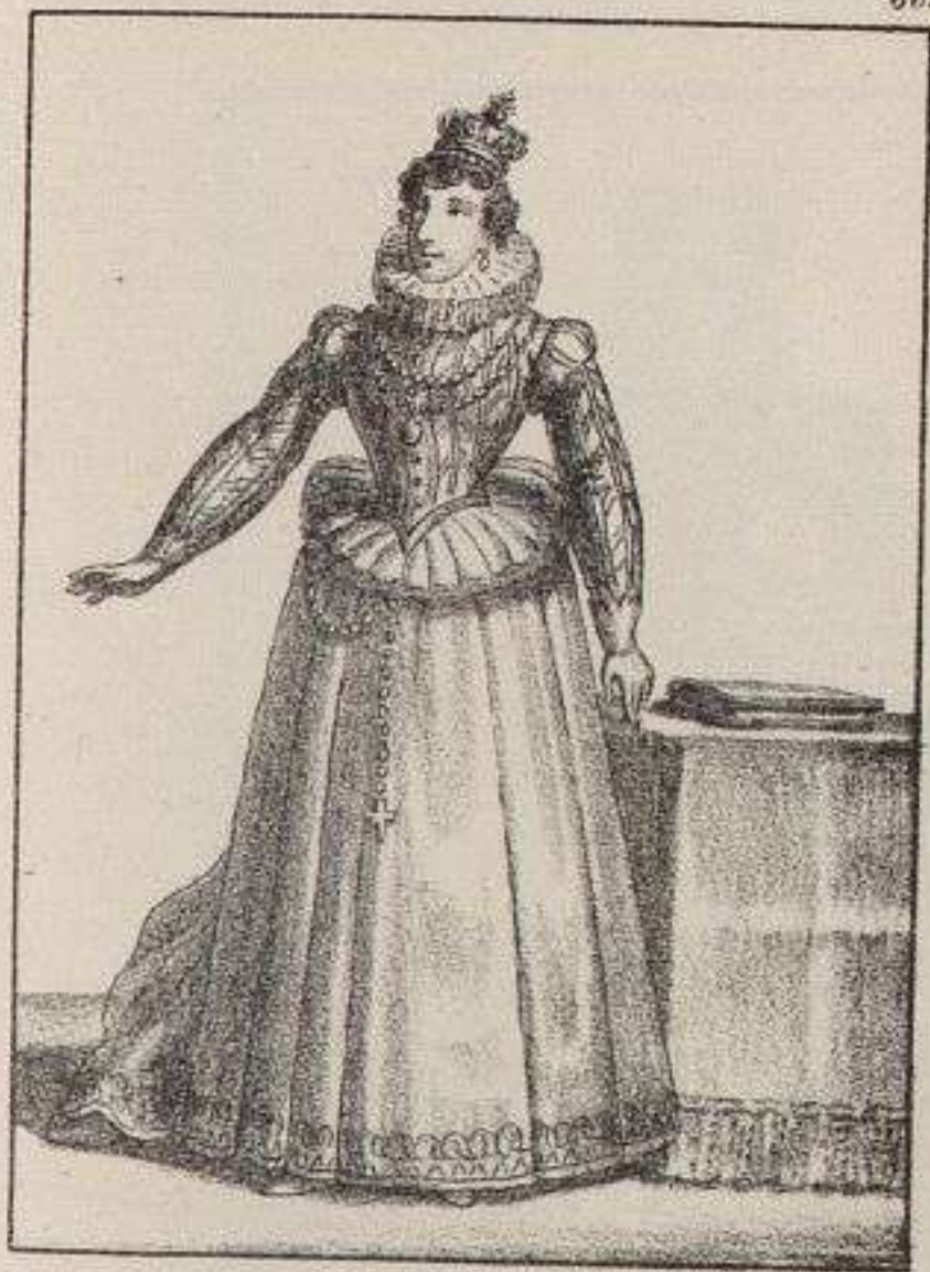
Margueritte de France. 1 re femme de Henry IV.