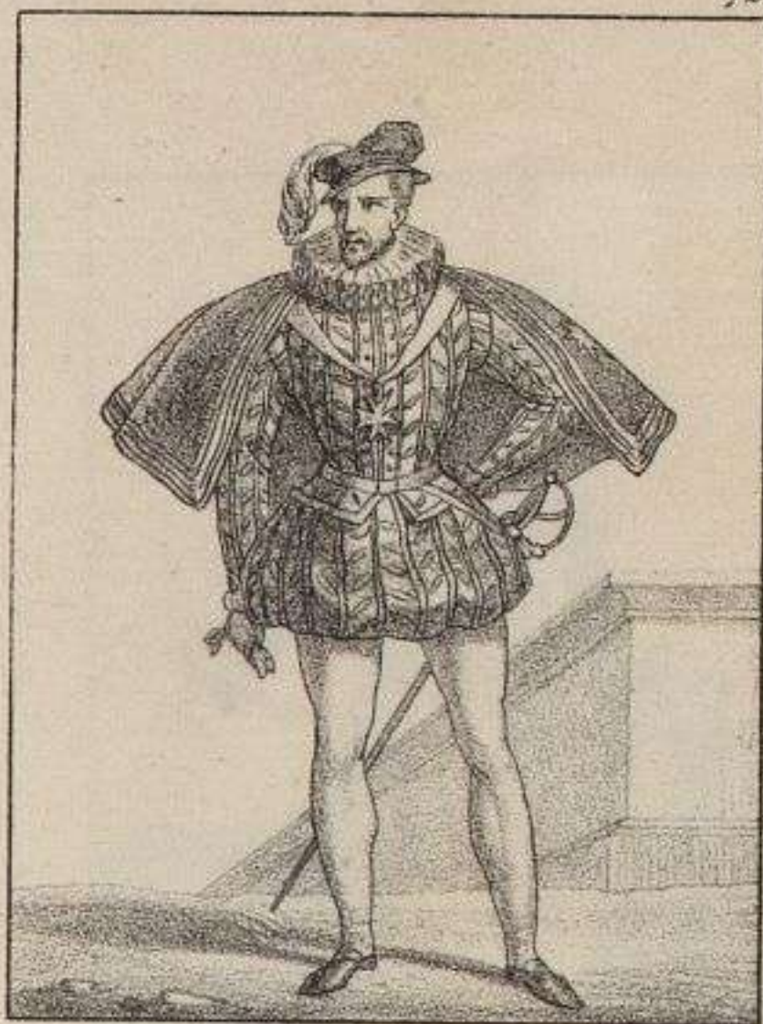
Henry III. Roi de France.