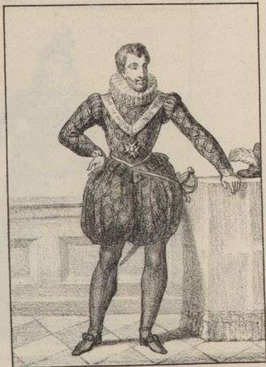
Henry IV. Roi de France et de Navarre.