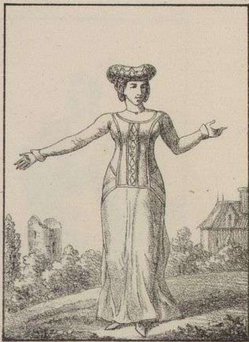
Dame de la Cour. 1370.