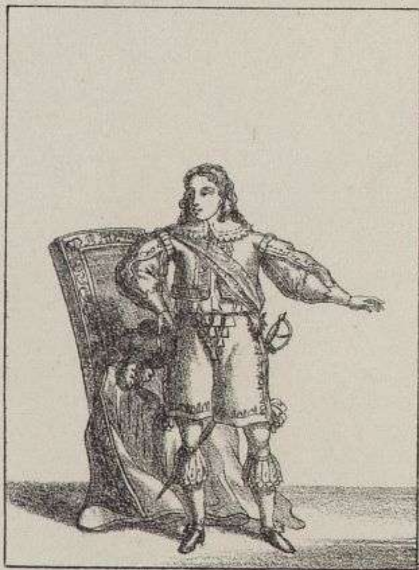
Louis XIV. fin de sa minorité.