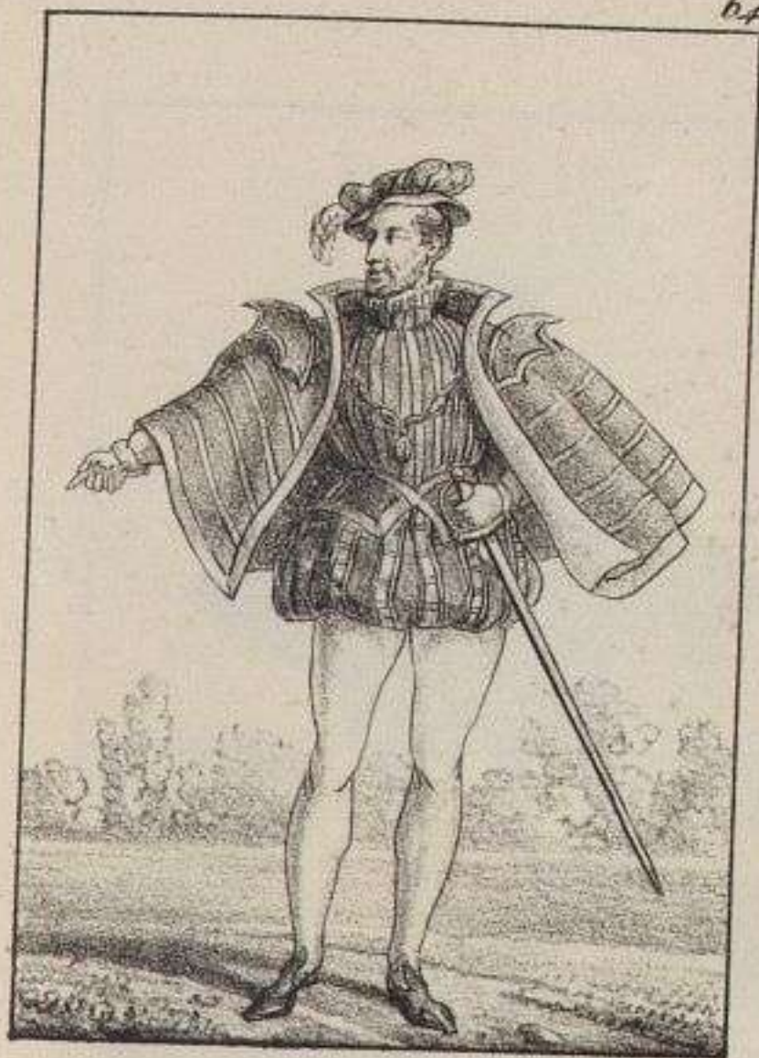
Antoine de Bourbon.