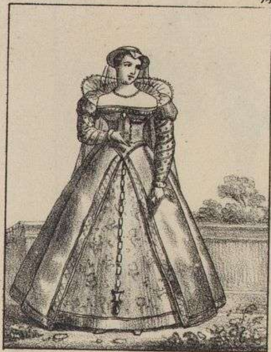
Catherine de Cleves.