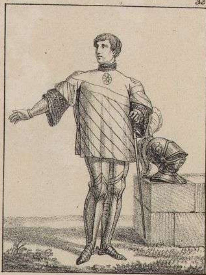
Michel Juvenet des Ursins. 1470.