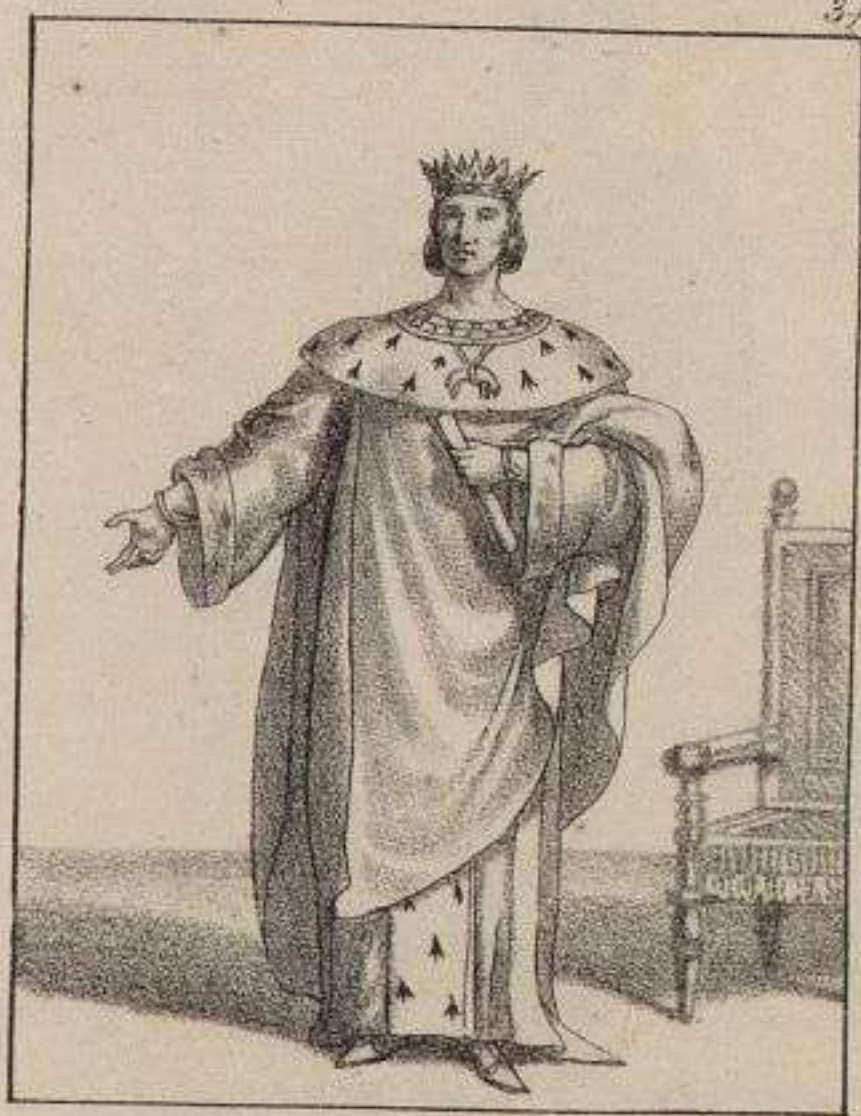
François II, Duc de Bretagne. 1470.