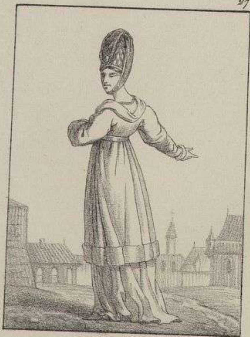
Costume de femme à la ville.