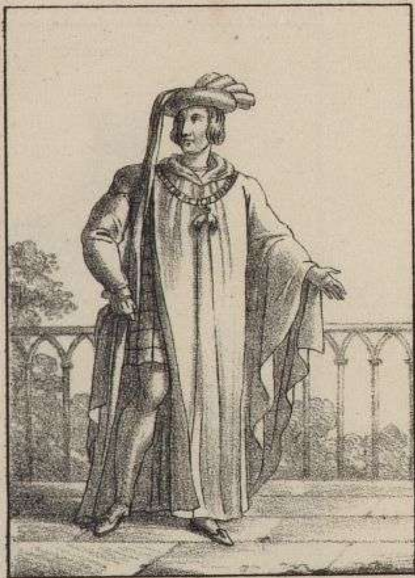
Philippe le bon, Duc de Bourgogne 1392.