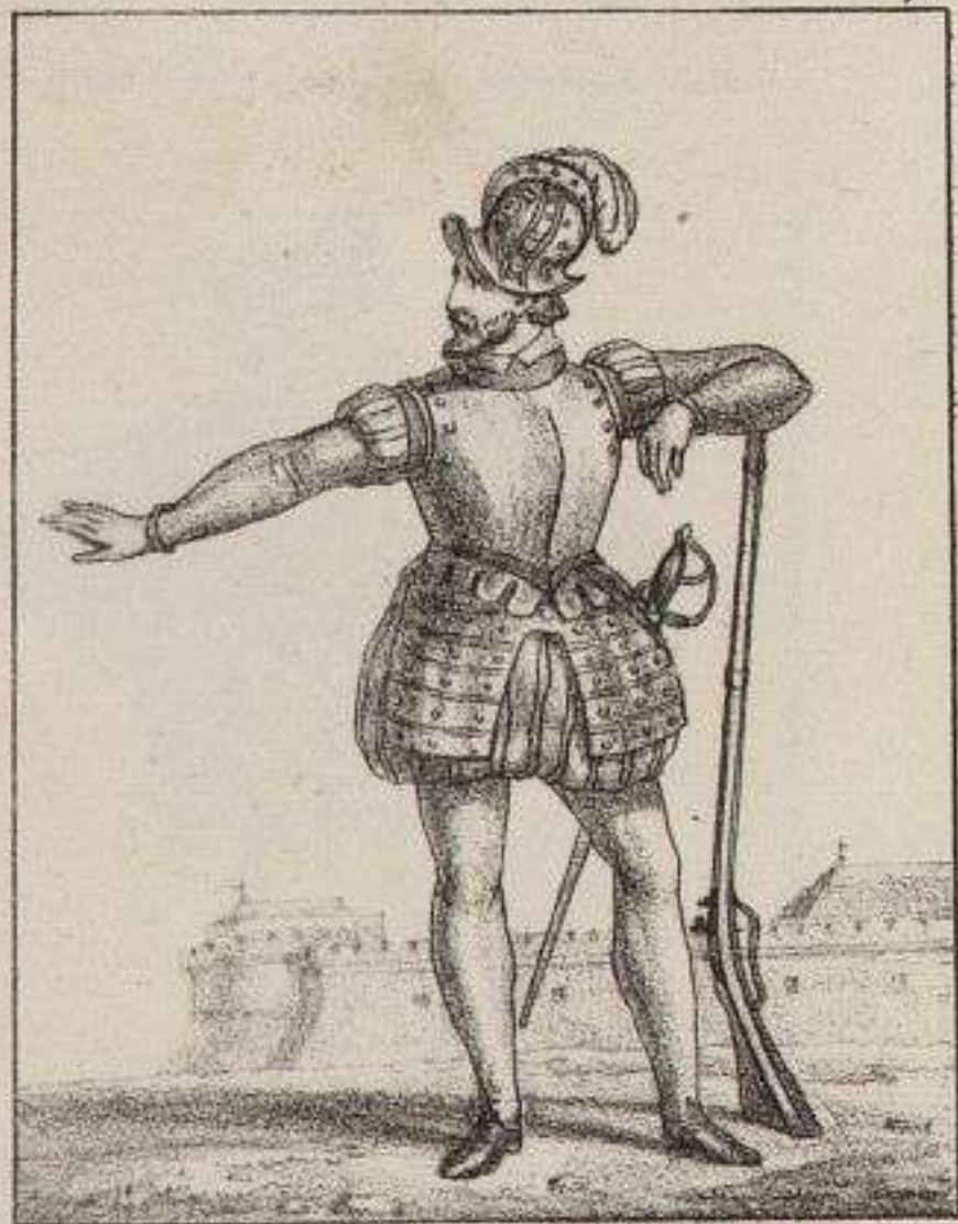
Soldat sous le R. me de Charles IX.