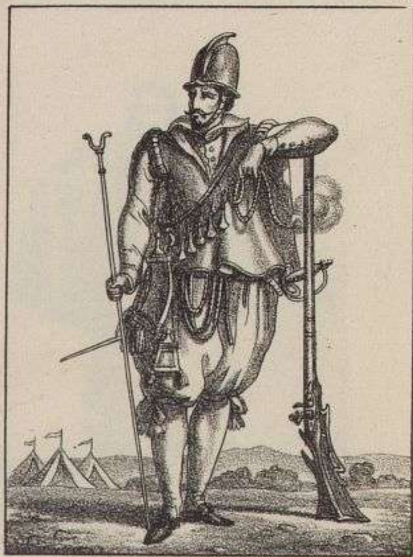
Soldat sous le R. e de Henry IV.