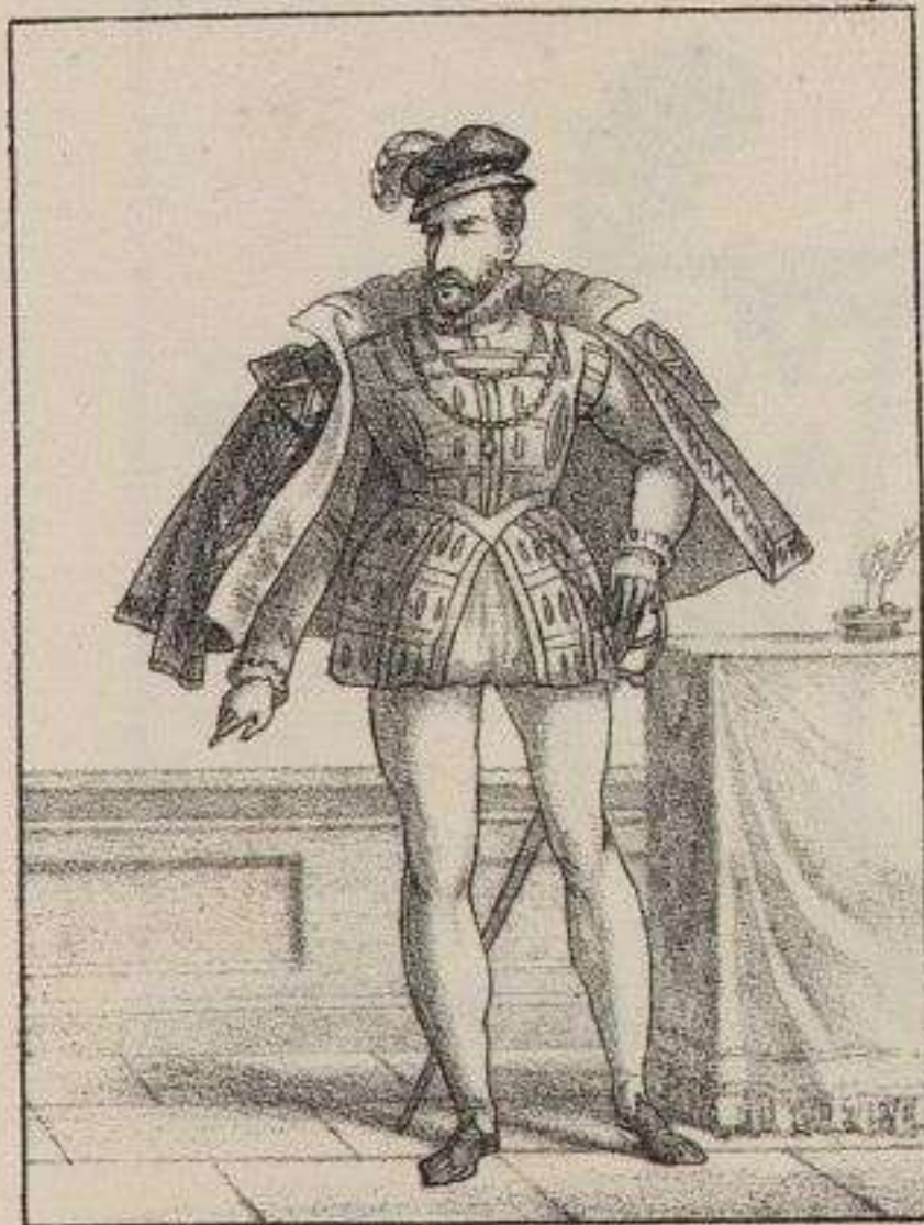
François de Lorraine, Duc de Guise.