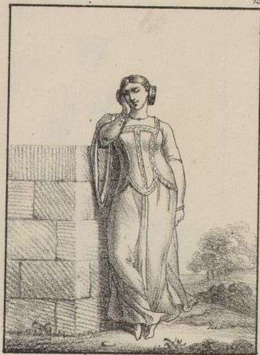
Rabit des jeunes personnes. de 1400 à 1500.