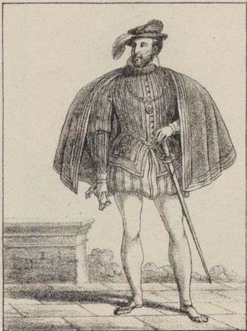
Henry II, Roi de France.