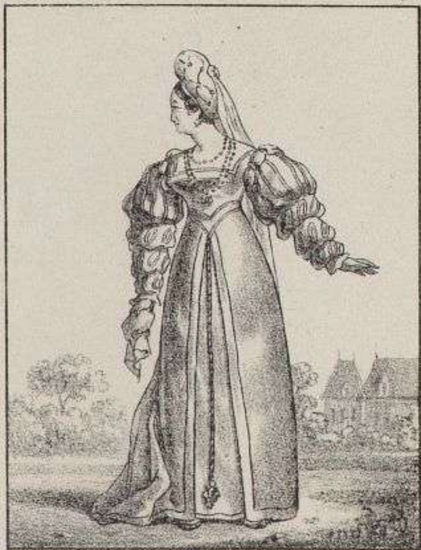
Dame de la Cour de François 1. er