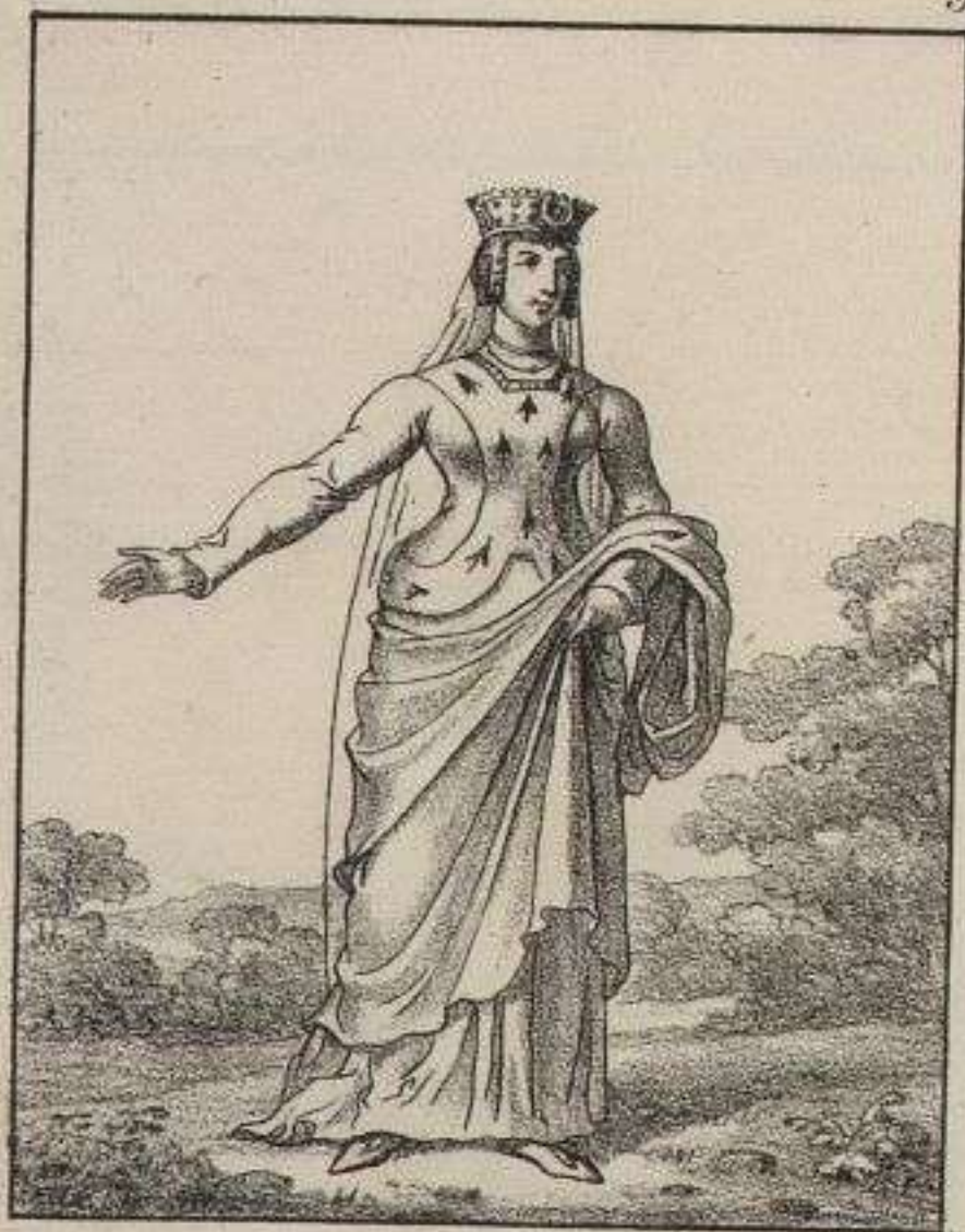
Dame de la Cour. 1240.