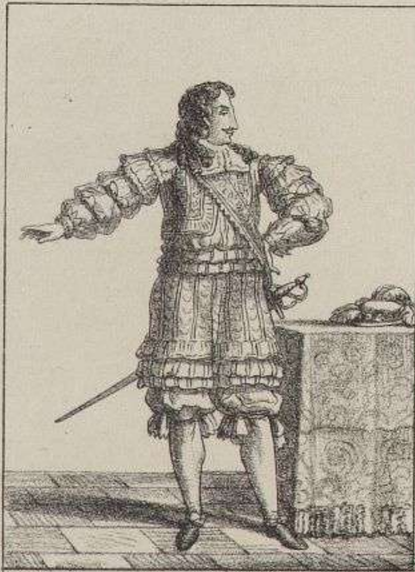
Louis XIV. Roi de France.