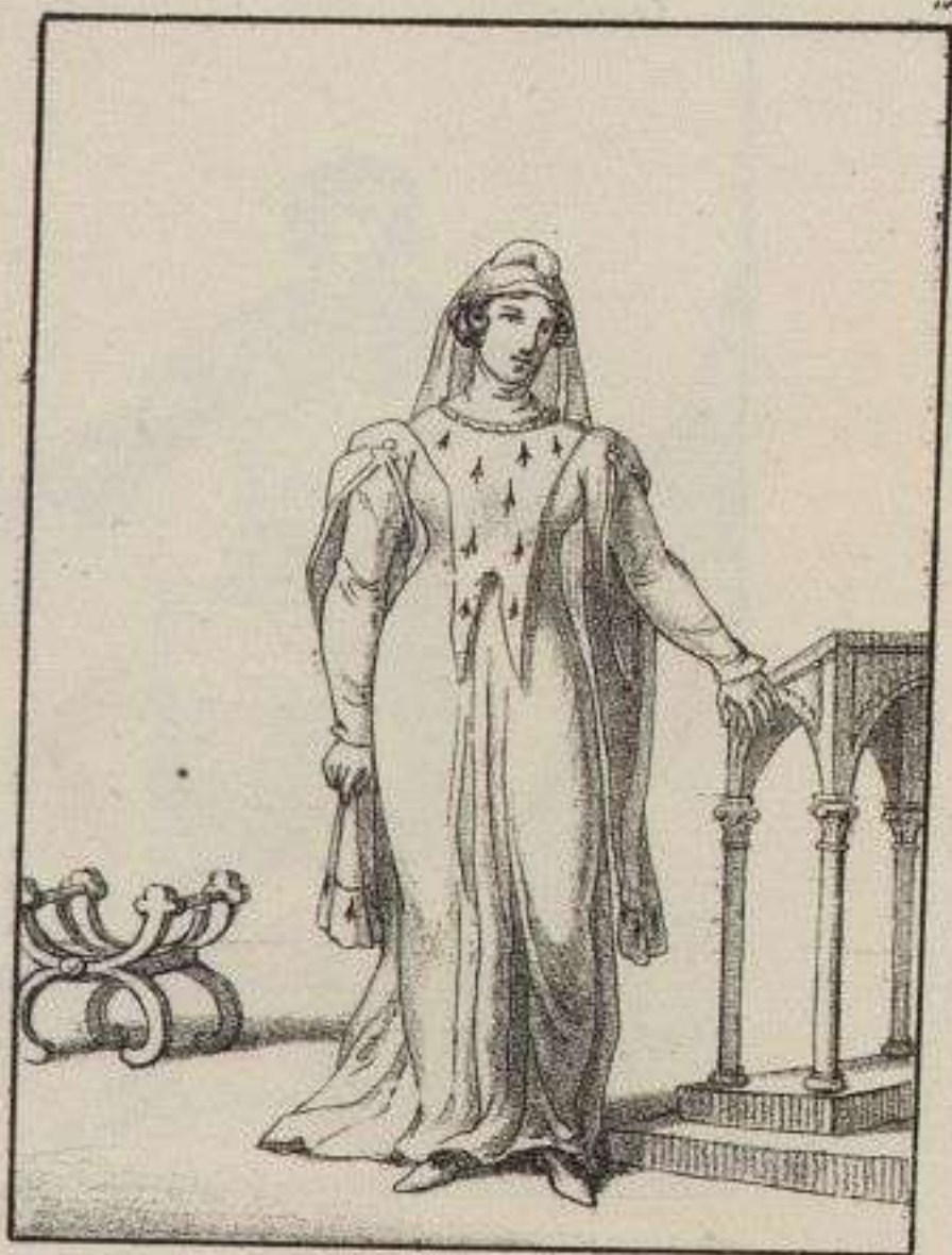
Jeanne de Navarre. 1595.