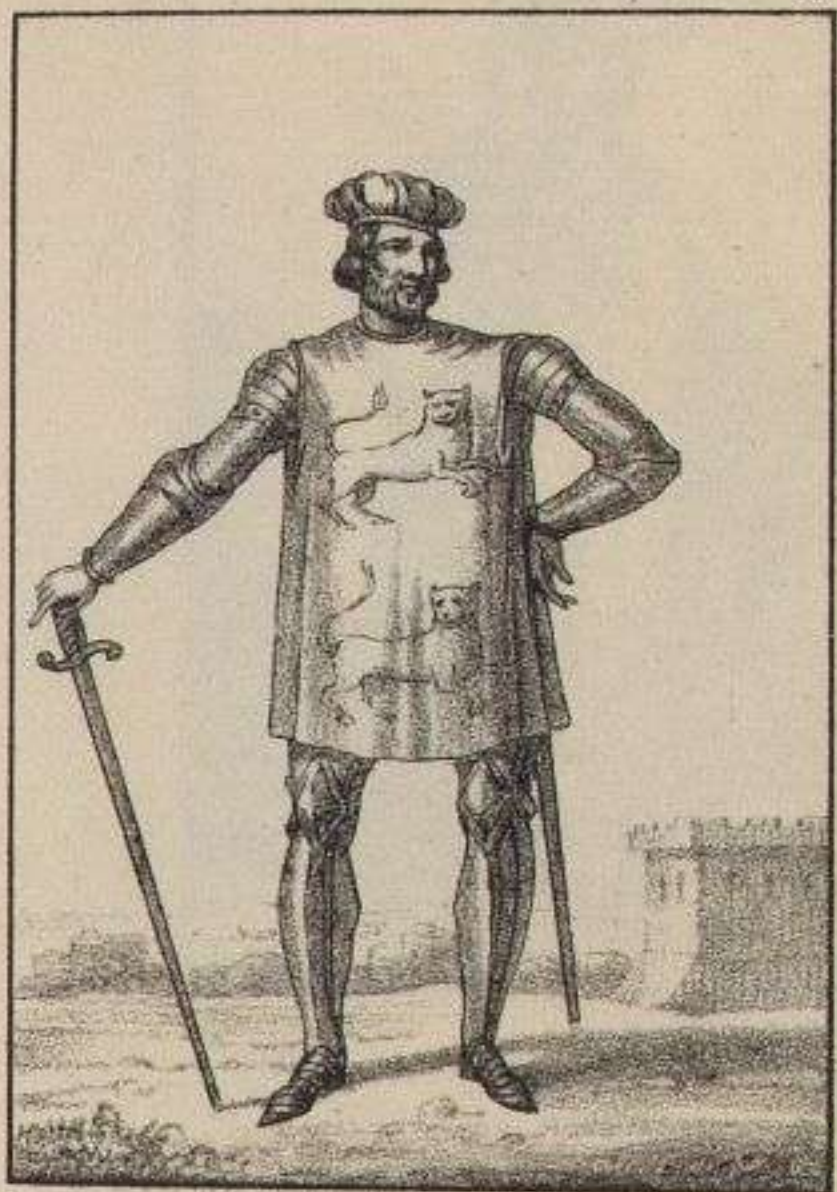
Le Duc de Normandie. 1390.