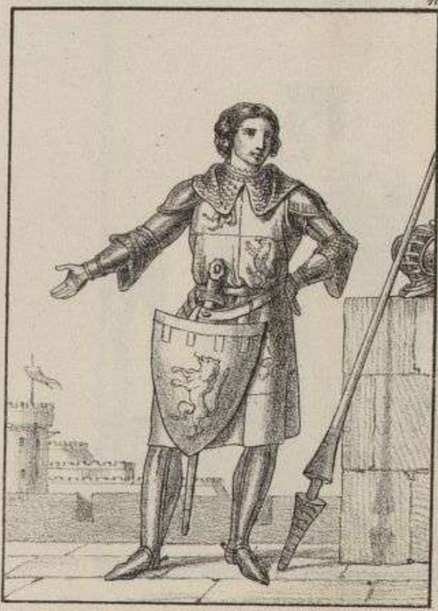
Chevalier revêtu de son armure. 1310.