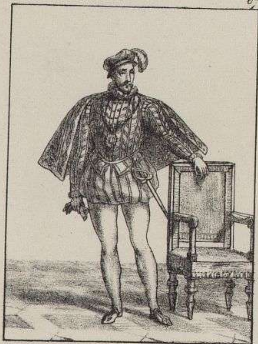
Charles IX. Roi de France.