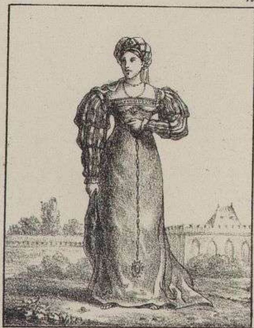
La Duchesse d'Etampes.