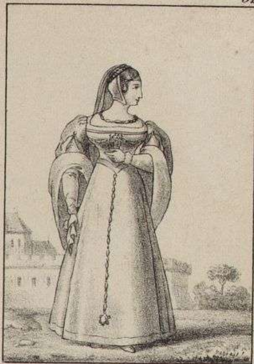
Diane de Poitiers.