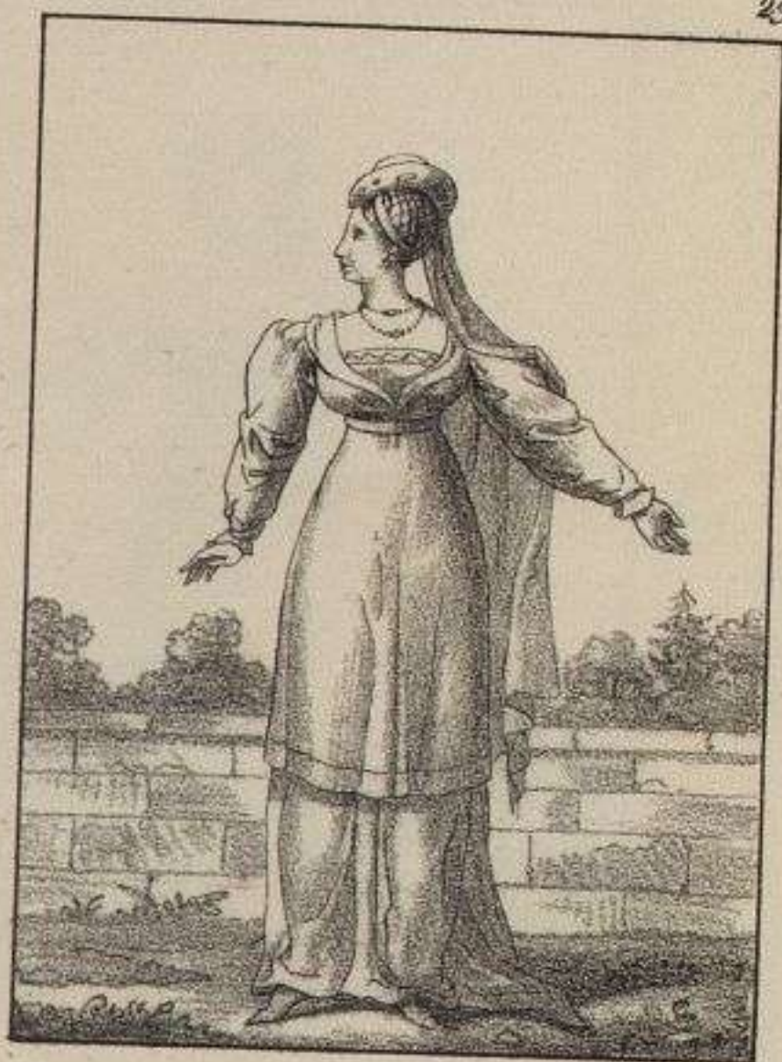
Dame de la cour de Charles VII.