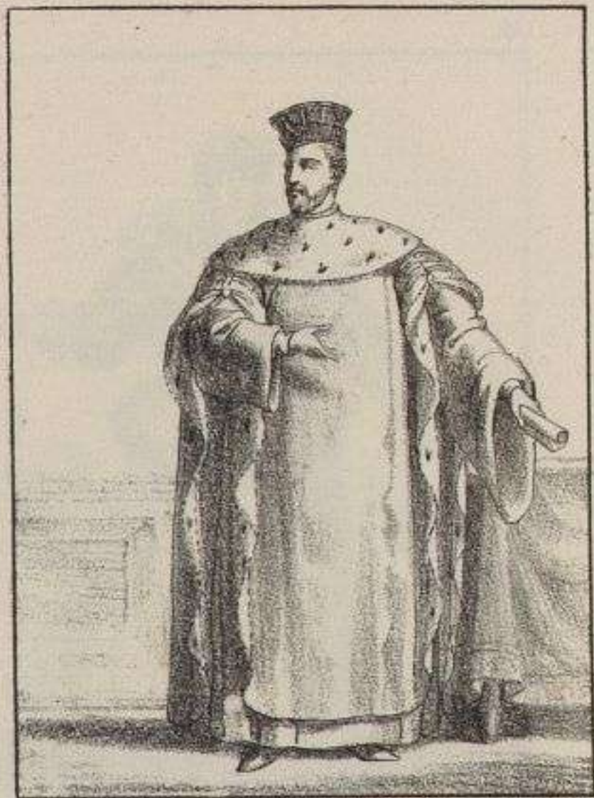
1. er Président au Parlement de Paris.