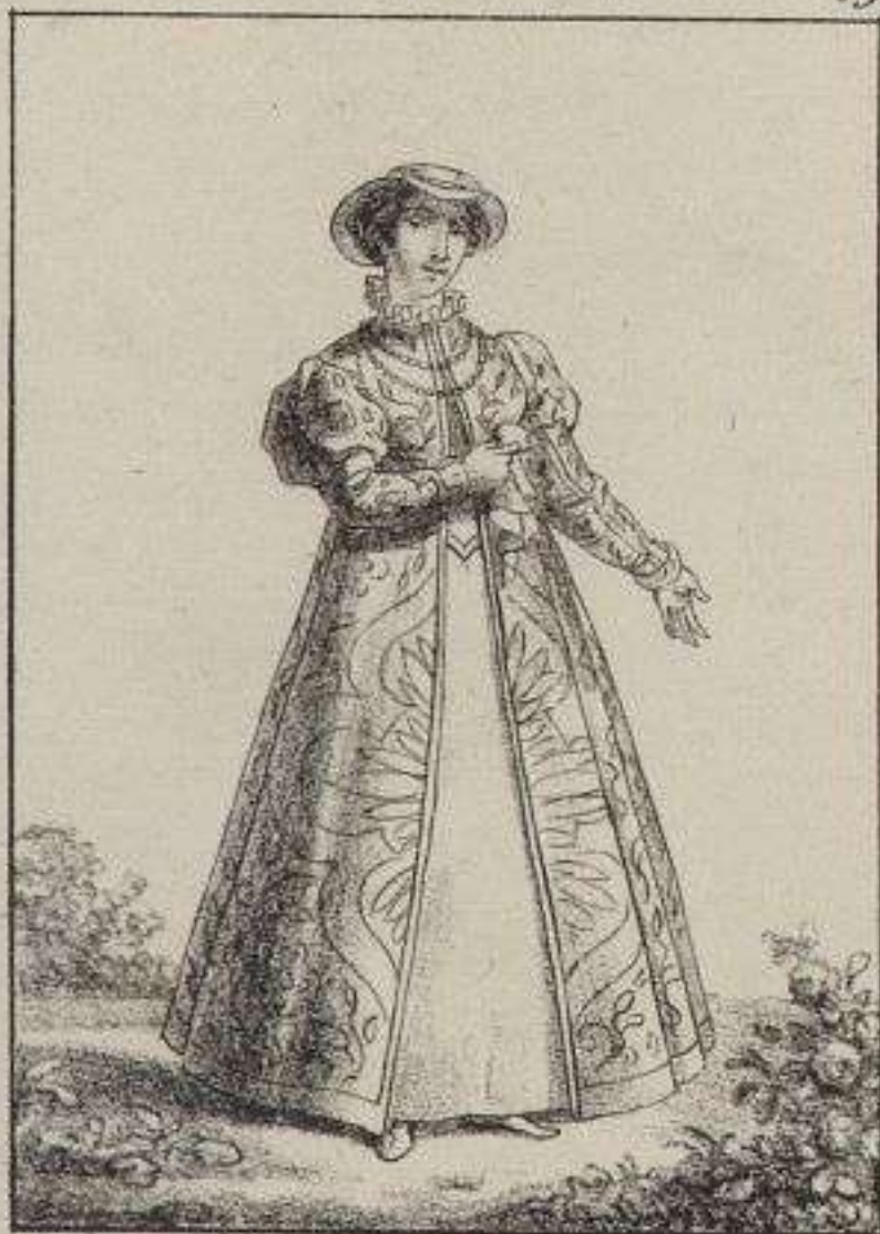
Dame de la Cour de Henry II.