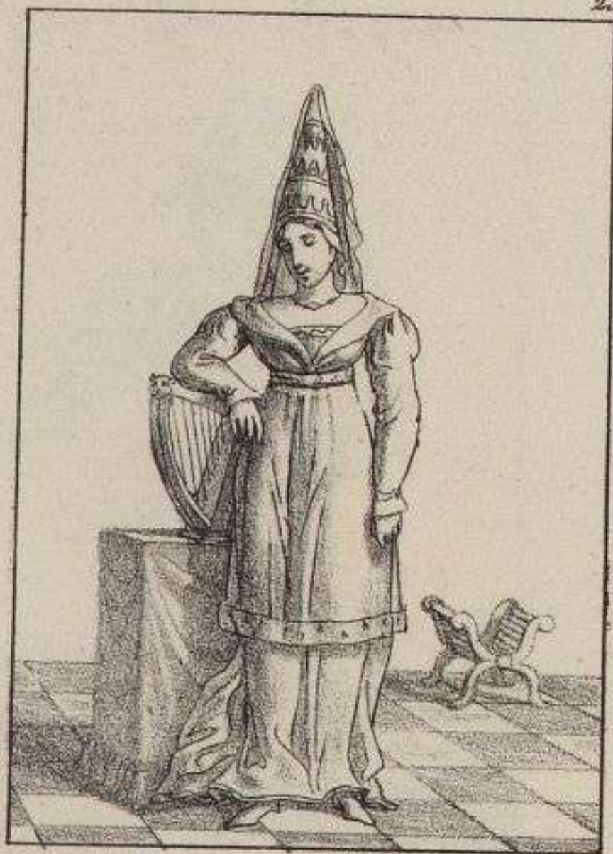
Euriant, Comtesse de Nevers. 1440.