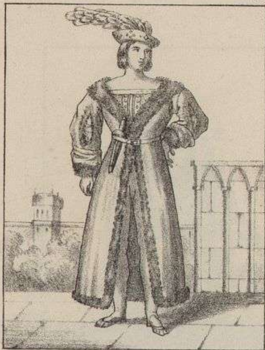
Seigneur de la Cour de Charles VIII. 1497