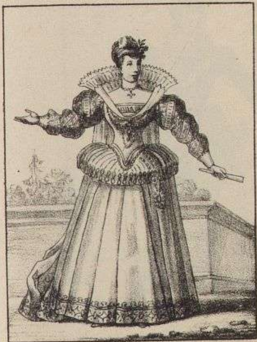
Grand habit de Cour.