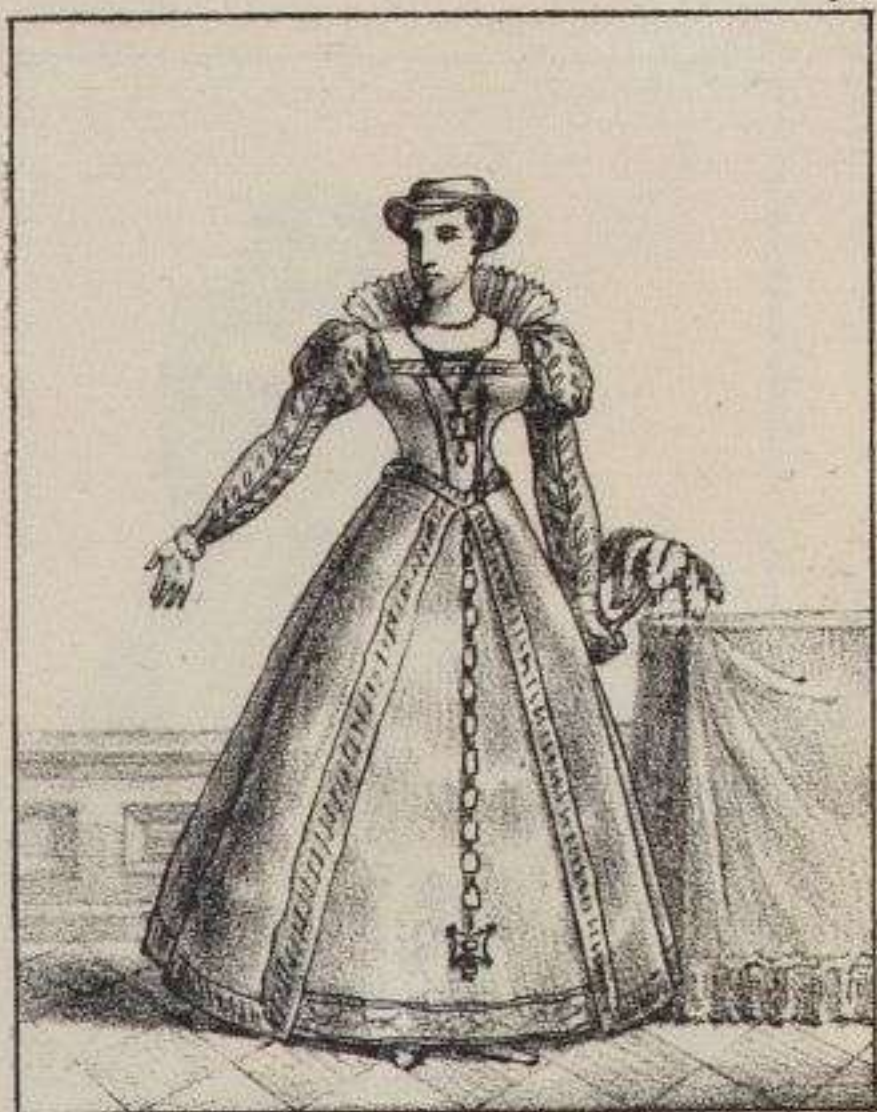
Louise de Lorraine, Reine de France.