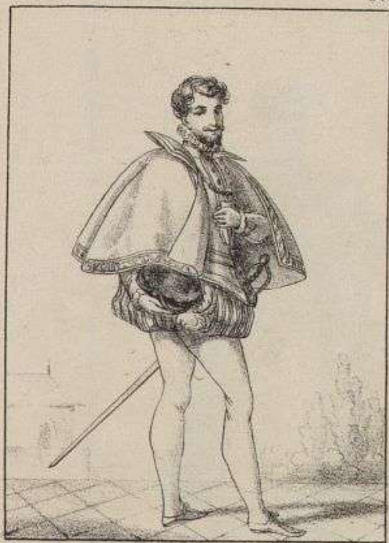
Seigneur de la cour de Henry II.