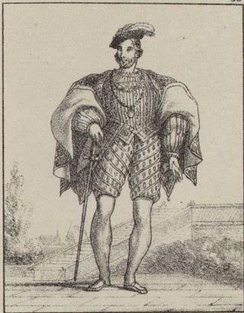
Claude de Lorraine.