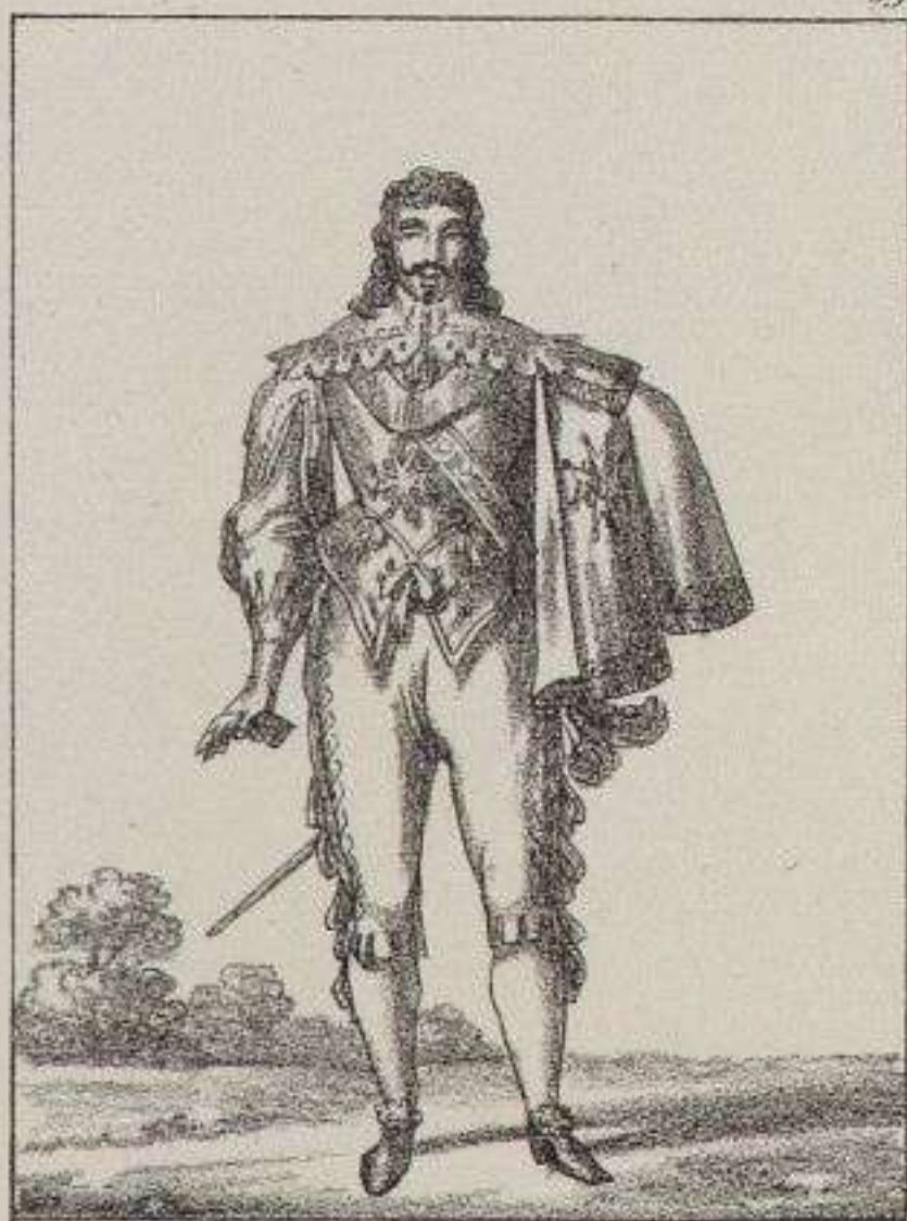
Seigneur de la Cour de Louis XIII.