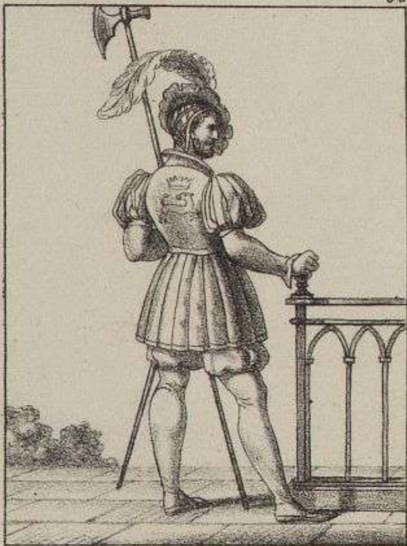
Garde du Palais.