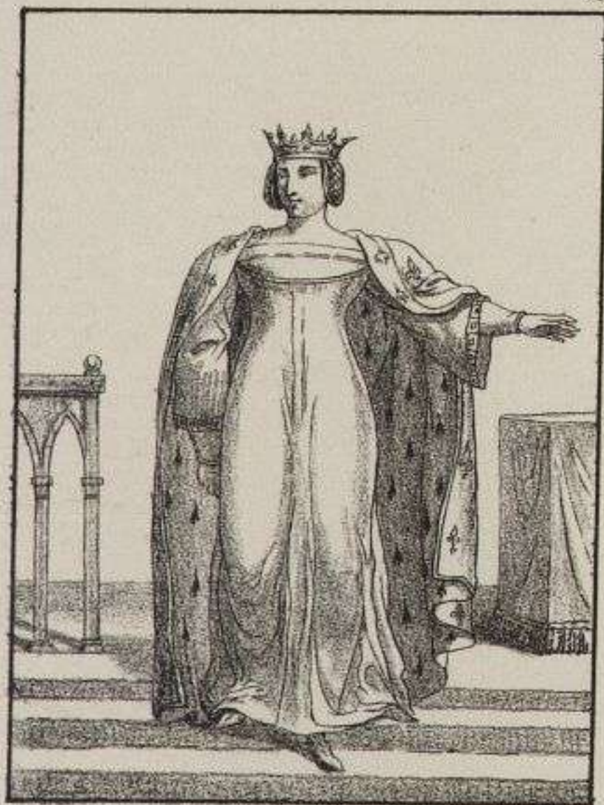
Jeanne de Bourgogne. 1328.