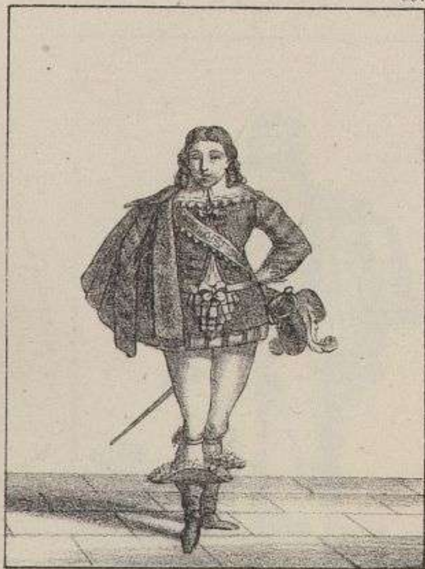
Page de M re de Guébriand.