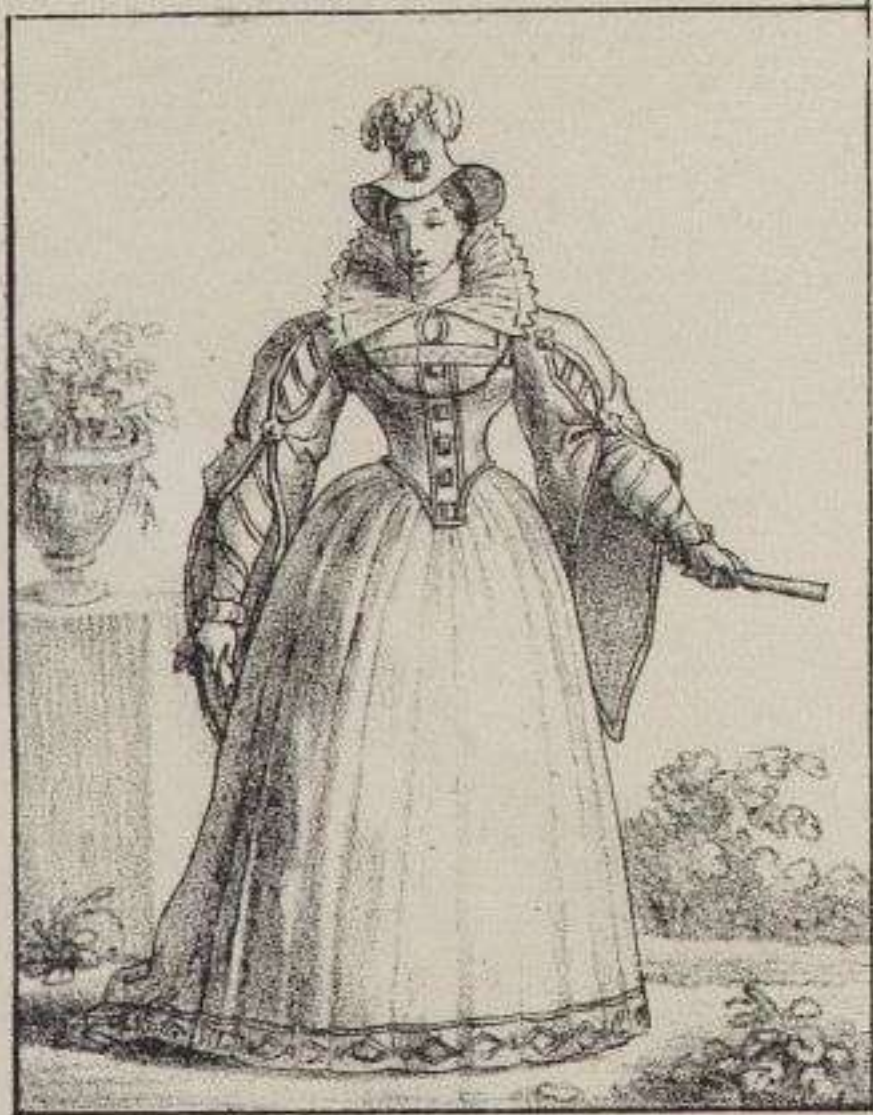
Marguerite de Lorraine.