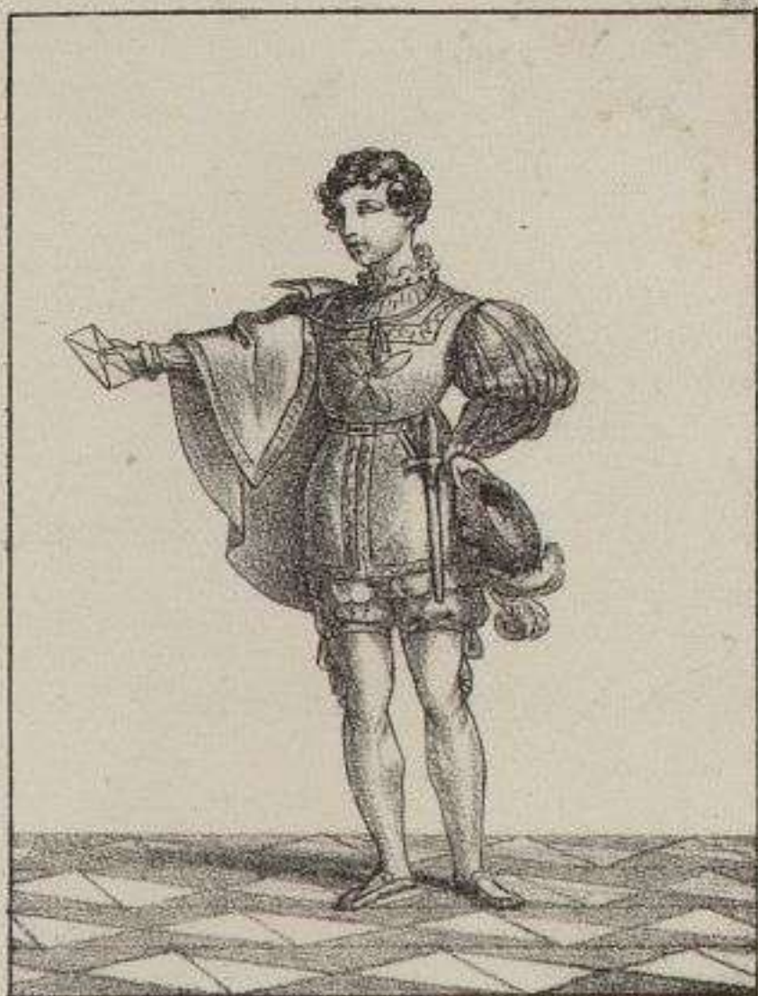
Page de la Cour de François 1 er