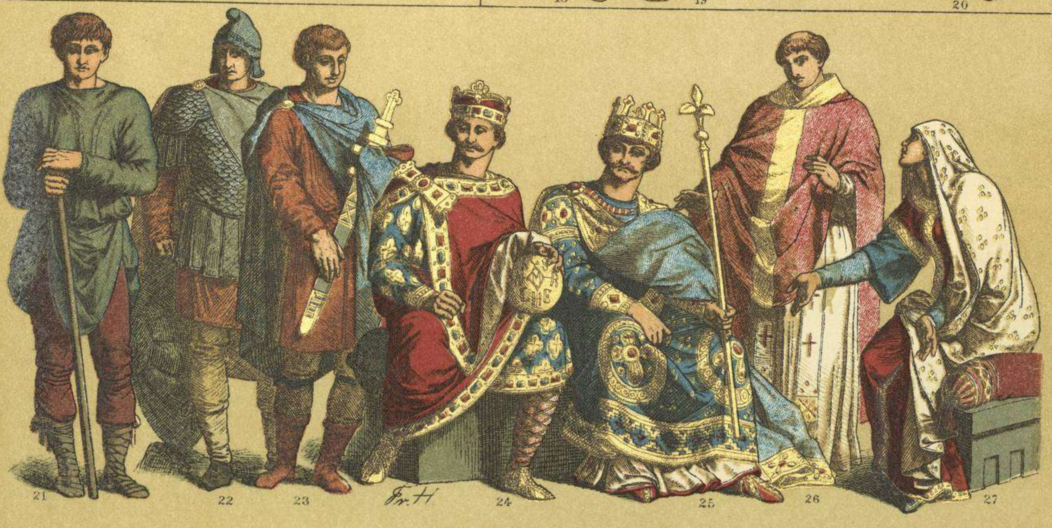
EDAD MEDIA.- ADORNOS, MUEBLES Y TRAJES DE LOS FRANCOS (ÉPOCAS MEROVINGIA Y CARLOVINGIA)