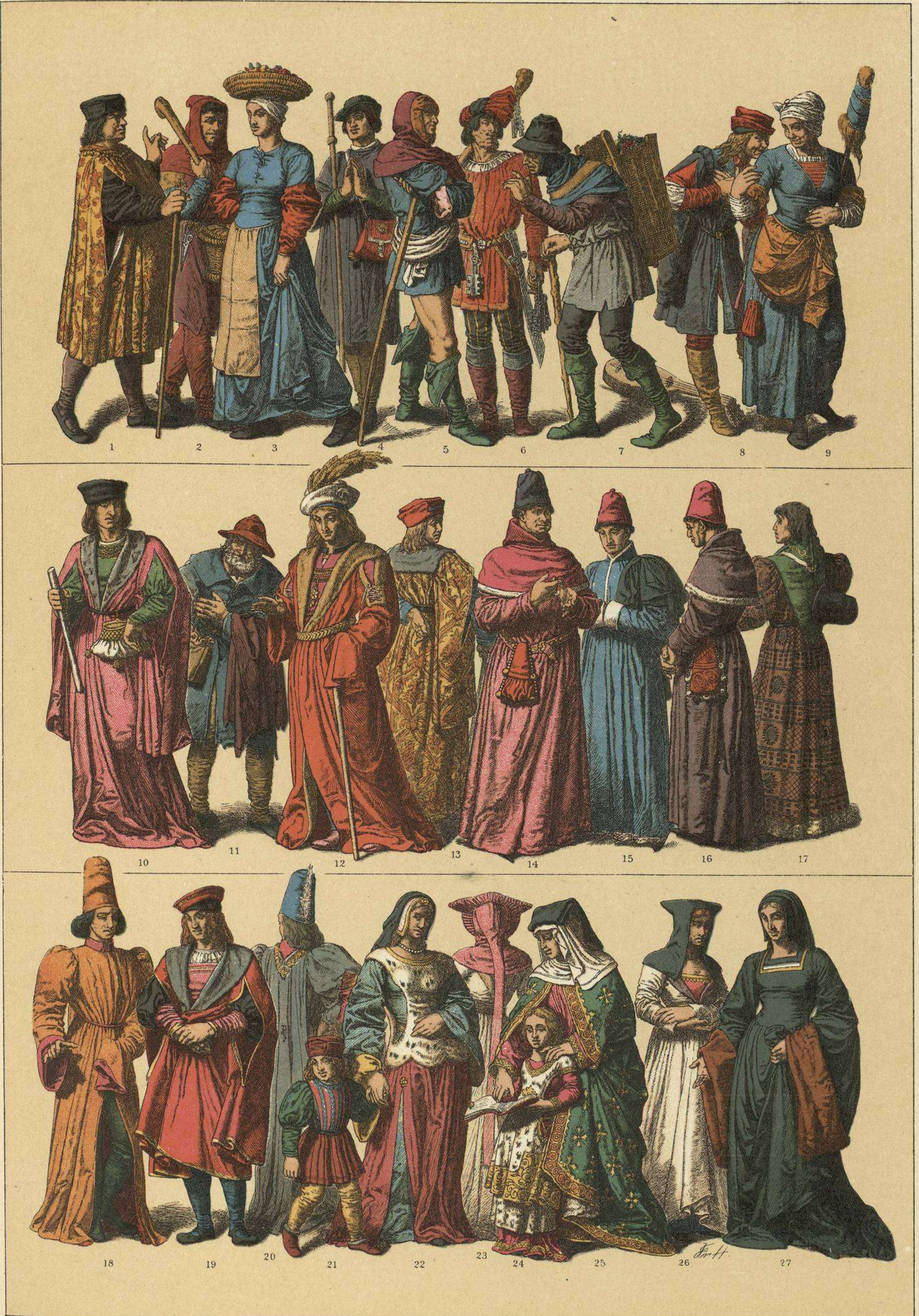
EDAD MEDIA.—TRAJES DE LOS FRANCESES EN LA SEGUNDA MITAD DEL SIGLO XV