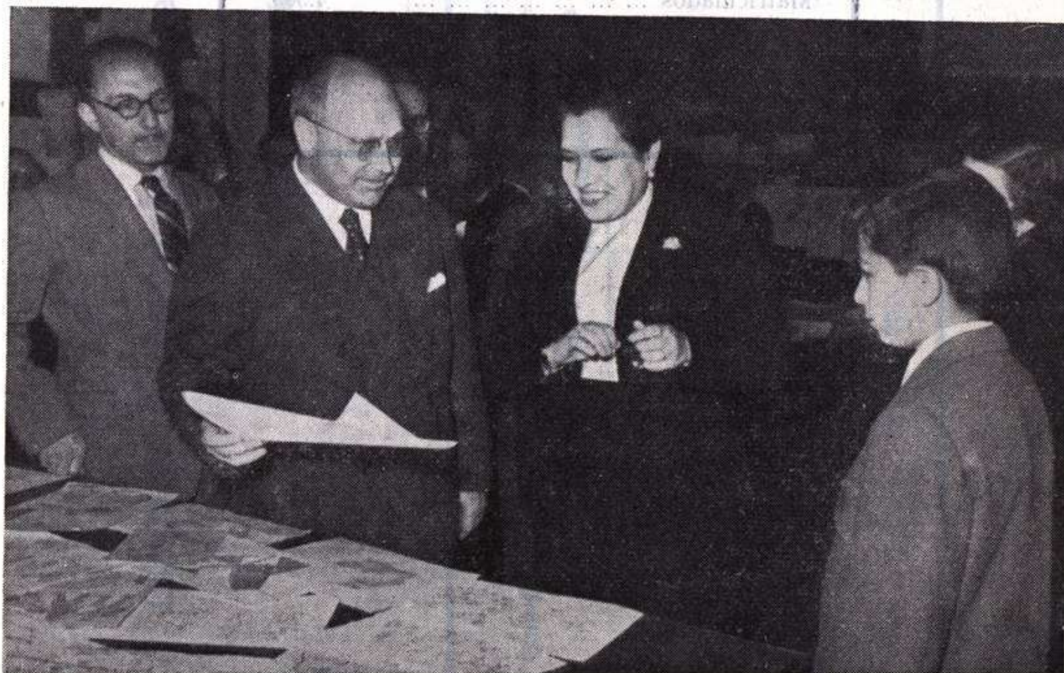
El Ilustrísimo señor director general de Enseñanza Media examinando los trabajos de la clase de dibujo.