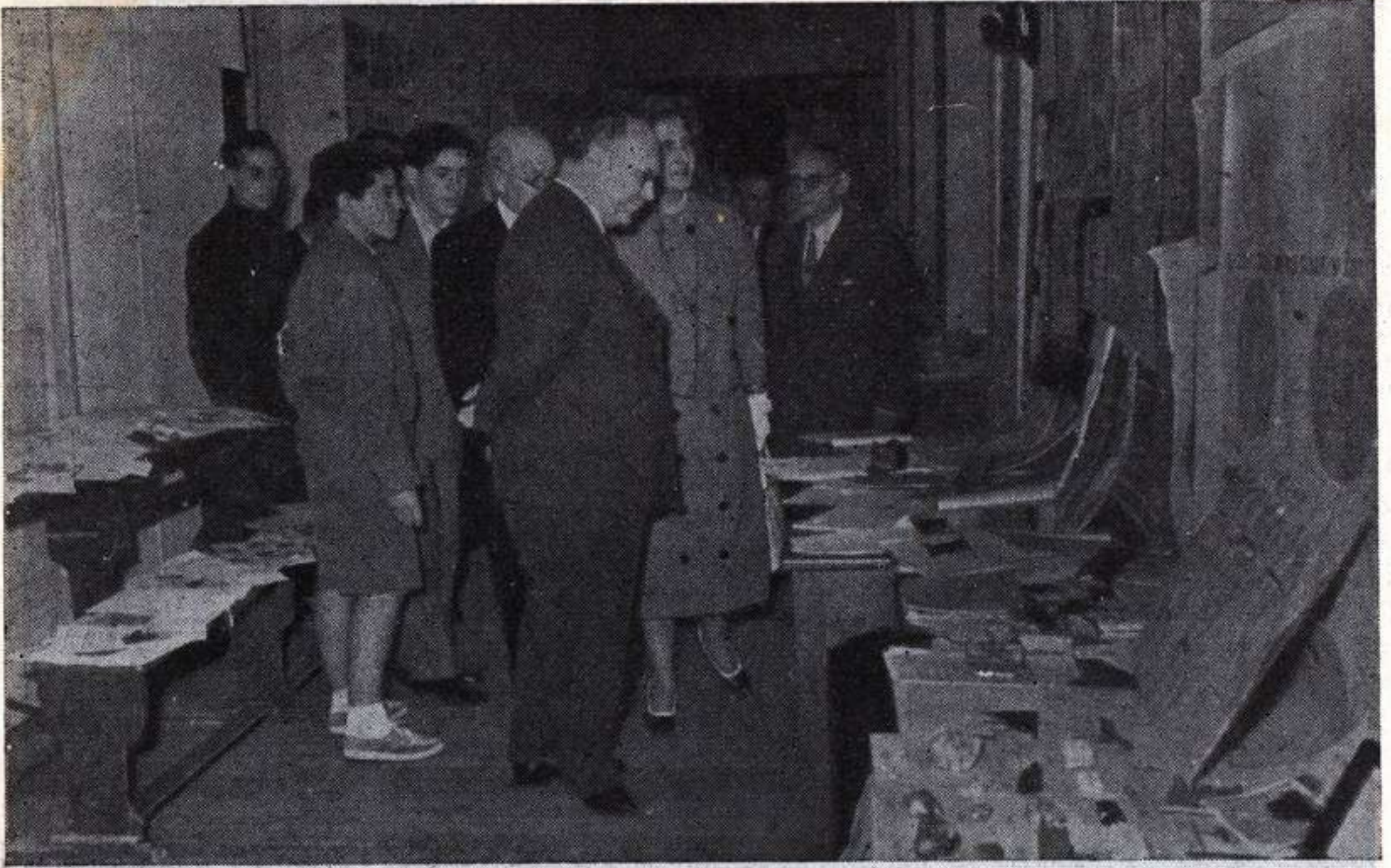
Otro aspecto de la Exposición.

El señor igual dando explicaciones a un grupo de presenciantes en San Juan de los Ríos, en Toledo.