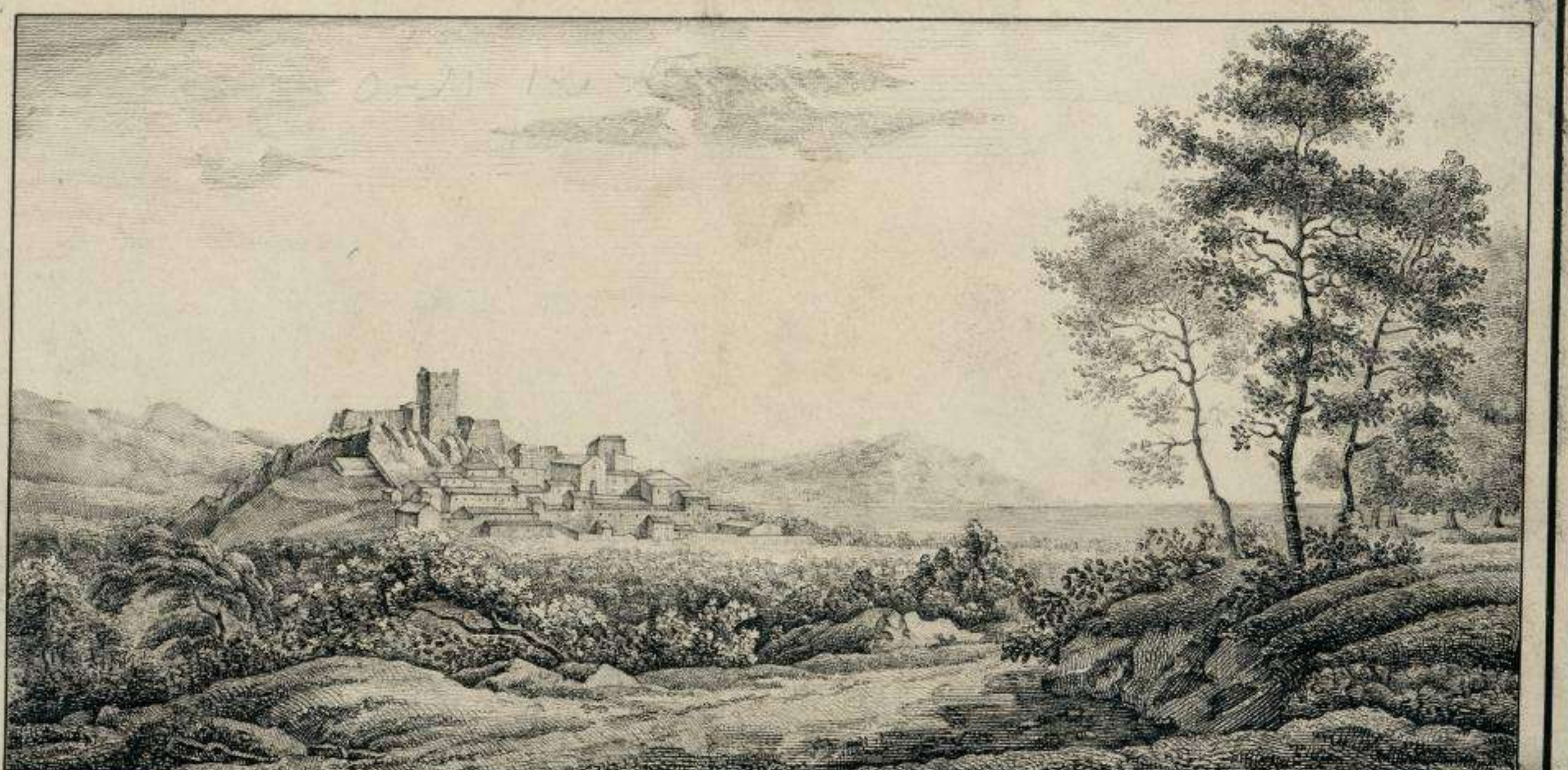
Vista tomada desde el lado de Valencia