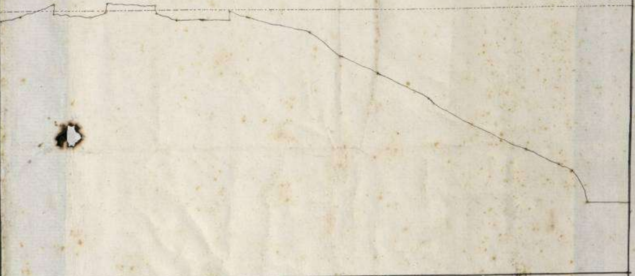
Plano de la Materia del Puerto de la Selva.