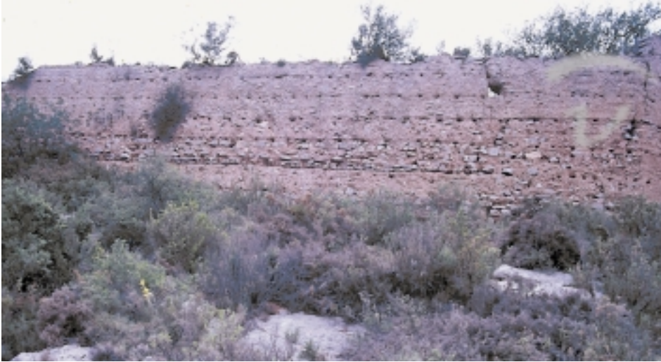
Foto 20. Detalle de esa cortina desde la zona superior.