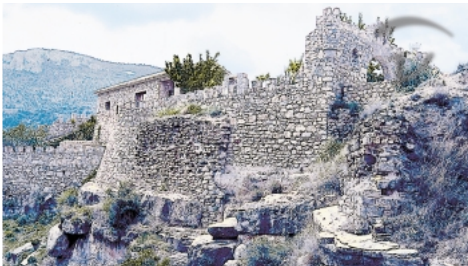
Foto 15. Escasos vestigios debido a la transformación actual que ha sufrido su antiguo recinto.