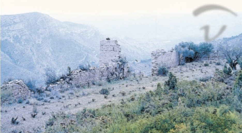
Foto 22. Detalle de una de sus posibles entradas.