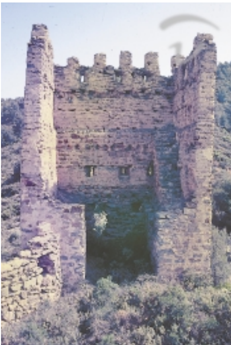
Foto 31. Vista interior de una de sus torres, con su escalera adosada -derecha- que conducía al piso superior.