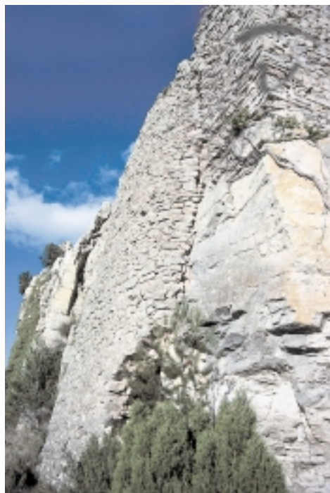
Foto 17. Sus huecos fueron cerrados por mampuesto para alisar sus caras e impedir el acceso a su interior.

Foto 16. Se construyó el castillo sobre una estructura rocosa que se eleva y conforma una plataforma.