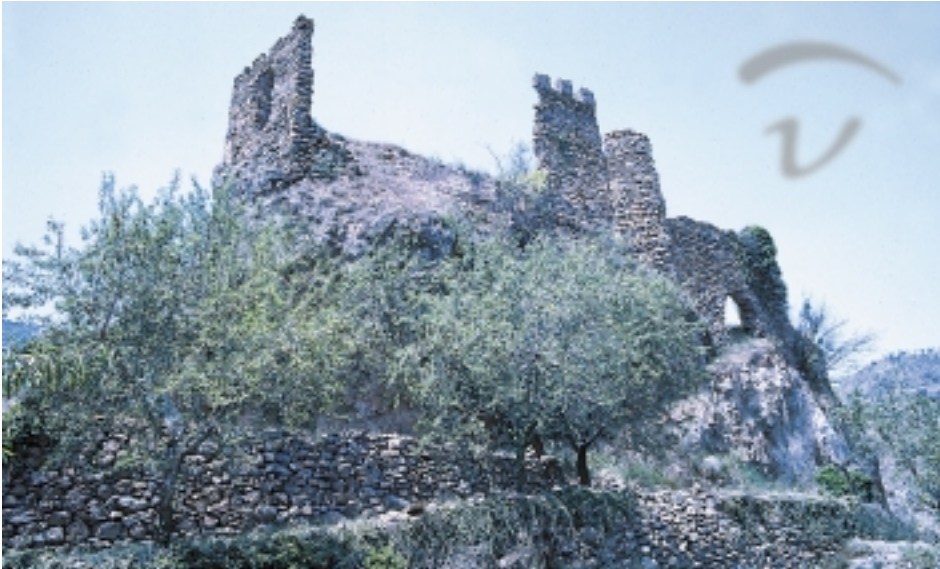
Foto 28. La construcción se situó sobre una elevación natural del terreno.