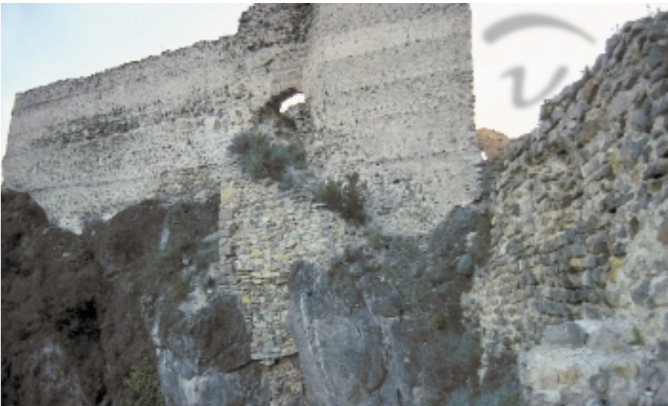
Foto 27. La roca cerraba todo el conjunto. Allí donde faltaba se unía sus partes con mampostería.