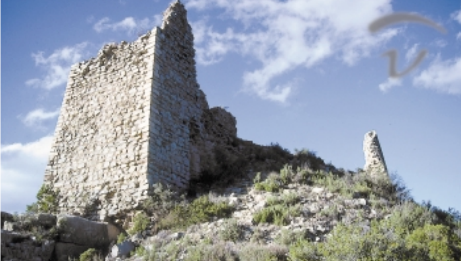
Foto 18. Las torres defendían los puntos de subida y estaban protegidas por cantoneras de piedras.