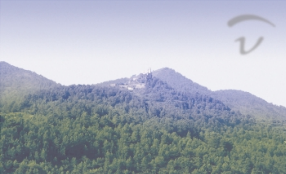
Foto 26. El castillo de Castro se situaba sobre un punto alto y estratégico.