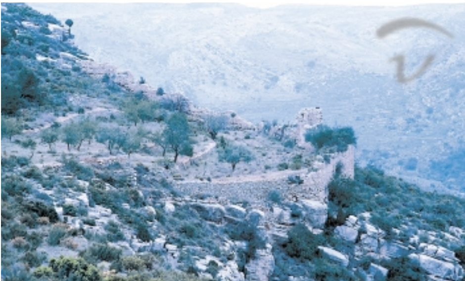
Foto 21. Tramo de muralla donde debía estar uno de los lugares de acceso. Aquélla luego se encaminaba hacia la parte superior -zona interna de esa muralla-.