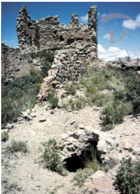
Foto 24. Los restos más importantes de su interior se centran en un cuerpo o torre donde se ven los apoyos de las vigas de su piso superior.