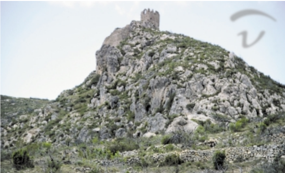
Foto 23. El recinto superior de Espadilla se asentaba sobre una pequeña superficie.