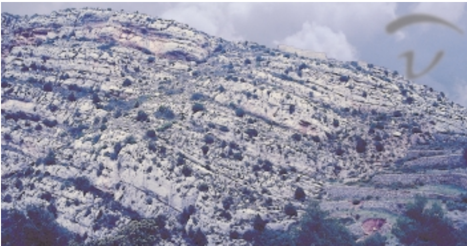
Foto 19. Véase parte del conjunto amurallado que cerraba este recinto de hábitat y refugio.