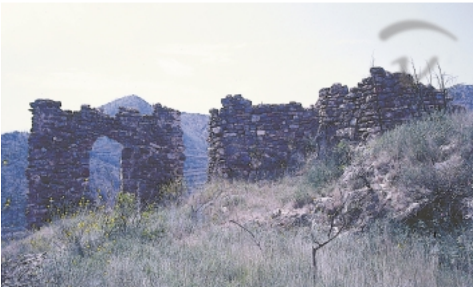
Foto 29. De nuevo, el contraste que presenta todo castillo valenciano visto desde el exterior, donde aún se divisan abundantes restos, y su interior, que conserva pocos.