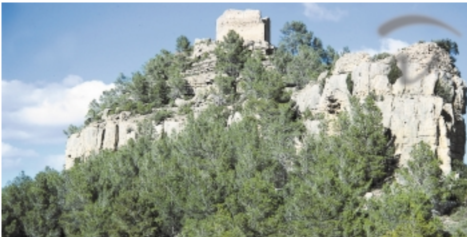
Foto 16. Se construyó el castillo sobre una estructura rocosa que se eleva y conforma una plataforma.