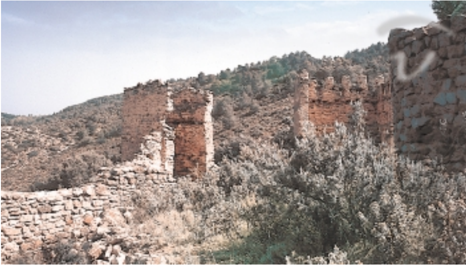
Foto 30. Torres interiores.