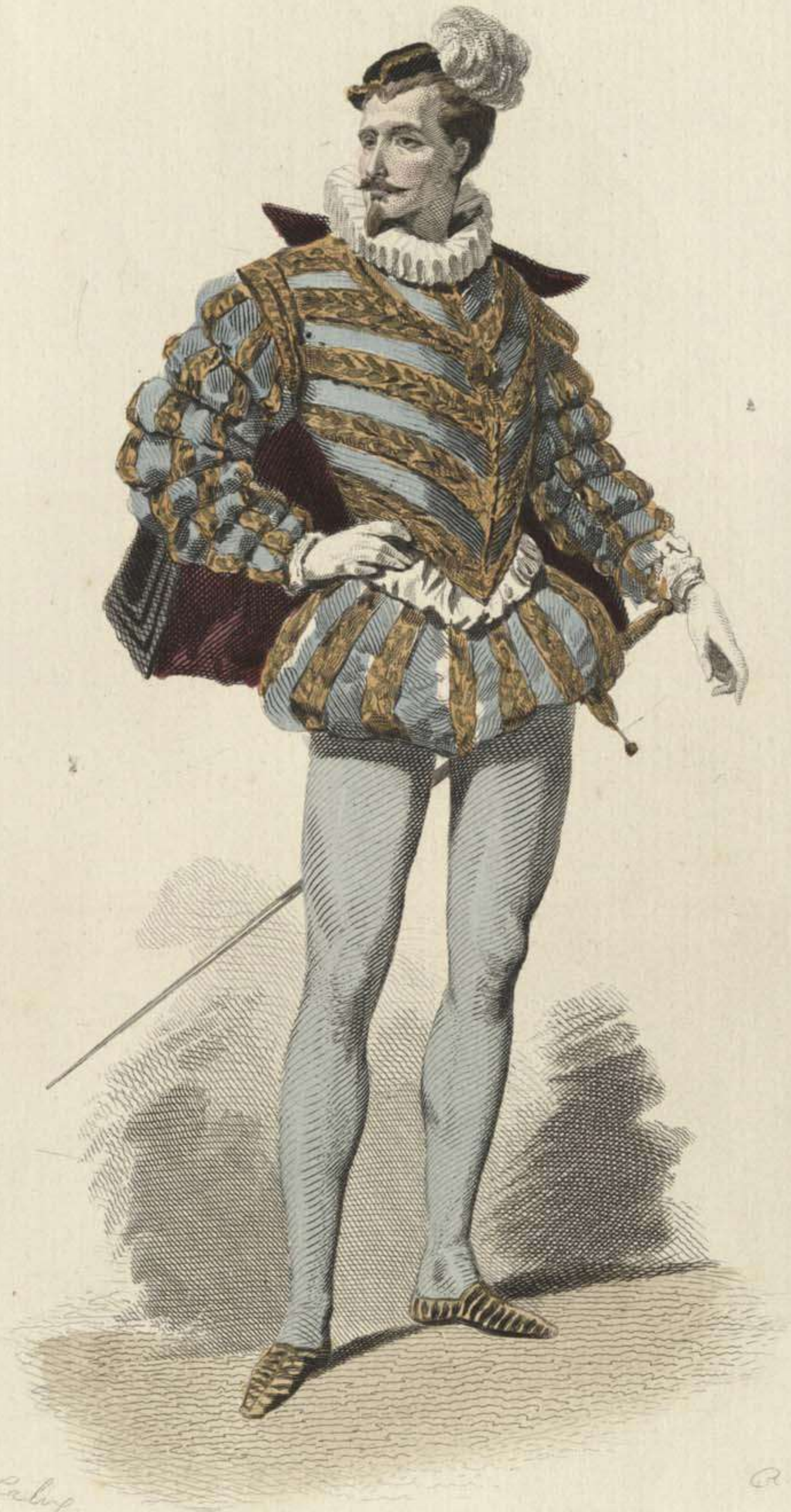
COUR DE HENRI III.