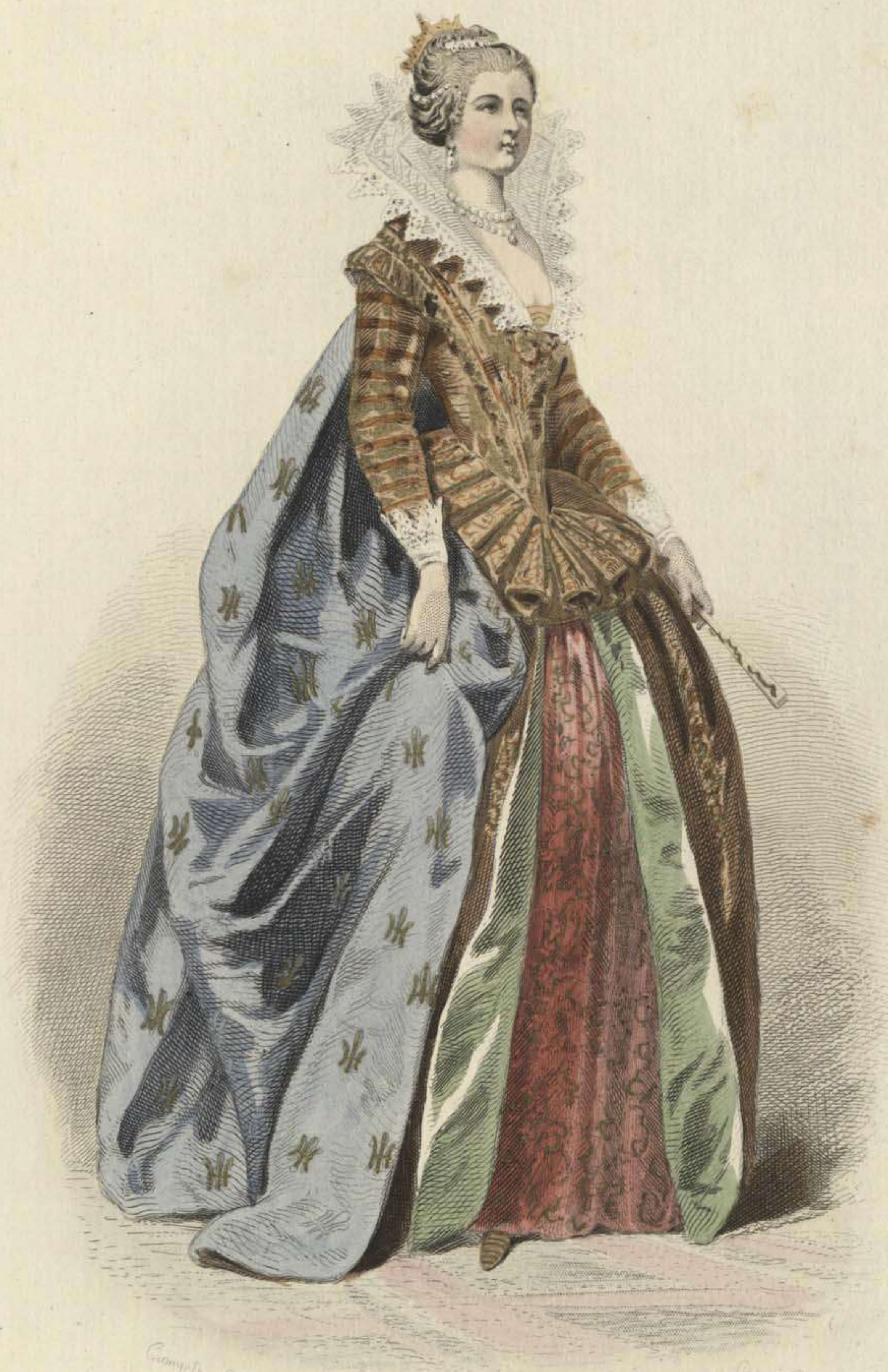
ROUPE DE MENDIANT