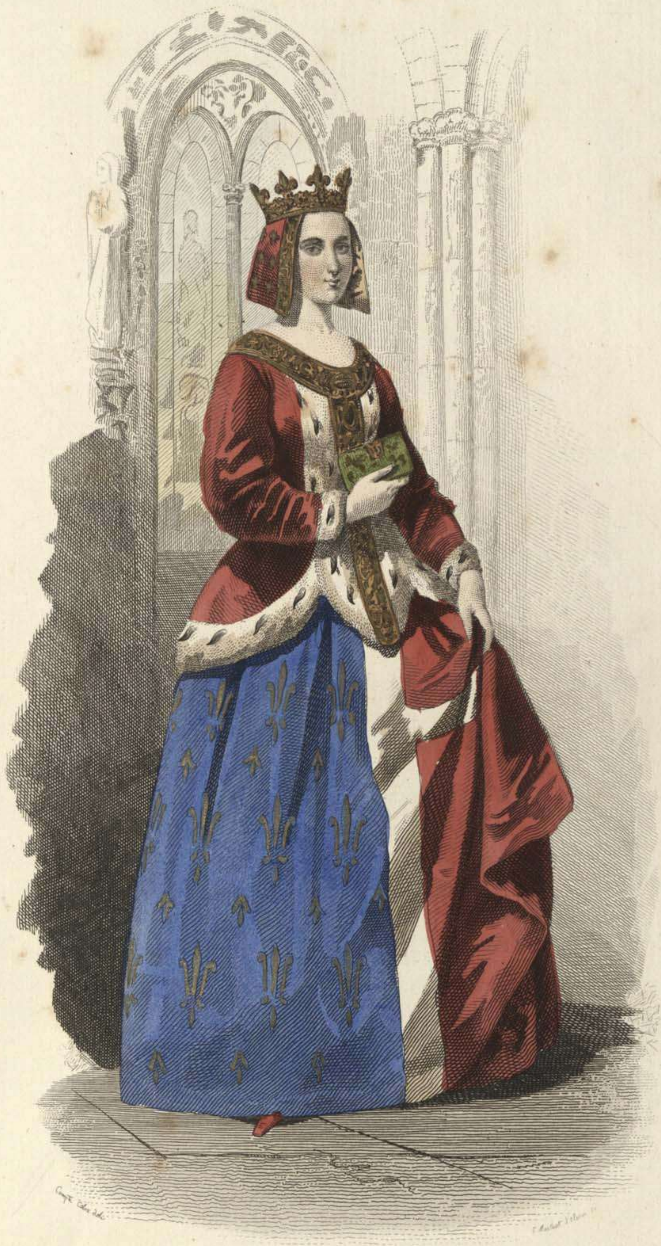
COUR DE LOUIS XI