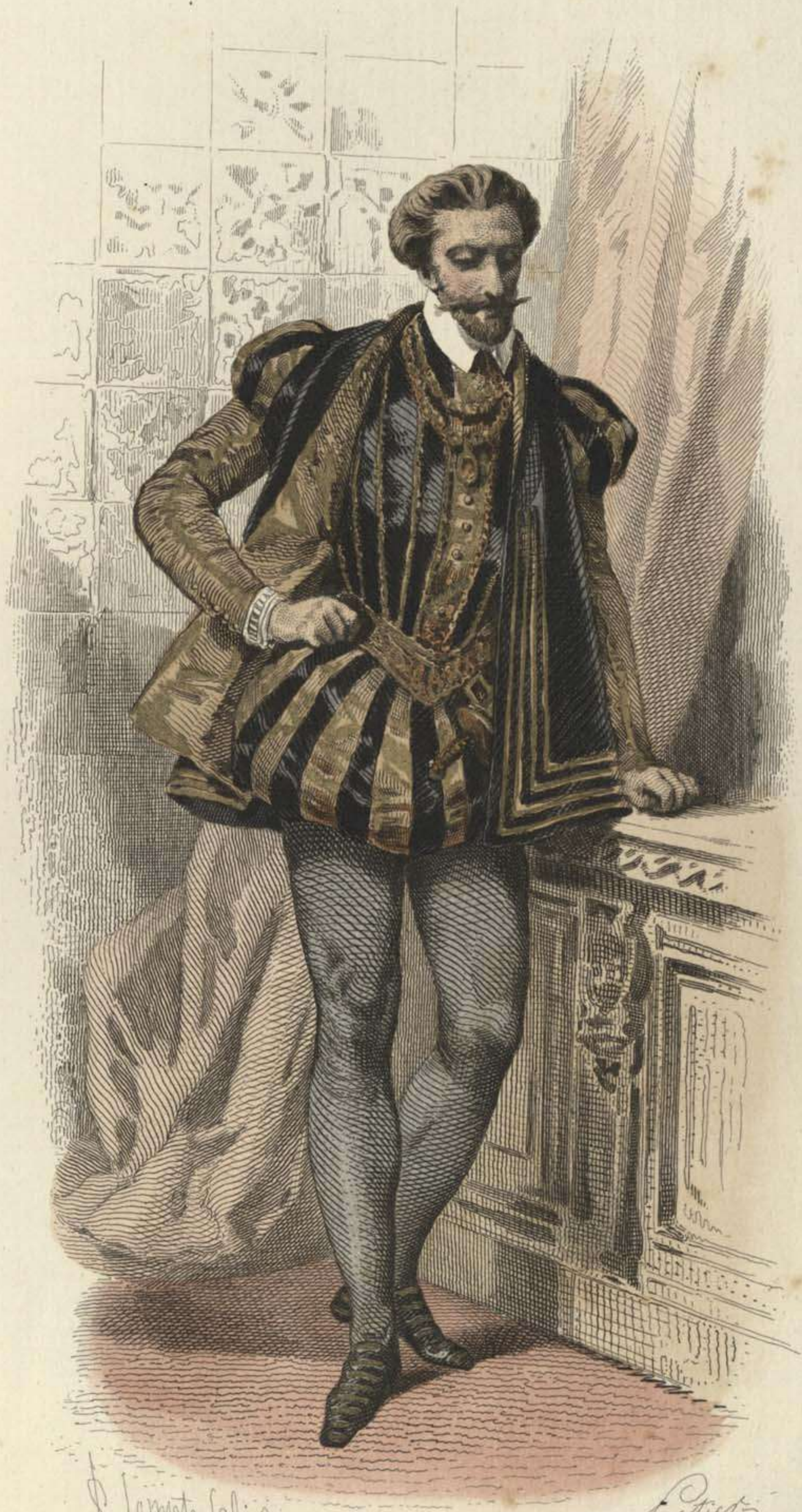
COUR DE HENRI II