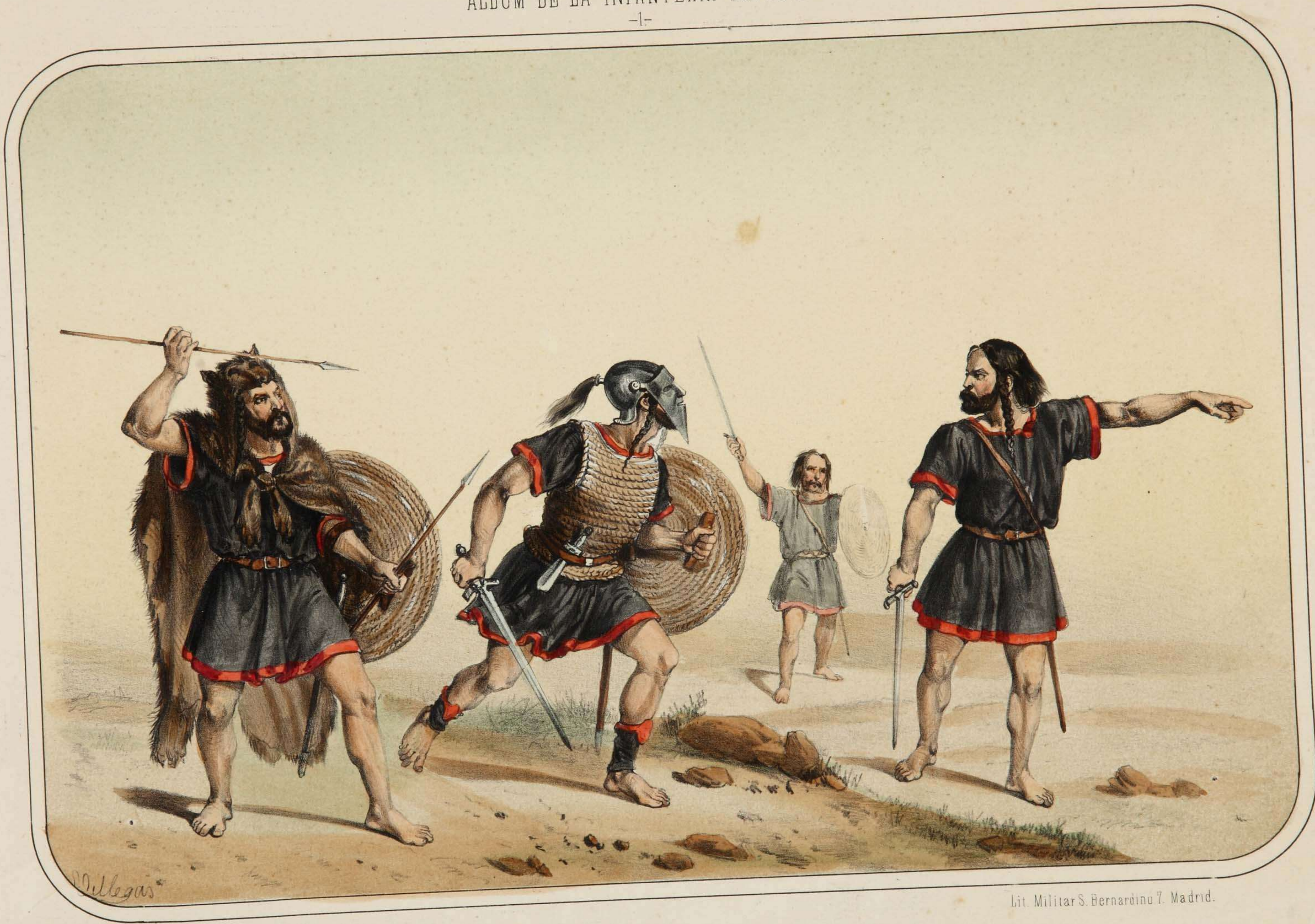
Villegas dibujó y litografió.