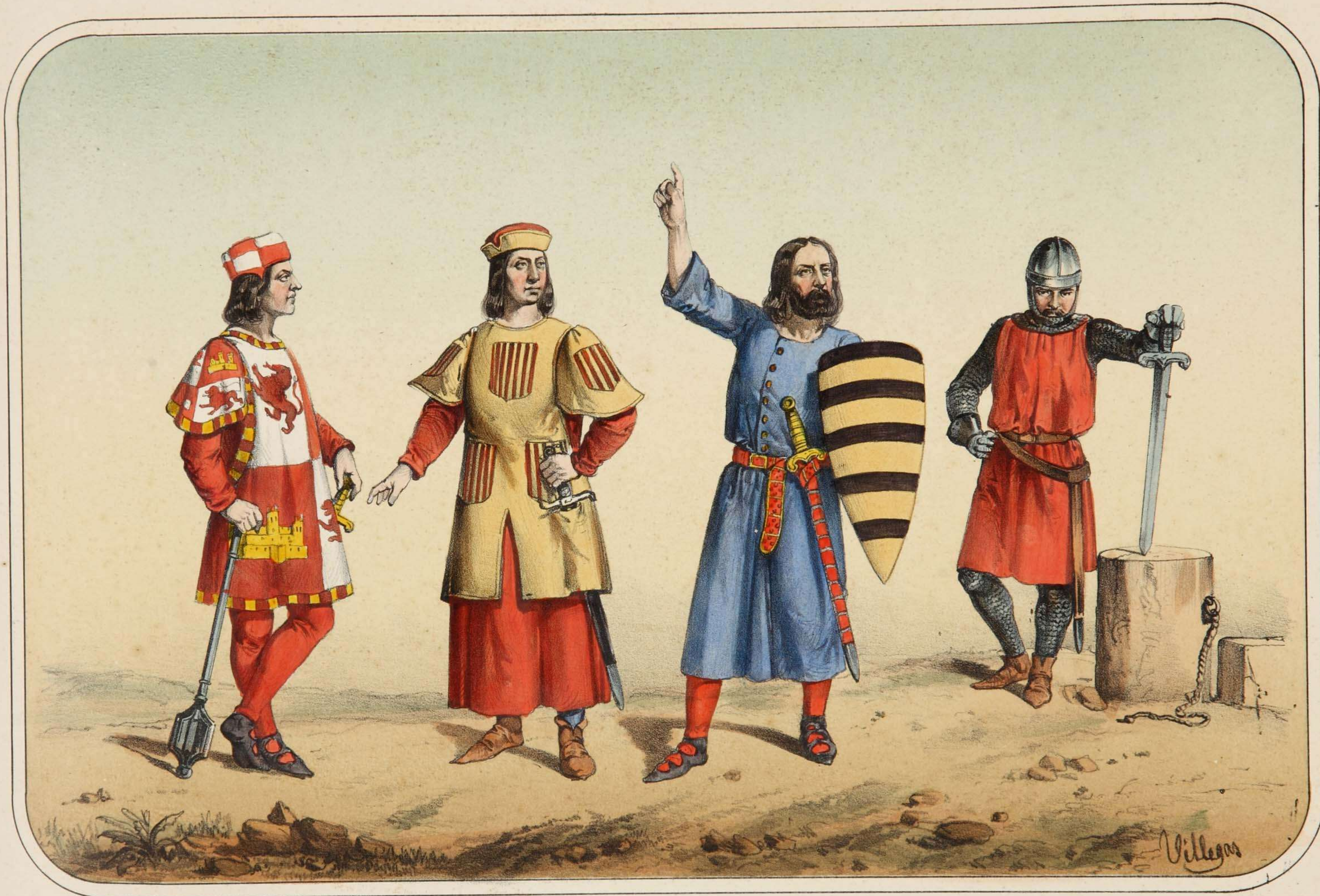
Villegas dibujó y litografió.