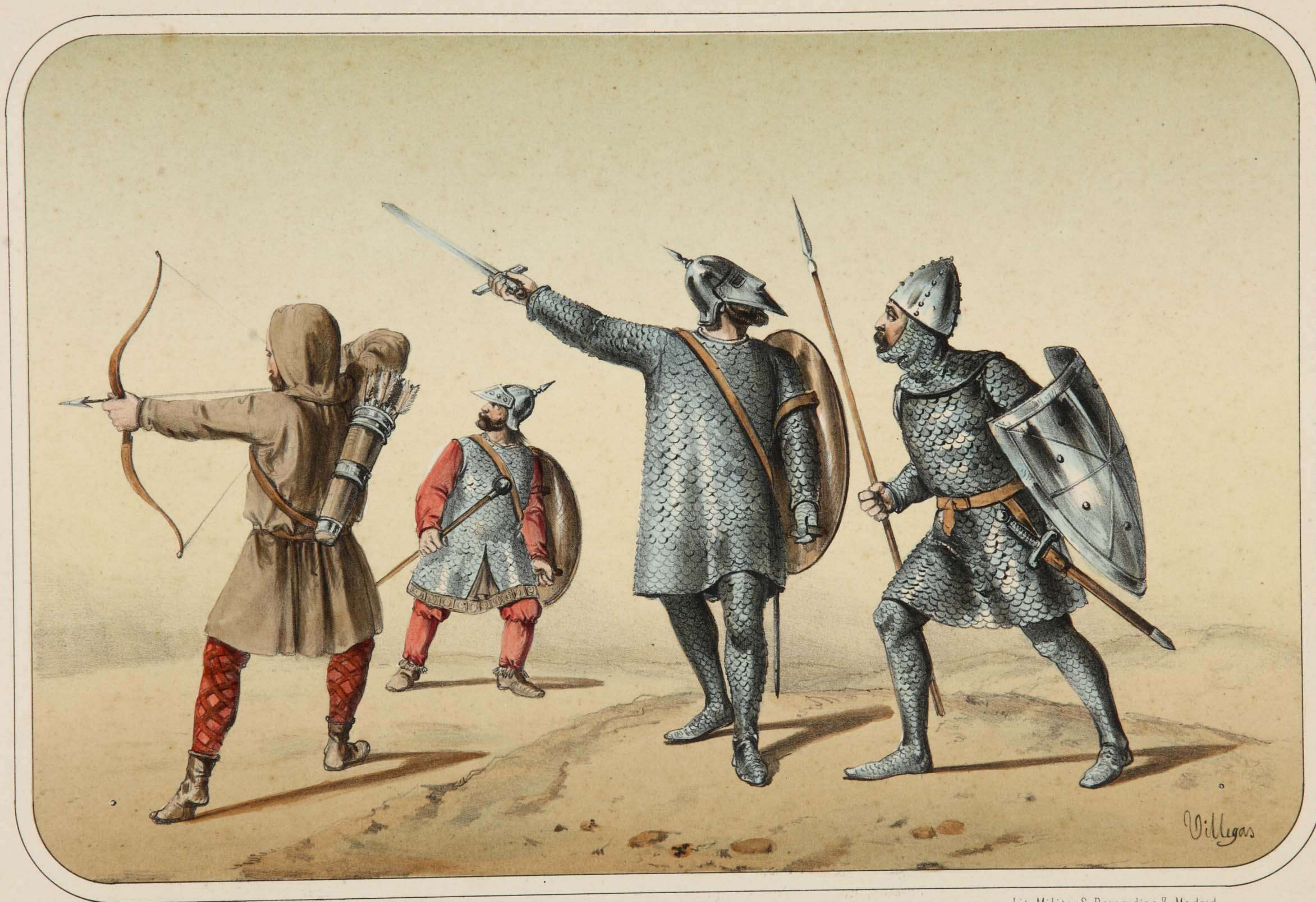
Villegas dibujó y litografió.