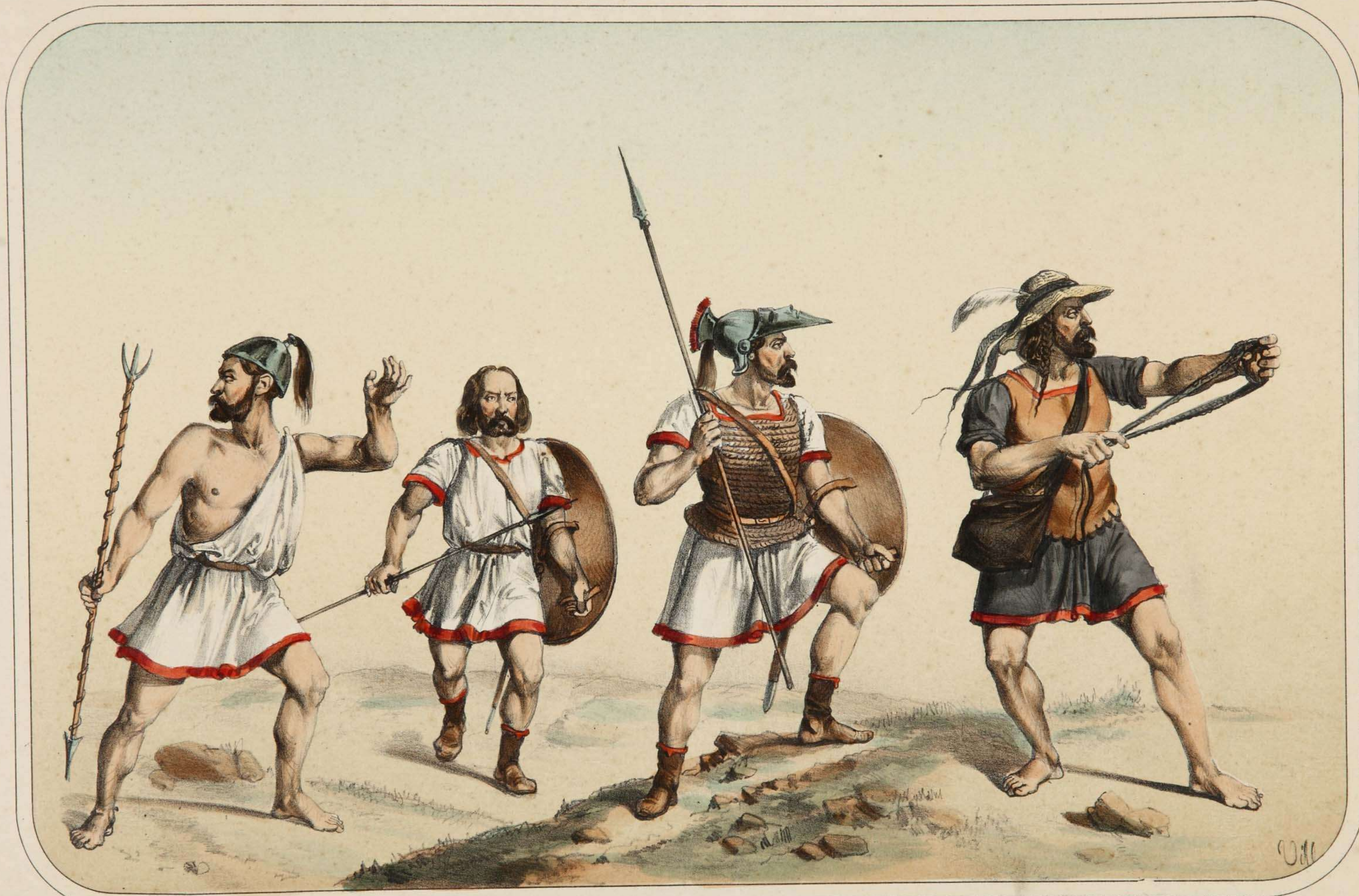
Villegas dibujó y litografió.