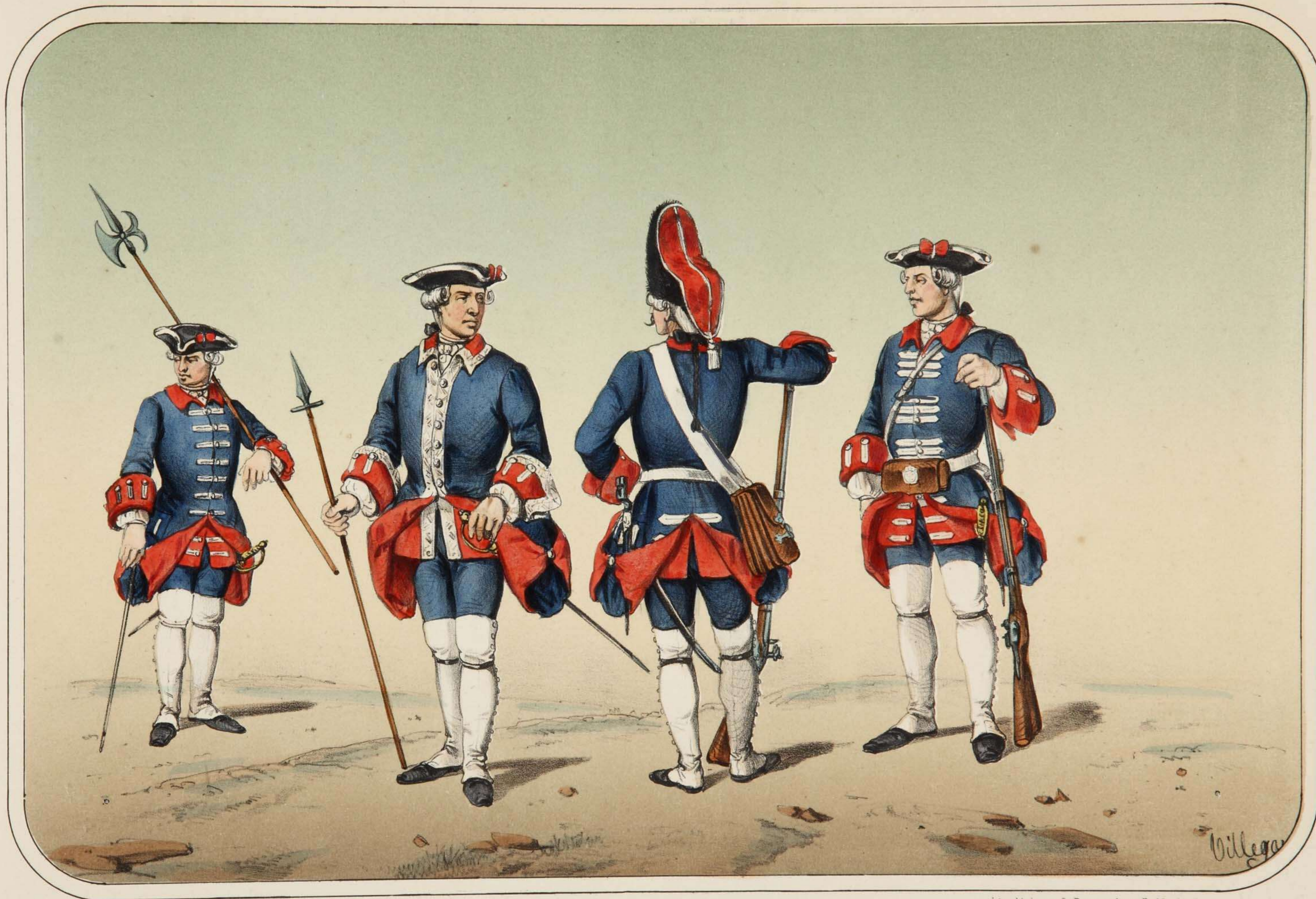
Villegas dibujo y litografía.