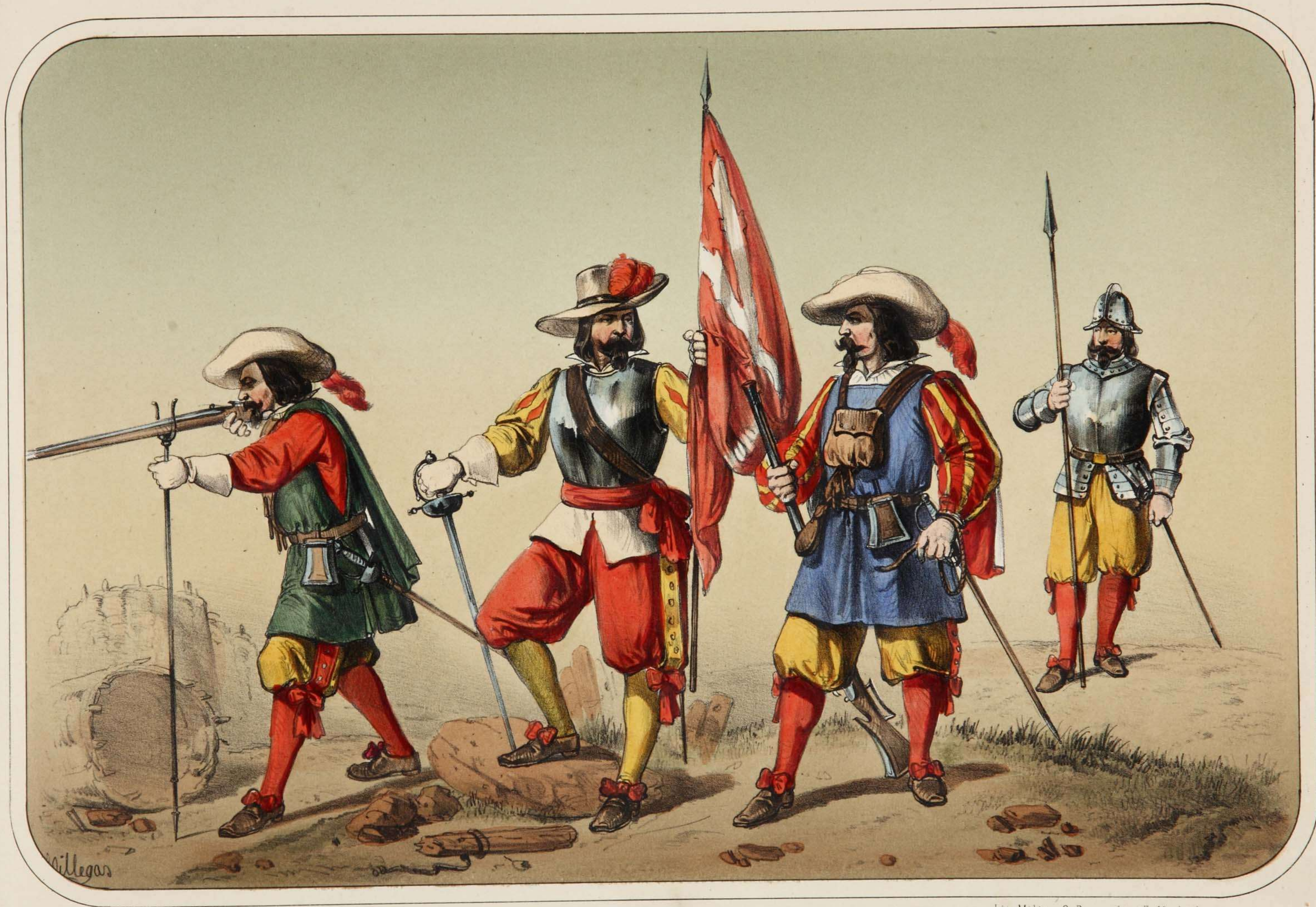
Villegas dibujó y litografió.