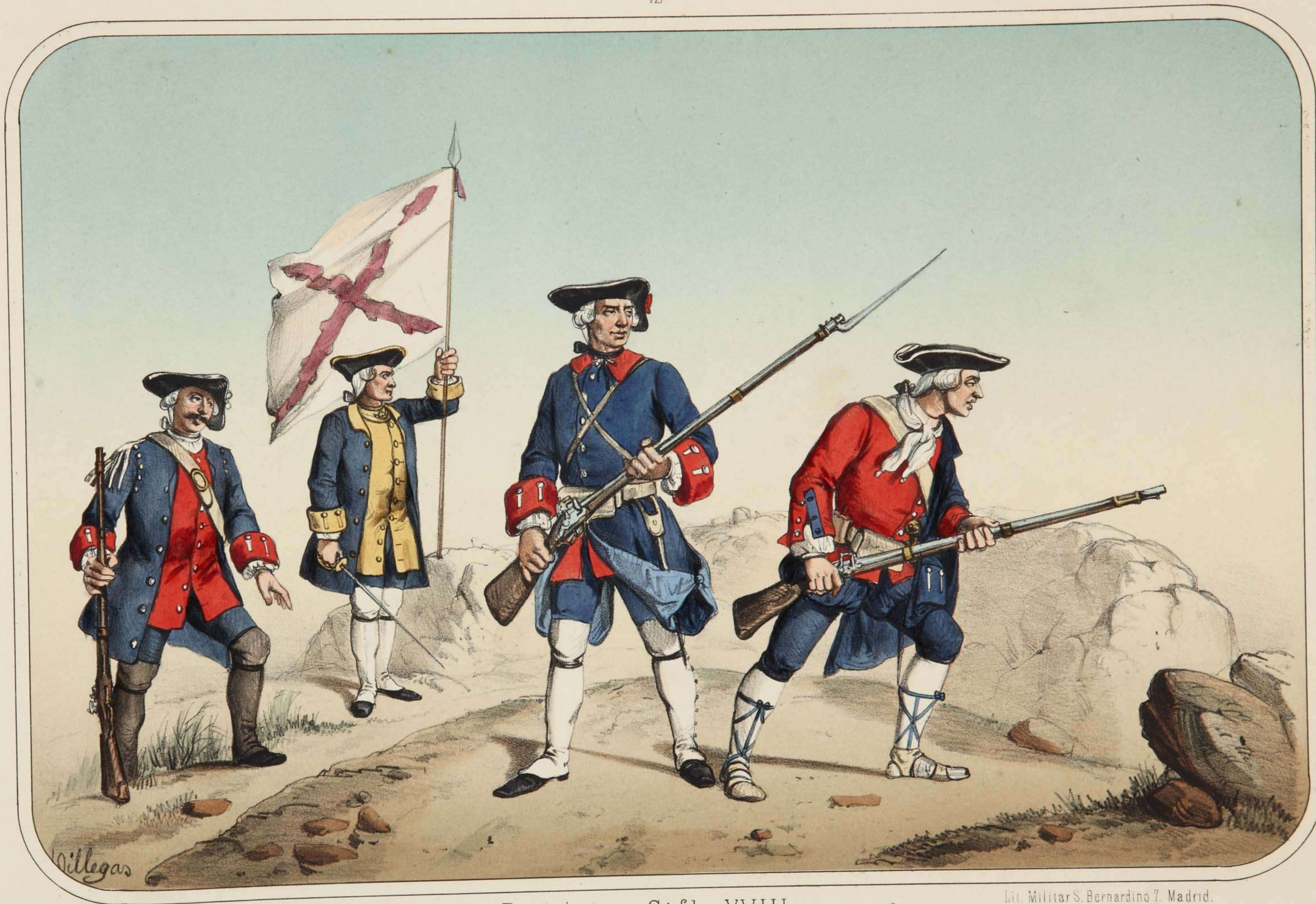
Villegas dibujo y litografía.