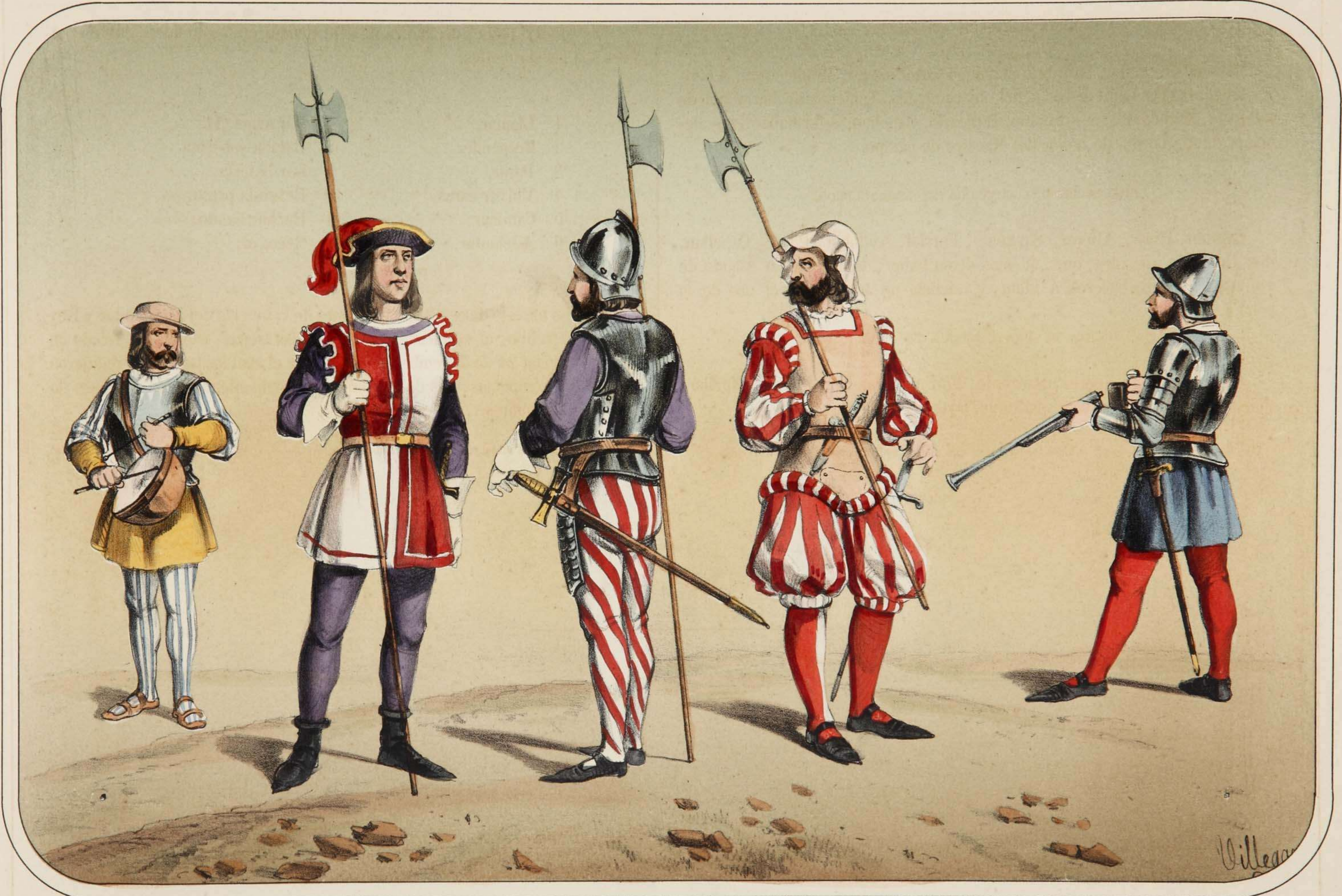
Villeças dibujó y litógráfico.