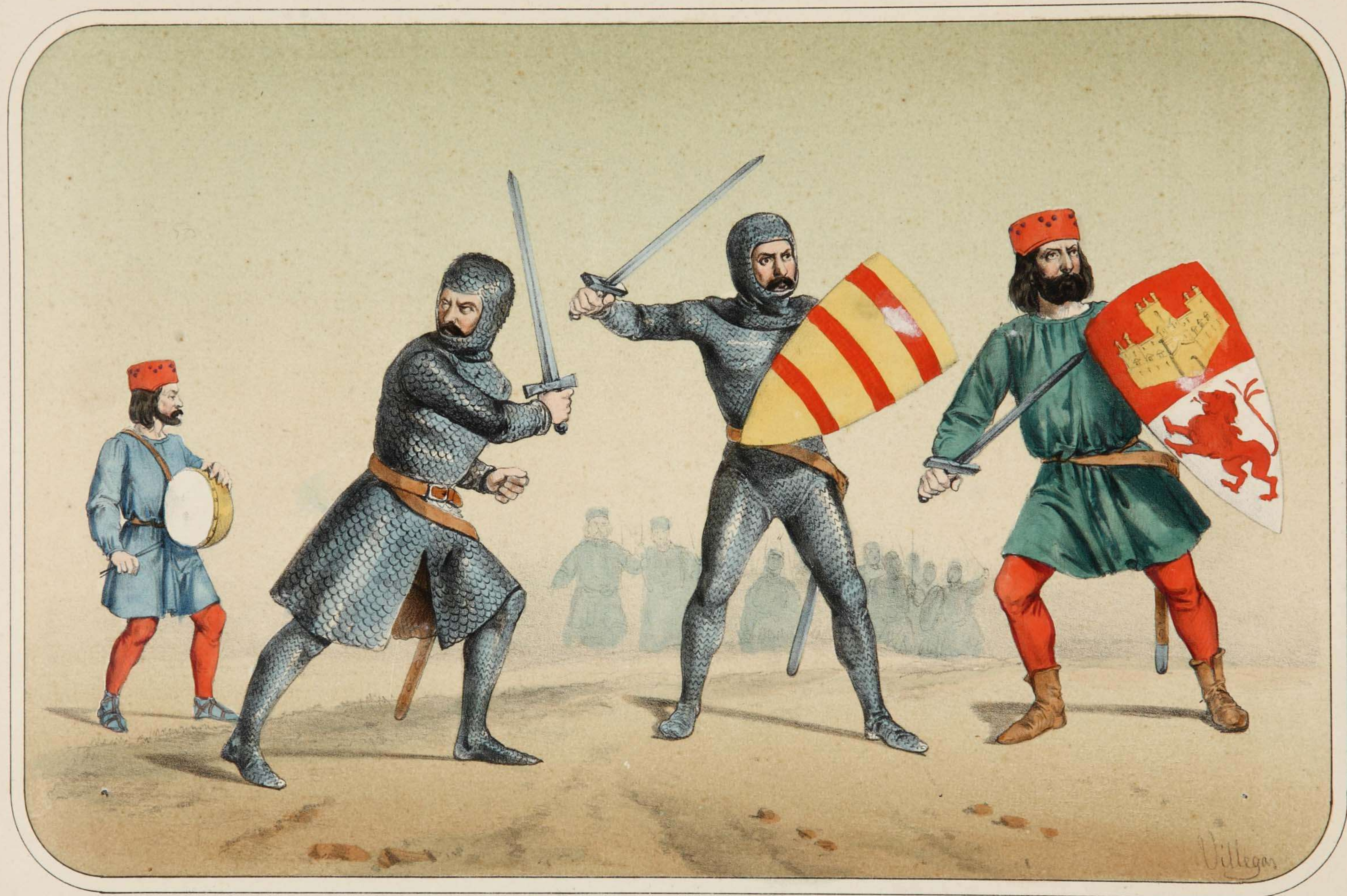
Villegas dibujó y litografió.