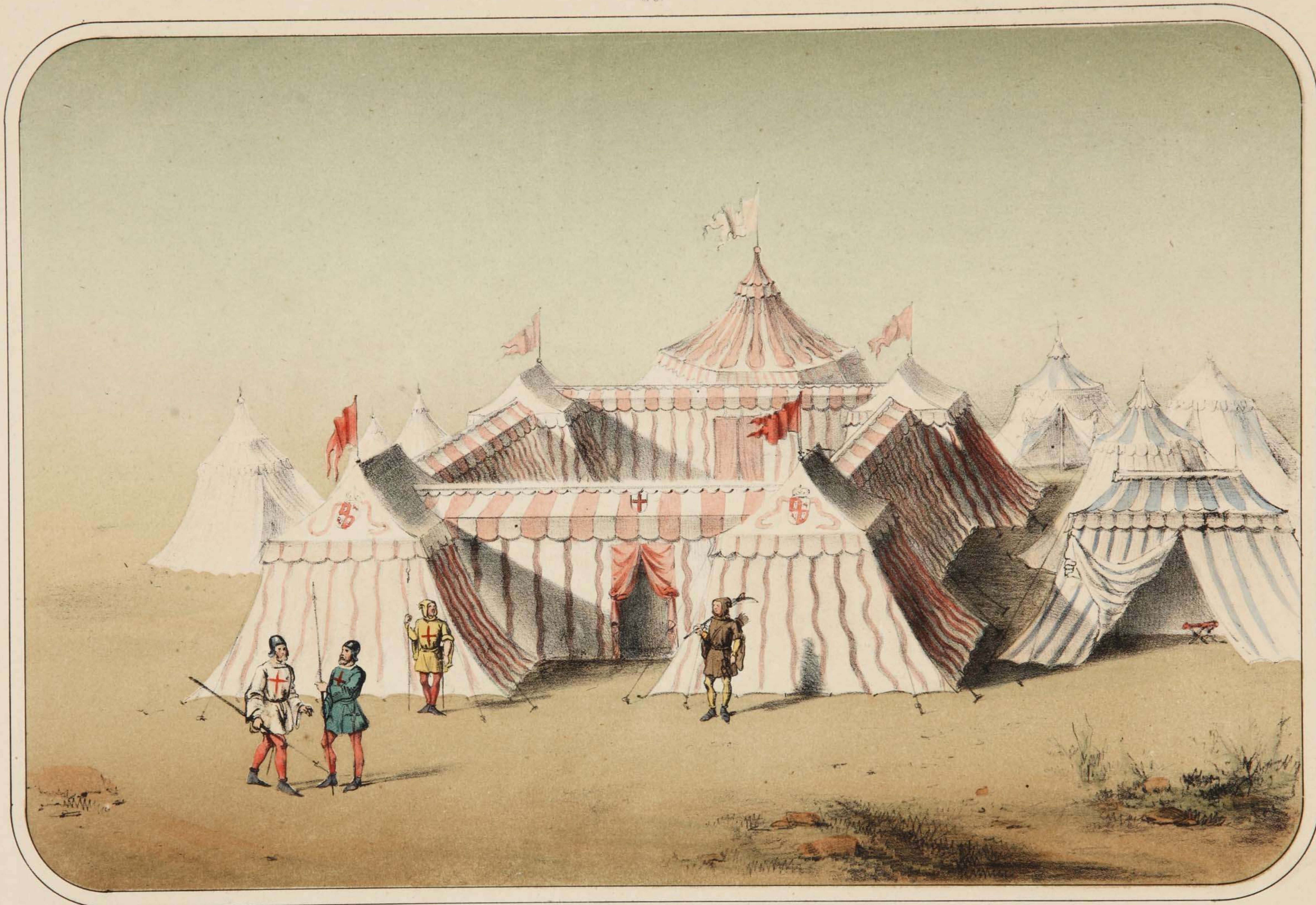
Edad media Siglo XV (Año 1493)