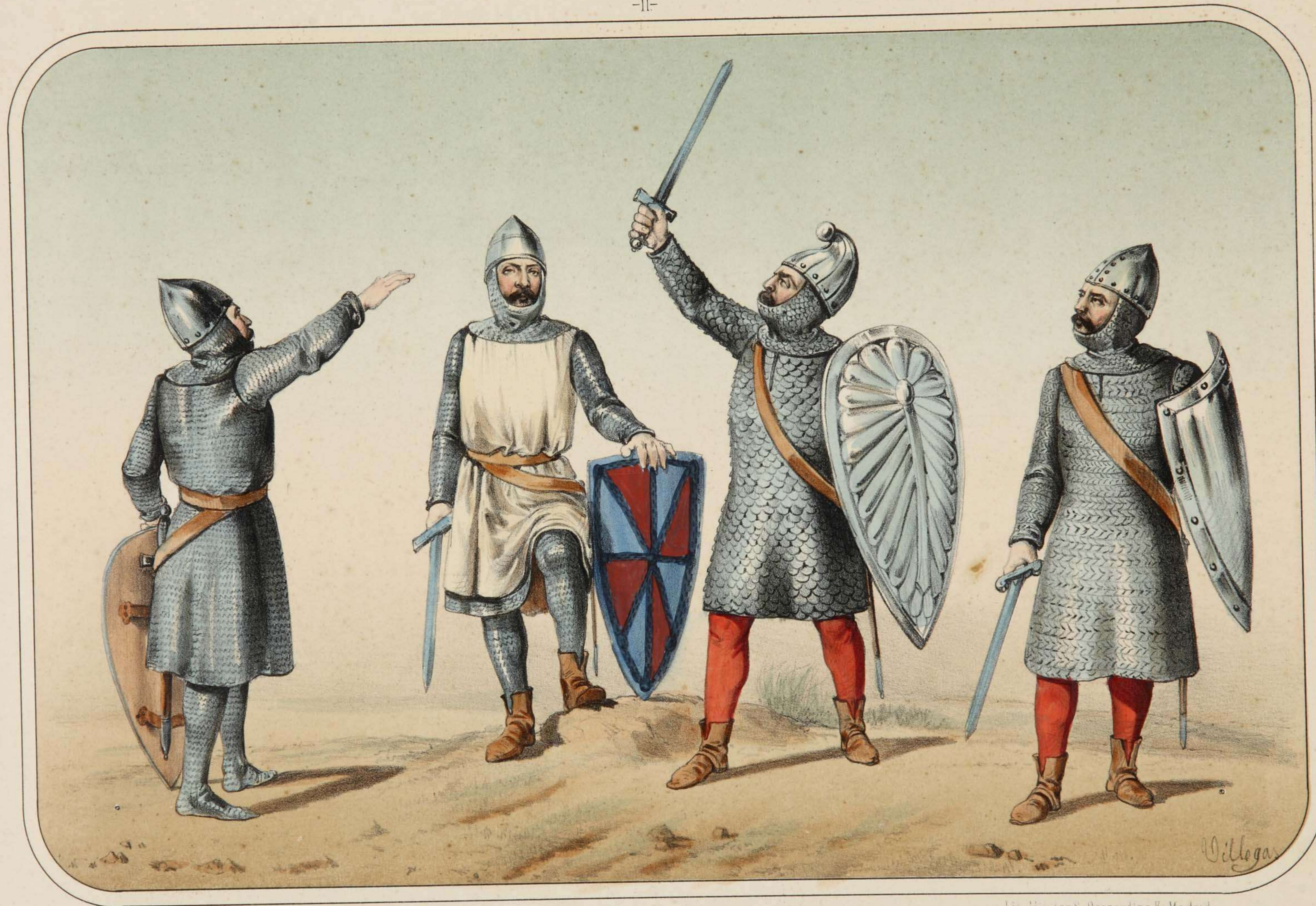
Villegas dibujó y litografió.