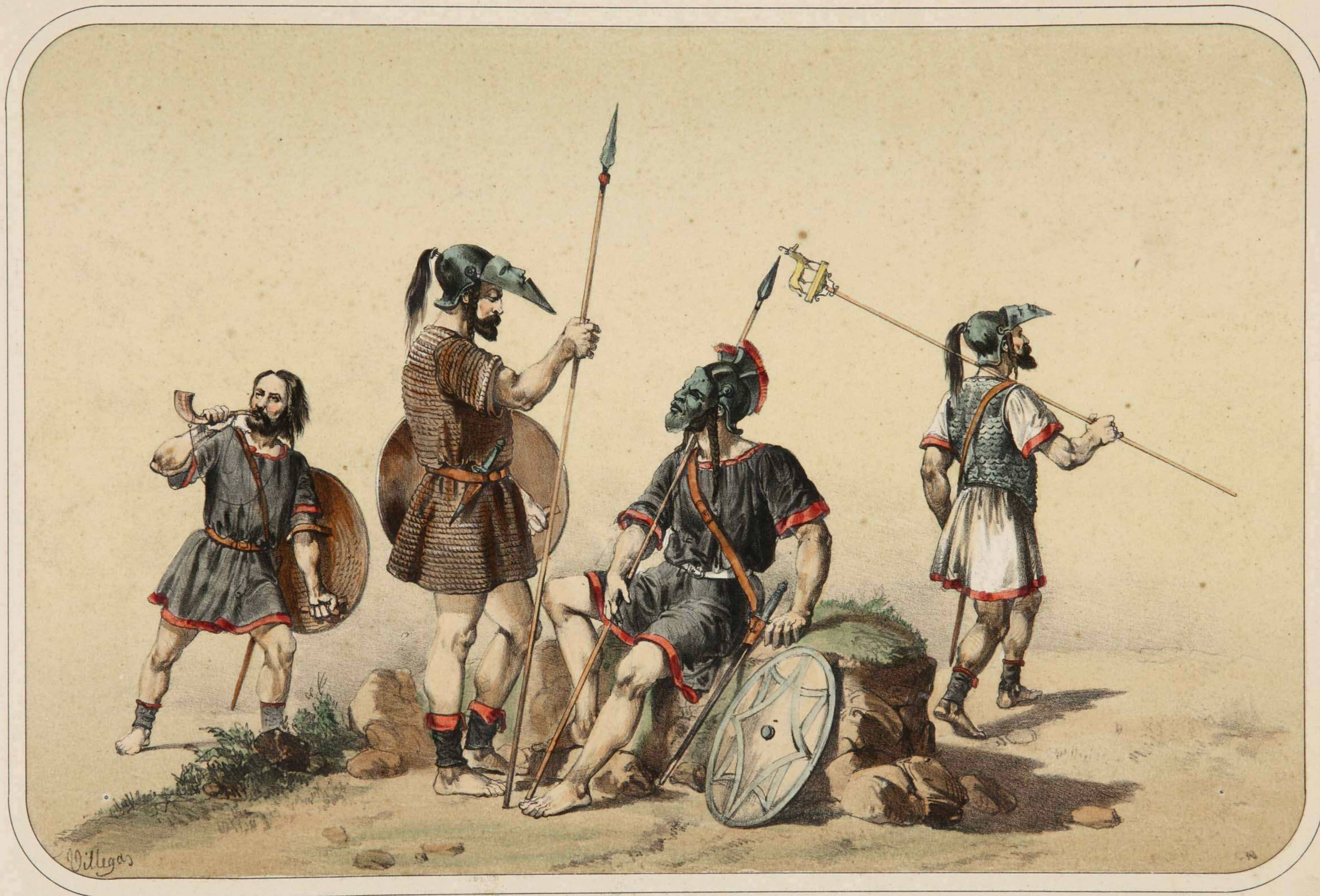
Villegas dibujó y litografió.