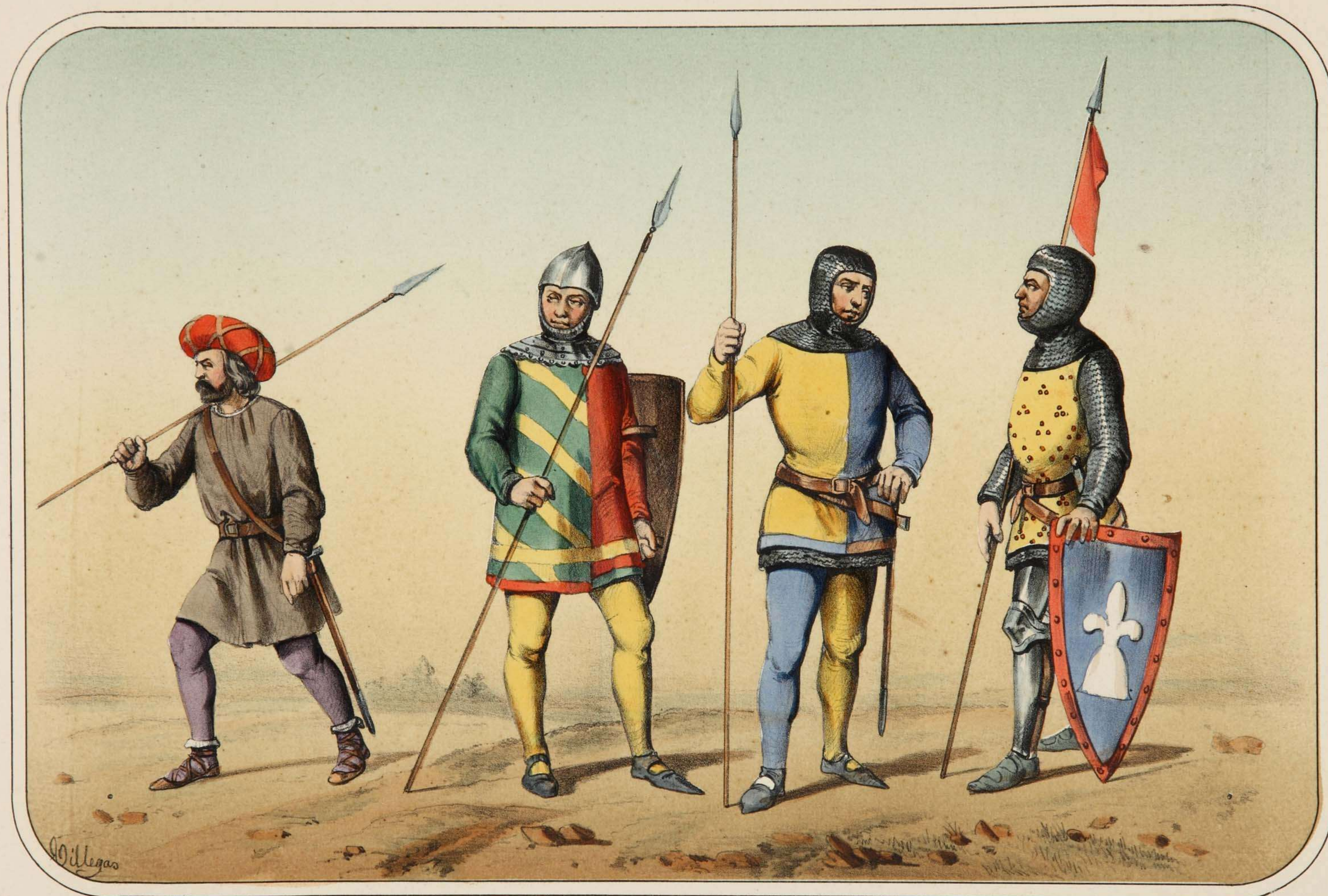
Villegas dibujó y litografió.