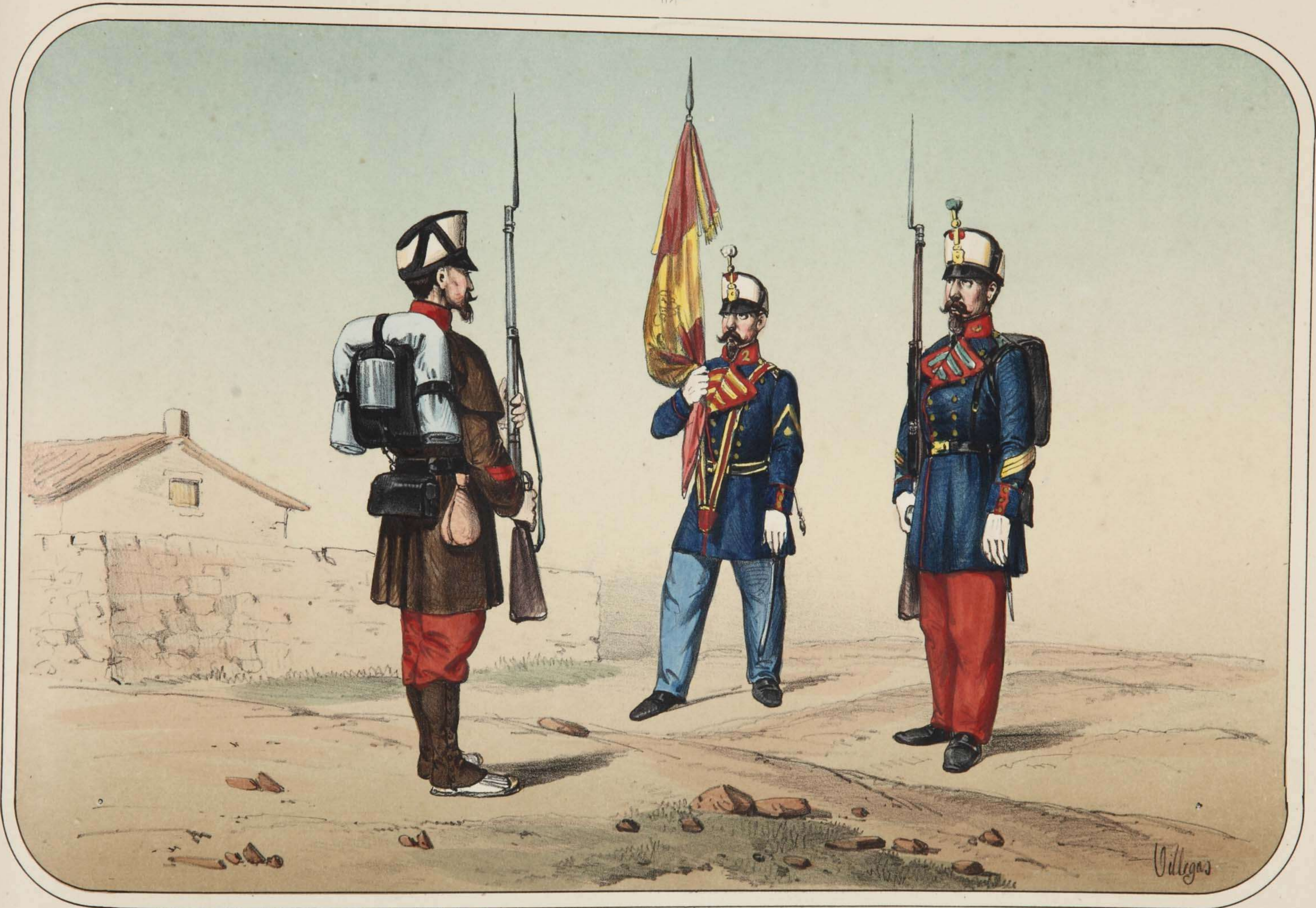
Villegas dibujó y litógráfico.