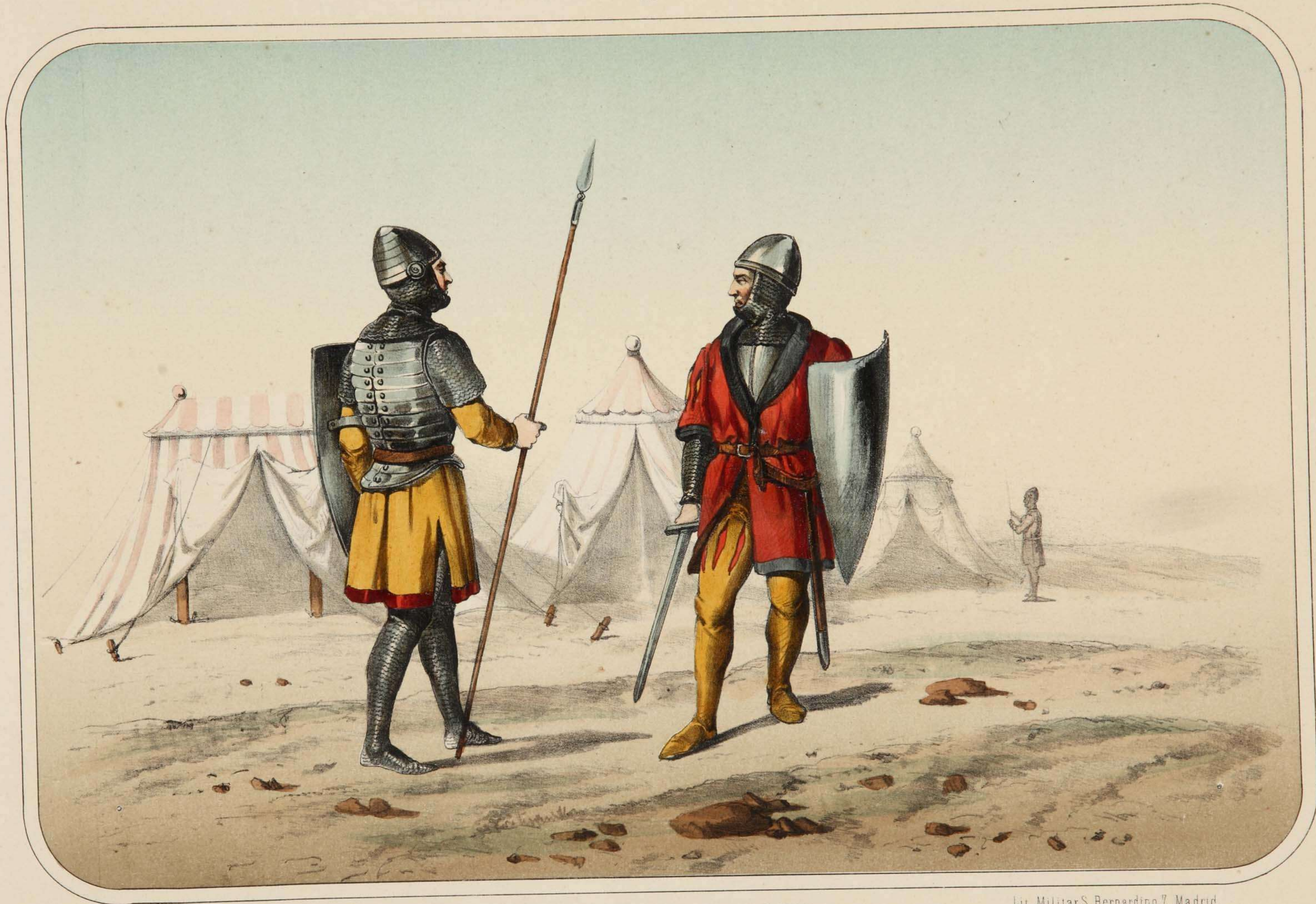
Villegas dibujó y litografió.