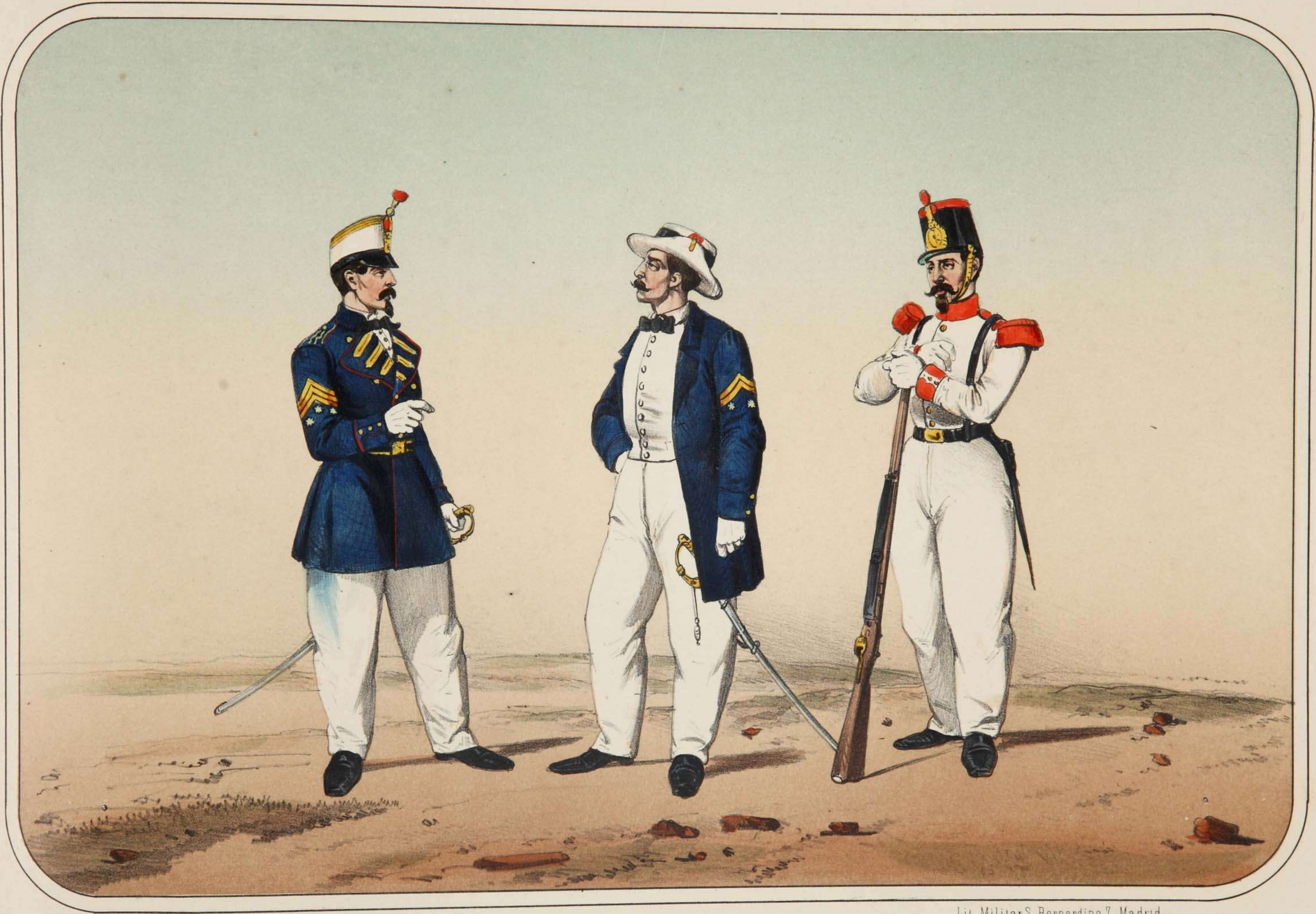
Villegas dibujó y litografió.