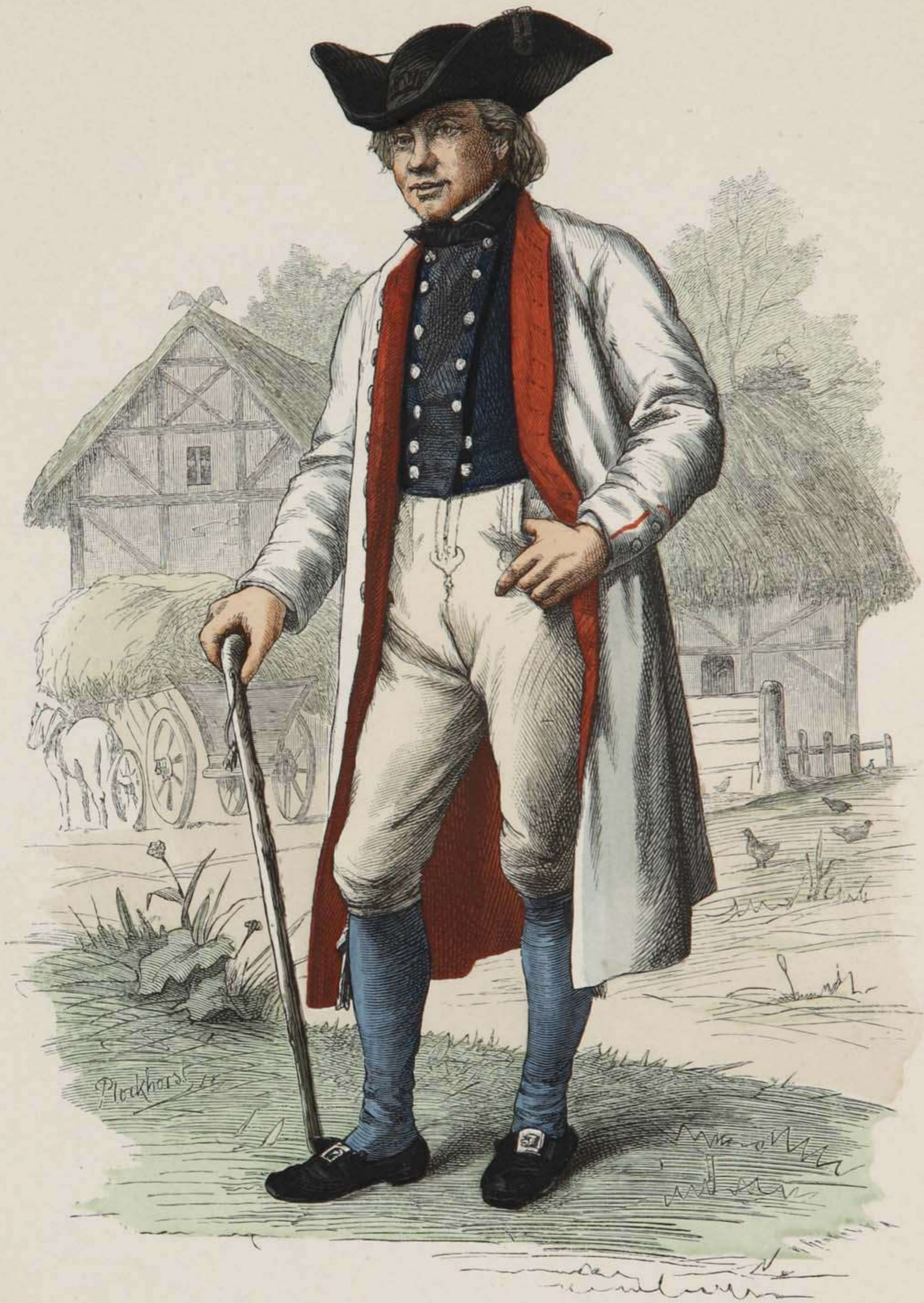
Bauer aus Bortfeld bei Braunschweig.