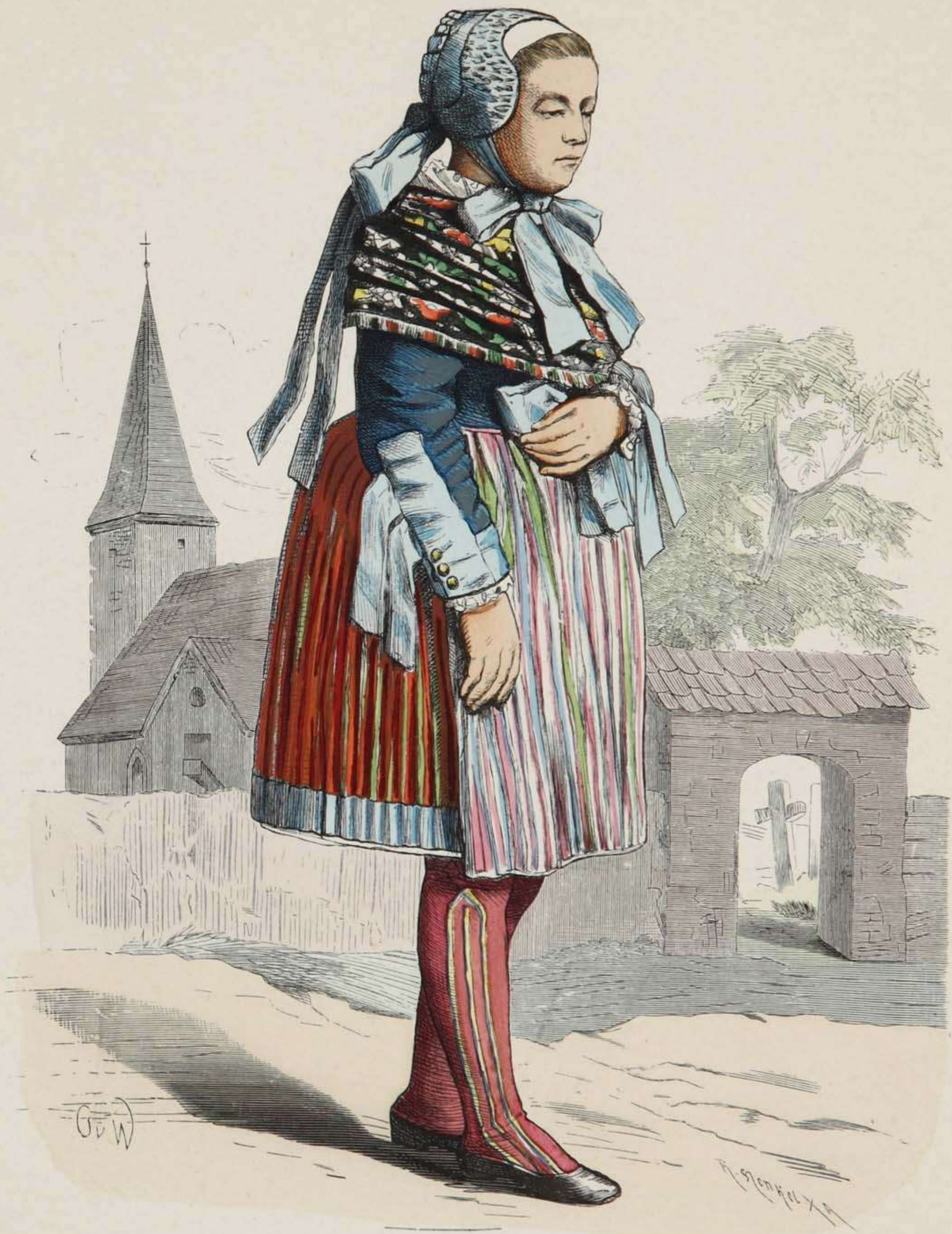
Pommersches Bauernmädchen aus dem Weizacker (Kreis Pyritz).