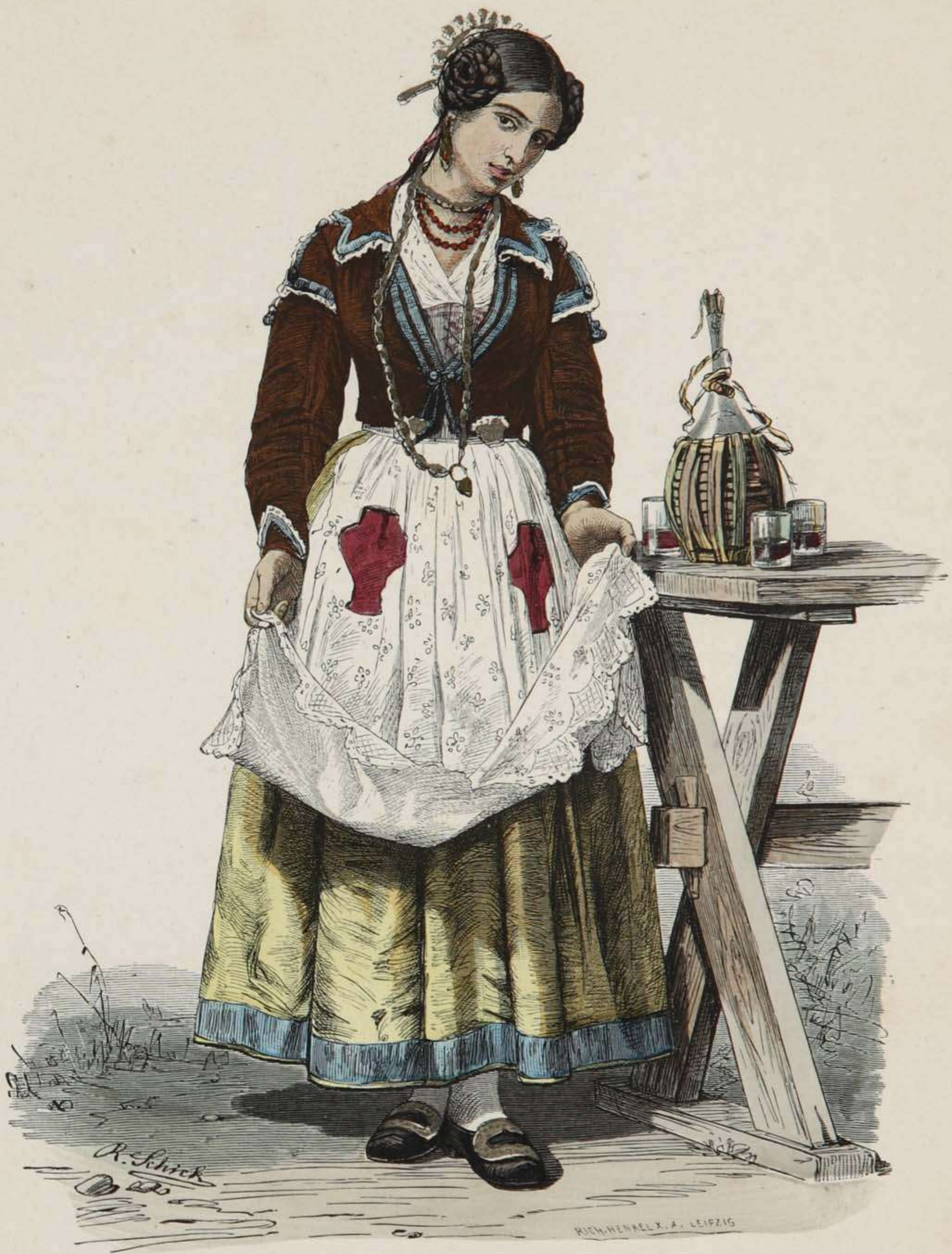
Mädchen aus Trastevere (Rom).