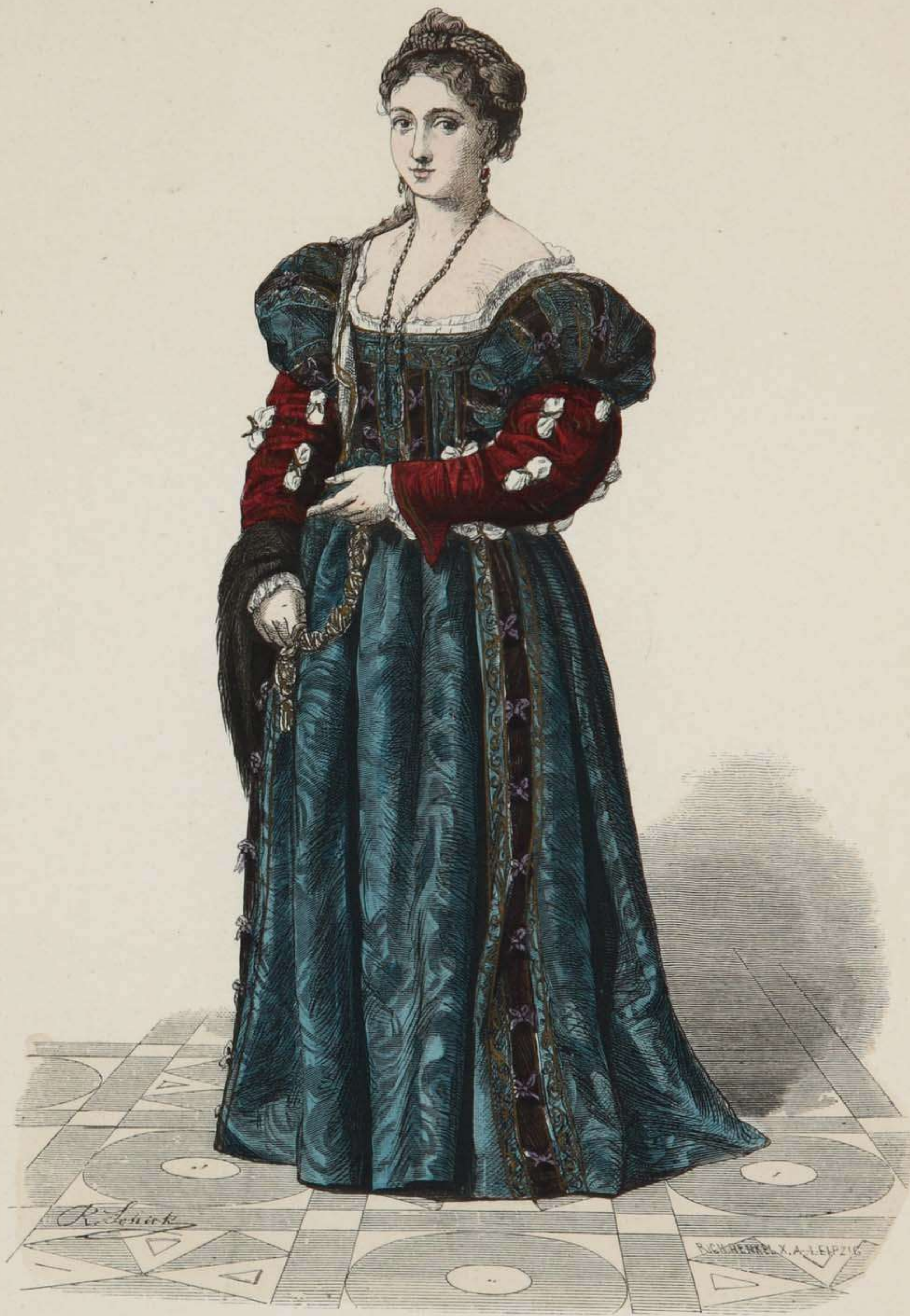
Italienische Fürstin, Anfang des XVI. Jahrhunderts. (La Bella di Tiziano.)