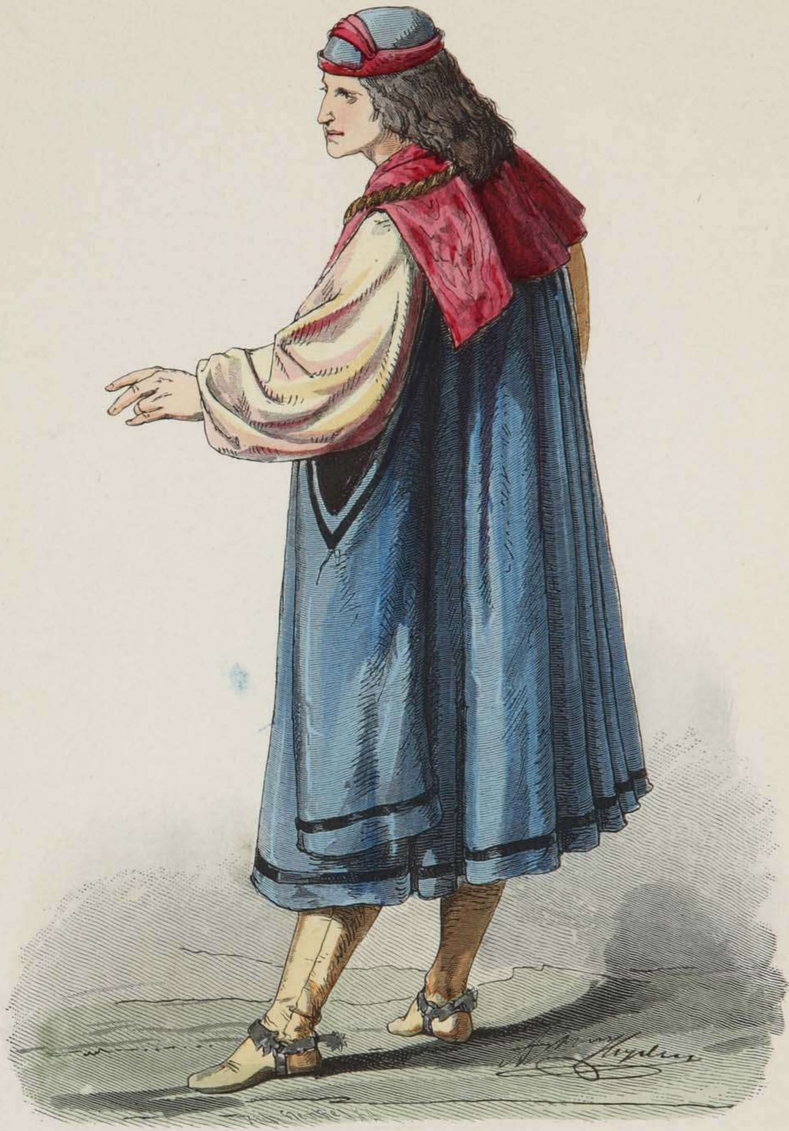
Burgundischer Edelmann. XV. Jahrhundert.