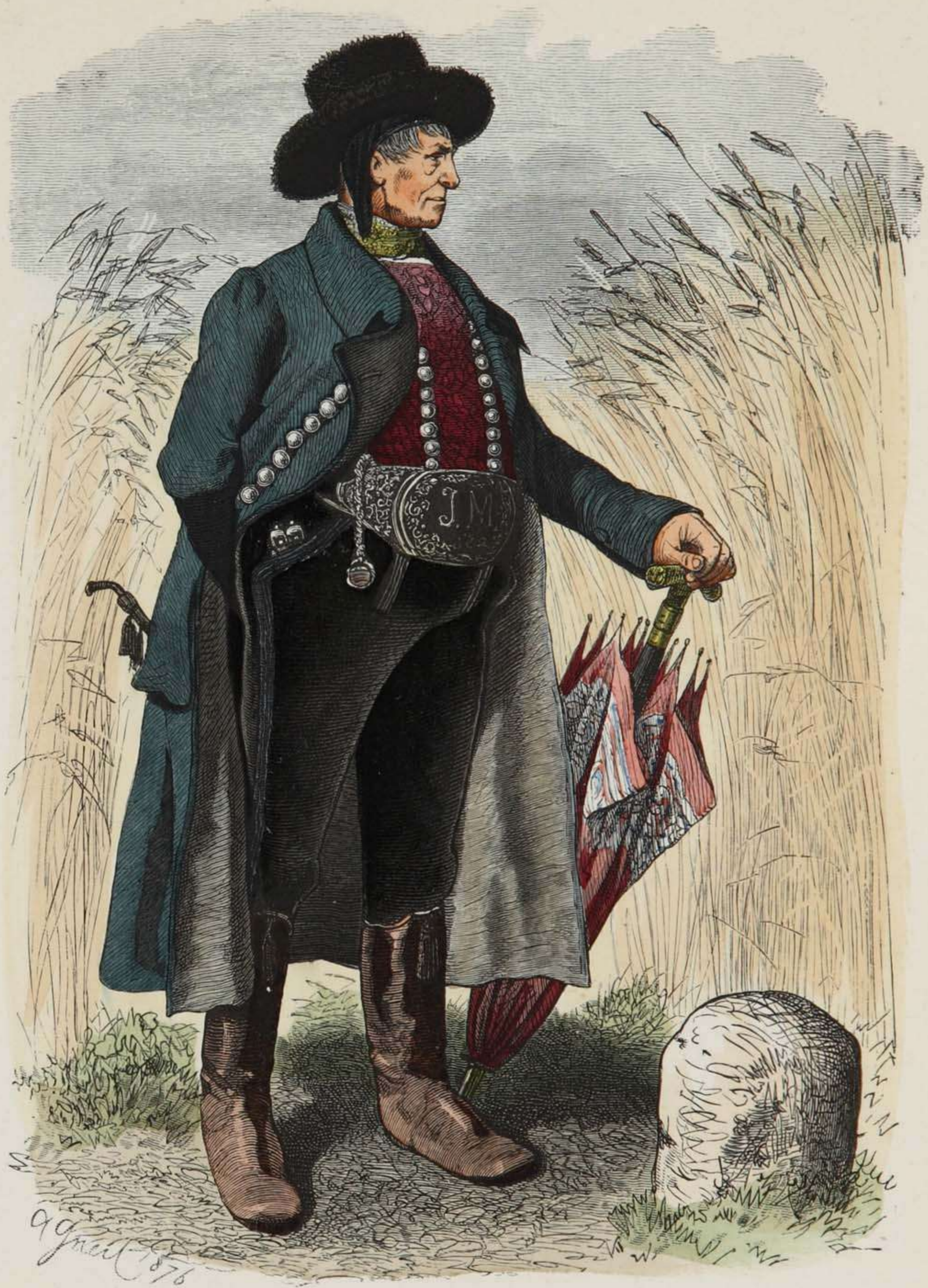
Bauer aus Ober-Oesterreich (Traunkreis).