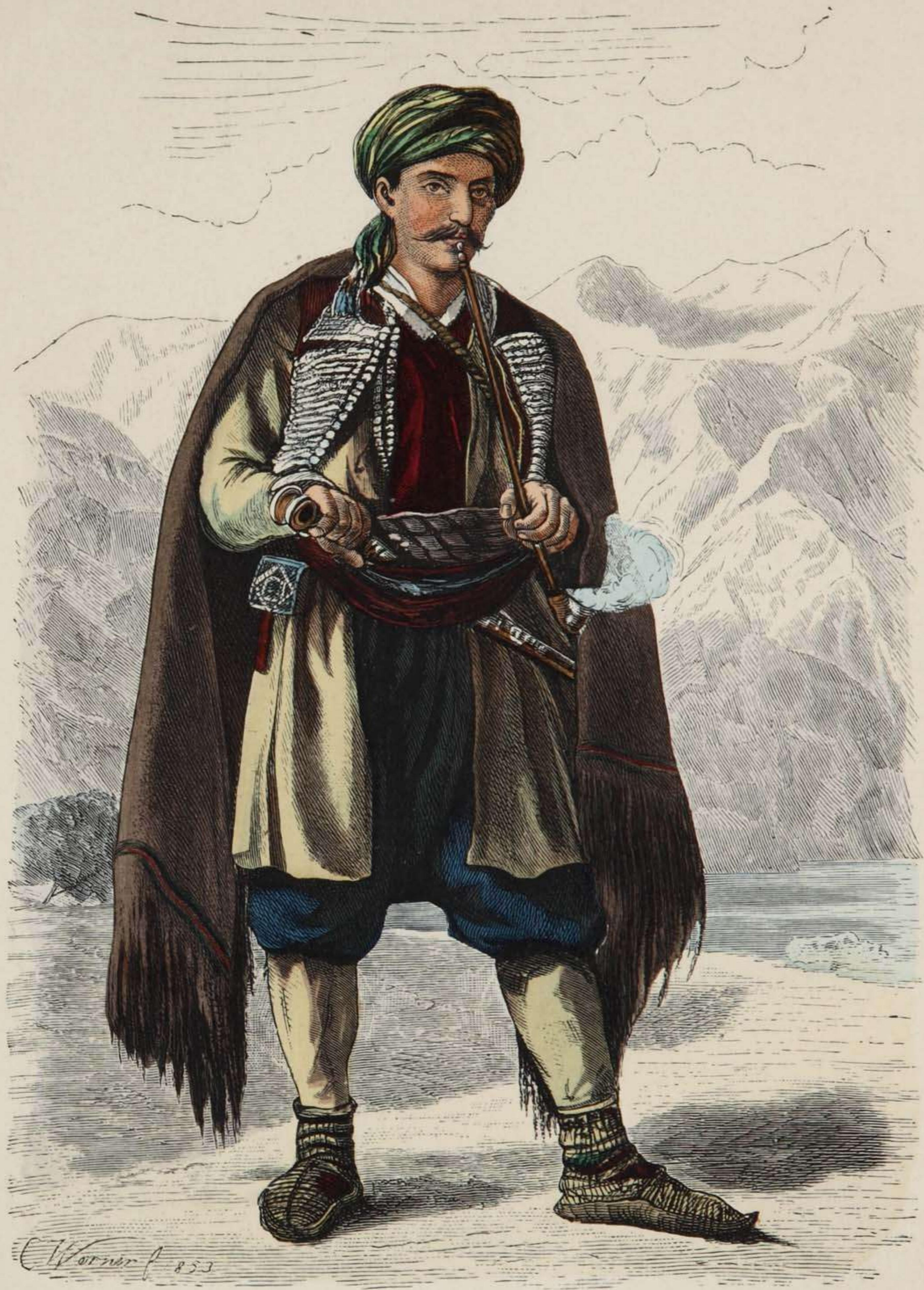
Montenegriner aus Cettinje.