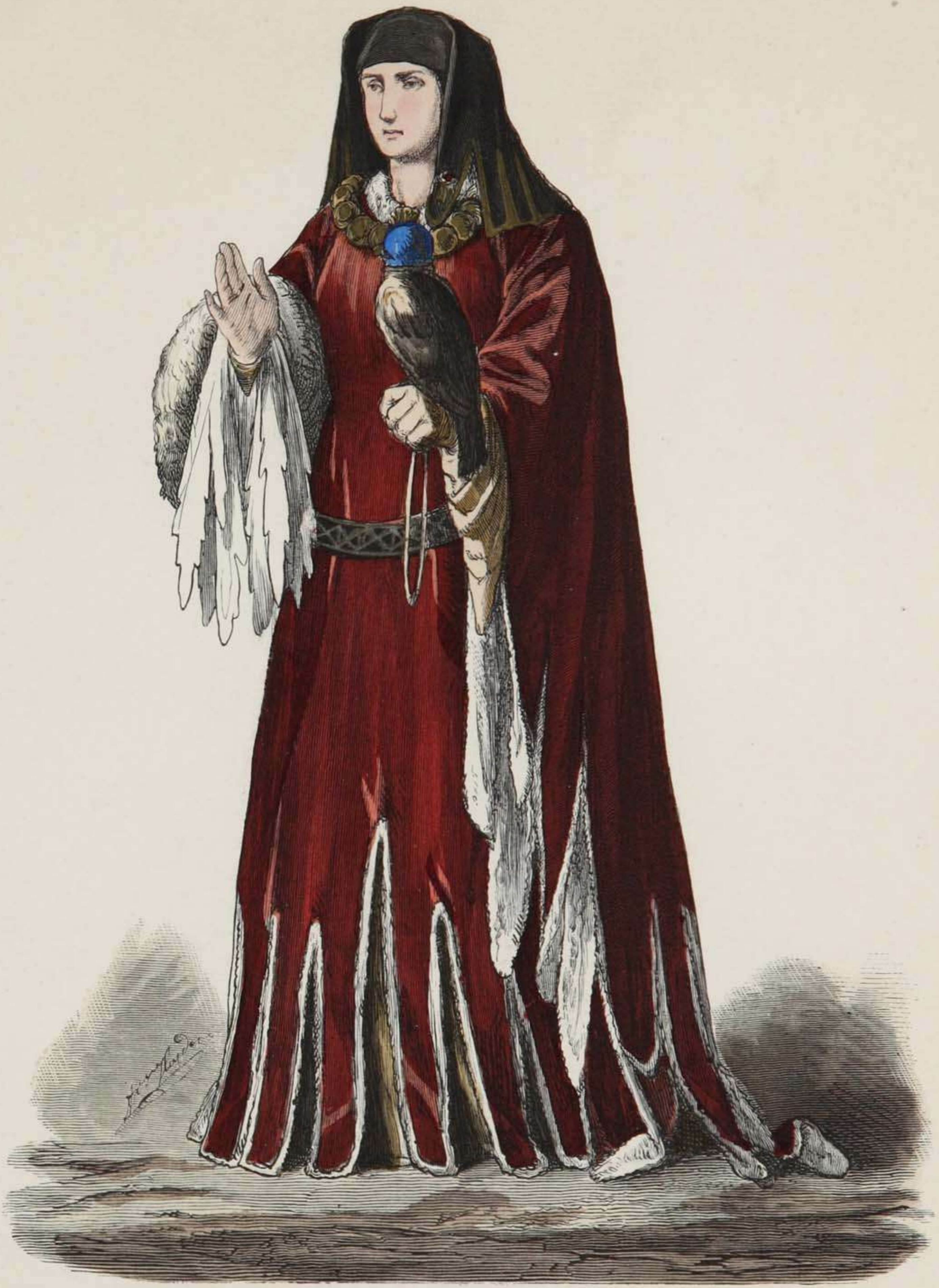
Burgundische Fürstin. Anfang des XV. Jahrhunderts.