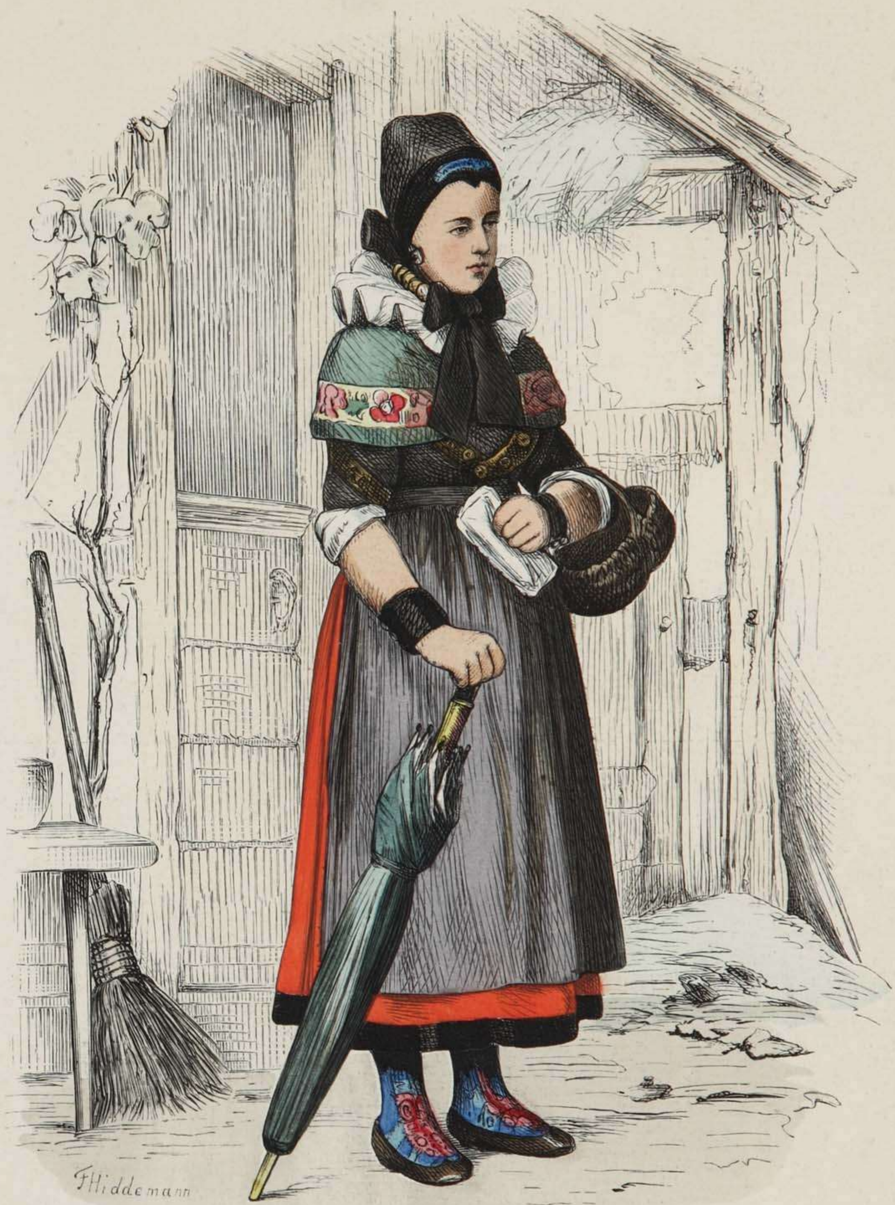
Bäuerin aus Klein-Bremen bei Minden (Westfalen).