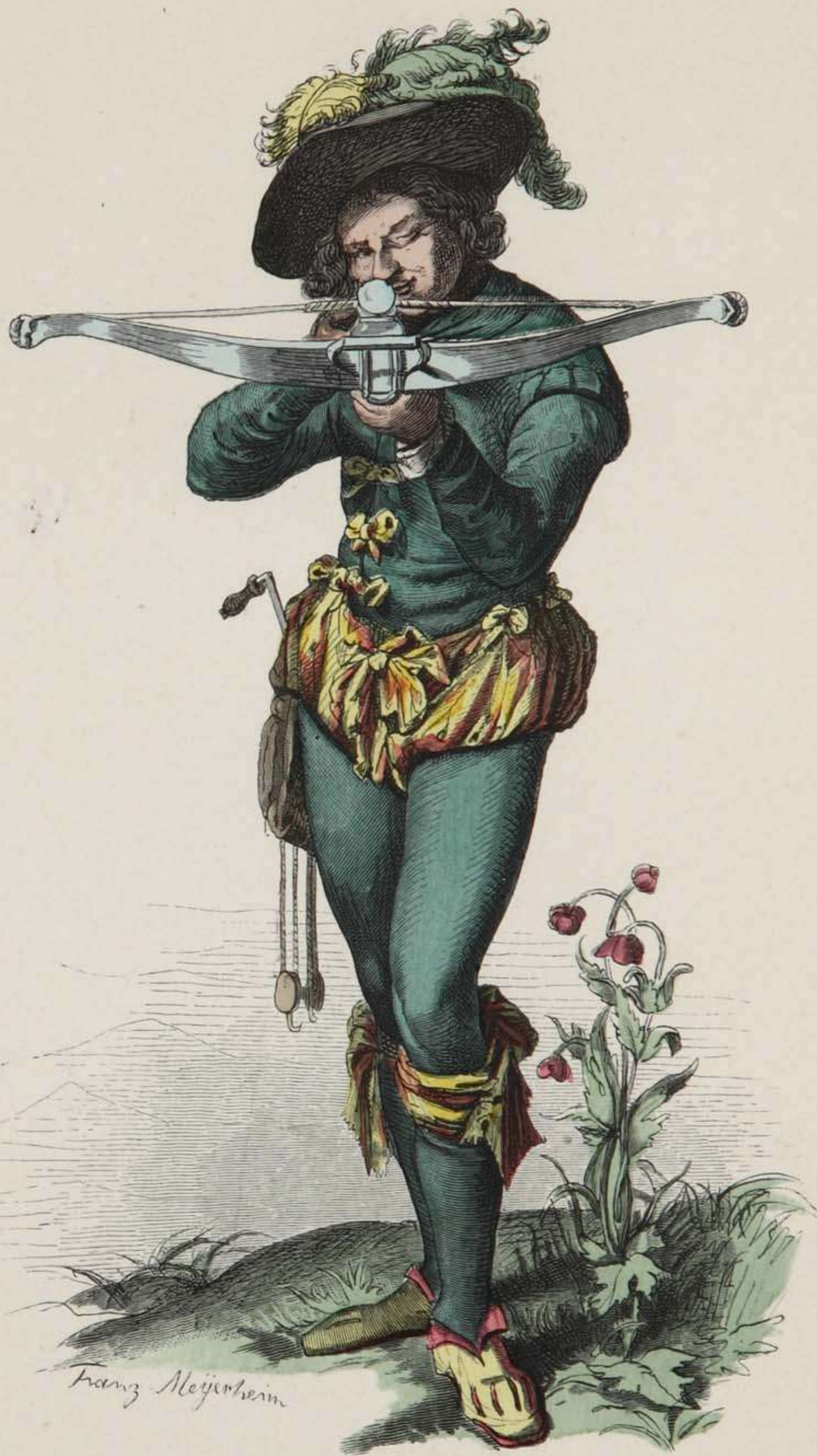
Scheibenschütze. Ende des XVI. Jahrhunderts.