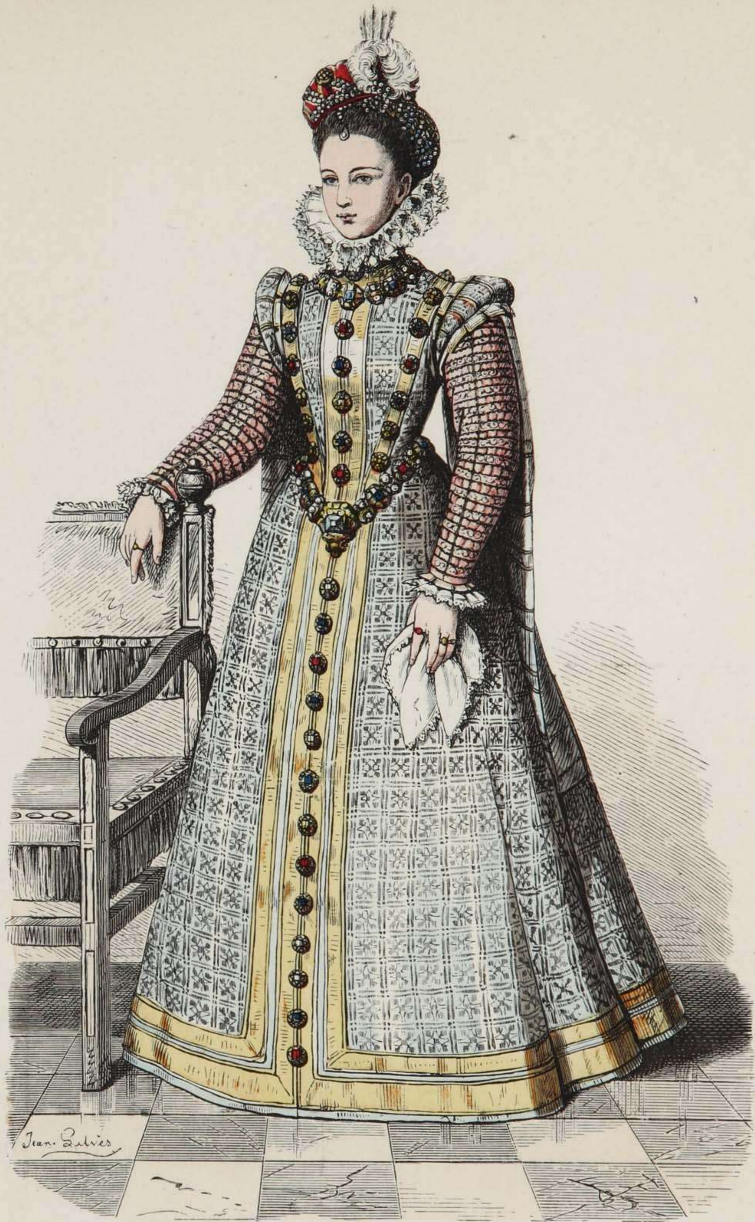
Isabella Clara Eugenia, Tochter Philipps II. von Spanien, 1584.