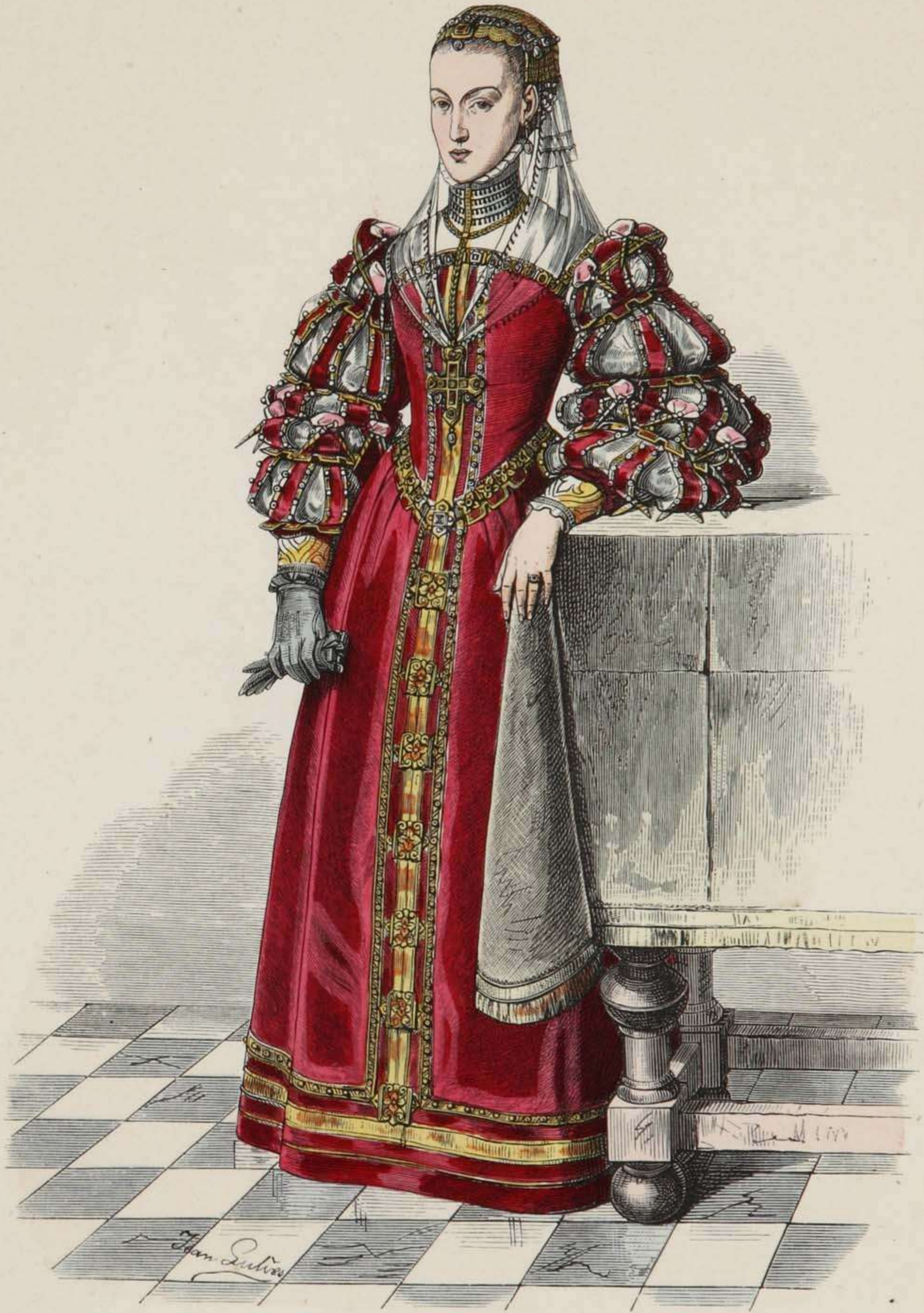
Johanna, Grossherzogin zu Florenz, geb. Erzherzogin zu Oesterreich. Geb. 1547; gest. 1578.