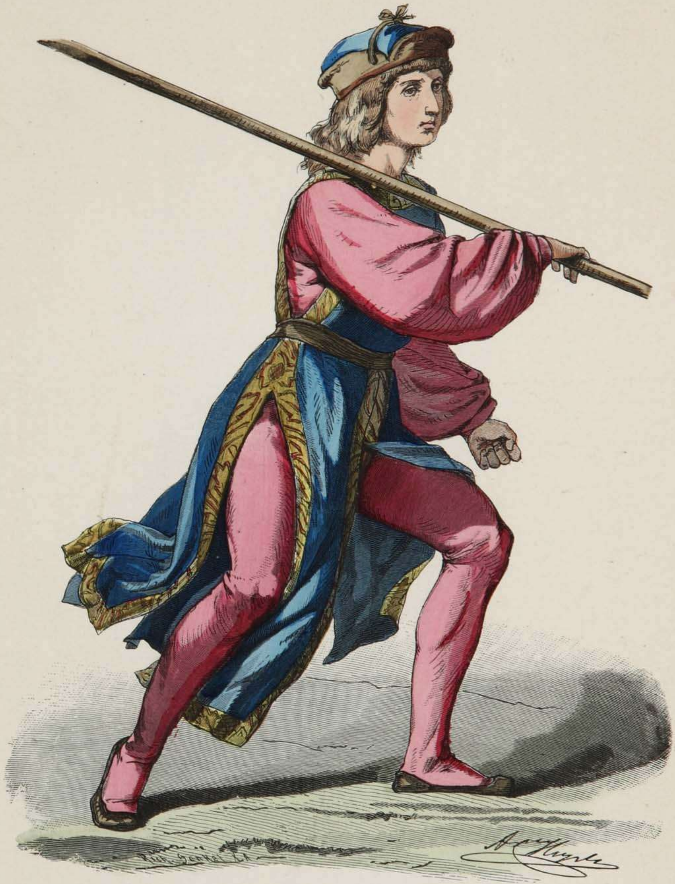
Burgundischer Knappe. XV. Jahrhundert.