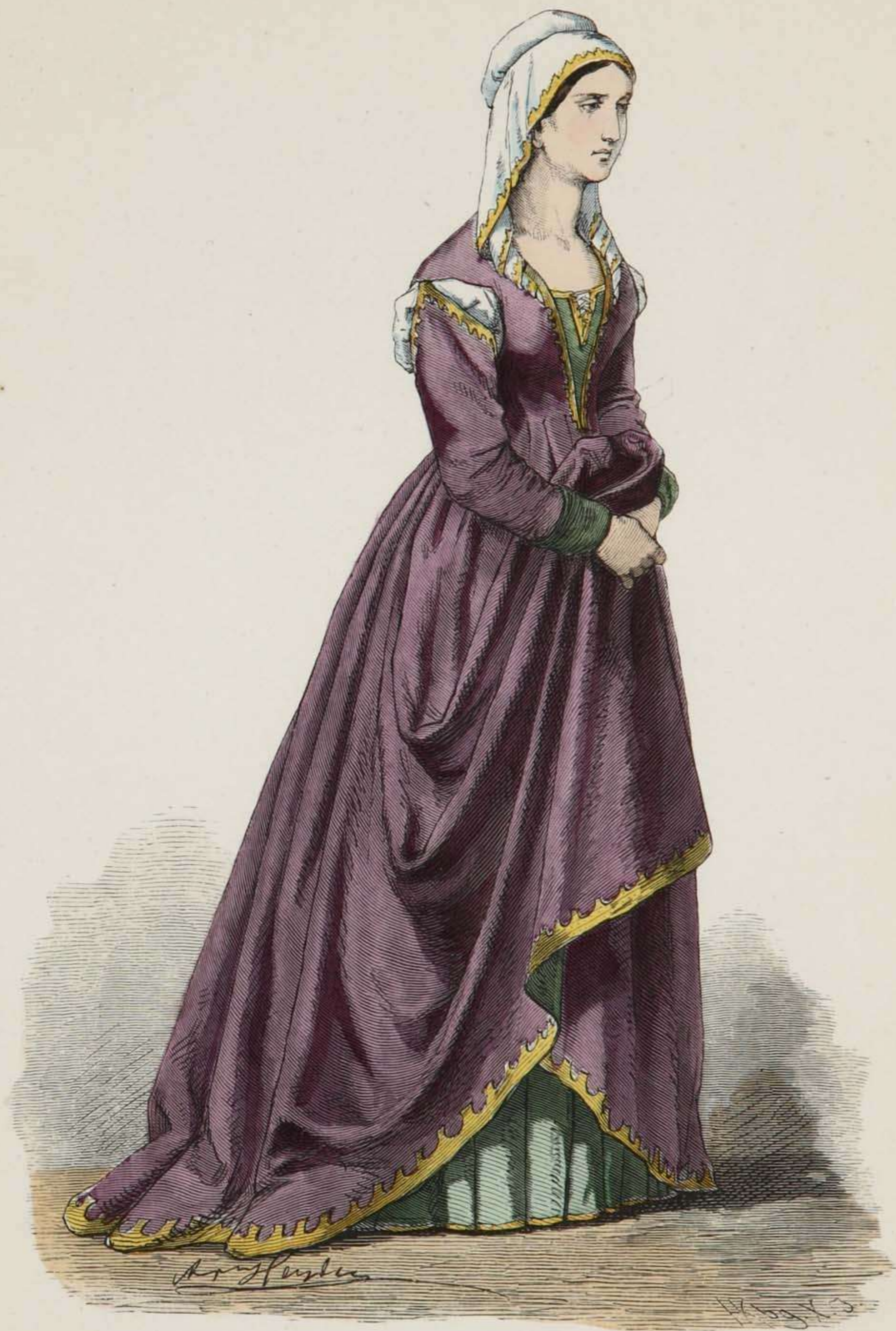
Florentinerin. Fünfzehntes Jahrhundert.