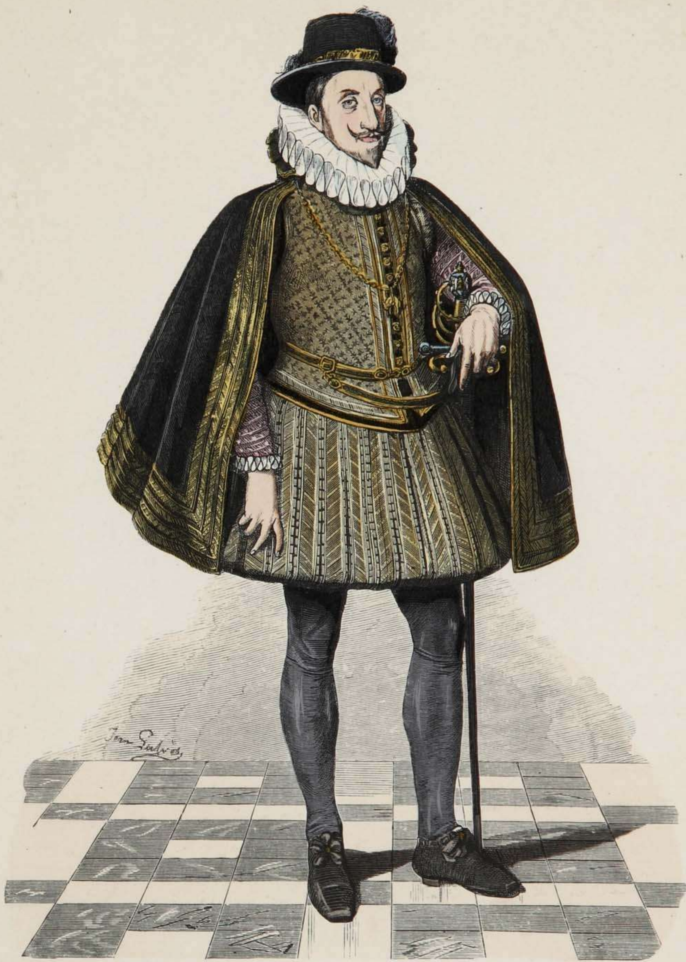
Ferdinand II., Kaiser von Deutschland.