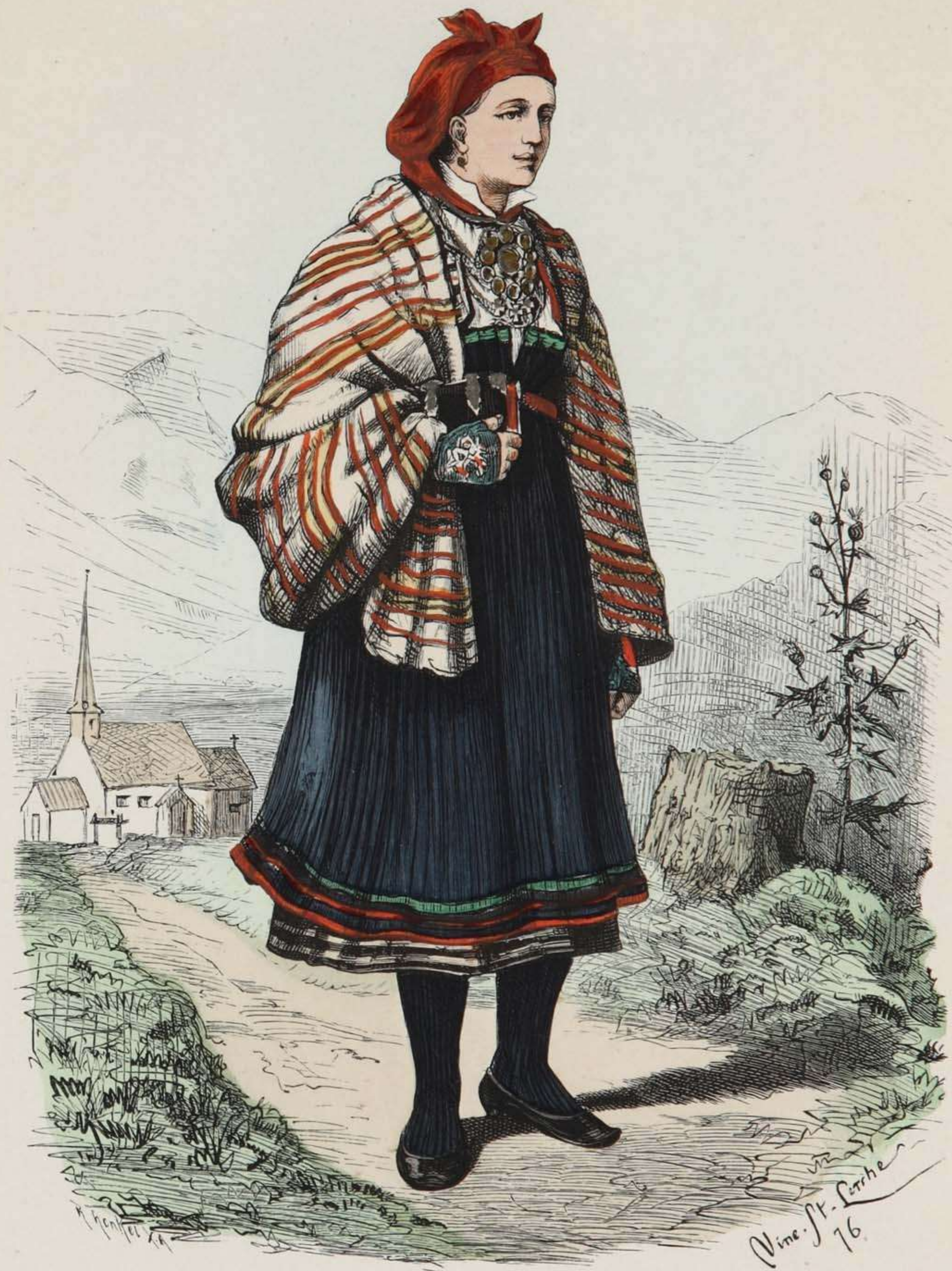
Bauernmädchen aus Valle in Säterdalen (Norwegen).