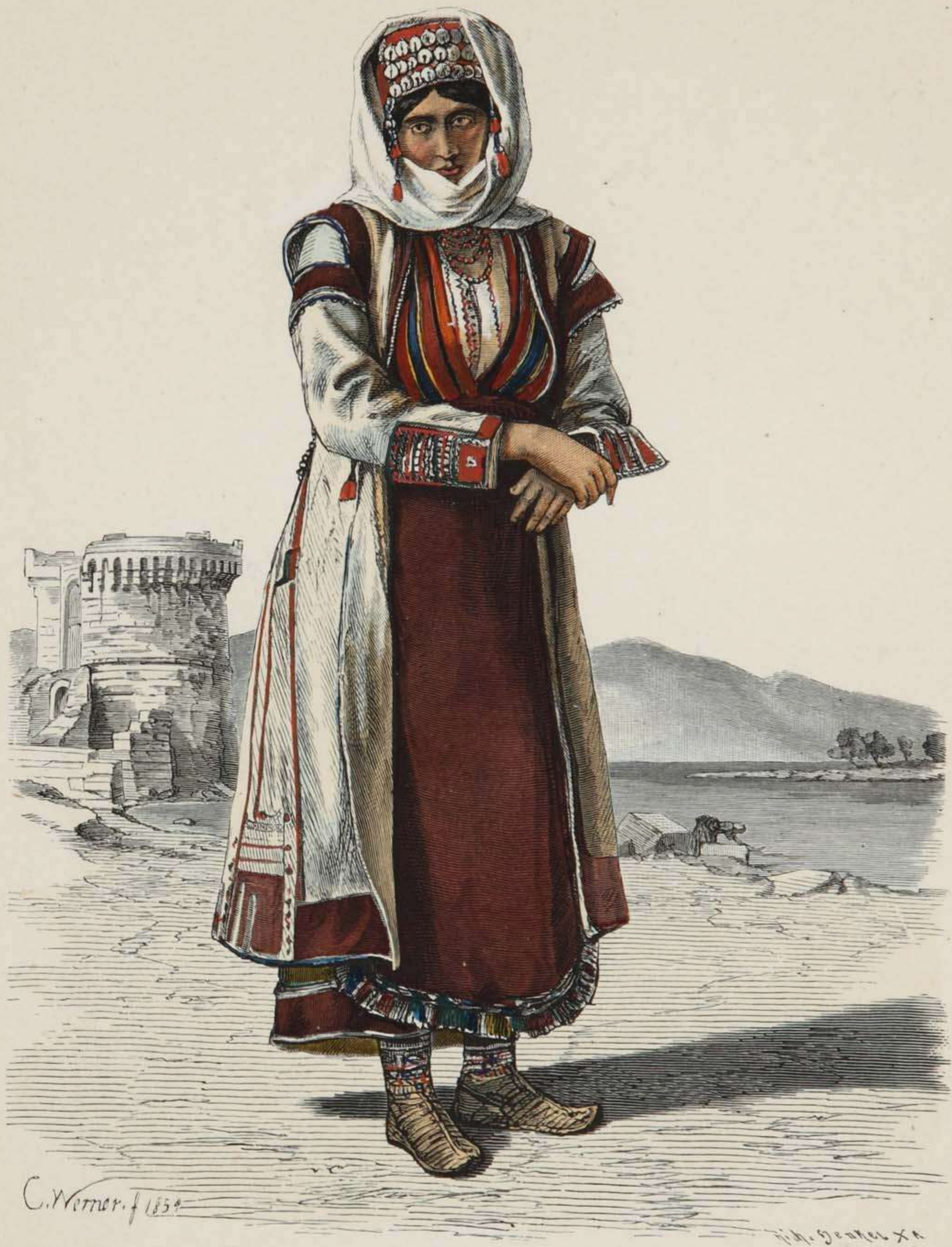
Montenegrinerin aus Postinje.