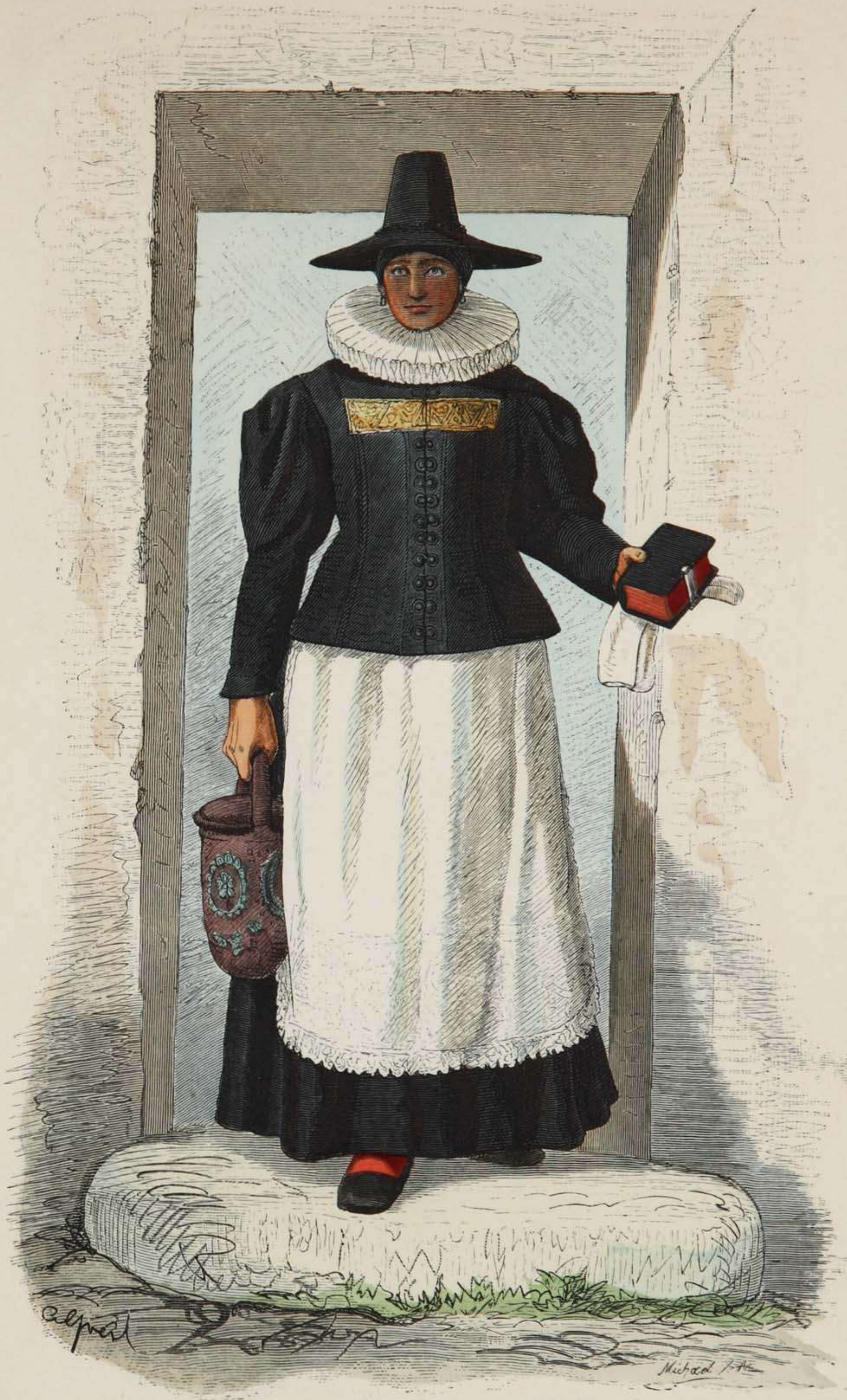
Oberösterreichische Bauersfrau. Zeit des österreichischen Bauernkrieges, 1626.