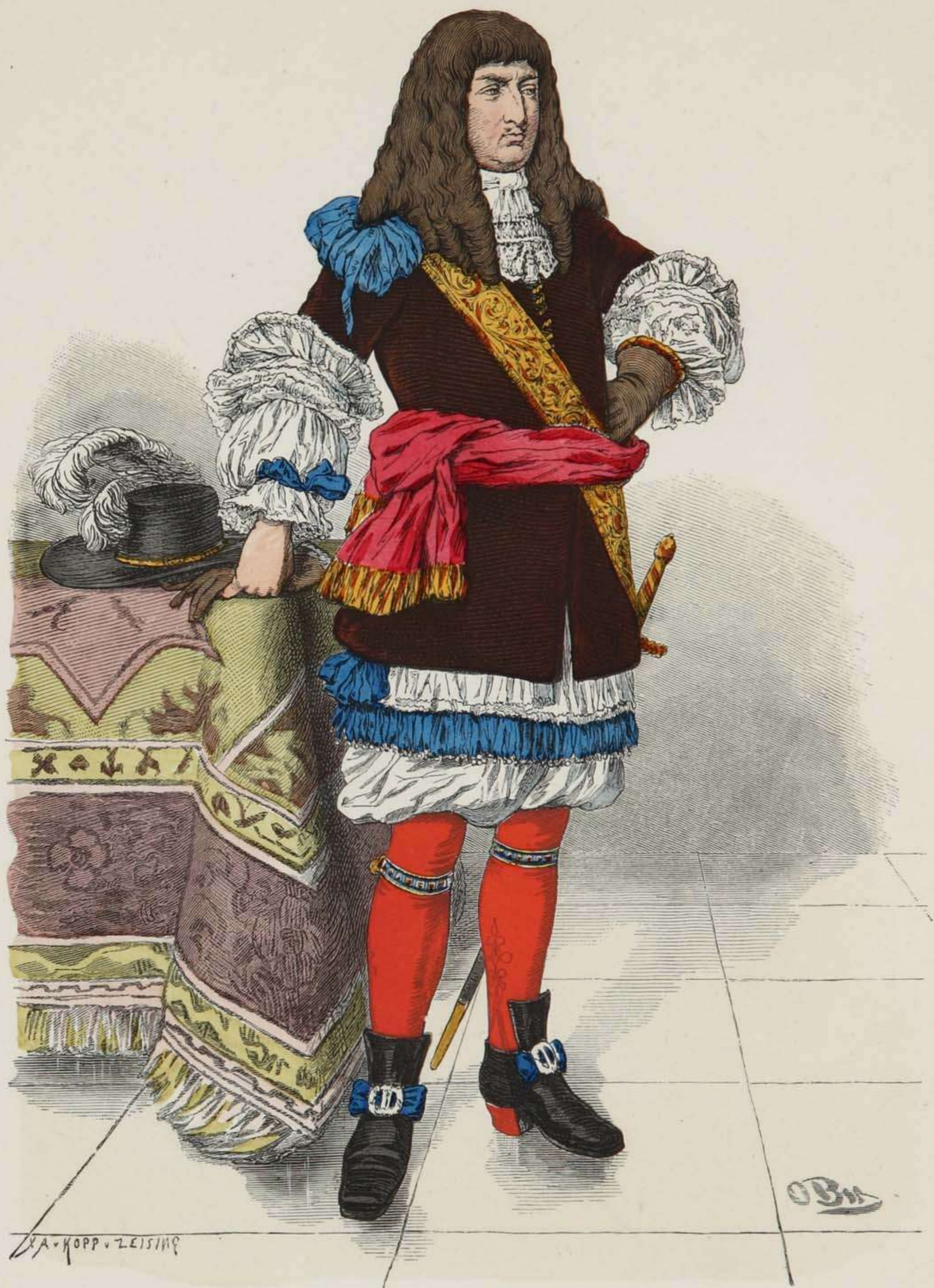
Tracht eines vornehmen Mannes. Um 1670 — 1680.