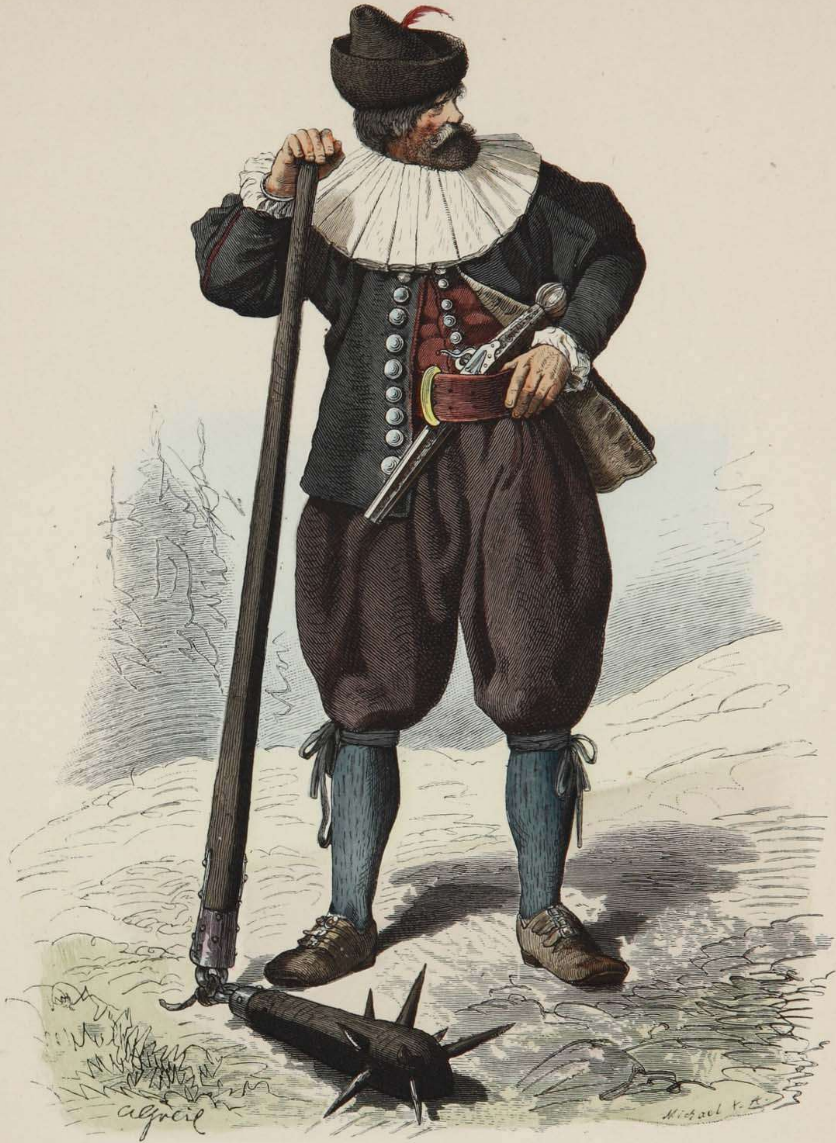
Oberösterreichischer Bauer. Zeit des österreichischen Bauernkrieges, 1626.