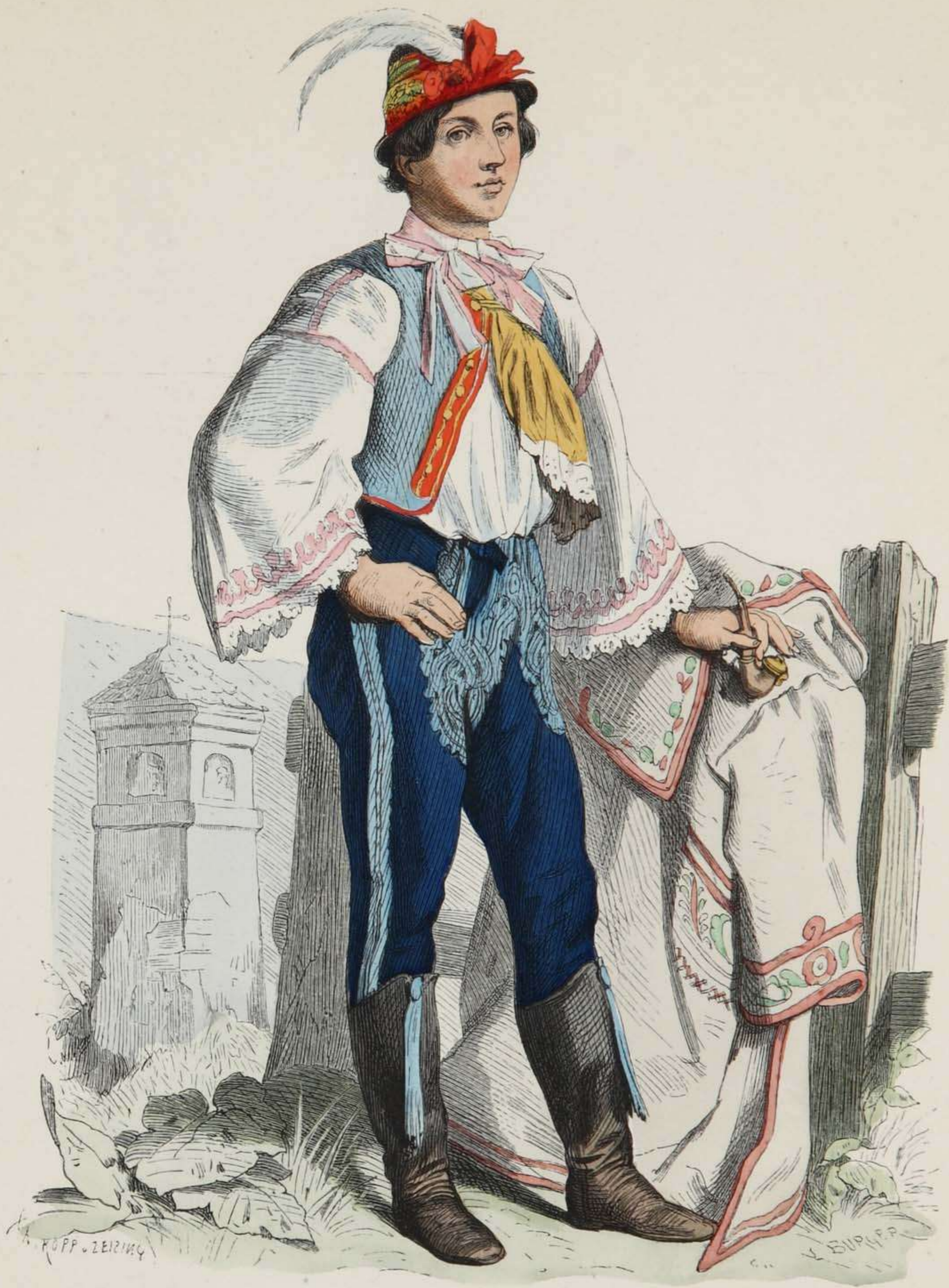
Slovake aus dem Pressburger Comitatz (Ungarn) in Sonntagstracht.