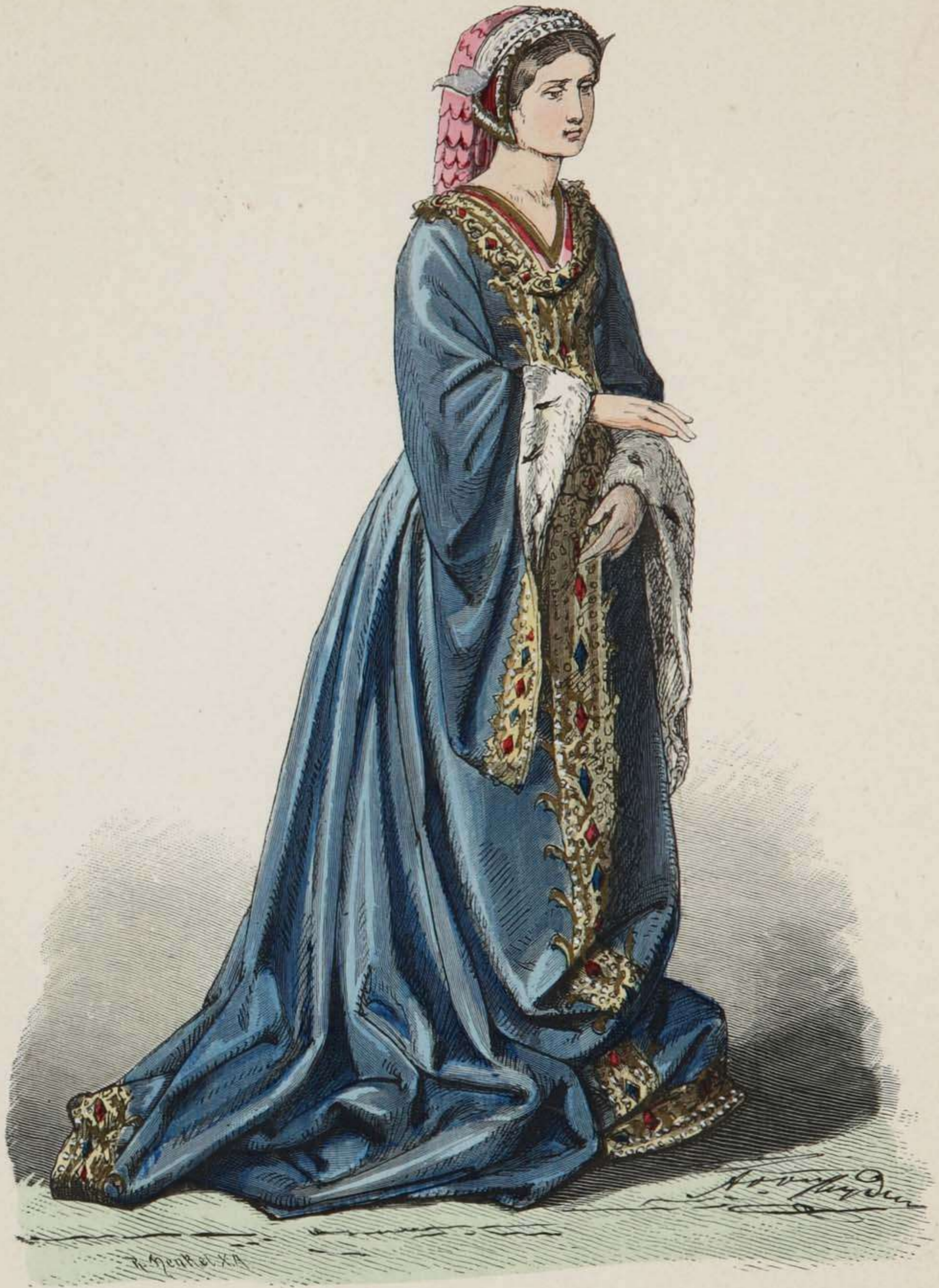
Burgundisches Edelfräulein. XV. Jahrhundert.