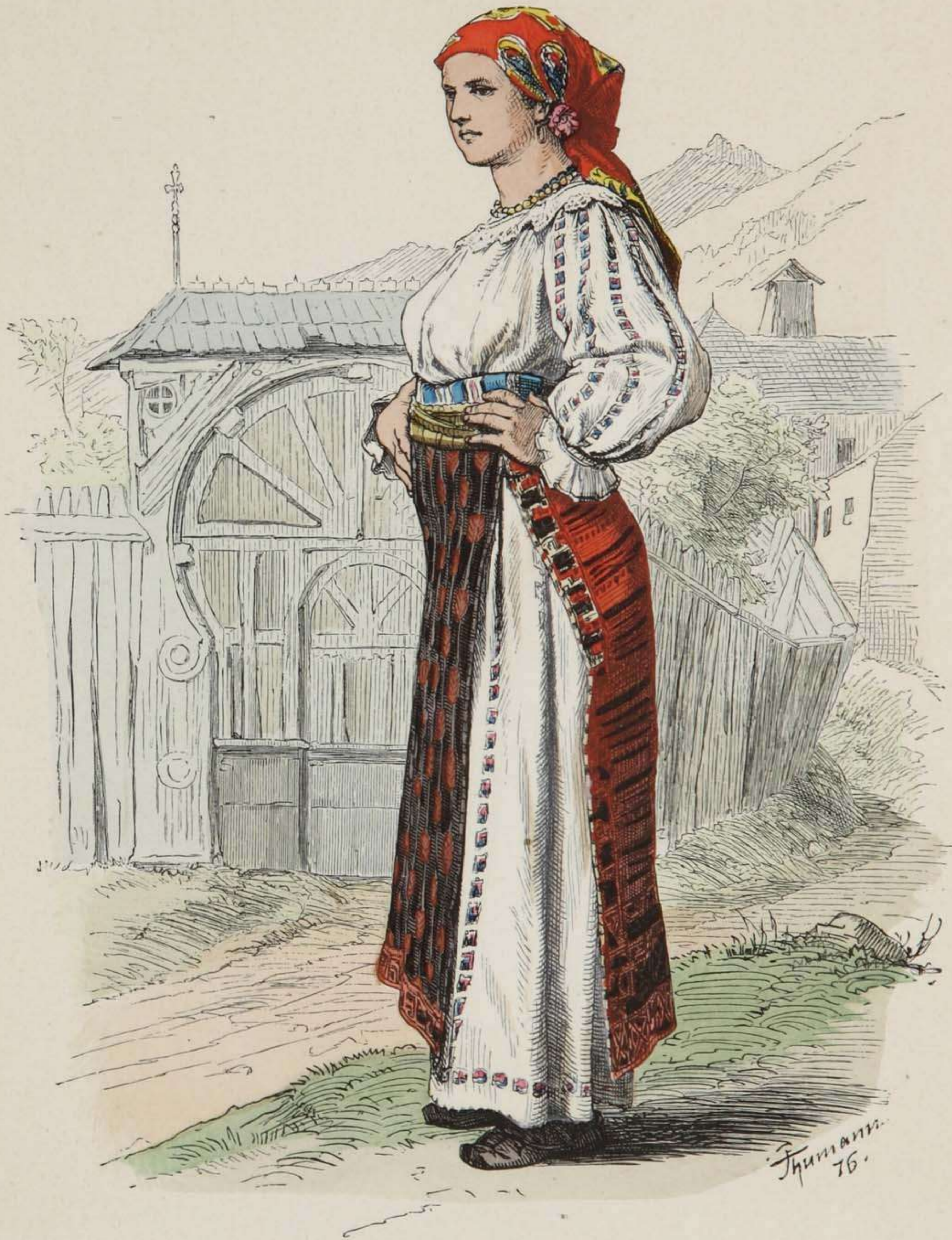
Walachin aus Rustkitza.