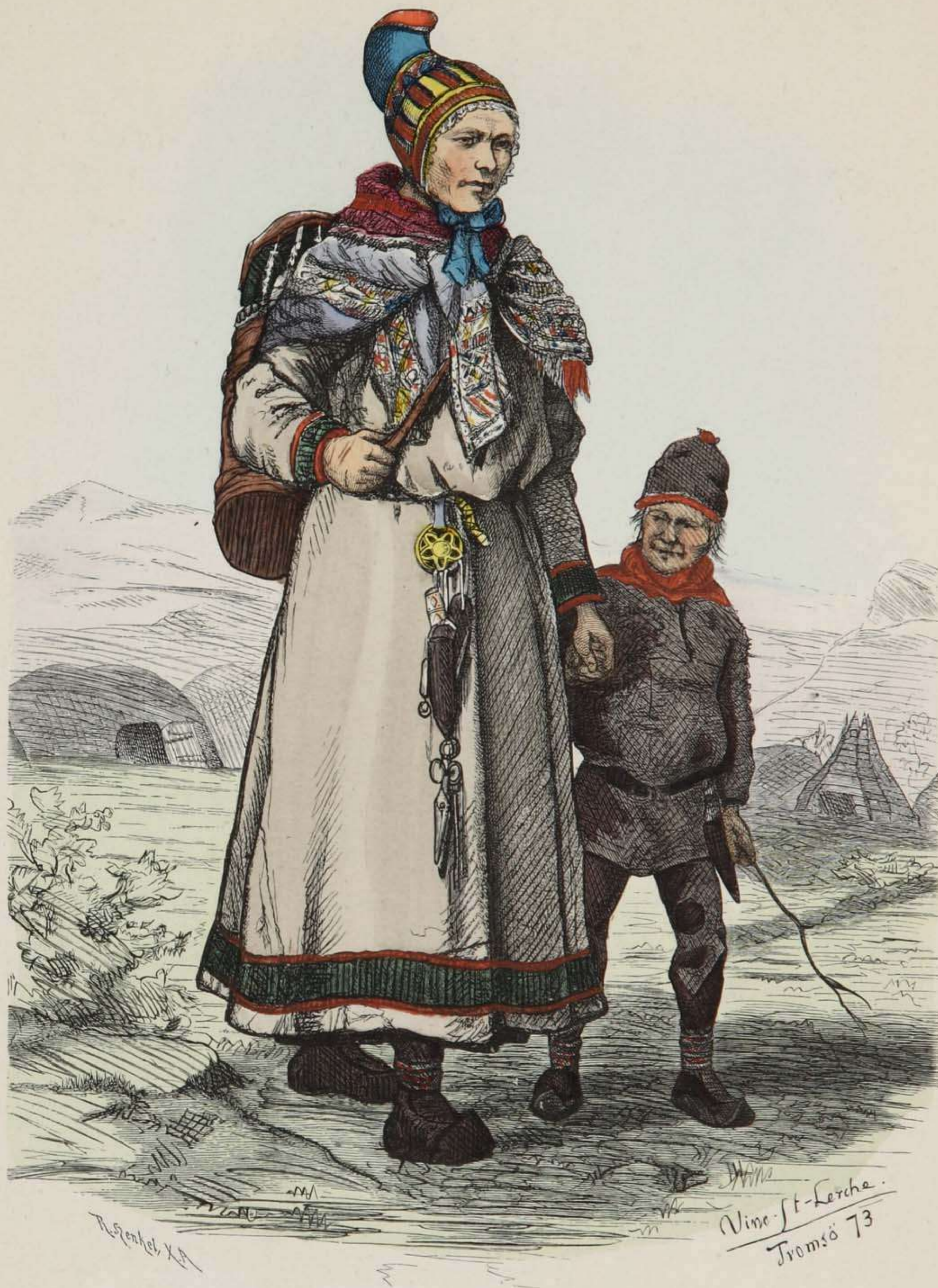
Lappen-Frau aus Karasjock in Finmarken (Norwegen).