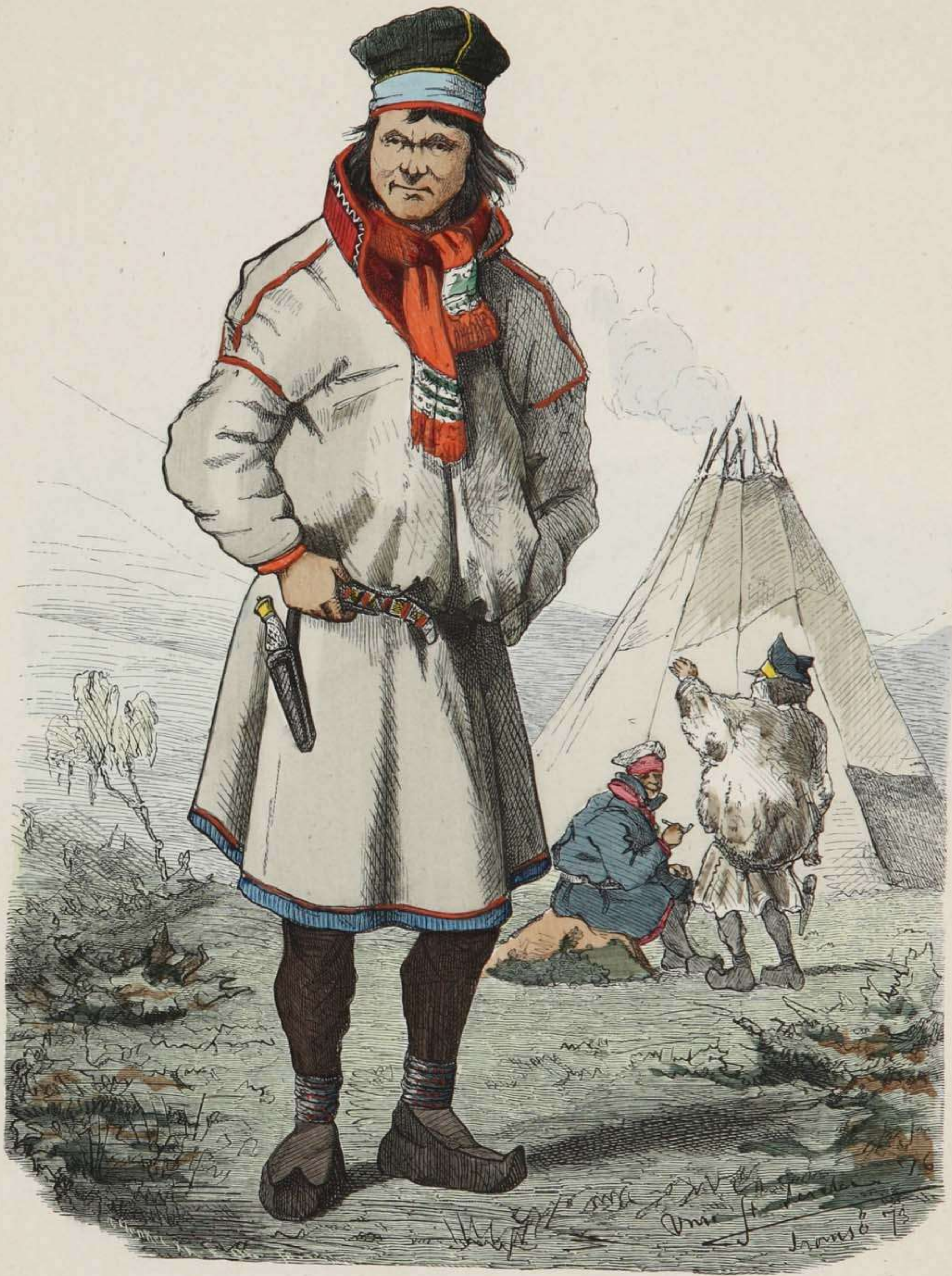
Lappe aus Karasjock in Finmarken (Norwegen).