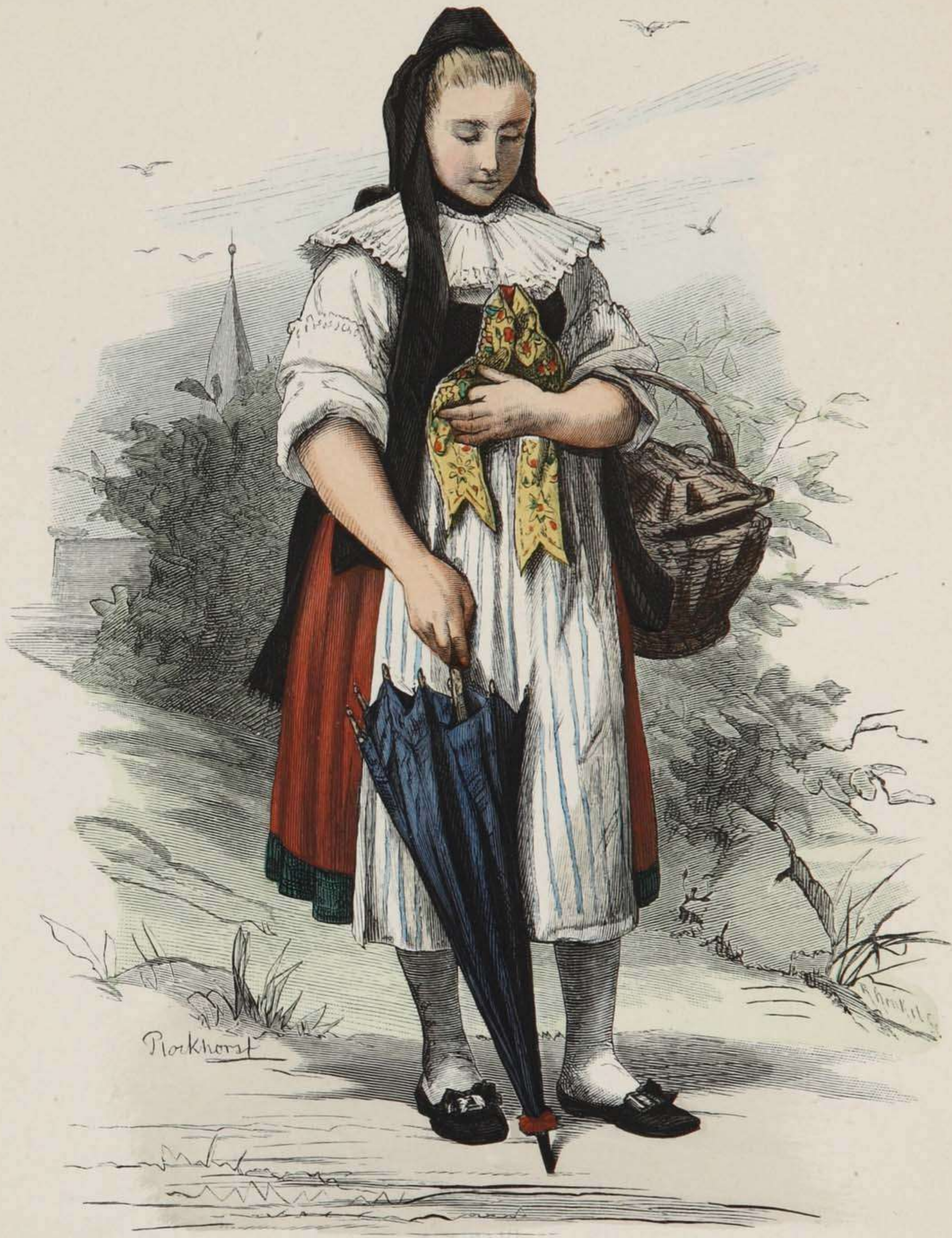
Bäuerin aus Bortfeld bei Braunschweig.