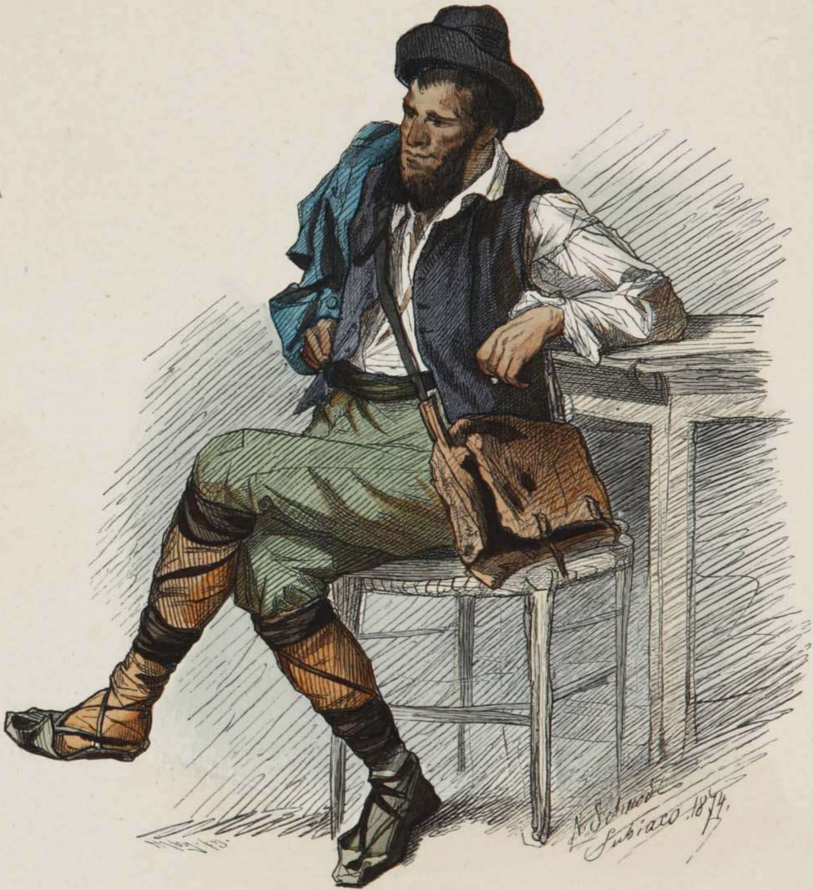
Ciociare aus dem Sabinergebirge.