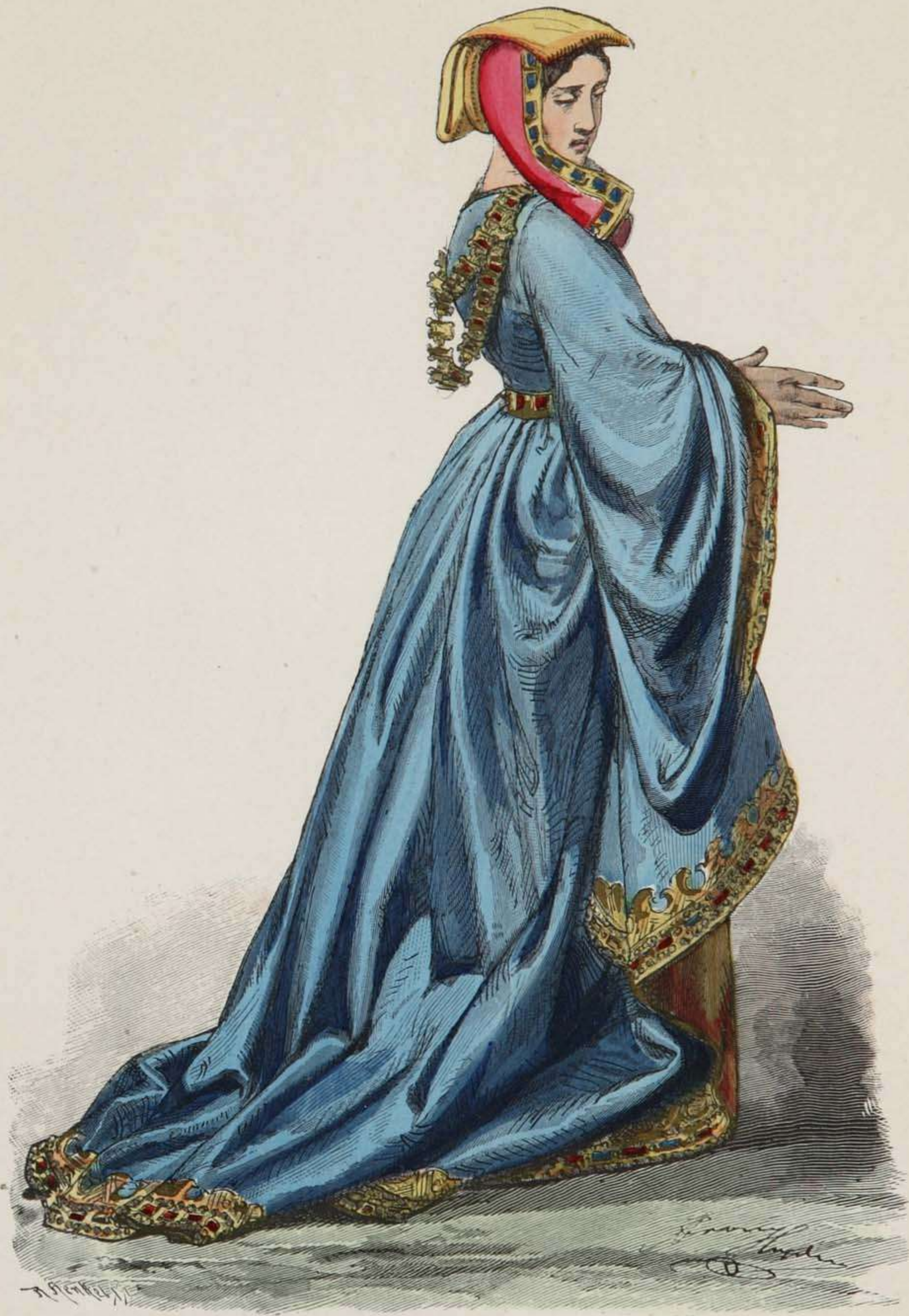
Burgundische Edelfrau. XV. Jahrhundert.