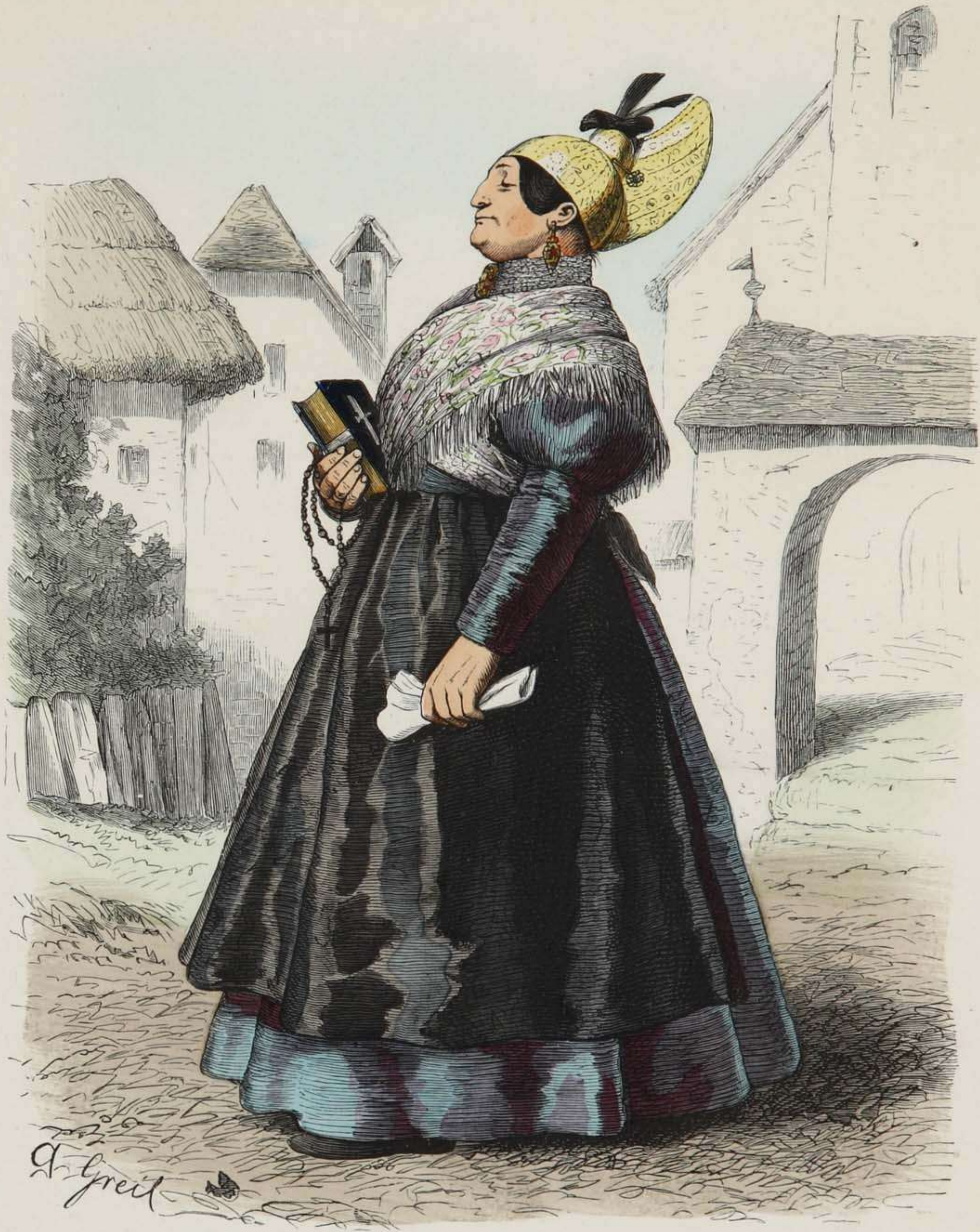
Bauersfrau aus Ober-Oesterreich (Traunkreis).