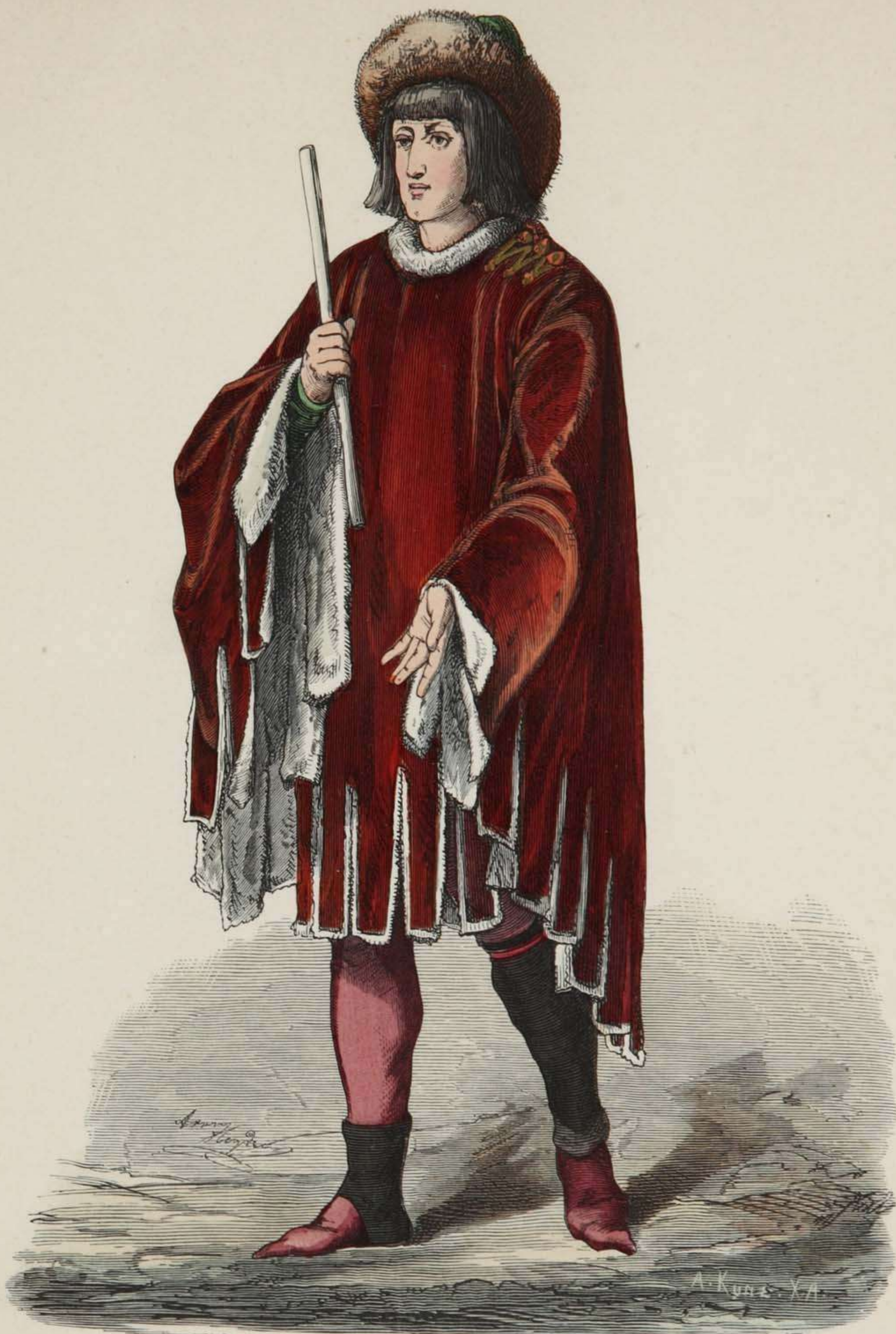
Burgundischer Fürst. Anfang des XV. Jahrhunderts.