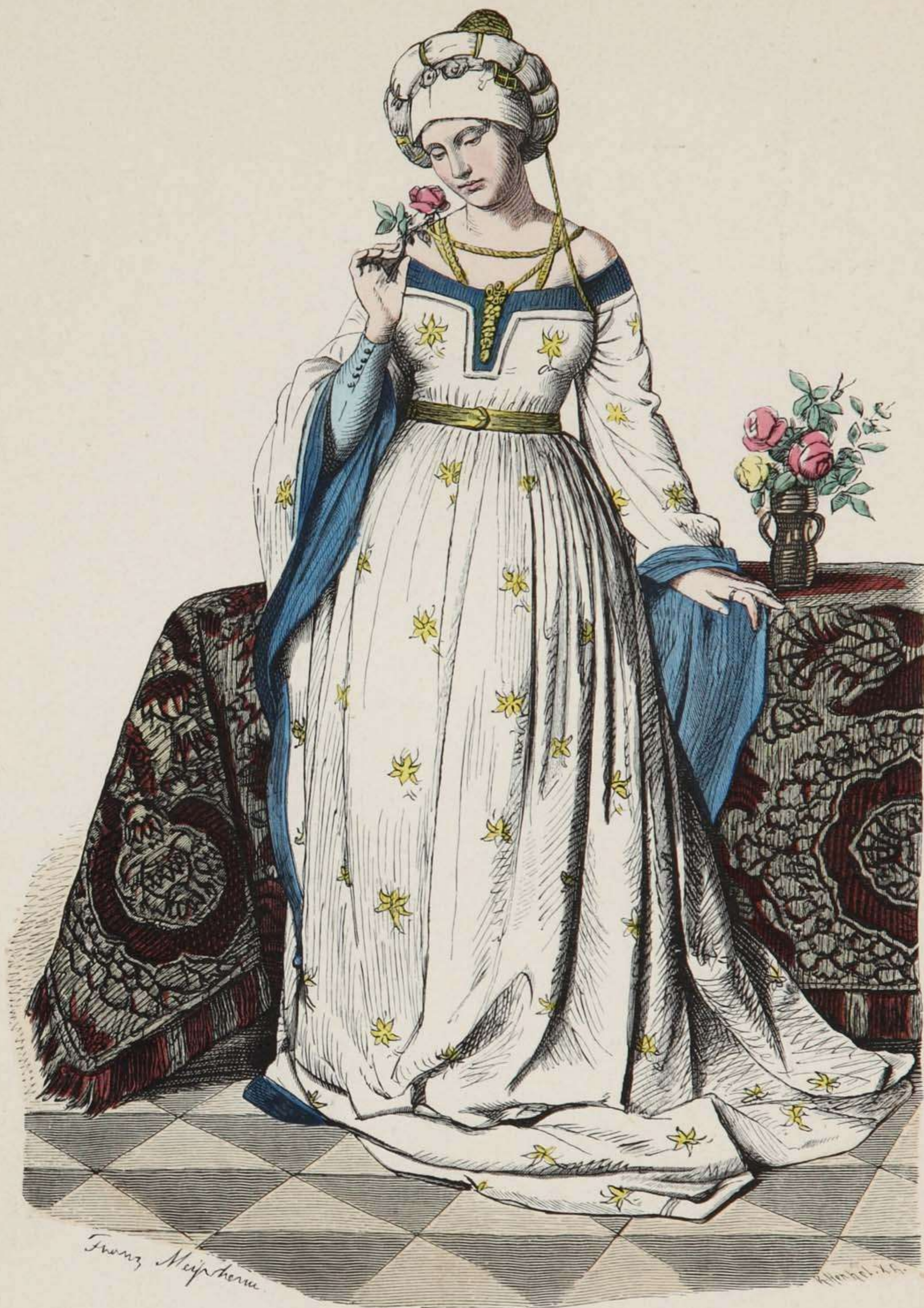
Vornehme deutsche Frau. Zweite Hälfte des XV. Jahrhunderts.