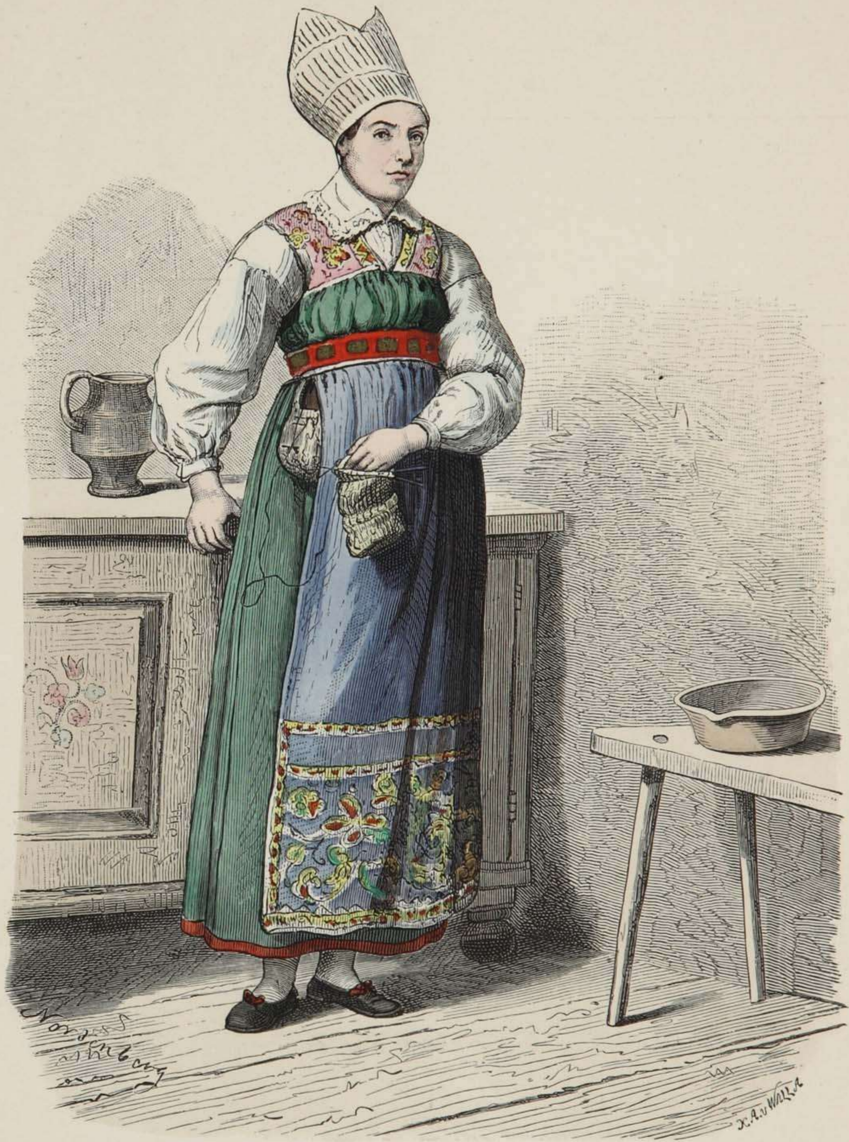
Frau aus West-Wingåker (Schweden).