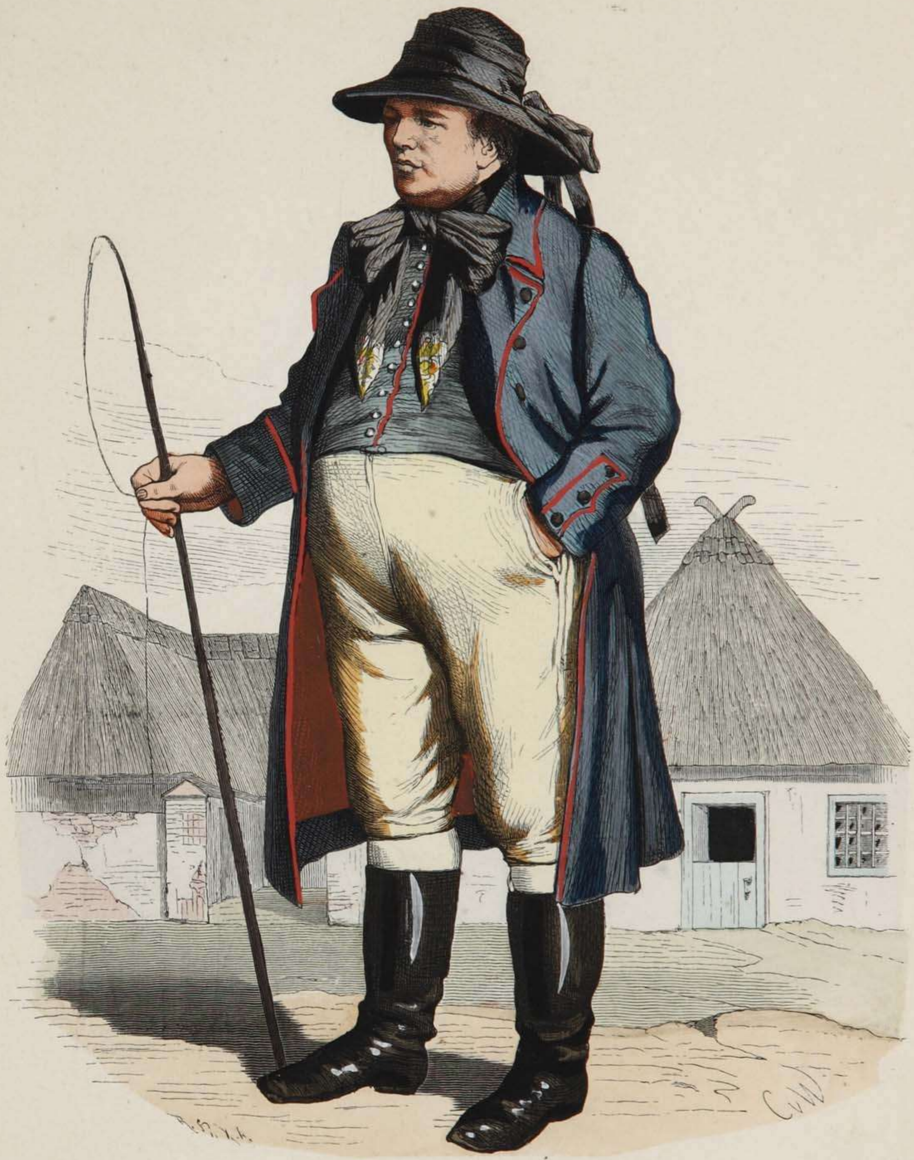
Pommerscher Bauer aus dem Weizacker (Kreis Pyritz).