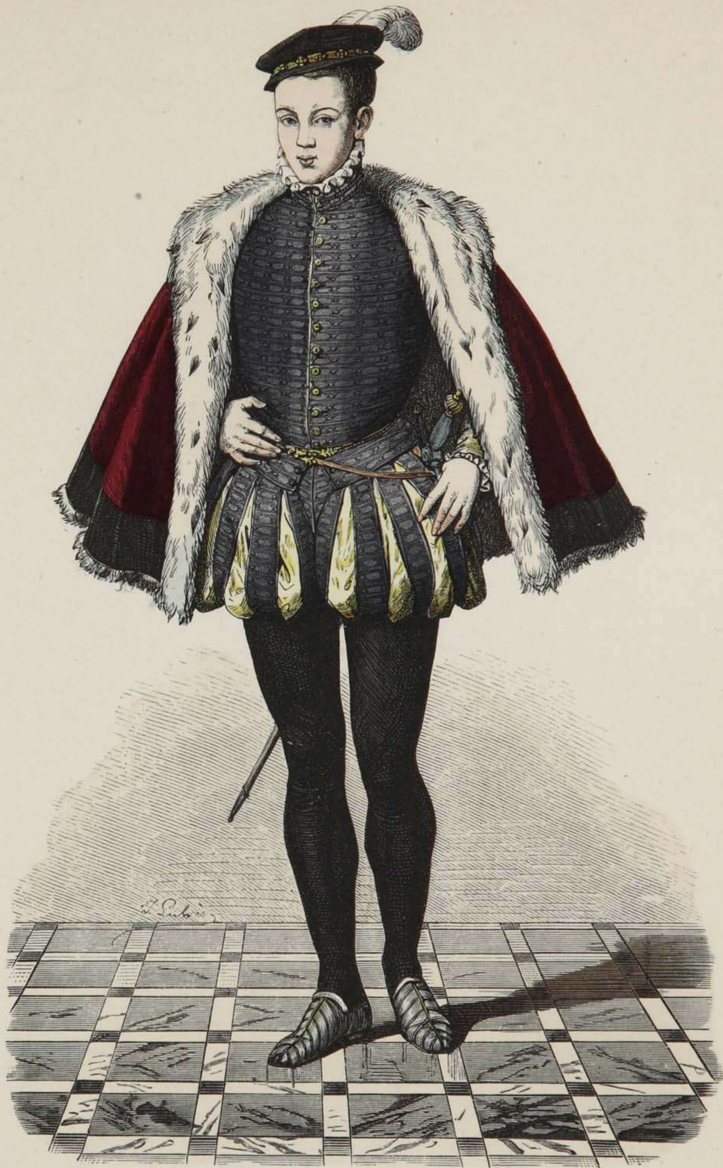
Don Carlos, Infant von Spanien.