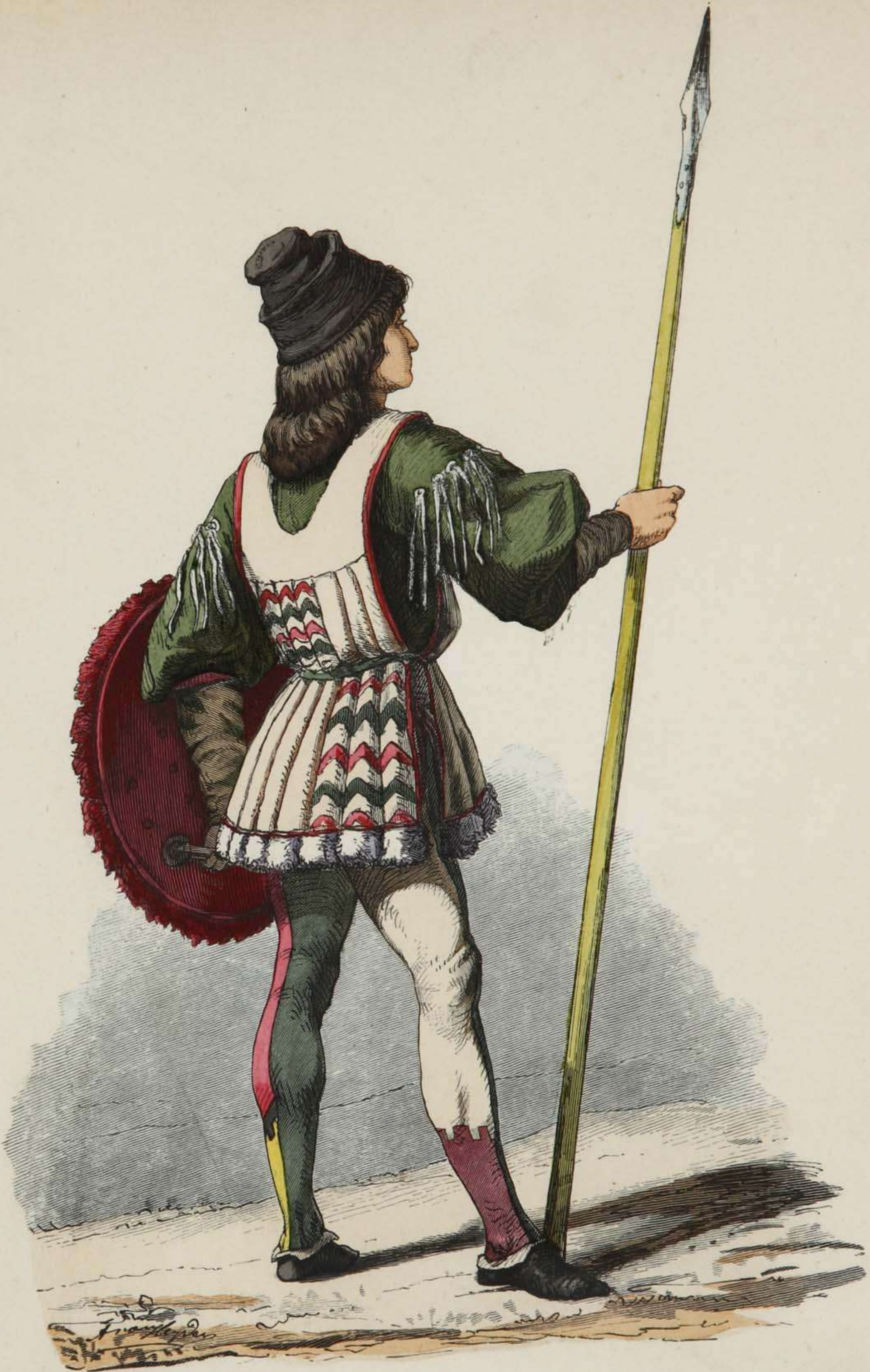
Italienischer Jüngling. Zweite Hälfte des fünfzehnten Jahrhunderts.