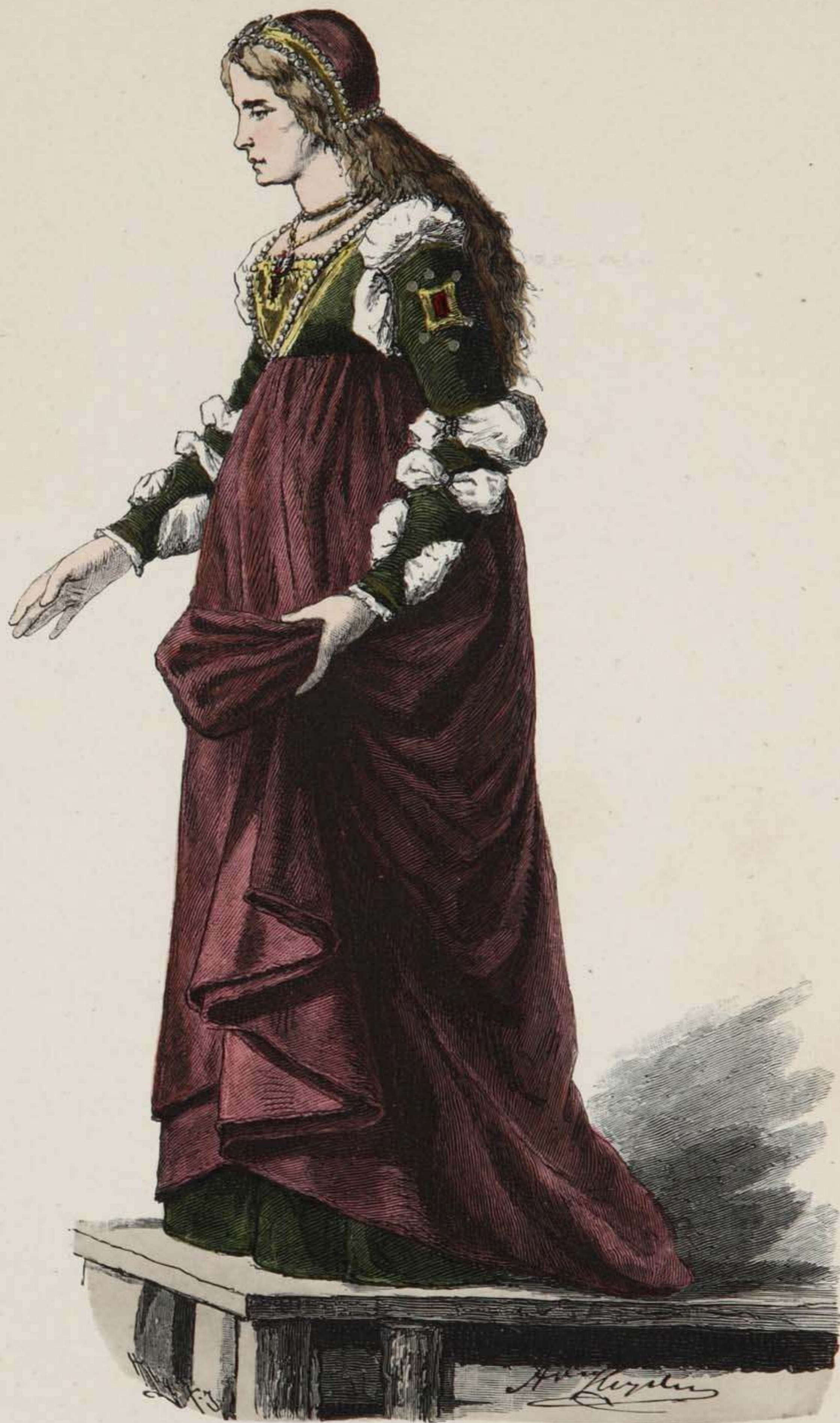
Edle Venetianerin. Erste Hälfte des XV. Jahrhunderts.