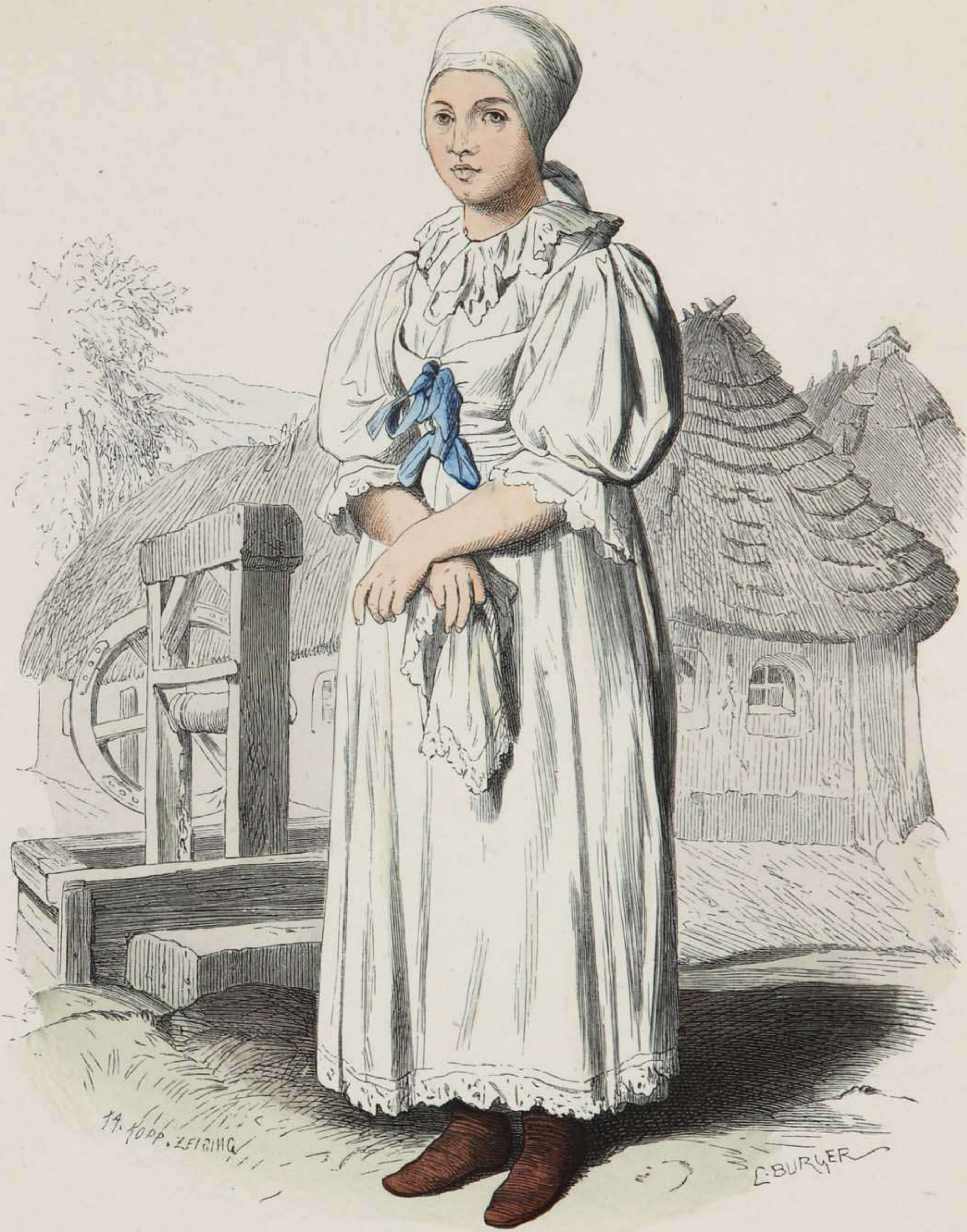
Slovakische Bäuerin aus dem Pressburger Comitatz (Ungarn) in Festtracht.