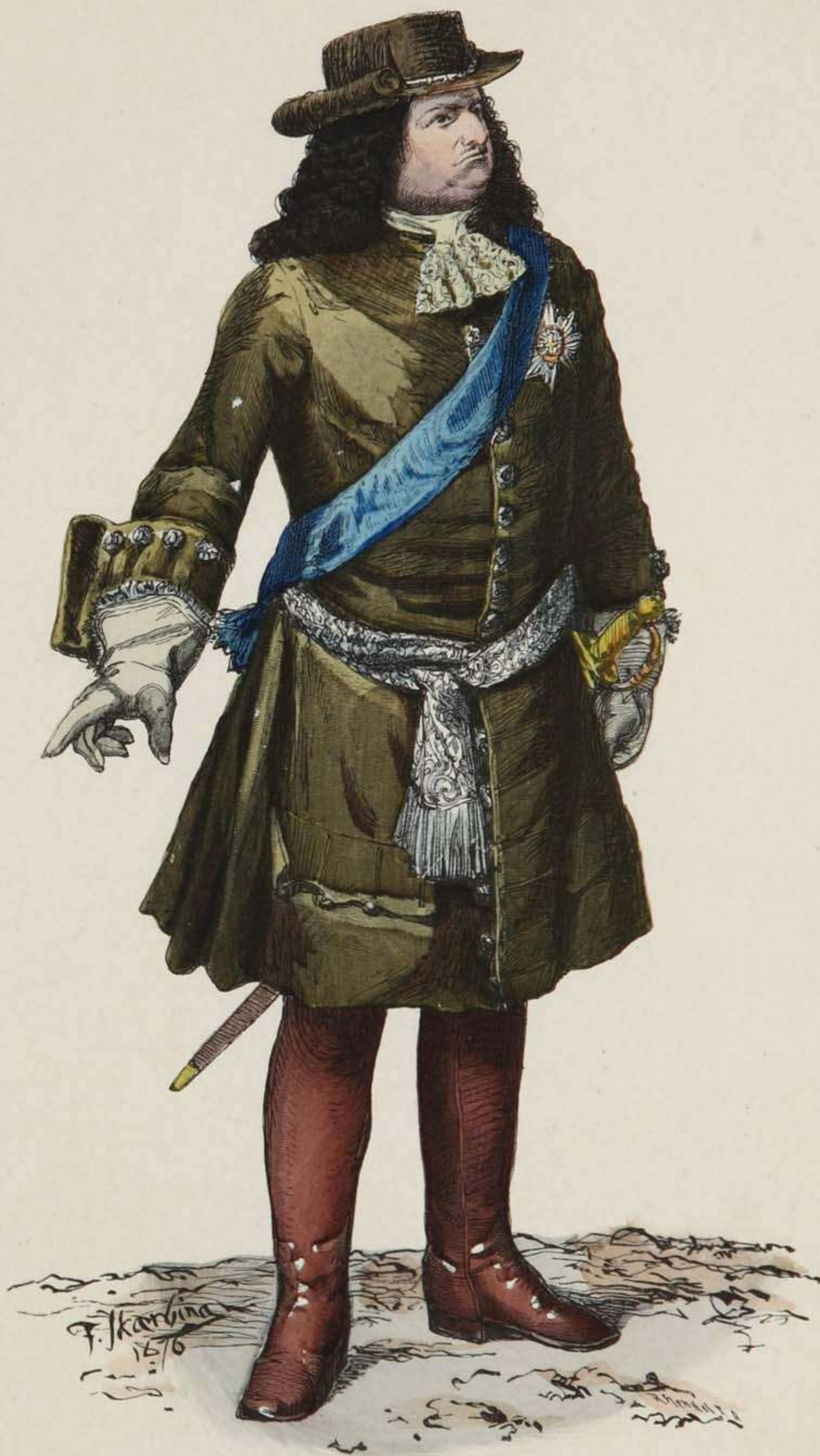
Friedrich Wilhelm der Grosse Kurfürst von Brandenburg. Um 1675.