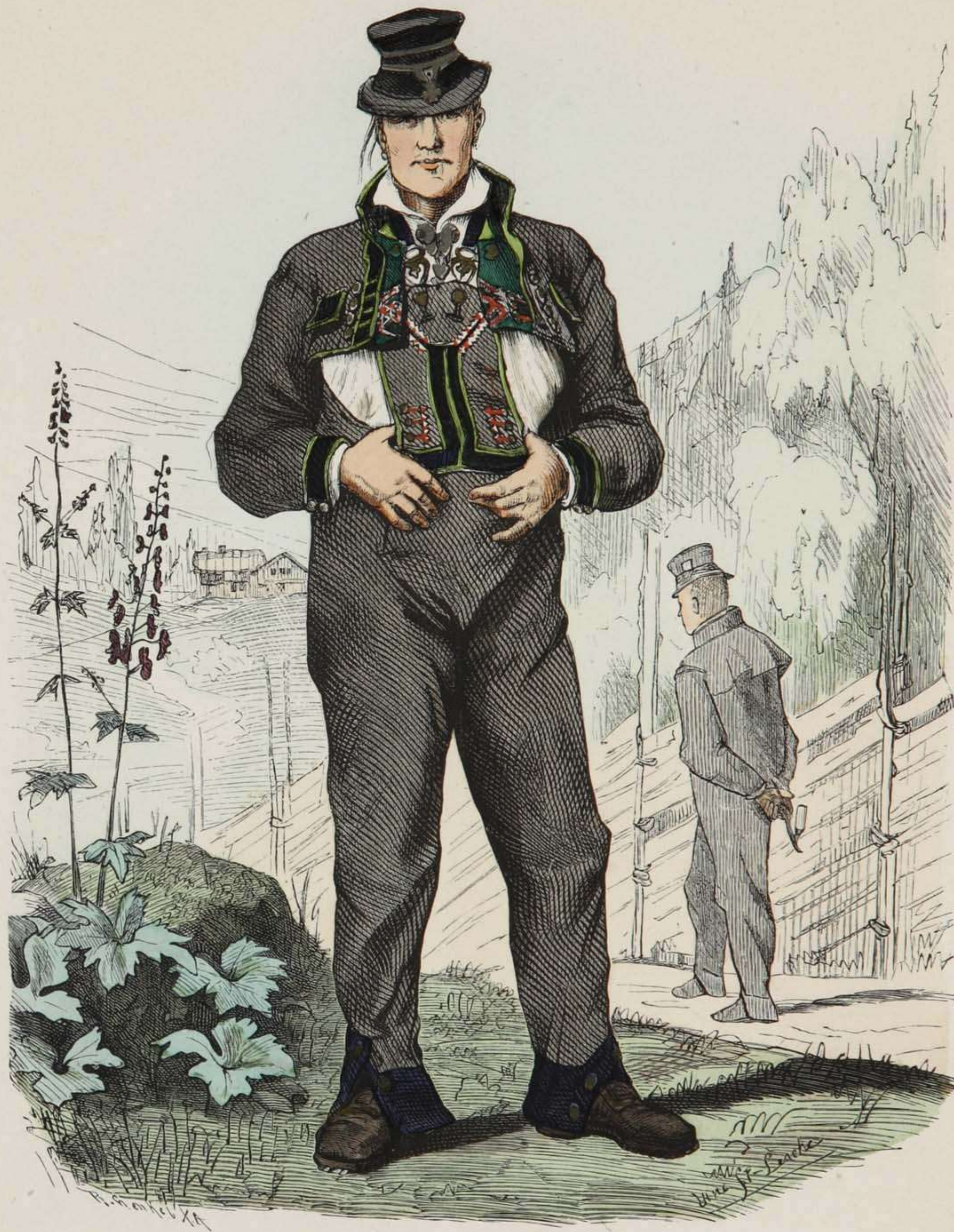
Junger Bauer aus Valle in Sätersdalen (Norwegen).