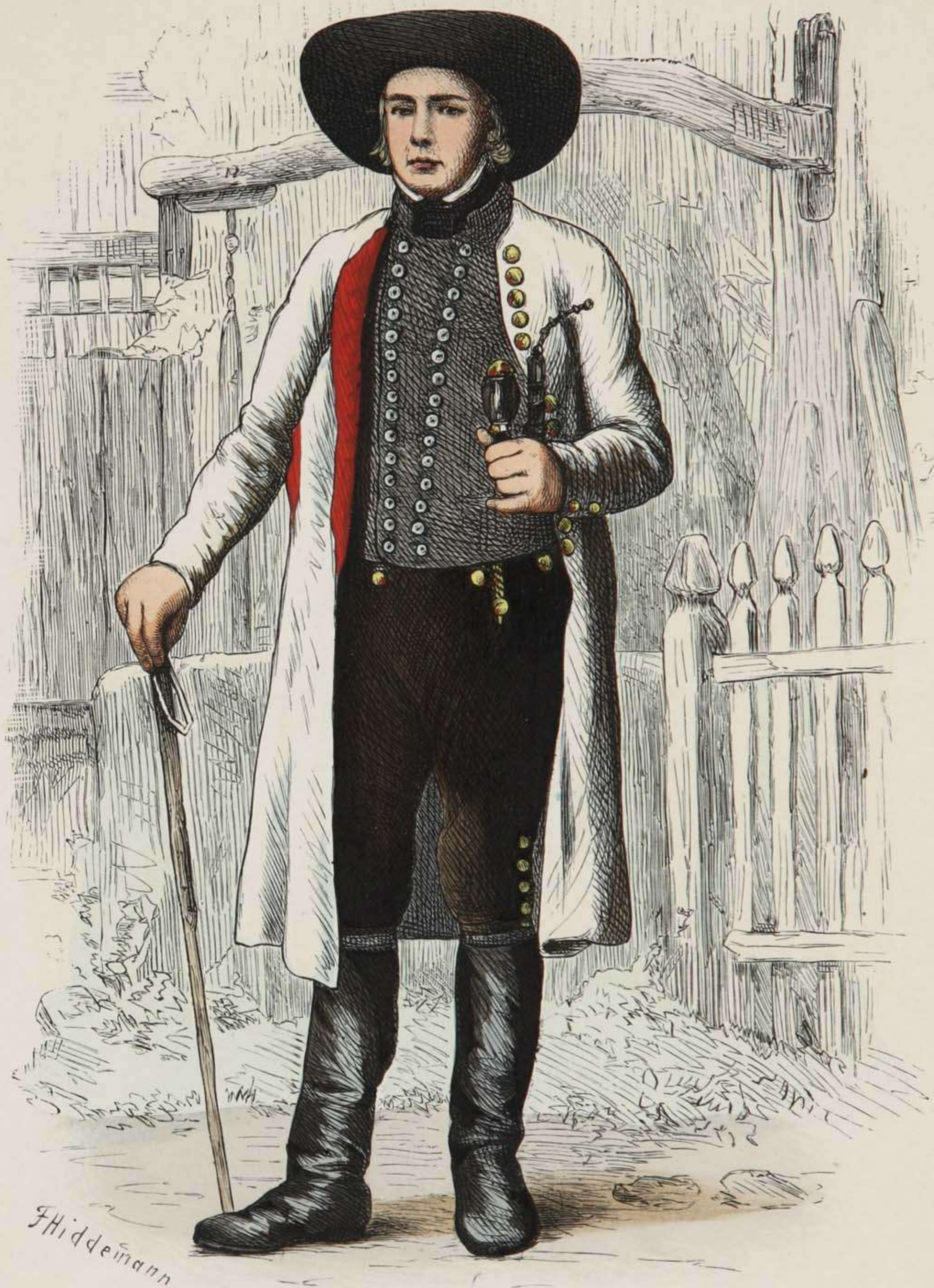
Bauer aus Klein-Bremen bei Minden (Westfalen).