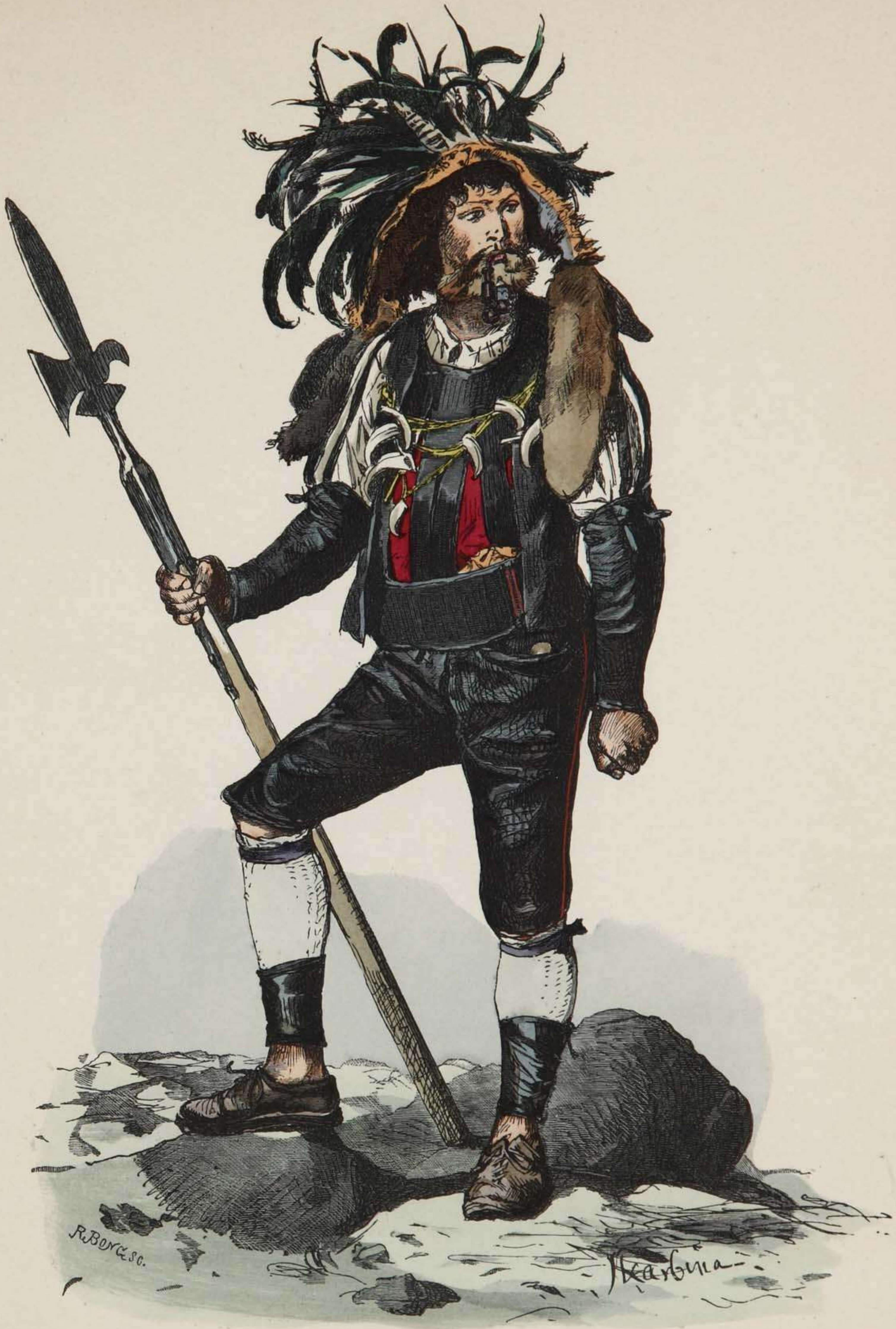
Weinhüter (Saltner) aus Meran (Süd-Tirol).