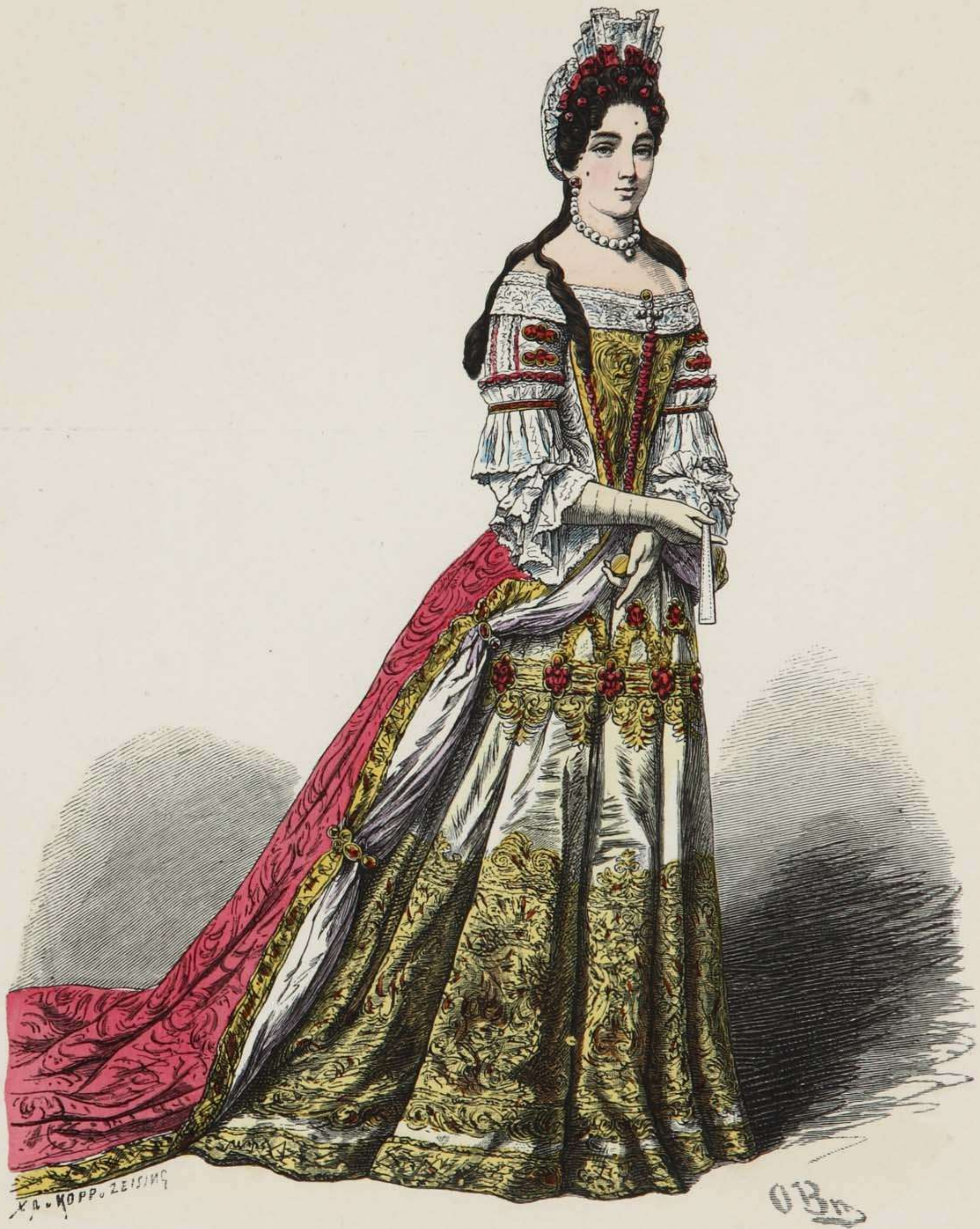
Kostüm vom Hofe Ludwigs XIV.