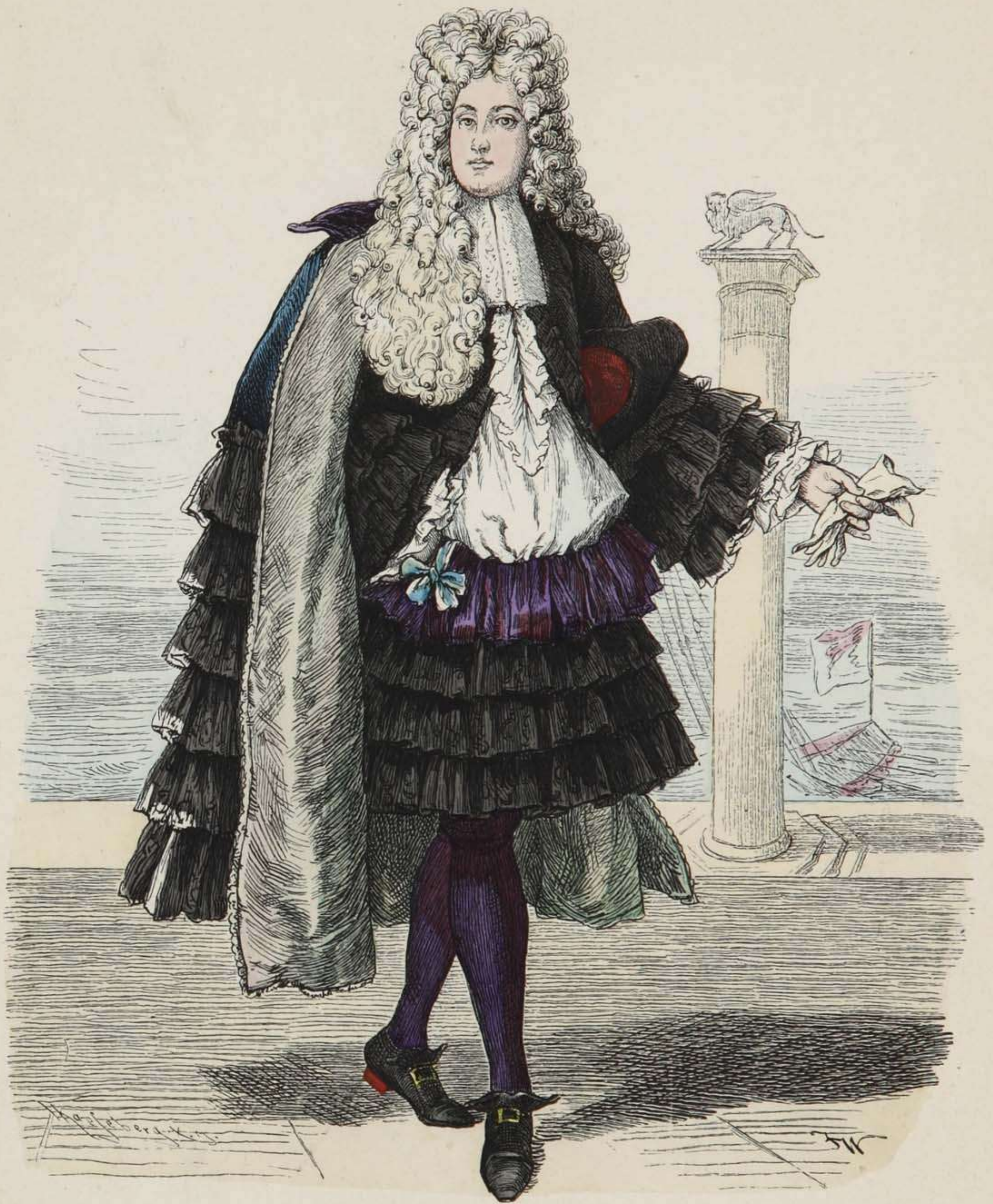
Venetianischer Edelmann. Zweite Hälfte des XVII. Jahrhunderts.