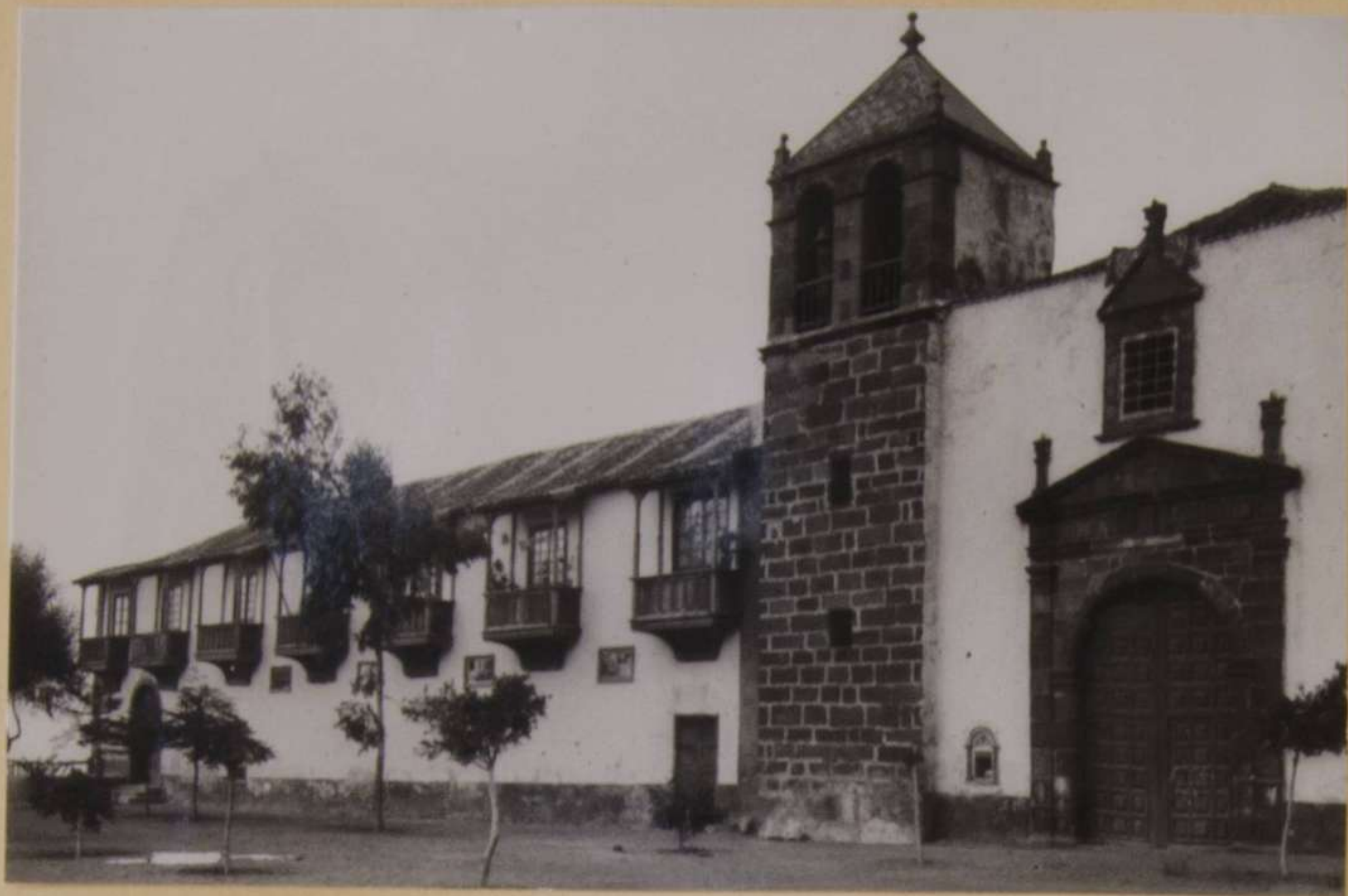
OBRAS DE MEJORAS EN EL HOSPITAL DE LA CONCEPCION EN GARACHICO COSTEADAS POR EL M. E. PRESUPUESTO 10.000 PTAS. — AÑO 1945.