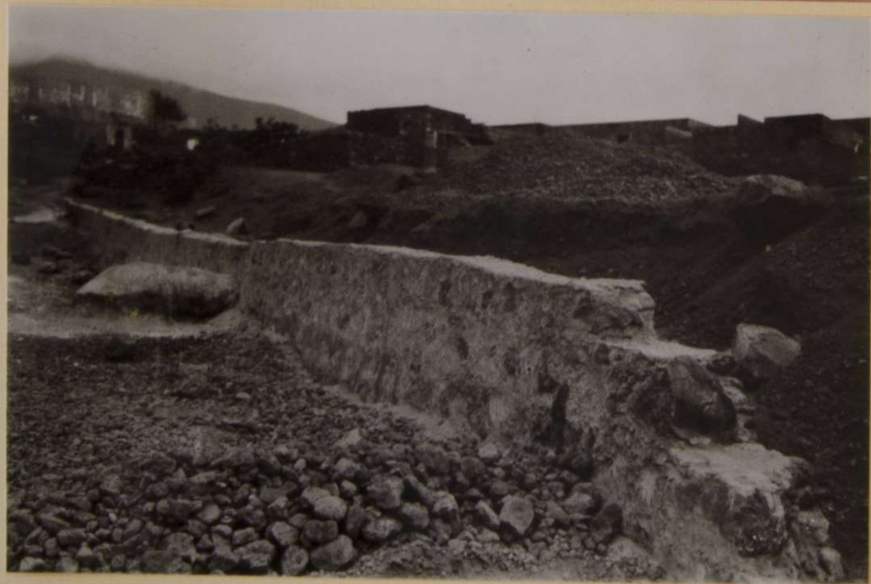
ESTADO DE LAS OBRAS PARA ELEVACIÓN DE UN MURO DE ENCAUZAMIENTO Y CONTENCIÓN DE AGUAS EN EL BARRANCO DE LA HAYA (REALEJO) COSTEADO POR EL M. E. — PRESUPUESTO 25.000 PTAS. — AÑO 1945.