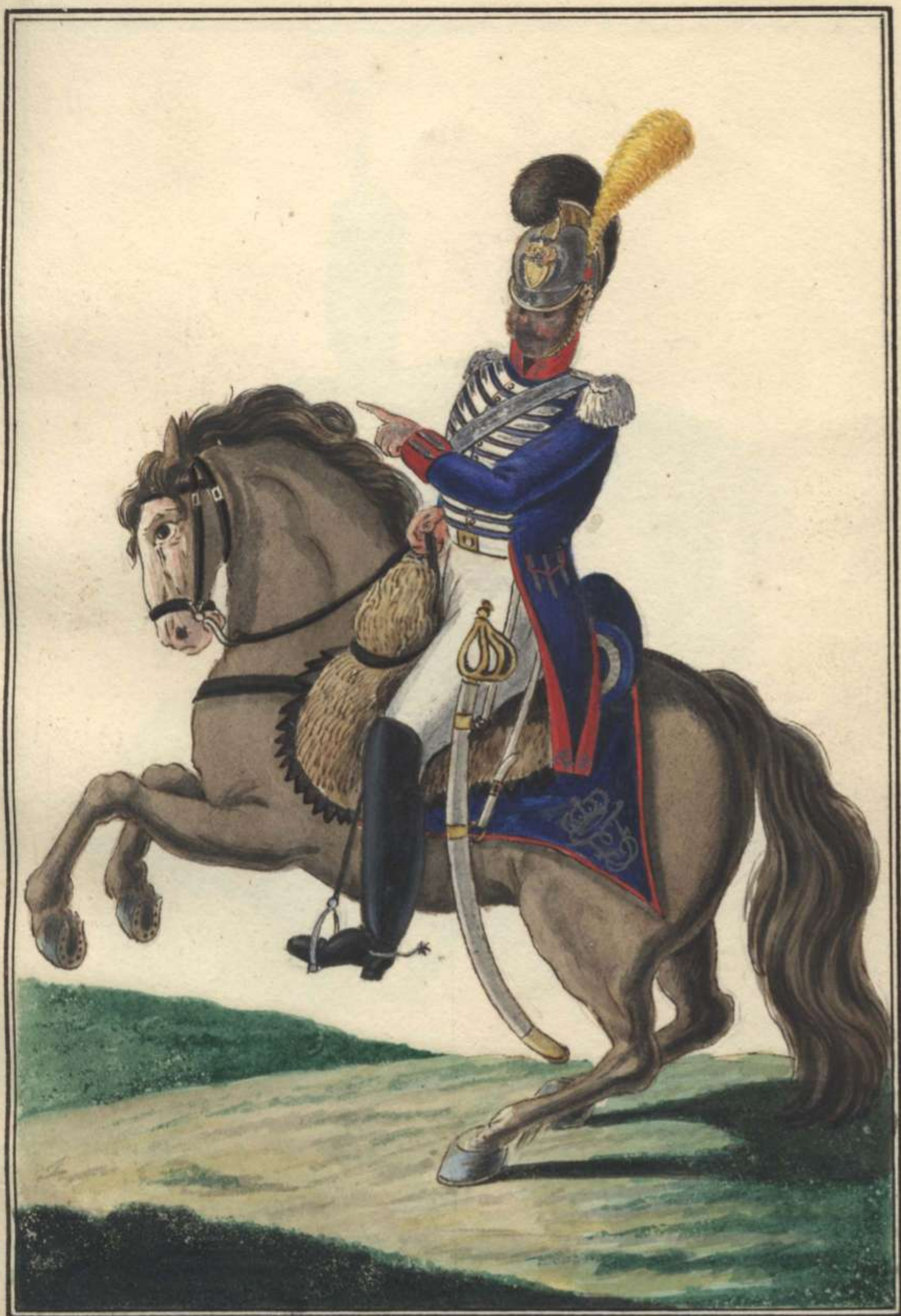
Caballeria di linea.