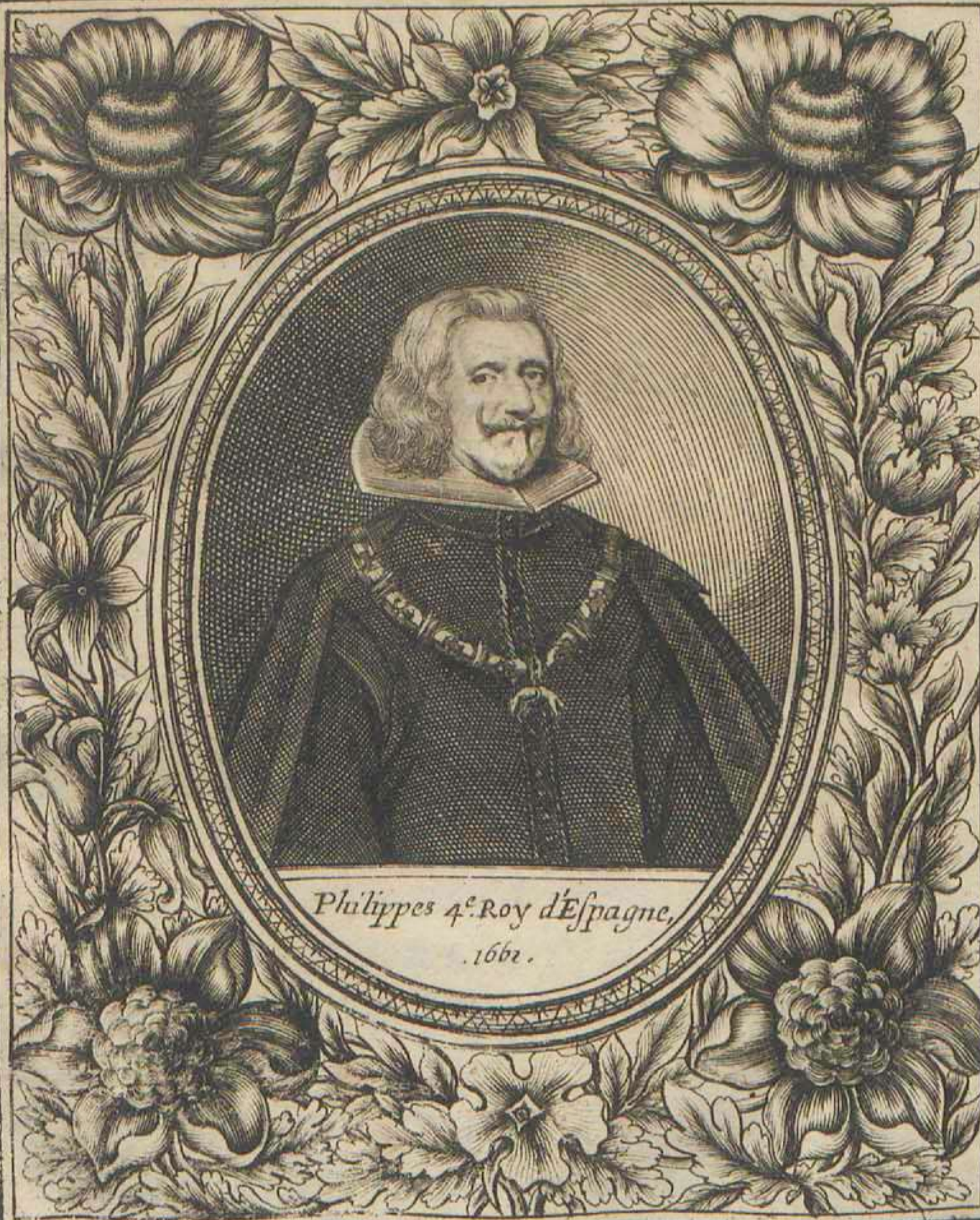
Philippe 4 e . Roy d'Espagne, .1662.