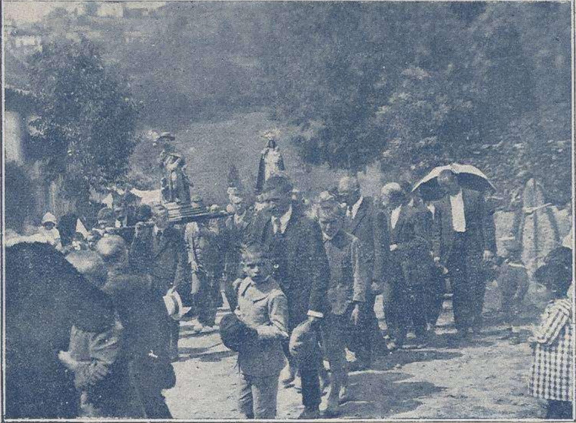
Procesión en la aldea