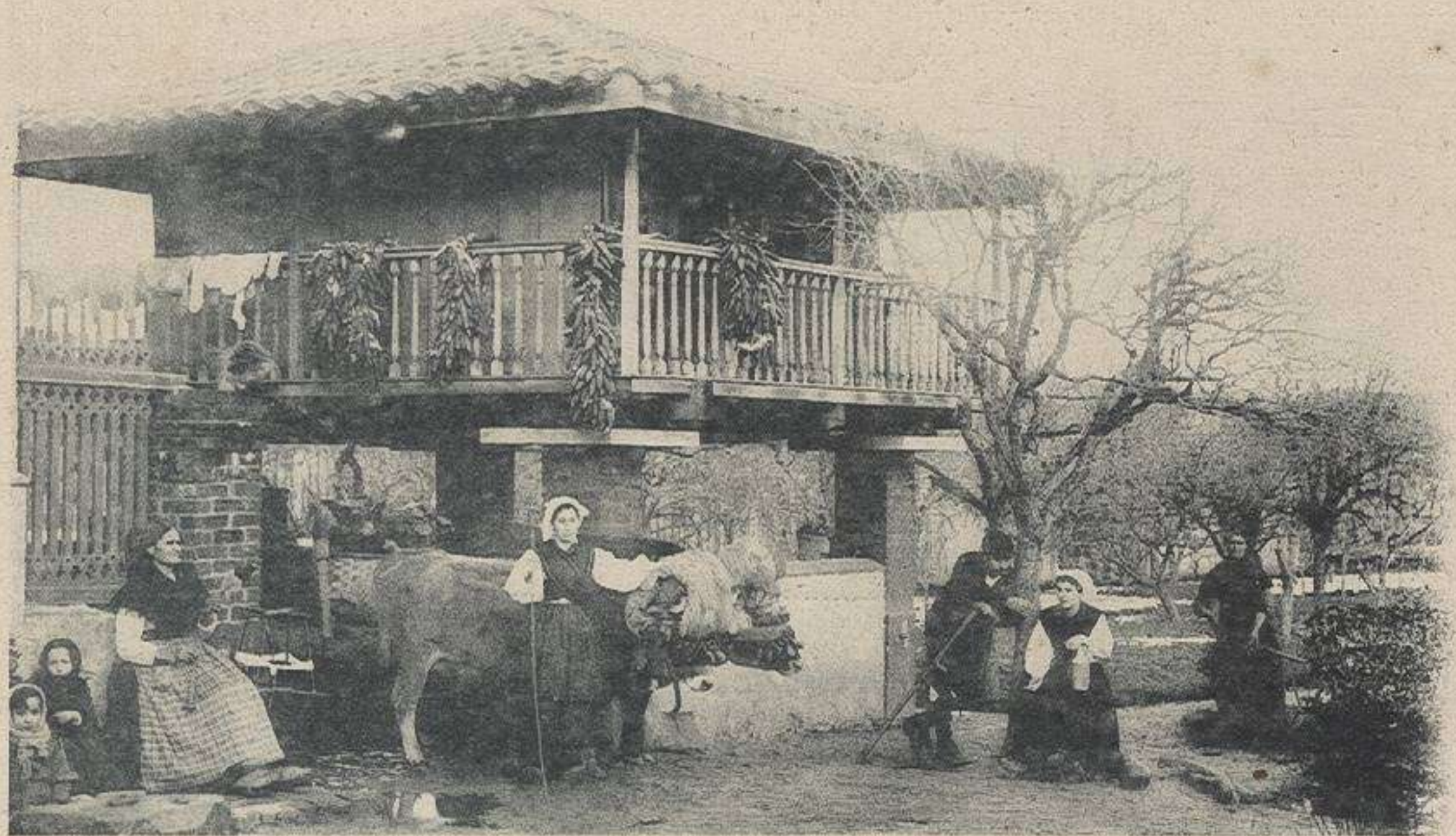
En la Quintana.—Asturias.