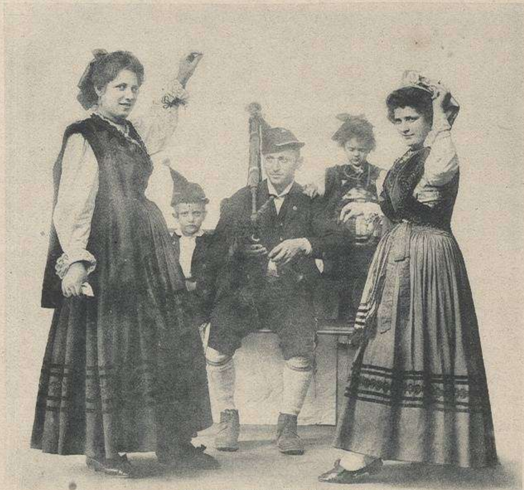
ASTURIAS.—Costumbres del País.