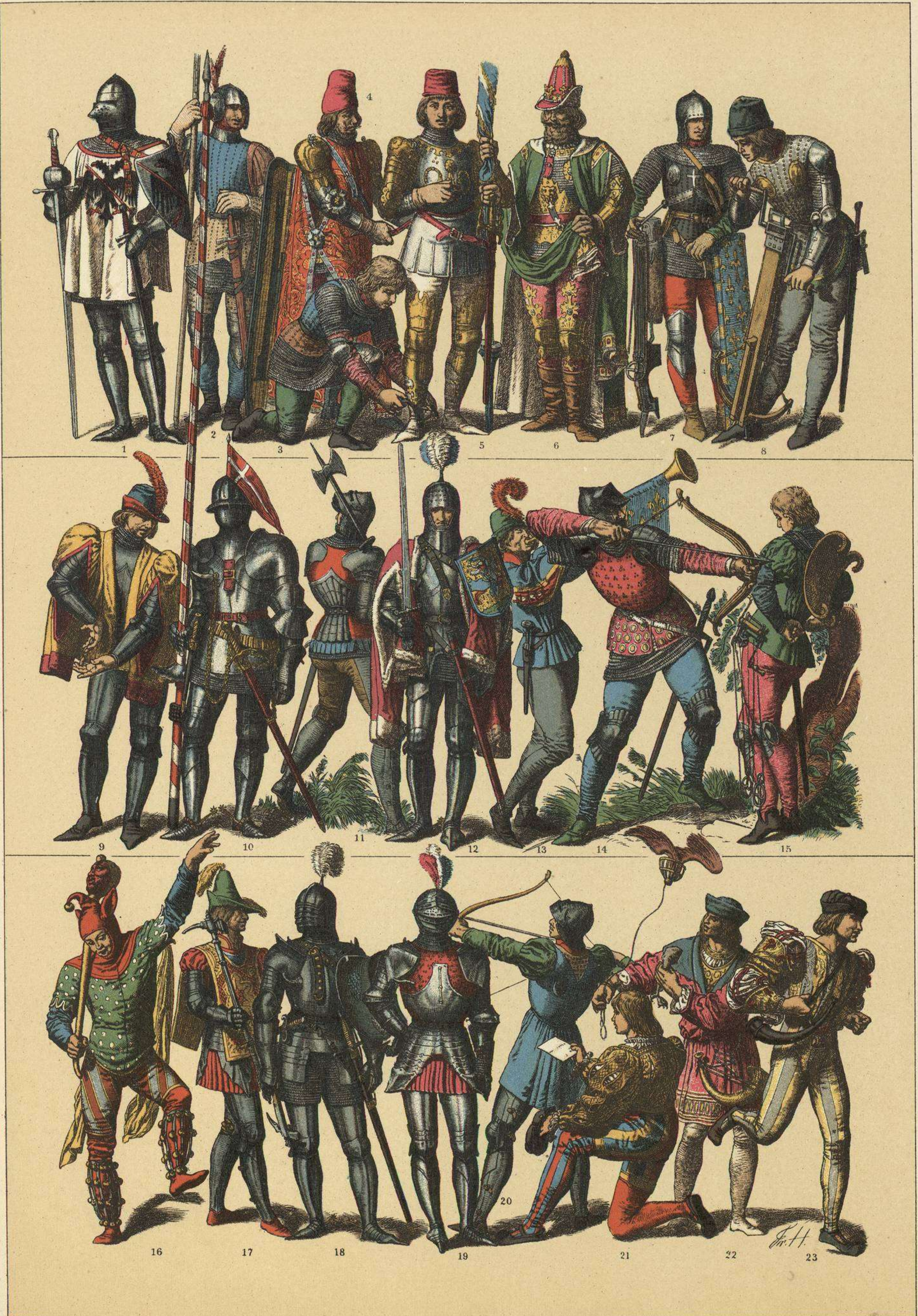
EDAD MEDIA.—TRAJES Y ARMAS DE LOS FRANCESES EN EL SIGLO XV