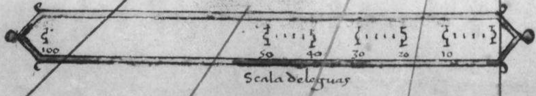
Scala de leguas

P. de S. Pedro P. de S. Juan P. de S. Mateo P. de S. Miguel P. de S. Nicolás P. de S. Roque P. de S. Vicente P. de S. Ysidoro P. de S. Zorobabel P. de S. Agustín P. de S. Blas P. de S. Domingo P. de S. Esteban P. de S. Felipe P. de S. Juan Bautista P. de S. Leonardo P. de S. Lorenzo P. de S. Marcos P. de S. Matías P. de S. Melchor P. de S. Nicasio P. de S. Ovidio P. de S. Primitivo P. de S. Rufino P. de S. Severino P. de S. Sixto P. de S. Valeriano P. de S. Vital P. de S. Zenobio