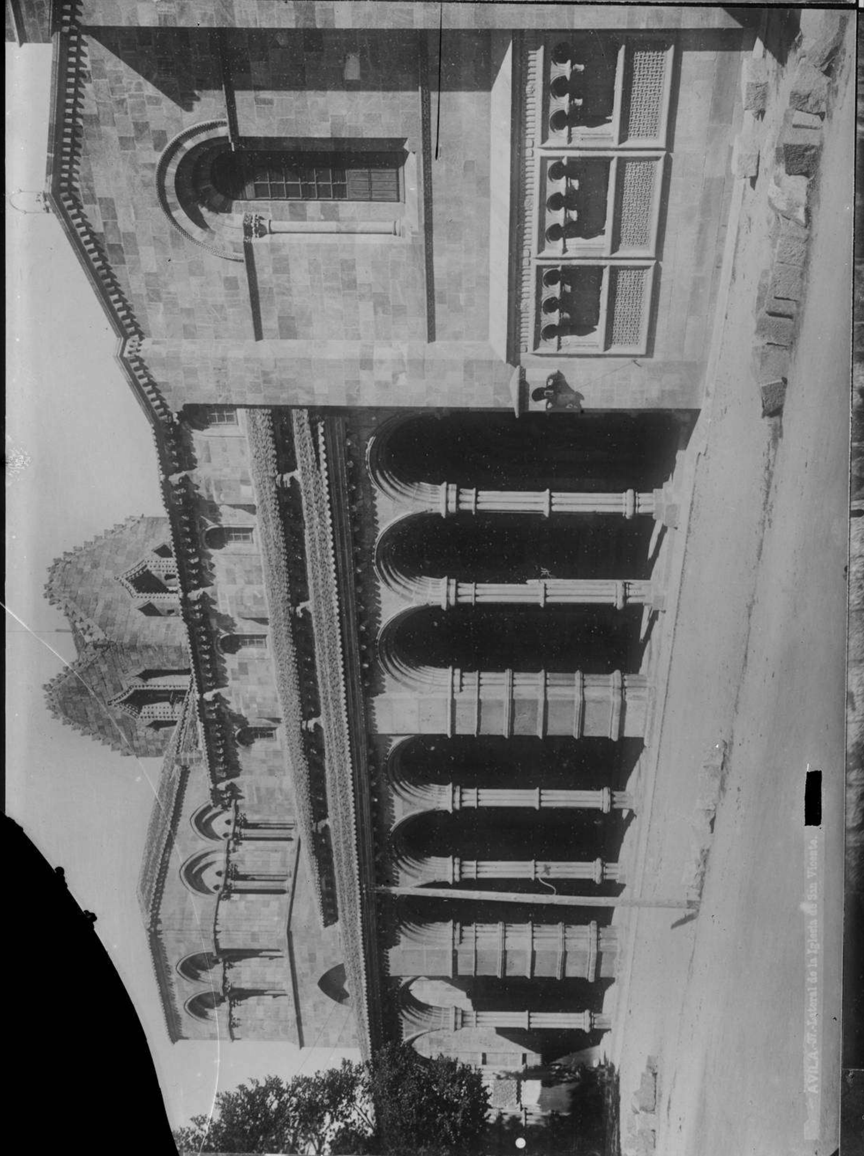
AVILA-37.-Cloister de la Iglesia de San Tomás.