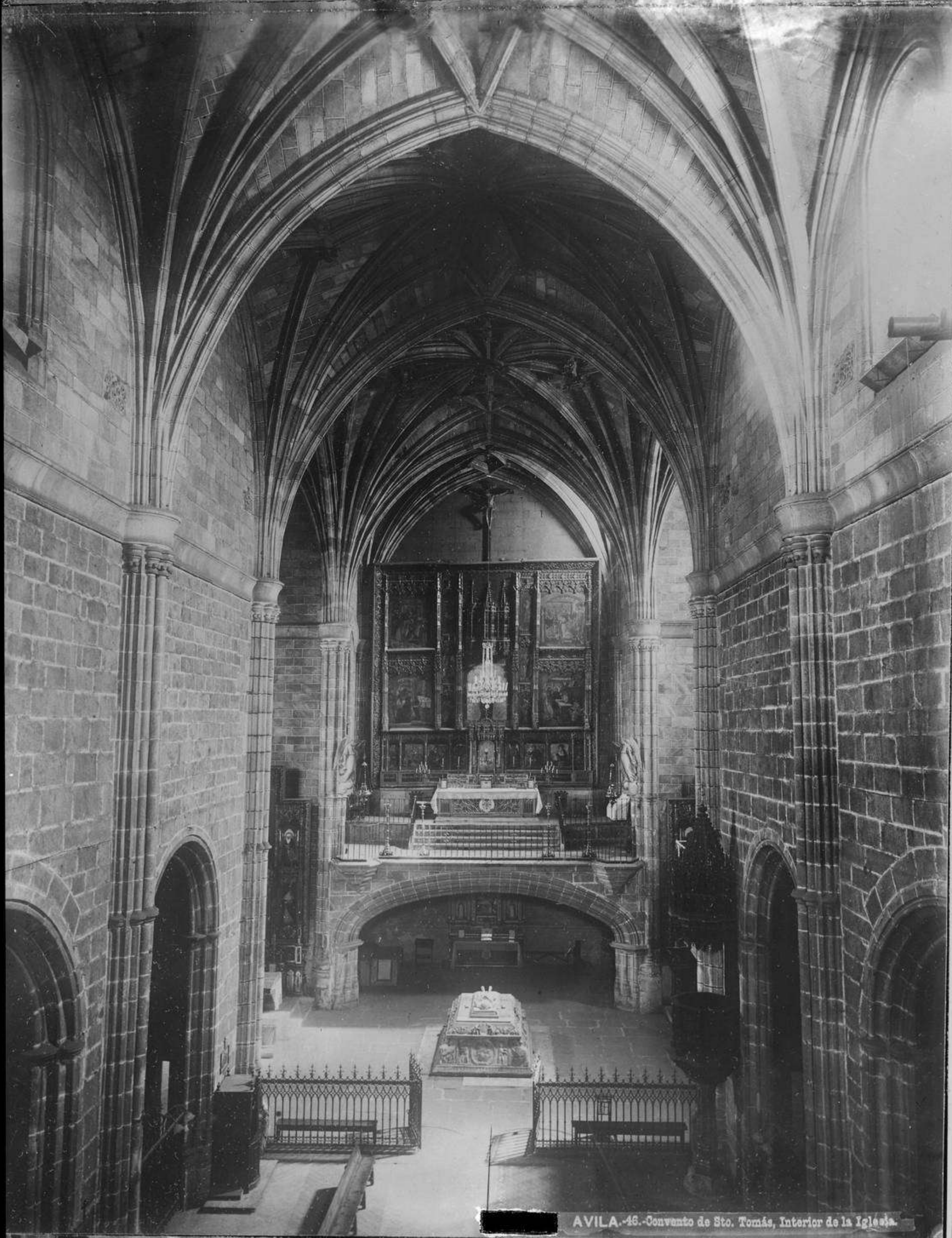
AVILA-46.-Convento de Sto. Tomás, Interior de la Iglesia.