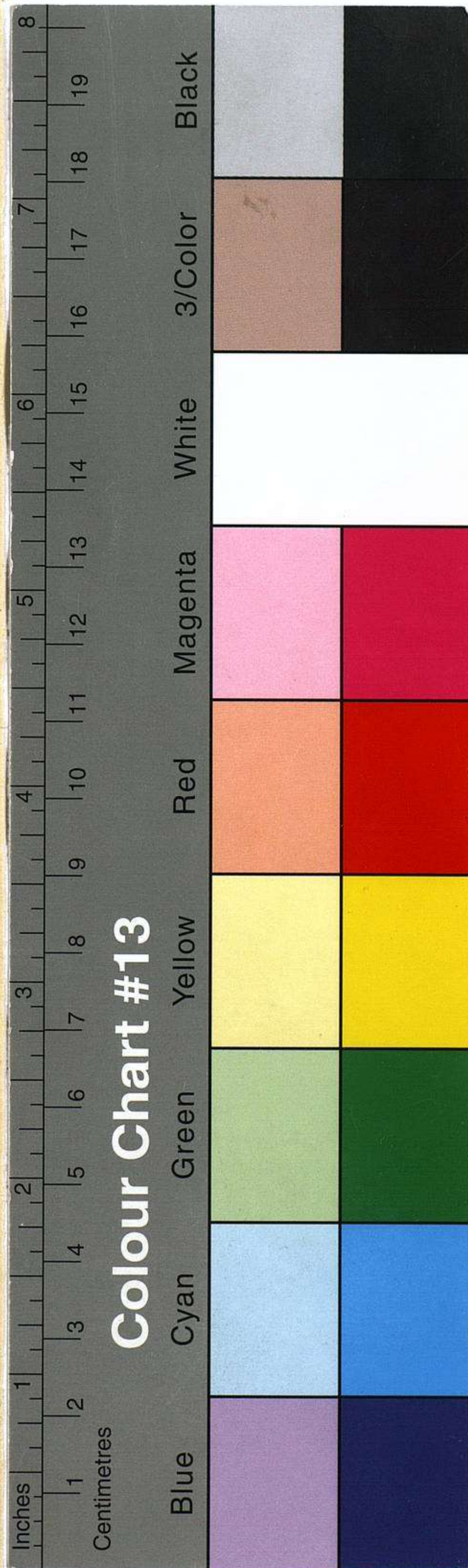
Colour Chart #13

ALB. ¿Y me he de arruinar por sostener una falsa reputacion?