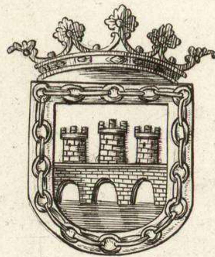
Armas de la Ciudad