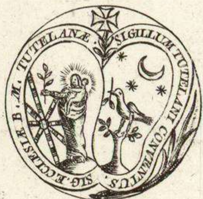
Armas de la Catedral