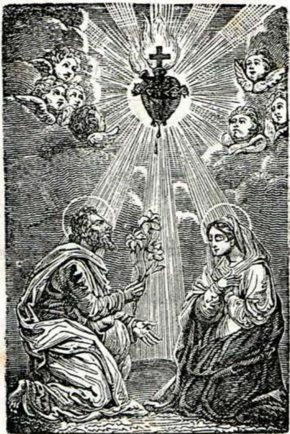
Amodiozco suan Gure viyotzac vero-zatzube Jesus, Maria eta José.