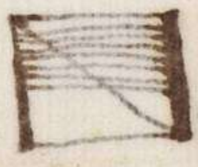
Fig. 4.° variis mathematicis angulis. l. q. dicitur. cont. ab Euclide, demonstratum fuisse omnes lineas in se & quales esse diuisibiles; si si demus lineam partem tribus punctis non posset induci partes & quales diuisi: ergo non componit: ex his punctis 5.° si potest abso lute negari hoc esse demonstrabile, nec demonstra- tum. et potest dici et certum hoc esse demonstrabile per se de punctis sensualem lineam, non vero de indivisibilibus, que sentiri nequeunt. esse nihil 2.° nos

5.° dicimus, quod debet esse continui, seu in continuatione positi; ad prob. D. dingo A. continui eos habita verum, condicio falsum; verum quidem est, quod ut puncti constituit continuum debent uniri, et fieri unus ex ipsis, existunt enim habet ultimum, et primum, altam individua, in seipsis fortiter. non de- bent habere ultimum quia in se solent continui non sit in diuisionem continui significent, solentibus sunt continui in composito ex ipsis, in quo est primum, et ultimum;