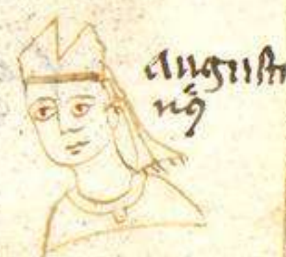
Augusti n' g

vidit q'da uultu tribule p' . alitulle. 2. morte s' m' m' a' te n' p' m' . i' o' i' b' u' s' e' x' a' u' d' i' s' s' .