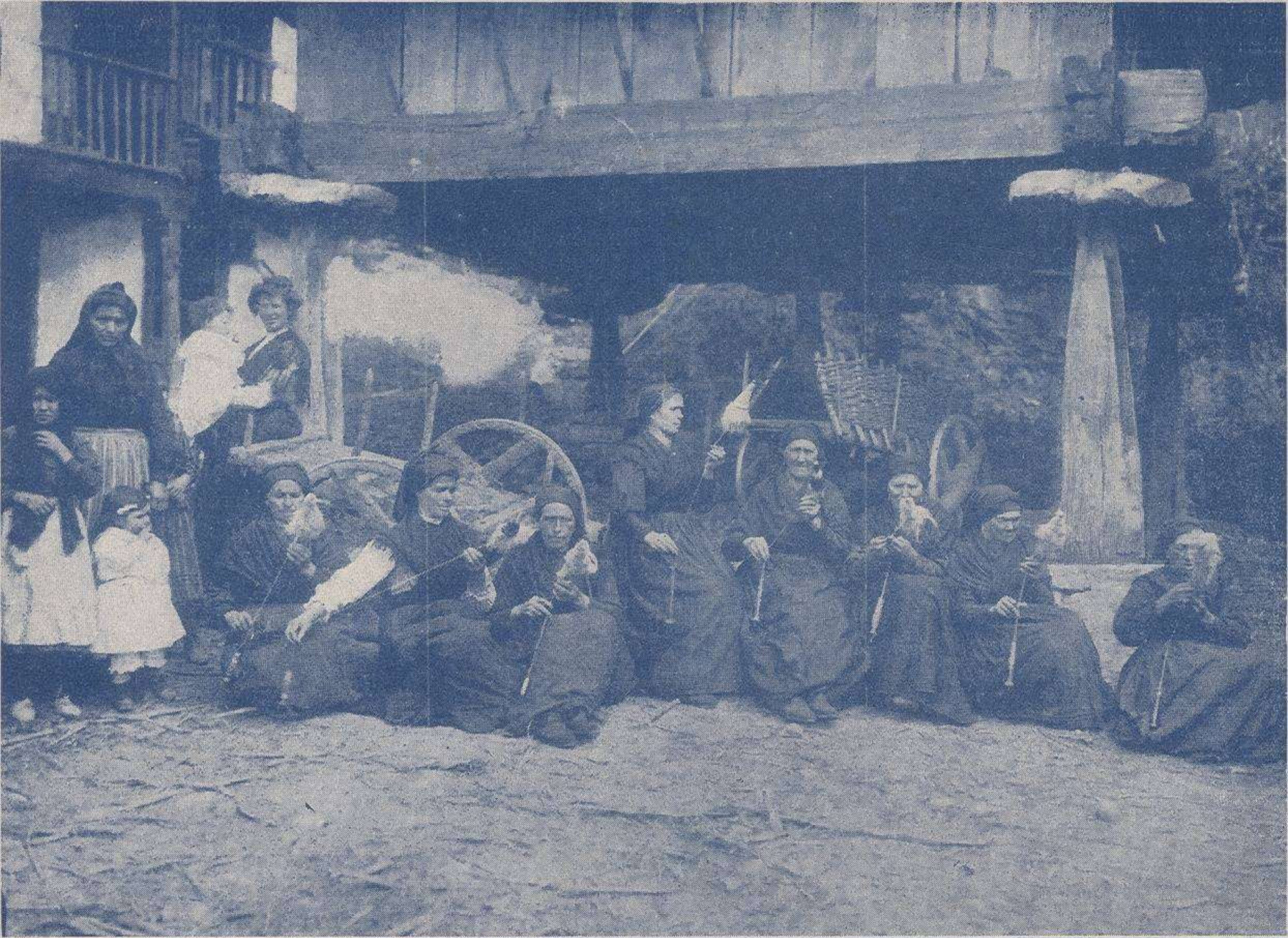
DEL CONSEJO DE PILOÑA Grupo de hilanderas del pueblo de Sieres (Borines) (UN FILANDÓN)