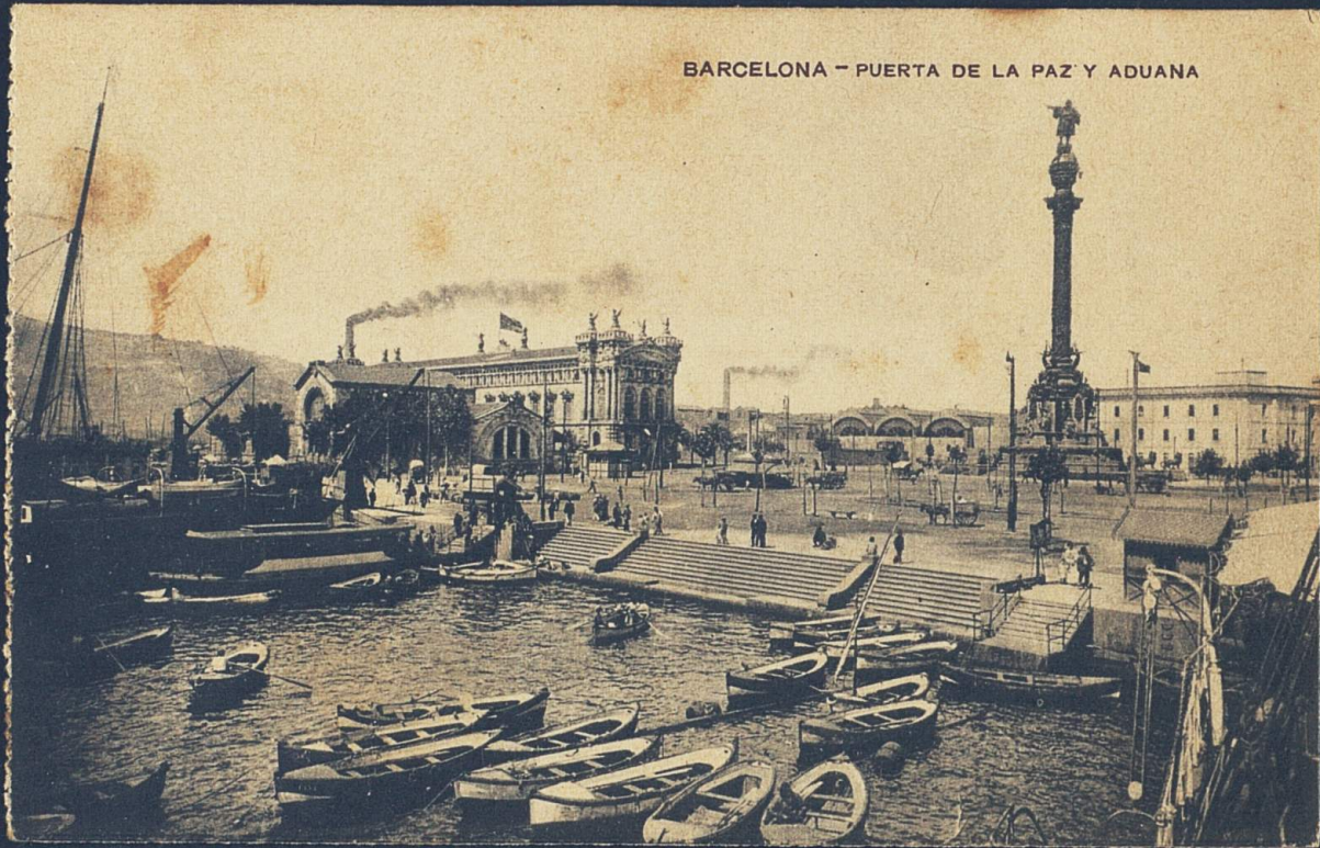
BARCELONA - PUERTA DE LA PAZ Y ADUANA