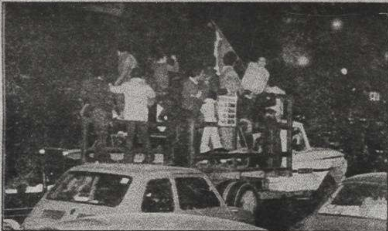
CUALQUIER ELEMENTO es bueno para meter bulla y expresar la alegría.