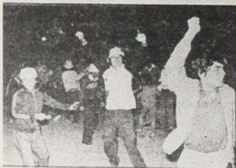
SE REVOLUCIONÓ SANTIAGO con el triunfo chileno. Torrentes de entusiasmo inundaron sus principales avenidas.