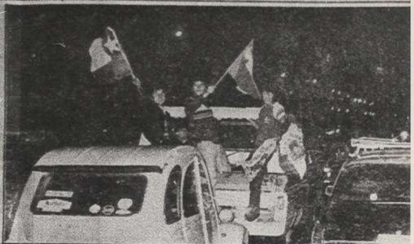
UN CARNAVAL se vivió en la Avenida Libertador Bernardo O'Higgins, luego del triunfo chileno.