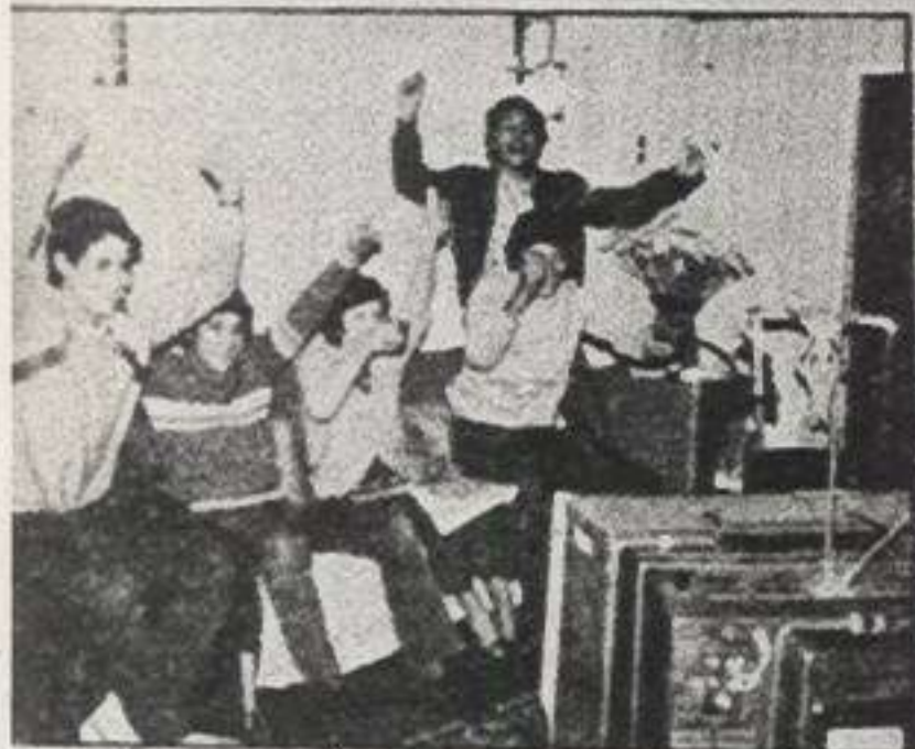
¡OOOOOOOOOOOOO! DE CHILE!